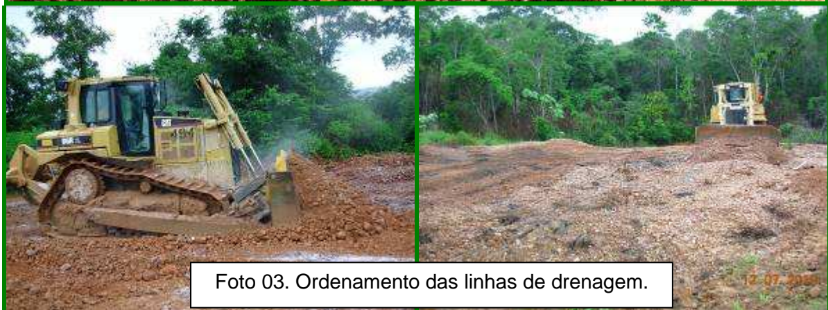
Foto 03. Ordenamento das linhas de drenagem.