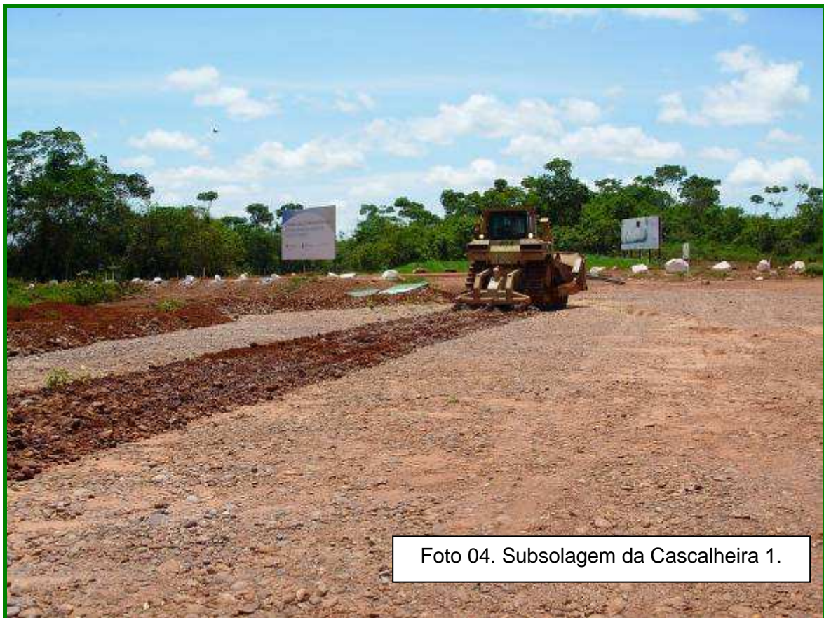
Foto 04. Subsolação da Cascalheira 1.