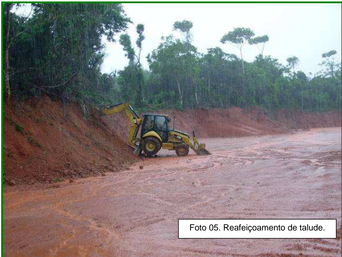
Foto 05. Reaquecimento de talude.