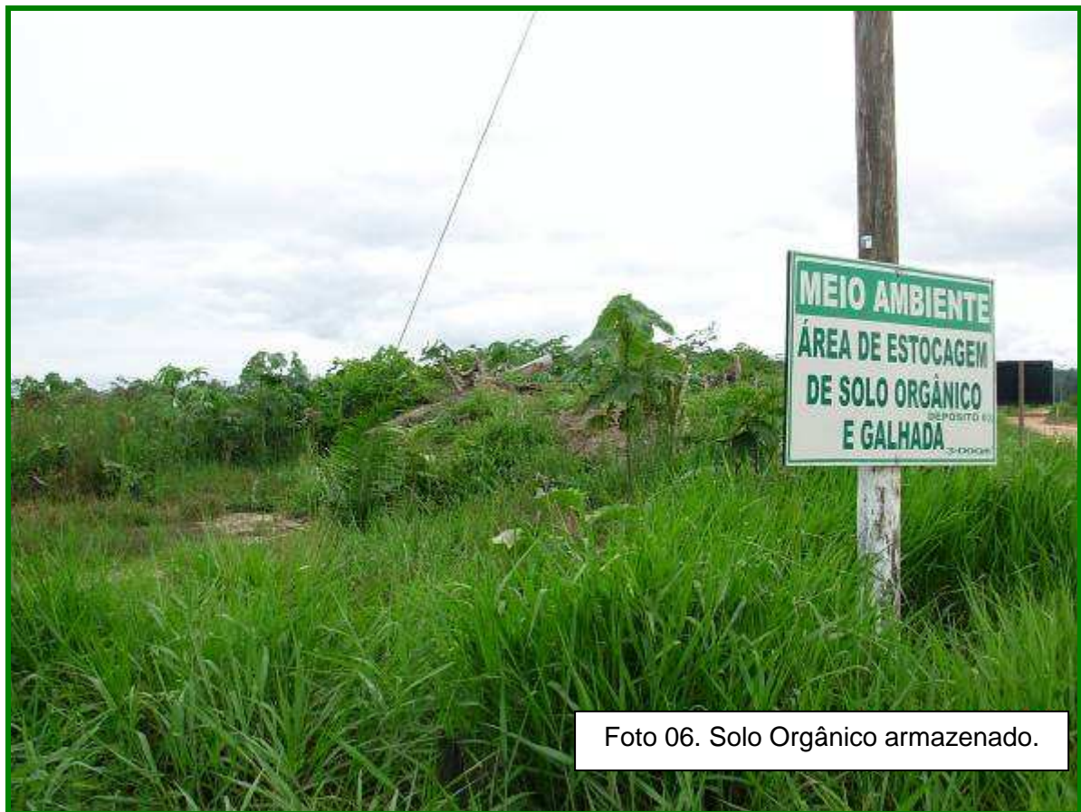
Foto 06. Solo Orgânico armazenado.

Durante a instalação das estruturas do Canteiro de Obras do AHE Jirau, o solo orgânico foi armazenado para ser utilizado posteriormente na recuperação das áreas degradadas. Os estoques de solo orgânico, juntamente com galhadas e aluvião, estão distribuídos em 30 pontos no Canteiro de Obras, totalizando 1.641.236,43 m 3 de material (Foto 06).