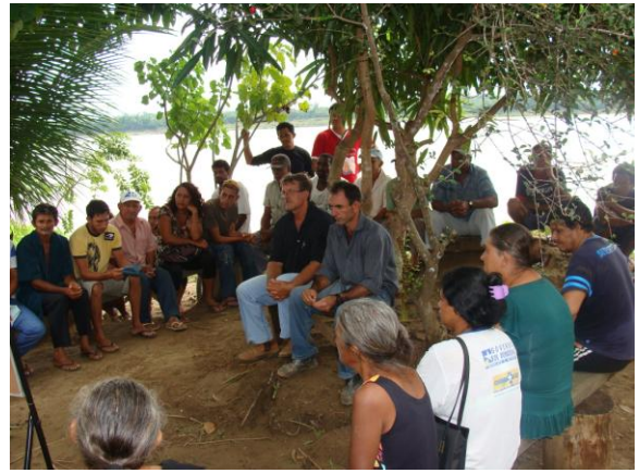
Foto 14 - Reunião Comunidade Vai Quem Quer

Outras reuniões/ações foram realizadas no período no âmbito do Programa de Remanejamento da População Atingida. Entre elas podemos citar: