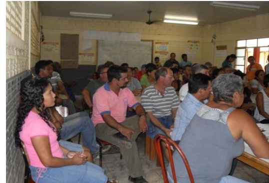
Foto 8 - Reunião com comerciantes Mutum

3.2.3 Reuniões com os Grupos de Trabalho – Urbanos e Rurais - Já formalizados. Nesta etapa de trabalho as reuniões foram com os membros efetivos dos grupos onde o objetivo principal foi apresentar e discutir os critérios de remanejamento para o Público Alvo de Remanejamento.