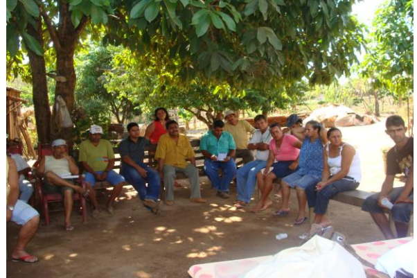
Foto 10 - Reunião Nova Mamoré - Comunidade Santo Antonio