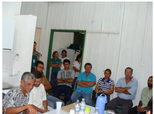
Foto 12 - Reunião GT Urbano

3.2.4 Reuniões para Apresentação dos Critérios Técnicos para o Remanejamento – Nestas reuniões foram apresentadas as modalidades de remanejamento, valores da carta de crédito, opções pelas modalidades de reassentamento, caderno de preços e toda a metodologia a ser adotada no Programa de Remanejamento. Foram realizadas no período de 15/10/09 a 14/11/09, nas localidades da área de influência direta do empreendimento.