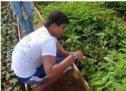
Foto 101 - Limpeza nos saquinhos com mudas