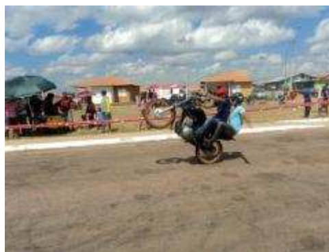
Fotos 143 e 144 - Cobertura da 1ª Gincana de Motos em Nova Mutum Paraná

- Cobertura da Visita de Gestão (Grupo de representantes da Prefeitura Municipal de Porto Velho e das sedes distritais do Baixo Madeira) às instalações do Observatório Ambiental Jirau em Nova Mutum Paraná – Novembro 2011.