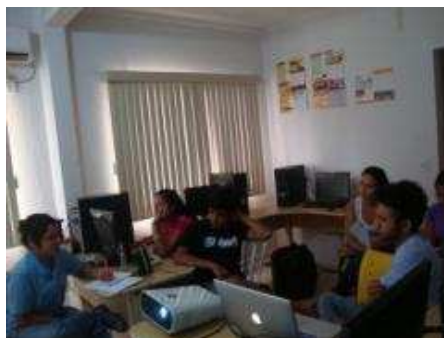
Fotos 43 e 44 - Planejamento e elaboração de roteiro