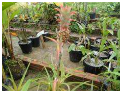
Fotos 39 e 40 - Espécies de mudas ornamentais fornecidas pela Embrapa