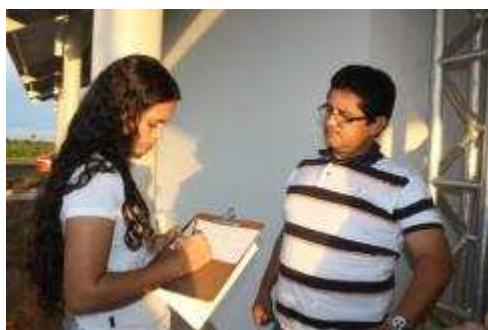
Foto 63 - Entrevista com o Diretor da Escola Municipal Nossa Senhora de Nazaré

Na sequência, são apresentados os registros fotográficos das atividades realizadas no período de dezembro de 2011 a fevereiro de 2012.