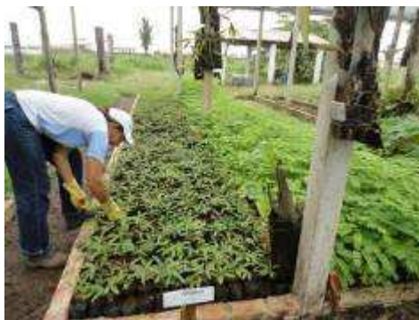
Fotos 31 e 32 - Tratos culturais dos canteiros