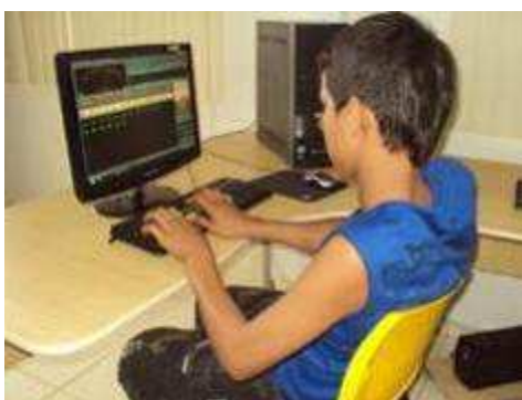
Foto 91 - Sala de informática