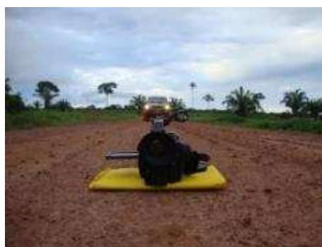
Fotos 49 e 50 - Registro fotográfico das gravações