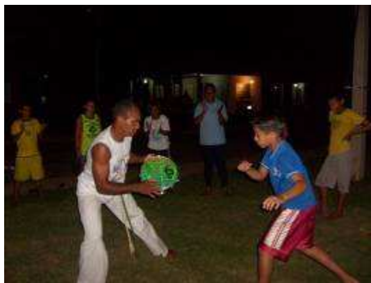
Fotos 248 e 249 - Atividades de Capoeira