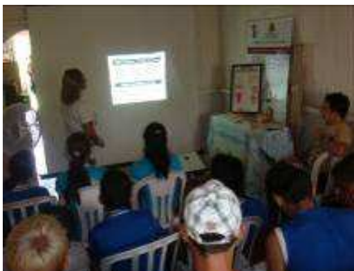
Foto 177 - Apresentação DST/AIDS