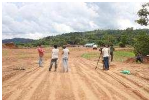
Fotos 53 e 54 - Entrevistas com representantes da COOGAMPA