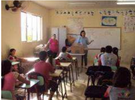
Foto 220 - Debate