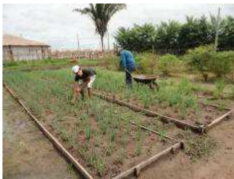
Foto 10 - Limpeza dos canteiros de cebolinha