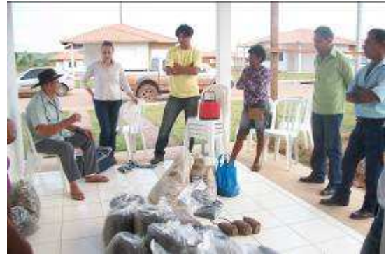
Fotos 238 e 239 - Entrega de sementes coletadas pelos produtores