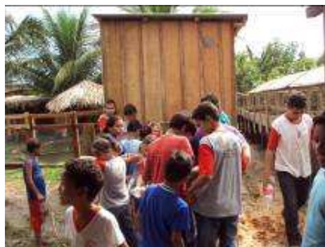
Foto 180 - Alunos lavando garrafas