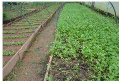
Fotos 15 e 16 - Vista geral dos canteiros de rúcula, coentro e alface