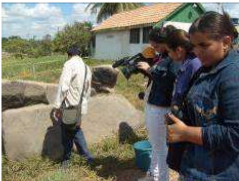
Foto 129 - Gravura Rupestre