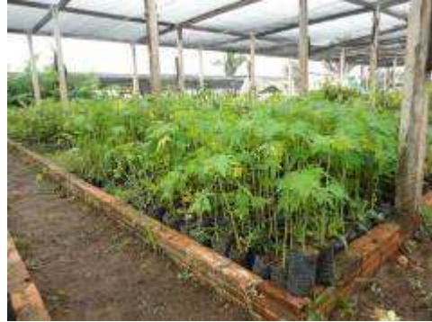
Foto 26 - Mudas de mamão