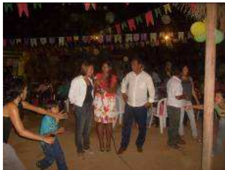
Fotos 135 - Entrevista com os organizadores da festa

Cobertura da última Festa Junina realizada na Igreja Nossa Senhora de Nazaré em Mutum-Paraná