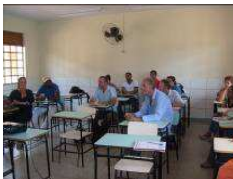
Fotos 228 e 229 - Devolutivas Jaci Paraná