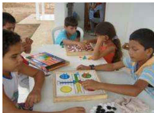
Fotos 171 e 172 - Monitores em atividades pedagógicas