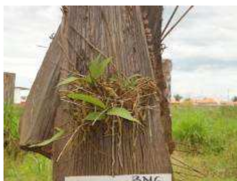
Fotos 41 e 42 - Espécies de mudas ornamentais fornecidas pela Embrapa