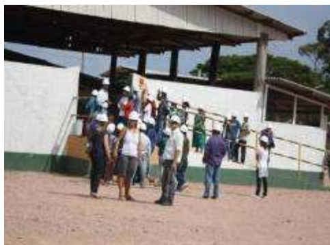
Foto 72 - Local de acondicionamento de resíduos contaminados