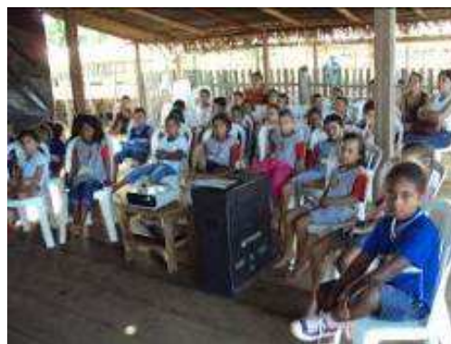
Fotos 183 e 184 - Alunos de Pré e 1º ano na sessão inaugural e opinião expressada por uma das alunas

“É gostoso porque parece que é cinema mesmo, com pipoca e tudo. Tá super legal.”