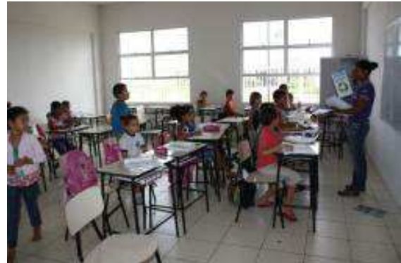
Fotos 191 e 192 - Distribuição de material informativo na Escola Municipal Nossa Srª de Nazaré