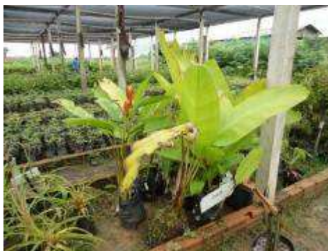
Fotos 37 e 38 - Espécies de mudas ornamentais fornecidas pela Embrapa