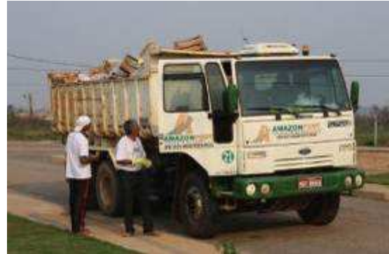
Foto 199 - Transporte de materiais descartados