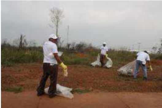
Foto 195 - Coleta de material na Fase I