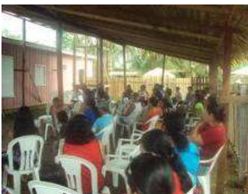
Foto 175 - População atenta às informações

Esta ação correu no dia 15 de dezembro de 2009 e está relacionada à área de saúde. Foram realizadas palestras com os seguintes temas: Hipertensão, Malária e Dengue. Durante o dia foram realizadas vacinas contra diversas doenças e aferimento de pressão. Estiveram presentes cerca de 80 pessoas da comunidade de Mutum-Paraná.