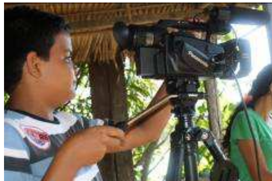
Fotos 115 e 116 - Entrevista com moradores de Mutum-Paraná