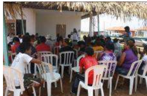
Fotos 240 e 241 - Formação de Cooperativa