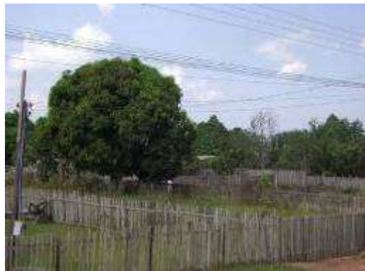
Foto 88 - Vista geral do local destinado a UDAMA