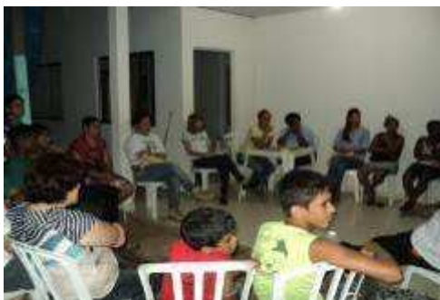
Foto 193 - Participantes da reunião de planejamento

As fotos a seguir retratam os diversos momentos dos trabalhos.