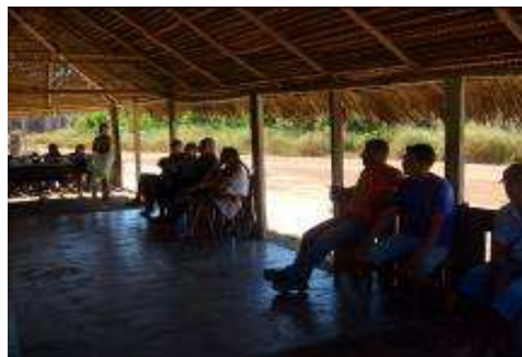
Fotos 230 e 231 - Devolutivas PA São Francisco

As atividades detalhadas do DRP constam em relatório específico enviado ao IBAMA, pela ESBR. Em conformidade com os resultados, estão em processo de implantação, os seguintes projetos: