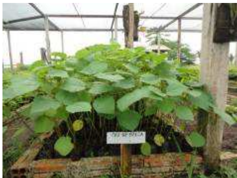
Foto 27 - Mudas de Pau de Balsa