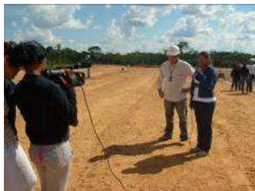
Fotos 127 e 128 - Entrevista com Coordenador de Meio Ambiente da ESBR