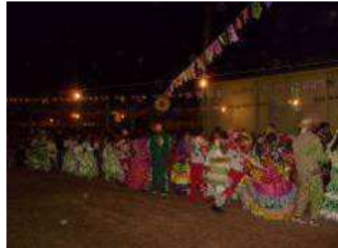
Foto 136 - Participantes da quadrilha