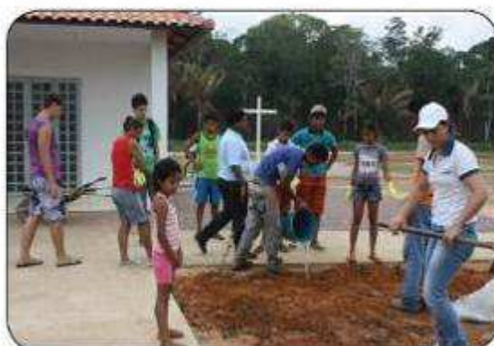
Por Bárbara Dantas

No dia 10 de novembro, funcionários do Observatório Ambiental Jirau e ESBM, monitores de manejo ambiental e membros da comunidade participaram do plantio de mudas no Cemitério de Nova Mutum-Paraná.