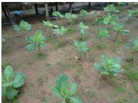
Foto 09 - Plantio de couve