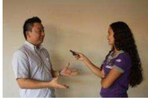
Fotos 157 e 158 - Participação do Núcleo na reunião do GT de Cultura, Lazer e Turismo

- Cobertura do Fest Folia – Agosto de 2011