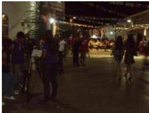
Fotos 141 e 142 - Cobertura da Festa Julina na E.M.E.F. Nossa Senhora de Nazaré

- 1ª Gincana de Motos em Nova Mutum Paraná