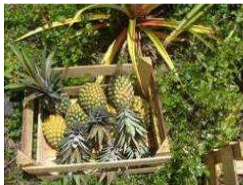
Fotos 236 e 237 - Colaboradores do Observatório Ambiental Jirau coletando frutos do produtor rural para Feira Livre