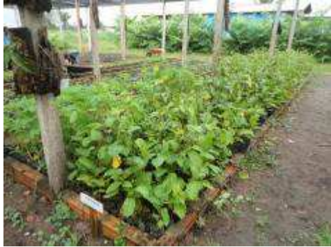
Foto 25 - Mudas de maracujá