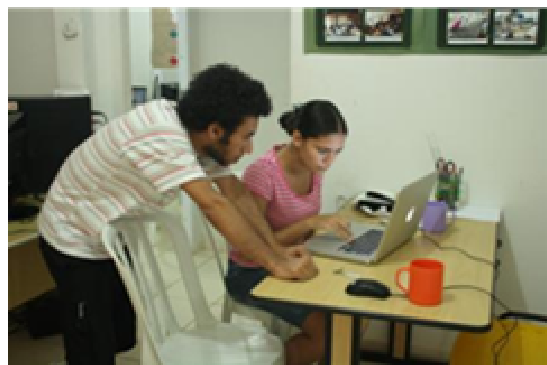
Fotos 109 e 110 - Consultores monitorando as atividades