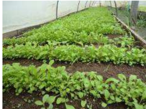
Fotos 17 e 18 - Vista geral dos canteiros de rúcula