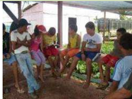
Foto 100 - Grupo de Discussão - Aulas teóricas ministradas pelos monitores