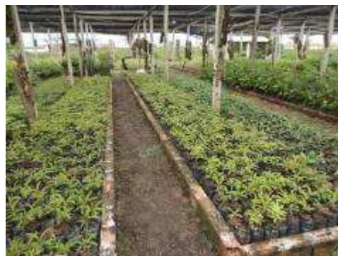
Fotos 23 e 24 - Vista geral dos canteiros