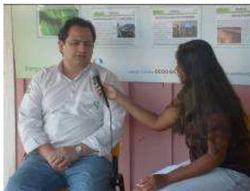
Fotos 123 e 124 - Entrevista com o Gerente do Programa de Remanejamento das Populações Atingidas