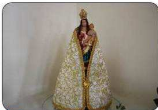
Por Bárbara Dantas

Nos dias 08 e 09 de outubro, a Igreja Católica Nossa Senhora de Nazaré realizou uma grande comemoração em suas dependências para festejar os dias das Padroeiras Nossa Senhora de Nazaré e Nossa Senhora Aparecida, além de lembrar carinhosamente o Dia das Crianças.