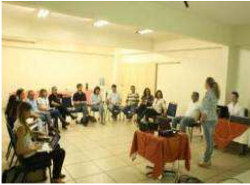
Foto 259 - Abertura dos trabalhos

No âmbito do Projeto Agenda Ambiental, no dia 11 de agosto de 2011, o Observatório Ambiental Jirau participou da 5ª. Reunião do Grupo de Trabalho de Cultura, Lazer e Turismo, realizada no auditório do Hotel Aquarius em Porto Velho.