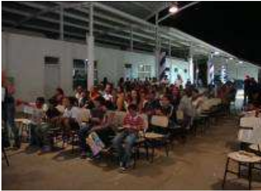
Foto 137 - Convidados

Evento de Lançamento do Jornal Observação! e do Portal do Observatório Ambiental Jirau (site na internet)