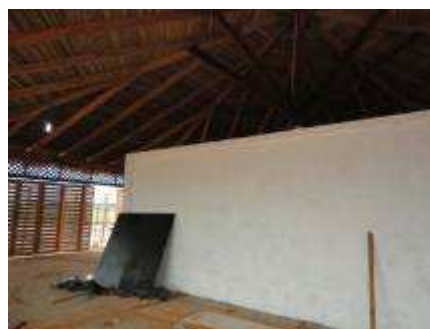
Foto 02 - Vista da área interna