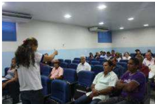
Foto 262 - Apresentação do Observatório Ambiental Jirau