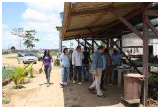
Fotos 147 e 148 - Visita do Secretário Municipal de Meio Ambiente – SEMA

- Cobertura da visita do Governador do Estado de Rondônia ao Distrito de Jaci Paraná – Novembro de 2011.