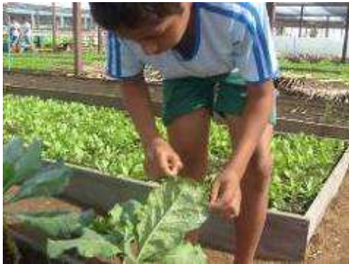
Foto 99 - Identificação de pragas nas hortaliças