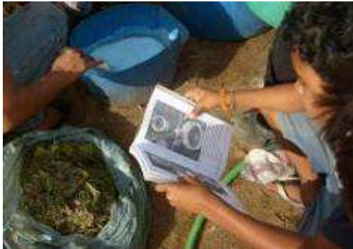
Foto 97 - Preparo de defensivo natural

As fotos apresentadas a seguir retratam algumas das atividades rotineiras realizadas na UDAMA com o envolvimento dos monitores.