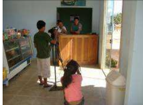
Foto 134 - Entrevista - Restaurante Pedrinhas

Cobertura da última Festa Junina realizada na Igreja Nossa Senhora de Nazaré em Mutum-Paraná