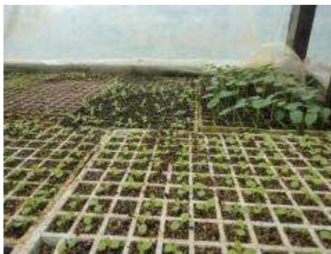
Fotos 21 e 22 - Vista geral da sementeira com plantio em bandejas