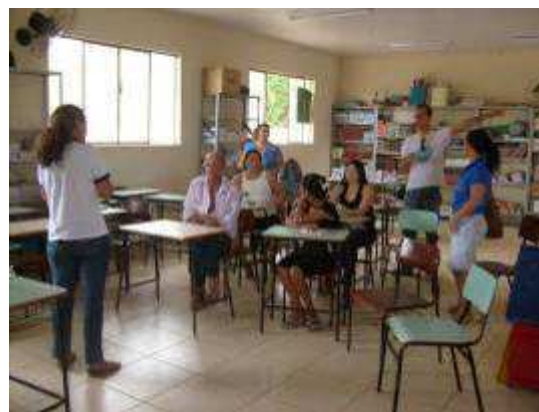
Fotos 216 e 217 - Participantes da reunião