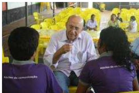
Fotos 149 e 150 - Visita do Governador do estado de Rondônia a Jaci Paraná