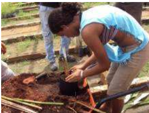
Foto 103 - Monitores reproduzindo mudas ornamentais