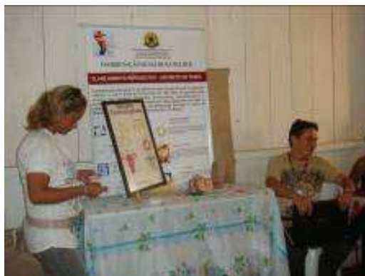
Foto 178 - Apresentação dos Métodos Contraceptivos