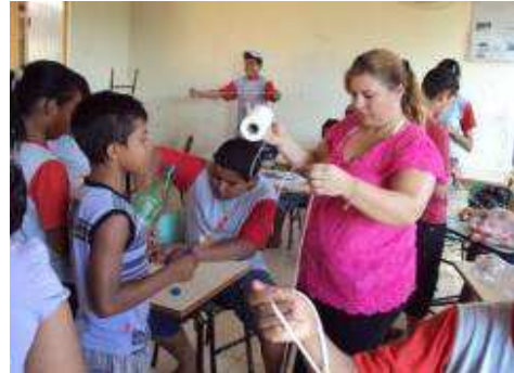
Foto 221 - Vai e Vem