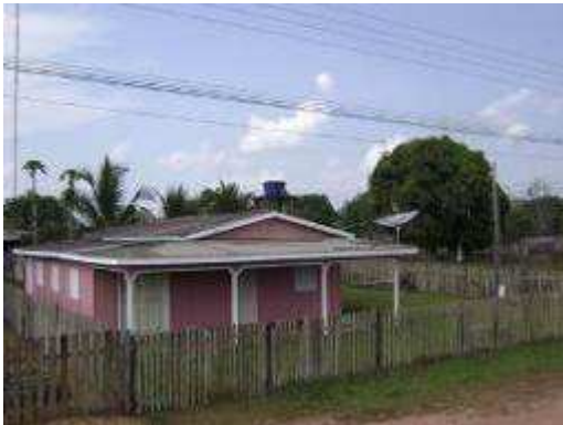
Foto 87 - Vista geral da casa sede do Núcleo em Mutum-Paraná