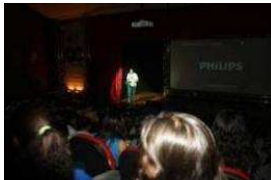
Fotos 167 e 168 - Abertura do evento