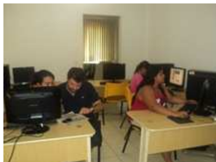
Fotos 59 e 60 - Elaboração do projeto gráfico do Jornal