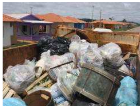
Foto 205 - Lixo coletado durante a Campanha