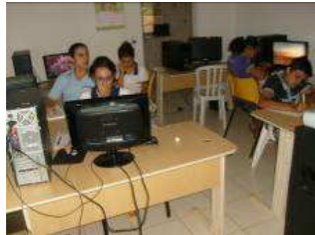
Fotos 257 e 258 - Capacitação para alimentação do Portal