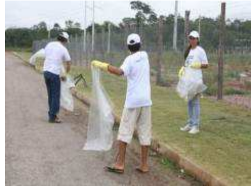
Fotos 202 e 203 - Voluntários recolhendo lixo na Av. Mutum Paraná