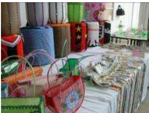
Foto 185 - Exposição de Artesanatos com Materiais Recicláveis - Fortaleza do Abunã

As fotos apresentadas a seguir registram momentos desta atividade.