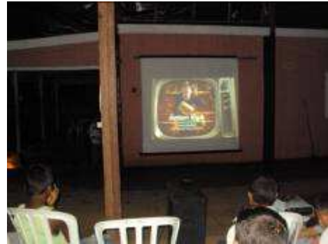
Fotos 255 e 256 - Sessão de Cinema