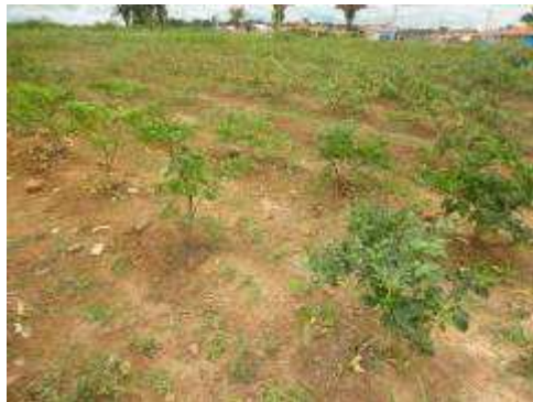
Fotos 03 e 04 - Plantio de pimenta na área externa da UDAMA