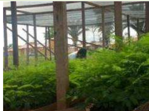
Foto 102 - Manutenção dos canteiros de mudas