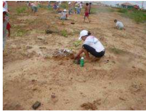
Foto 188 - Plantio de mudas