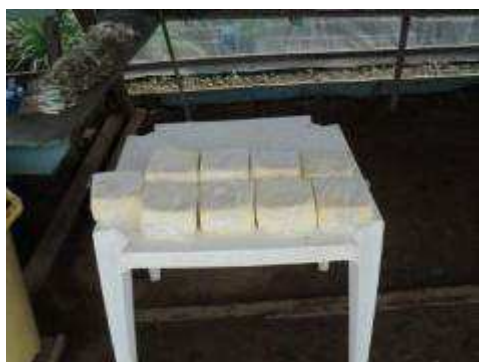
Foto 77 - Queijo