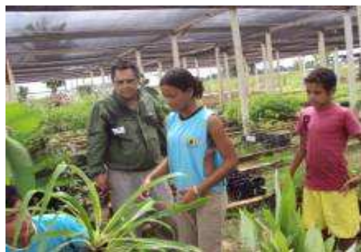
Foto 104 - Tratos culturais mudas ornamentais

Os produtos resultantes das capacitações na UDAMA são comercializados com a população de Nova Mutum Paraná e os recursos obtidos, destinados ao pagamento das Bolsas do Manejo e do Núcleo de Comunicação Social, de professores de violão e de capoeira.