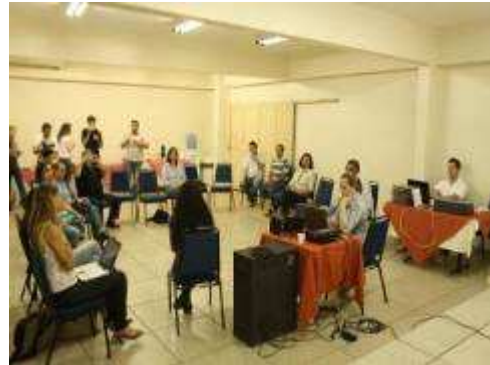
Foto 260 - Discussão em plenária