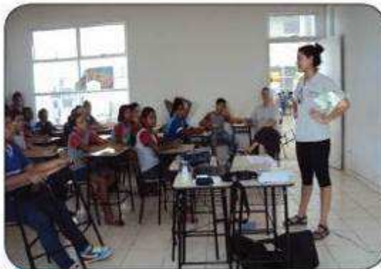
Por Símella Marinho

A empresa Documento - Patrimônio Cultural, Arqueologia e Antropologia promoveu no mês de outubro a oficina de Educação Patrimonial nas escolas Nossa Senhora de Nazaré, Estudo e Trabalho e Einstein com o objetivo de informar as comunidades estudantis sobre as atividades realizadas.