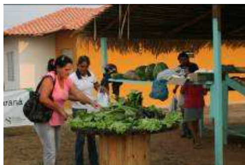
Fotos 232 e 233 - Produtos da Feira Livre do Observatório Ambiental Jirau