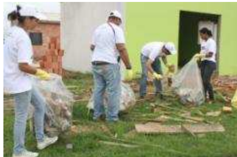
Fotos 163 e 164 - Registro Fotográfico do 2º Mutirão Eu Cuido do Que É Nosso

- Cobertura da Feira Cultural Inaugural em Nova Mutum Paraná - outubro de 2011