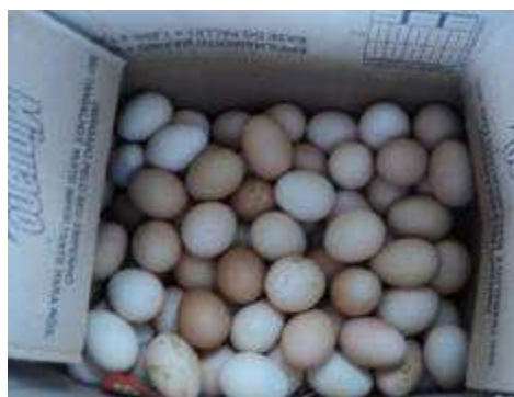
Foto 78 - Ovos caipira