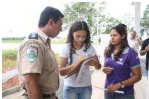
Fotos 65 e 66 - Cobertura jornalística da Entrega da Quadra de Esportes, Posto de Saúde e Posto Policial em Nova Mutum Paraná