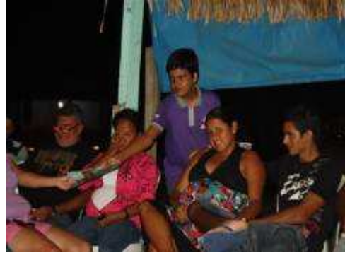
Foto 270 - Distribuição do Jornal para os Comerciantes