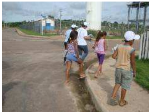
Fotos 206 e 207 - Participantes do mutirão