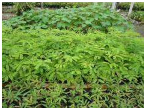
Foto 30 - Canteiros de Parkia, Bandarra e Pau de Balsa