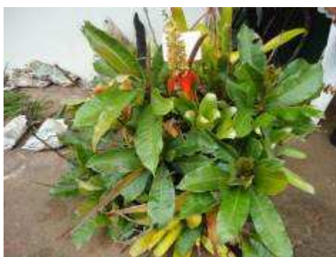
Fotos 33 e 34 - Mudas de espécies ornamentais fornecidas pela Embrapa