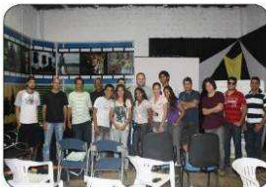
Por Símella Marinho

O Núcleo de Comunicação, junto aos profissionais experientes da área audiovisual, participou do curso de Assistente de Câmera e Operação em HD, que aconteceu no Studio da Ampla Comunicação em Porto Velho no mês de outubro.