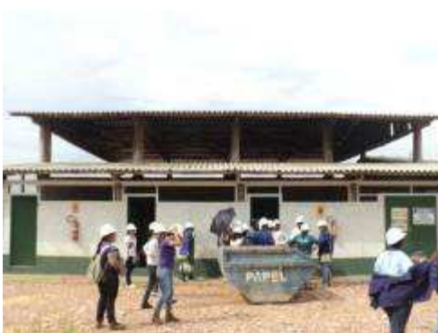
Foto 73 - Local de acondicionamento de baterias e lâmpadas