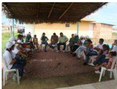
Foto 208 - Participante conversando com o morador e entregando o informativo