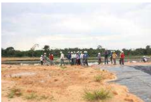
Foto 75 - Visitantes conhecendo a logoa de tratamento de esgoto