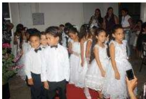
Fotos 67 e 68 - Cobertura de eventos - Registro Fotográfico “Formatura do Pré em Nova Mutum Paraná”