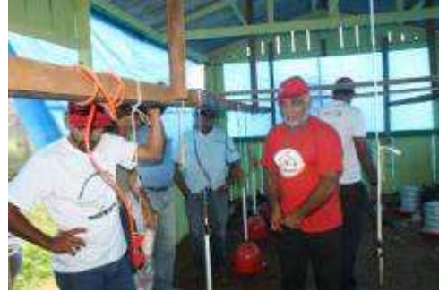
Foto 266 - Visistantes na UDAMA