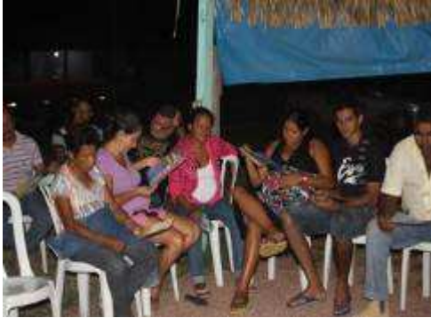
Foto 269 - Reunião com os Comerciantes