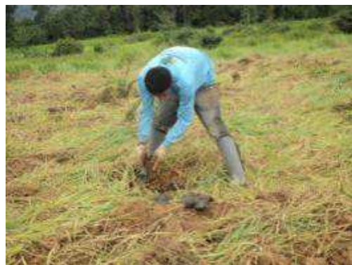
Fotos 83 e 84 - Trabalhadores de campo na atividade de plantio de mudas florestais