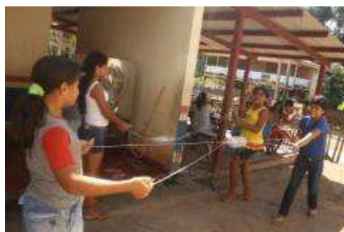
Fotos 224 e 225 - Crianças brincando em Fortaleza do Abunã