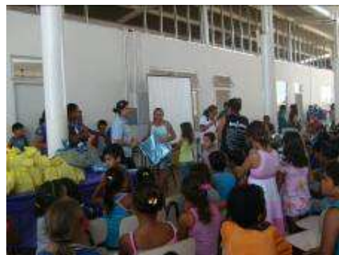
Foto 186 - Momento da Premiação