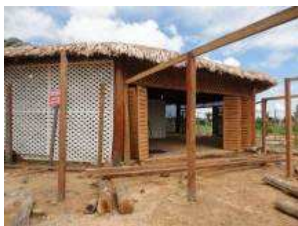
Foto 01 - Vista externa da sede do Observatório Ambiental Jirau