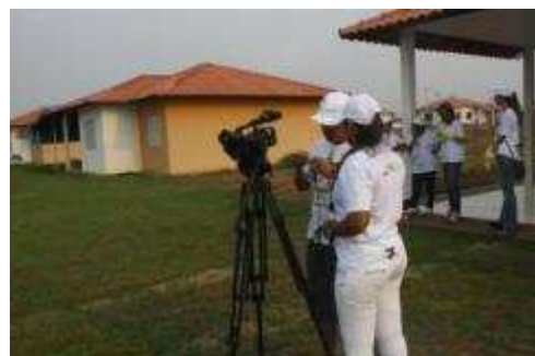
Fotos 161 e 162 - Registro audiovisual do mutirão