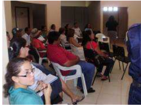
Fotos 218 e 219 - Participantes do Seminário