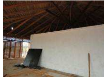
Foto 96 - Vista da área interna