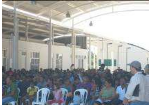
Foto 122 - Vista geral do evento de escolha das casas em Nova Mutum Paraná

Entrevista com o Gerente de Remanejamento da Energia Sustentável do Brasil S.A.