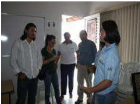
Foto 267 - A equipe técnica recebendo os secretários