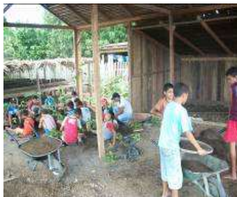
Foto 90 - Instalações da esterqueira

Em julho de 2010 ocorreu a transferência das instalações do Núcleo de Desenvolvimento do Observatório Ambiental Jirau para Nova Mutum Paraná (NMP).