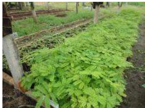
Foto 28 - Mudas de Bandarra