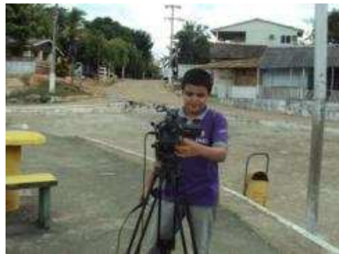
Fotos 139 e 140 - Visita domiciliar em Fortaleza do Abunã