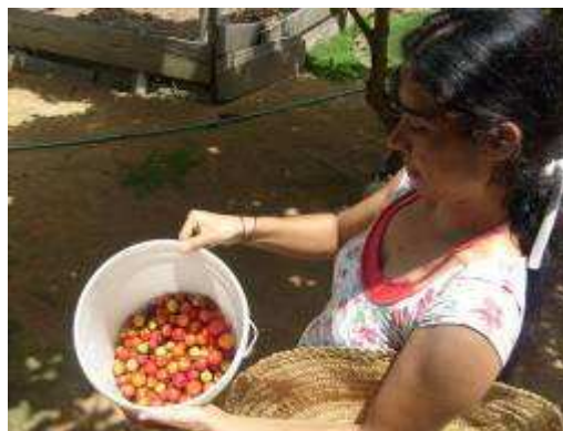
Fotos 234 e 235 - Produtora rural da linha F – PA São Francisco, colhendo acerola para Feira Livre de Nova Mutum Paraná