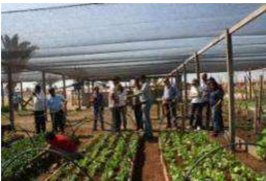
Foto 155 - Visita ao Projeto Horta Natural

- Cobertura da visita da Comitiva de representantes de órgãos públicos e instituições ao Observatório Ambiental Jirau – Agosto de 2011.