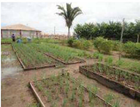
Fotos 13 e 14 - Vista geral dos canteiros de cebolinha