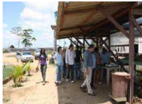
Foto 268 - Visita à UDAMA