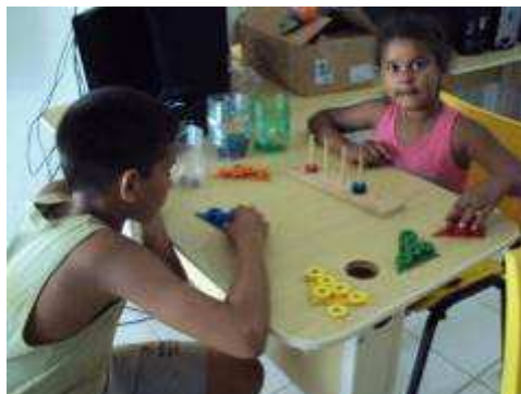
Foto 92 - Área utilizada para o acompanhamento pedagógico