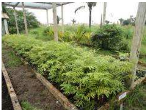
Foto 29 - Mudas de Paracaxi