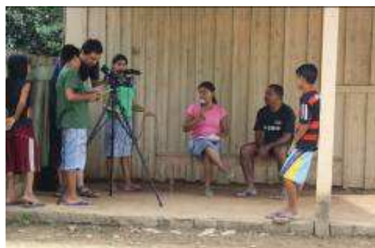
Fotos 117 e 118 - Entrevista com moradores de Mutum-Paraná