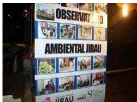
Fotos 210 e 211 - Exposição de Fotos - I Feira Cultural "Mutum Paraná"