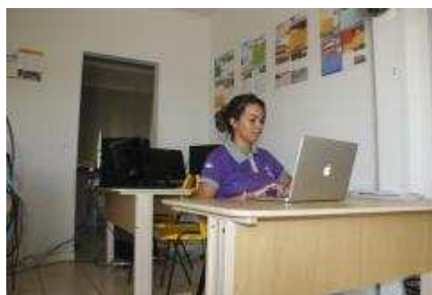
Foto 64 - Monitor produzindo conteúdo