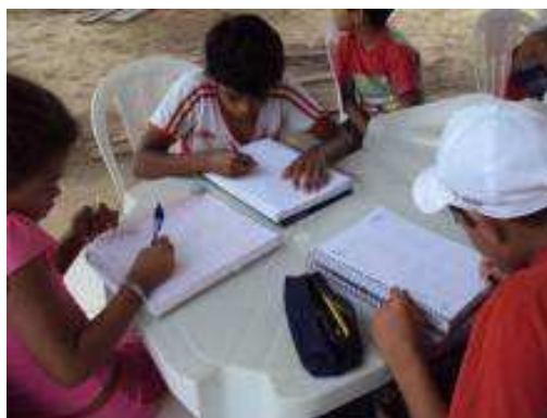
Fotos 173 e 174 - Monitores fazendo as tarefas escolares