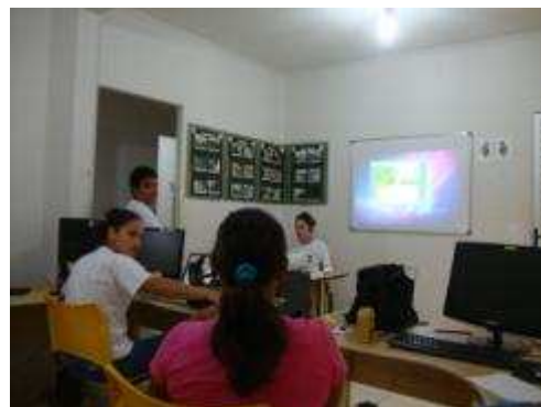
Fotos 111 e 112 - Reunião de avaliação do Grupo de Comunicação Social