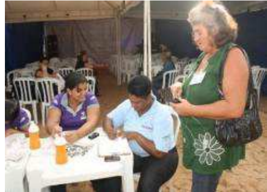
Fotos 244 e 245 - Inscrições