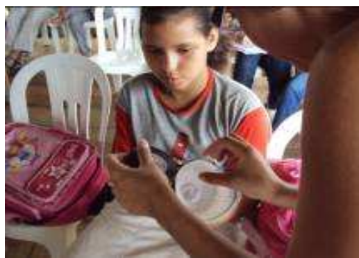
Foto 182 - Vedando armadilha