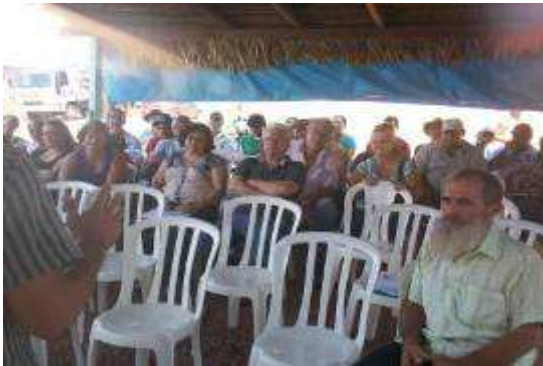
Foto 242 - Produtores atentos às orientações sobre padrão de qualidade das mudas