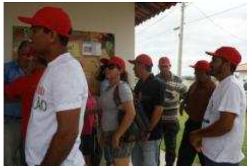
Fotos 145 e 146 - Representantes da Prefeitura e Administradores Distritais do Baixo Madeira

- Cobertura da visita do Secretário Municipal de Meio Ambiente ao Observatório Ambiental Jirau – Novembro de 2011.