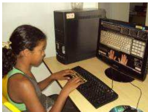
Fotos 253 e 254 - Monitores do Manejo no curso de informática

O quadro a seguir apresenta o número de participantes nas atividades abertas para a comunidade.