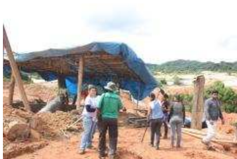
Fotos 57 e 58 - Gravação de modalidade de Garimpo de Rampa