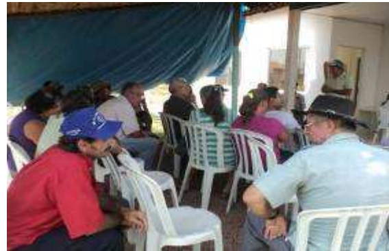
Foto 243 - Pronunciamento do Presidente do Sindicato dos Trabalhadores e Trabalhadoras Rurais (STTR)