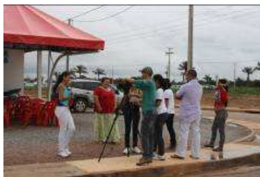
Fotos 119 e 120 - Realização de entrevistas com moradores – escolha das casas em Nova Mutum Paraná