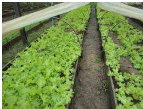
Fotos 07 e 08 - Canteiros de alface