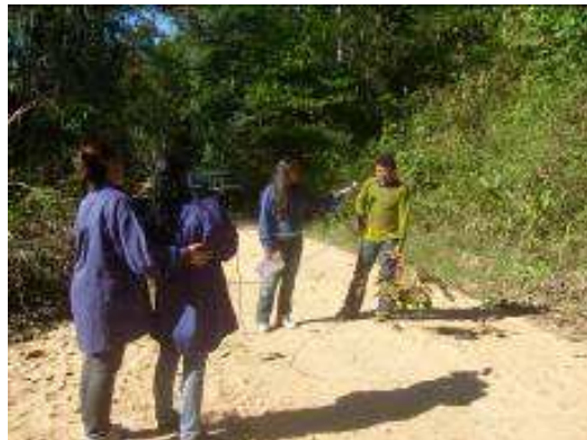
Fotos 125 e 126 - Entrevista com Equipe de Fauna e Flora

Entrevista com o Gerente de Meio Ambiente da Energia Sustentável do Brasil