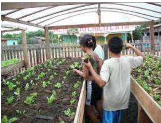
Foto 89 - Estruturas dos canteiros e da cobertura