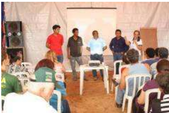
Foto 246 - Equipe técnica da UDAMA