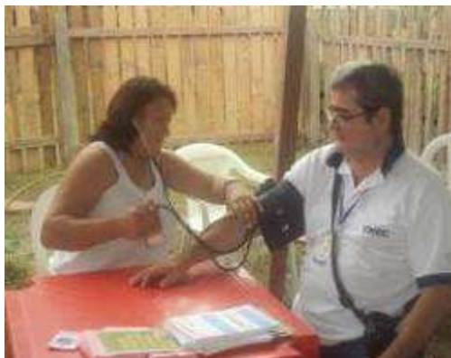
Foto 176 - Verificação de pressão arterial