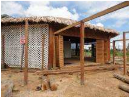
Foto 95 - Vista externa da sede do Observatório Ambiental Jirau