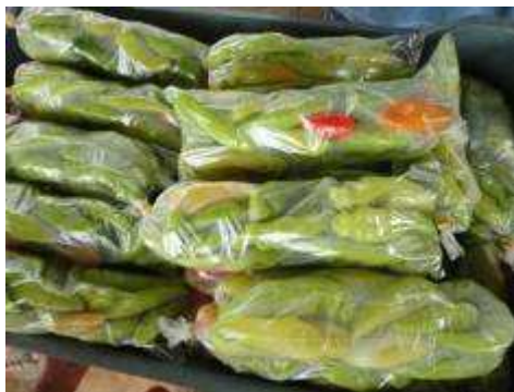
Fotos 05 e 06 - Monitores embalando pimentas para comercialização