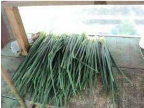
Foto 79 - Cebolinha