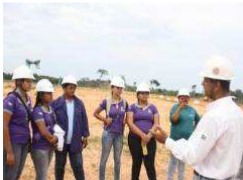
Foto 76 - Núcleo de Comunicação atento às explicações