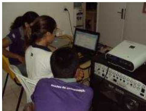
Fotos 93 e 94 - Local utilizado para as atividades do Núcleo de Comunicação Social