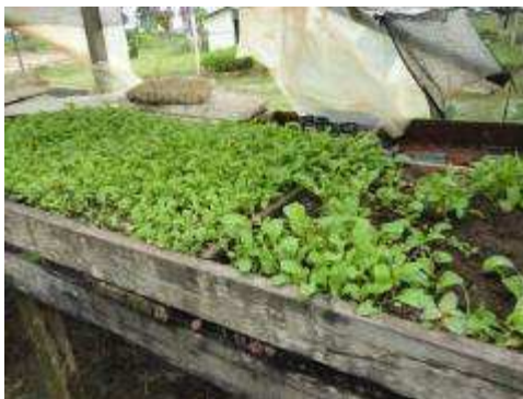
Fotos 19 e 20 - Vista geral da sementeira com plantio direto