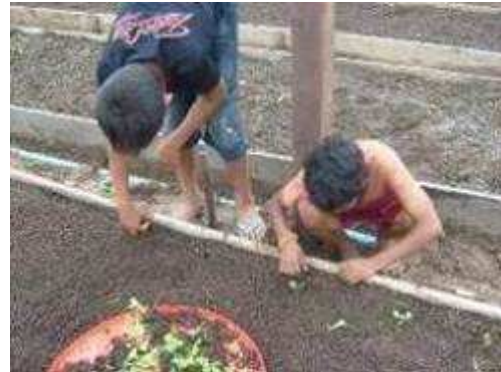
Foto 98 - Transplântio de alface