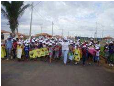
Foto 187 - Caminhada Ecológica