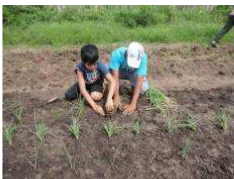
Fotos 11 e 12 - Monitores plantando cebolinha