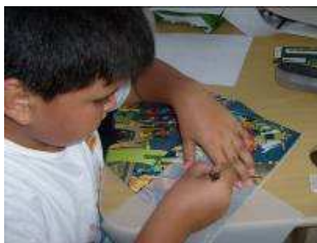
Fotos 252 e 253 - Oficina de Desenho