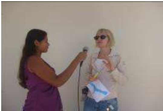
Foto 121 - Entrevista com técnicos da ESBR