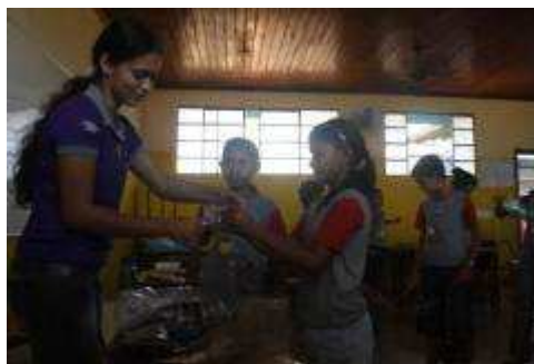
Foto 223 - Oficina em Fortaleza do Abunã