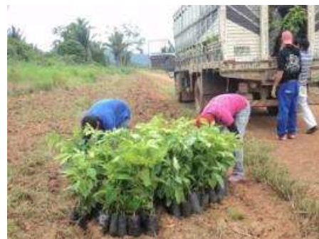
Fotos 81 e 82 - Transporte e entrega de mudas nas áreas de plantio