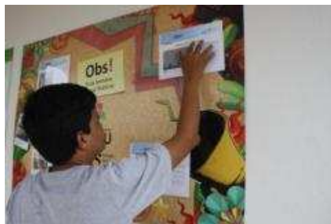
Fotos 69 e 70 - Atividades cotidianas do Núcleo de Comunicação Social