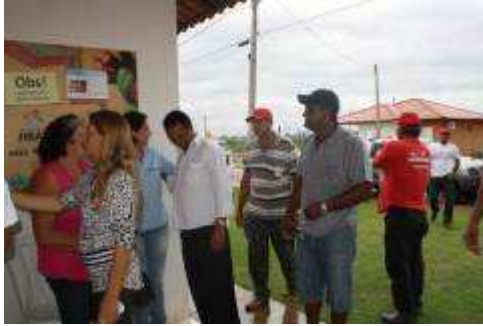
Foto 265 - Visistantes chegando ao Observatório Ambiental Jirau