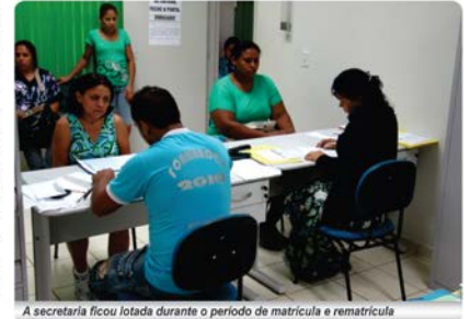
A secretária ficou lotada durante o período de matrícula e rematrícula

Enquanto os estudantes aproveitavam o período de férias, as escolas em Nova Mutum Paraná não pararam. A corrida contra o tempo para deixar tudo pronto para o retorno das aulas começou com as matrículas e rematrículas dos estudantes. Na escola Municipal Nossa Senhora de Nazaré não foi diferente. O período que foi estipulado para realizar os procedimentos deixou a escola cheia. Para acompanhar a procura pela comunidade, a escola precisou abrir duas novas turmas, sendo uma do 6º e outra do 7º ano.