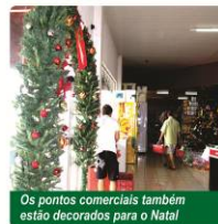
Os pontos comerciais também estão decorados para o Natal

o sorteio de duas motocicletas para as compras acima de R$ 20,00. A premiação acontecerá em janeiro.