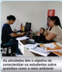
As atividades têm o objetivo de conscientizar os estudantes sobre questões como o meio ambiente

Incluindo jogos, brincadeiras, competições, teatros, músicas, noite do pijama e cinema. E no último dia, uma festa à fantasia, com a participação de todas as crianças. O Centro de Aprendizagem fica na rua Mutum Paraná, casa 1, quadra M1.