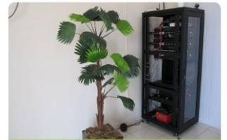
Hoje é possível encontrar até um megabyte de velocidade no acesso a web em Nova Mutum Paraná

Os moradores de Nova Mutum Paraná se conectam com o mundo em casa, no trabalho ou pelo celular. Funcionário de um restaurante, Egileudo Almeida, 25 anos, conta que usa a internet para tudo. "Me comunico, uso para entretenimento, trabalho, sempre estou conectado",