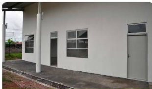
Novas salas de aula terão capacidade para 40 alunos

A Escola Municipal Nossa Senhora de Nazaré ganhou a ampliação de mais duas salas de aula, tornando possível subir para mais de 240 o número de vagas na escola. Cada sala