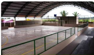
Ginásio poliesportivo atenderá a comunidade