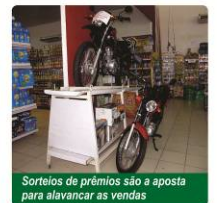
Sorteios de prêmios são a aposta para alavancar as vendas