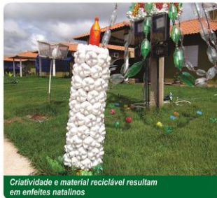
Criatividade e material reciclável resultam em enfeites natalinos

O clima natalino, aos poucos, tomou conta de Nova Mutum Paraná. As luzes, pisca-piscas e outros enfeites natalinos passaram a fazer parte da decoração das casas e comércios, deixando as noites coloridas e alegres.