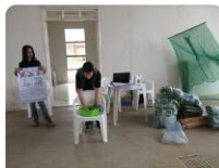
Podem ser lavados sem que a ação inseticida seja perdida