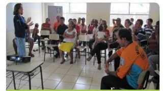
O próximo passo será eleger a mesa diretora da nova associação

De acordo com os moradores do Reassentamento Rural, há mais de um ano se discute em reuniões a criação da associação. O próximo passo, que deverá ocorrer ainda em fevereiro, é a convocação para efetivar a