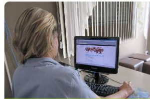
A interatividade da internet atrai os moradores