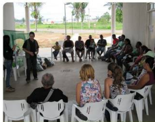
Na oficina, os reassentados aprenderam como se proteger da doença

A equipe do Programa de Saúde Pública iniciou a instalação dos MILDs no início do ano passado, cumprindo a meta de 8.166 mosquiteiros. Os equipamentos foram instalados nas comunidades de Taquara e Vila da Penha (BR 425); Garimpos São Lourenço, Maciza, Cerombraz