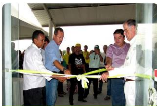
Autoridades marcam presença durante as inaugurações

Novas inaugurações em Nova Mutum Paraná ganham significado todo especial, pois a cada obra finalizada, os moradores ganham mais atendimento e qualidade de vida. Em fevereiro, Nova Mutum recebeu mais obras de compensações sociais. E as entregas contaram