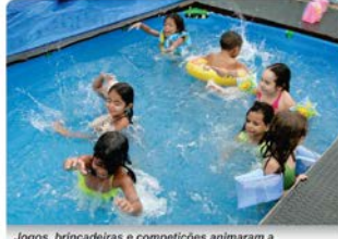
Jogos, brincadeiras e competições animaram a garotada durante o mês de janeiro