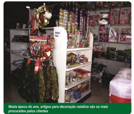
Nesta época do ano, artigos para decoração natalina são os mais procurados pelos clientes

responsáveis pelo aumento das vendas. No supermercado Euza e Oliveira, por exemplo, a promoção é