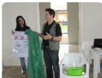
Os MILDs têm o inseticida impregnado em suas fibras

Gavião; ramais Primavera, Vai Quem Quer; Eixão da linha F, Embaúba, Jirau, Linha 101 e adjacências, além do distrito Abunã. As áreas contempladas foram selecionadas por apresentarem inúmeros casos de malária, principalmente do tipo falciparum , e um alto número de crianças com até 10 anos que contraíram a doença.