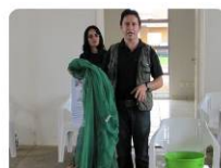
A duração de sua ação é de até cinco anos

Nova Mutum Paraná - RO, 01 a 15 de fevereiro de 2012