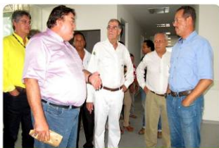
Entregas solenes das obras de compensação social

Novas inaugurações em Nova Mutum Paraná ganham significado todo especial, pois a cada obra finalizada, os moradores ganham mais atendimento e qualidade de vida. Em fevereiro, Nova Mutum recebeu mais obras de compensações sociais. E as entregas contaram