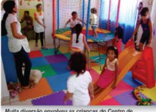
Muita diversão envolveu as crianças do Centro de Aprendizagem Recanto do Arco Íris

Nova Mutum Paraná, preparada para ser feliz.