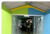
A creche, um dos serviços públicos mais esperados pelas mães de Nova Mutum, já é uma realidade

Outro espaço que irá trazer benefício para os moradores, principalmente às mães, é a creche e pré-escola municipal. O local foi construído para atender a 240 crianças da faixa etária de 3 a 5 anos. E de acordo com a Prefeitura, o prazo para iniciar as atividades, está entre 40 e 50 dias, a partir da data de inauguração, dia 14 de fevereiro. O prédio possui seis salas de aula, refeitório, cozinha, brinquedoteca,