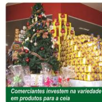
Comerciantes investem na variedade em produtos para a ceia