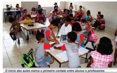
O início das aulas marca o primeiro contato entre alunos e professores

É no início das aulas que alunos e professores têm os primeiros contatos do ano, reencontram os amigos e fazem novas amizades. Para os estudantes, esta é uma ocasião de grandes expectativas e alguns procedimentos são fundamentais para um período mais tranquilo como: a organização com antecedência do material escolar, o uniforme estar pronto desde a noite anterior, ter um sono tranquilo e acordar cedo para ser pontual na chegada à escola.