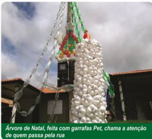
Árvore de Natal, feita com garrafas Pet, chama a atenção de quem passa pela rua