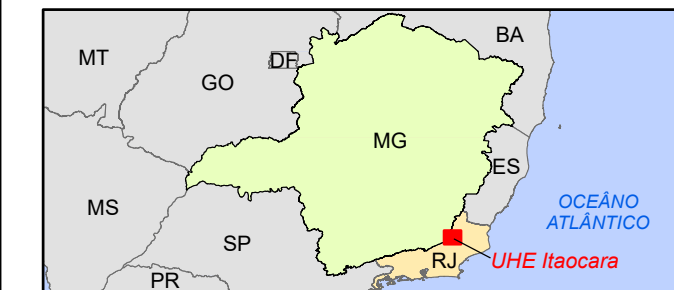
Localização da UHE Itaocara I em relação aos estados brasileiros