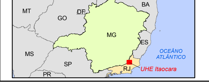
Localização da UHE Itaocara I em relação aos estados brasileiros