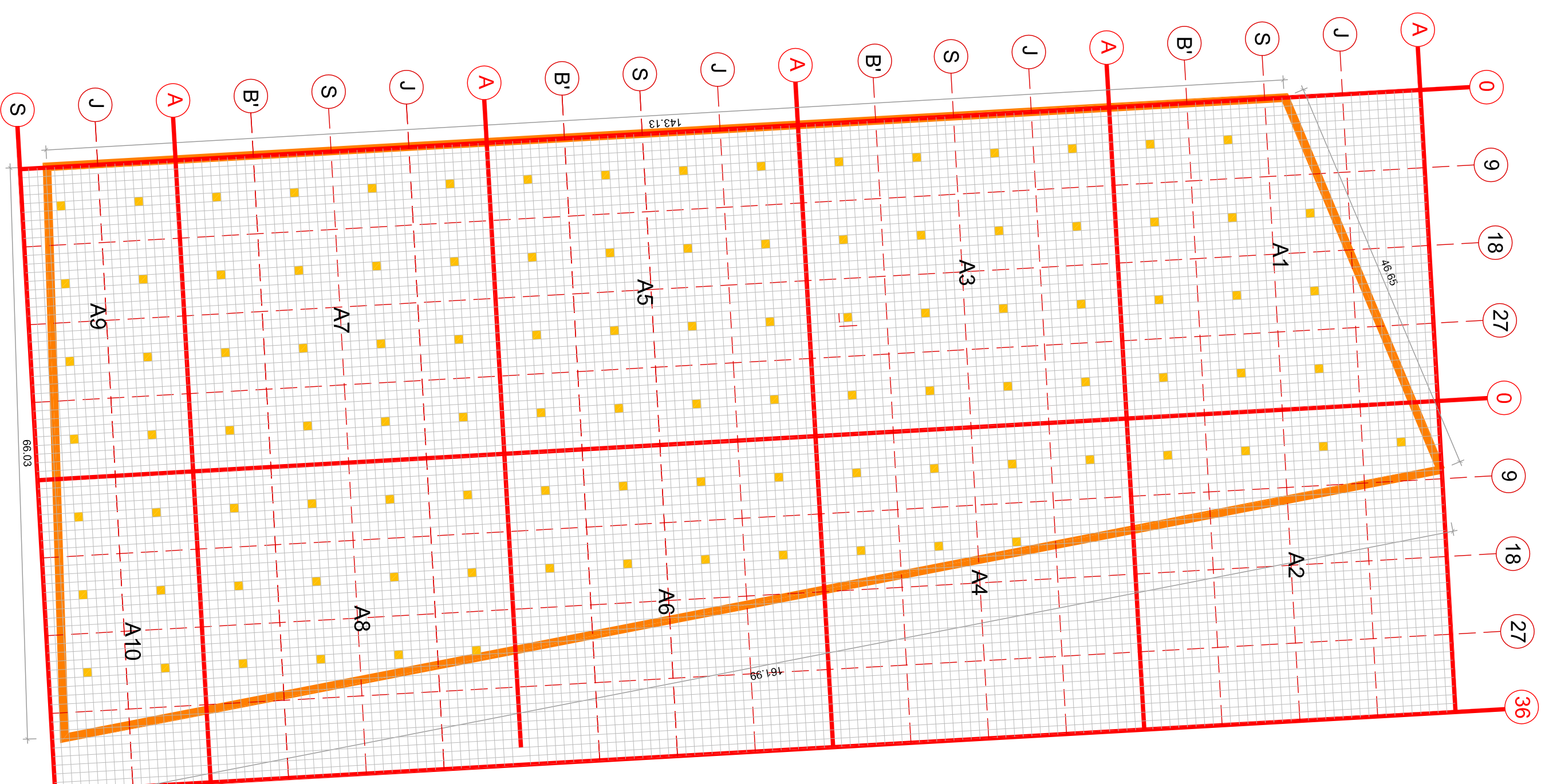
1 PLANTA BAIXA esc.: 1/500