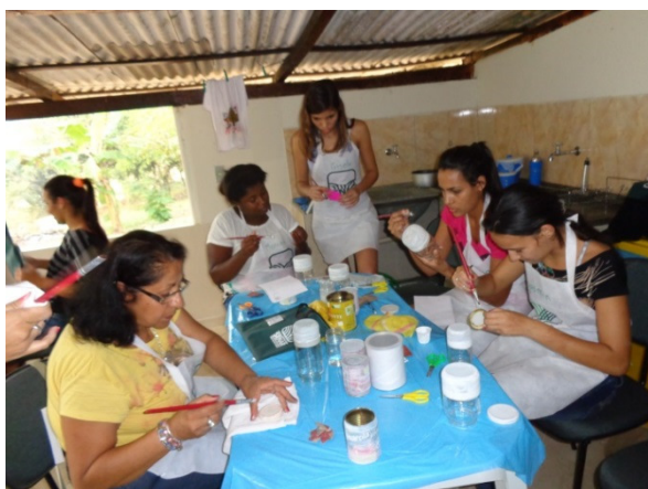
Alunas confeccionando as peças