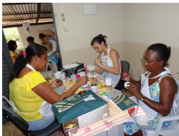
Alunas confeccionando as peças