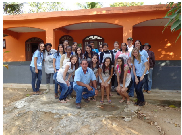
Alunas do curso, equipe do Consórcio UHE Itacara e representantes do SENAR