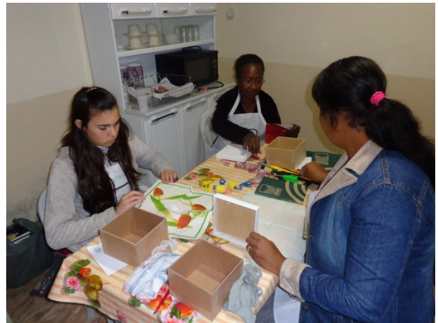
Alunas confeccionando as peças