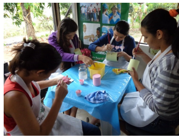
Alunas confeccionando as peças