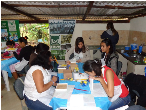
Alunas confeccionando as peças