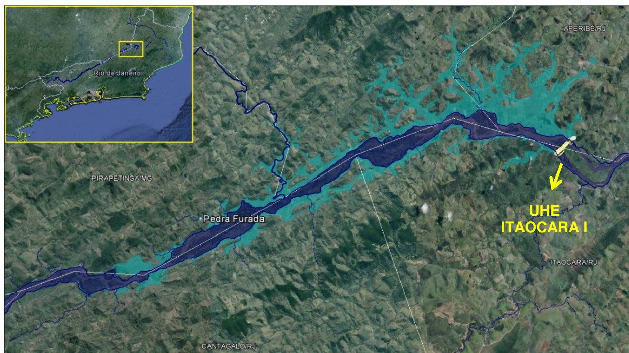
Mapa de localização

A UHE Itaocara I terá seu futuro reservatório com extensão de 24 km no trecho médio baixo do rio Paraíba do Sul e 7 km no rio Pirapetinga.