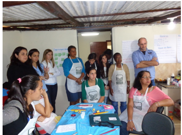
Encerramento do curso