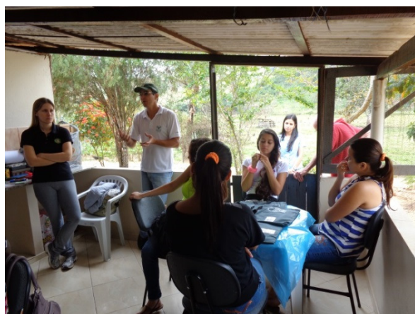
Abertura do curso de Artesanato em Decoupage

As fotos a seguir apresentam alguns momentos do Curso de Artesanato em Decoupage realizado pelo SENAR em parceria com o Consórcio UHE Itaocara: