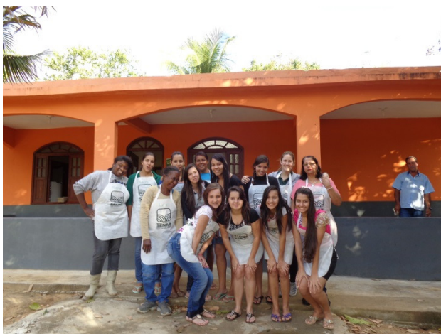
Confraternização das alunas com a professora