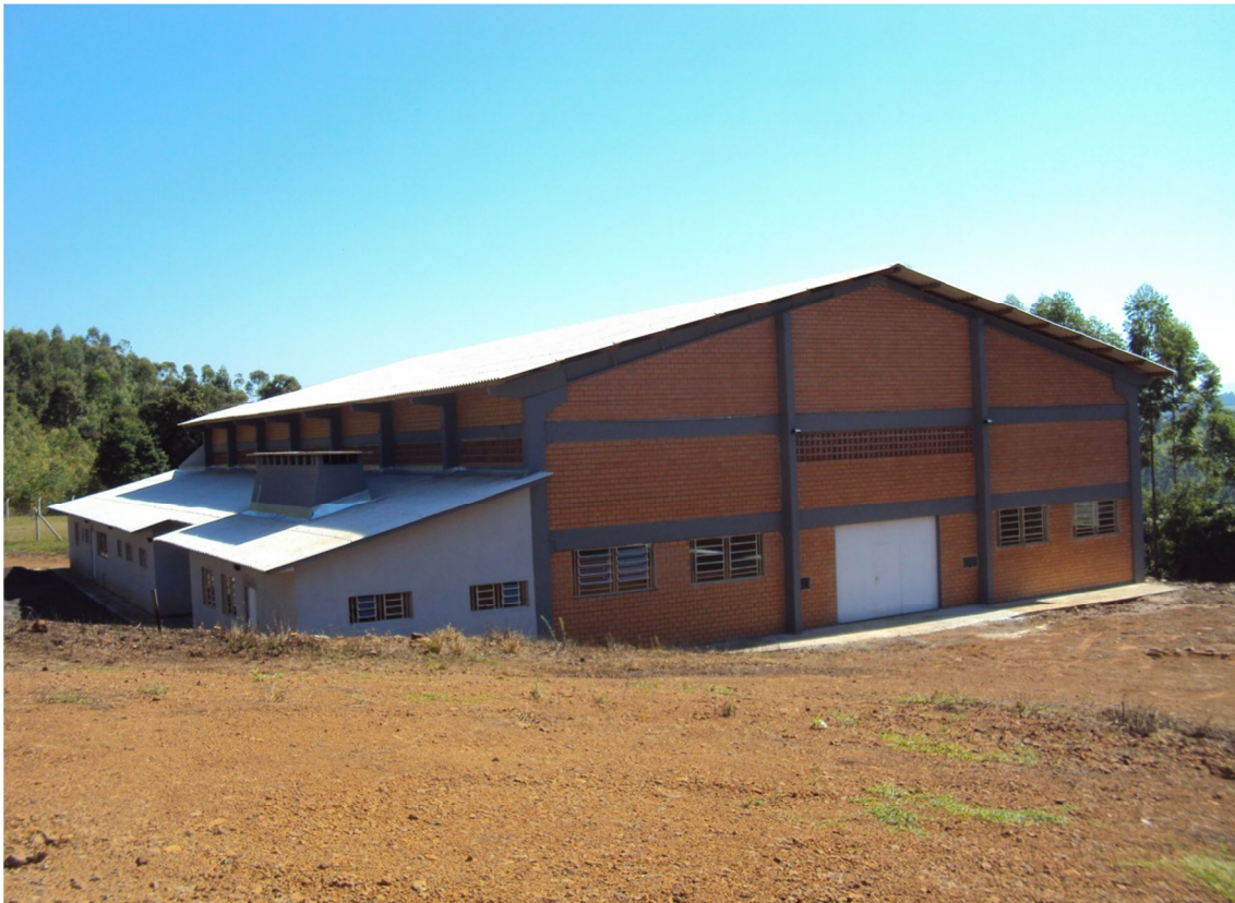
Núcleo relocado- Porto Mauá