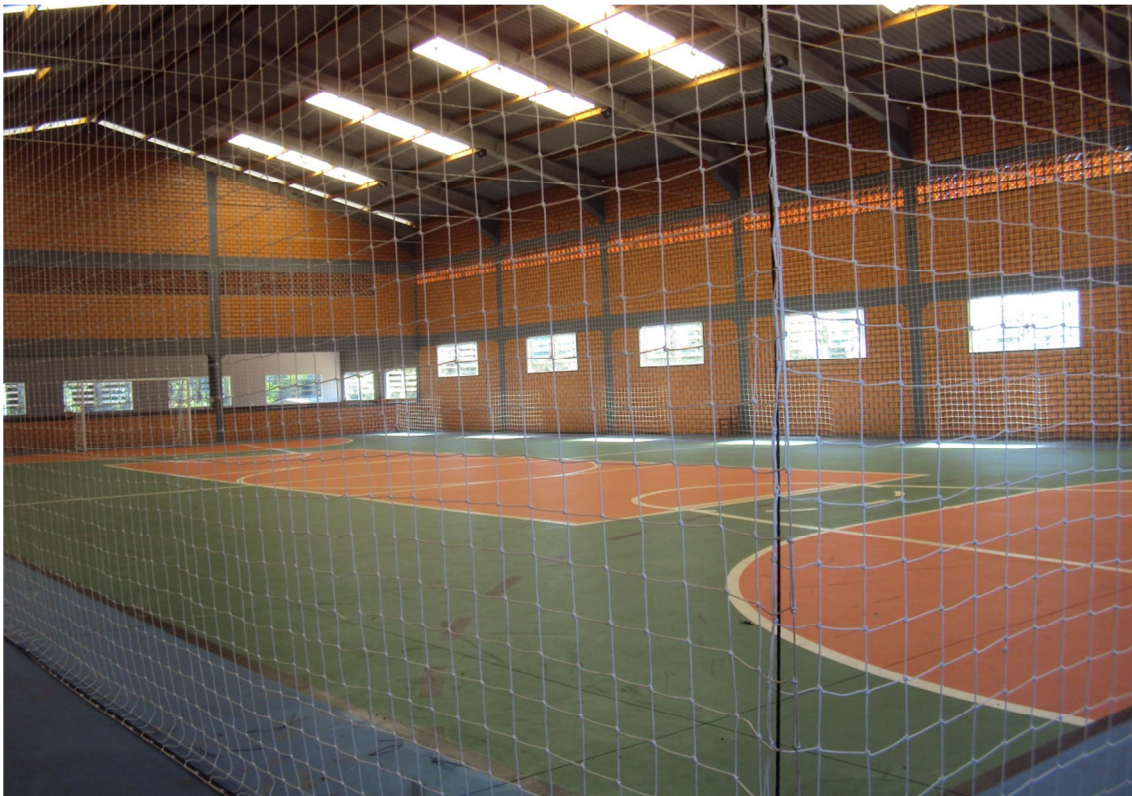
Núcleo relocado- Porto Mauá