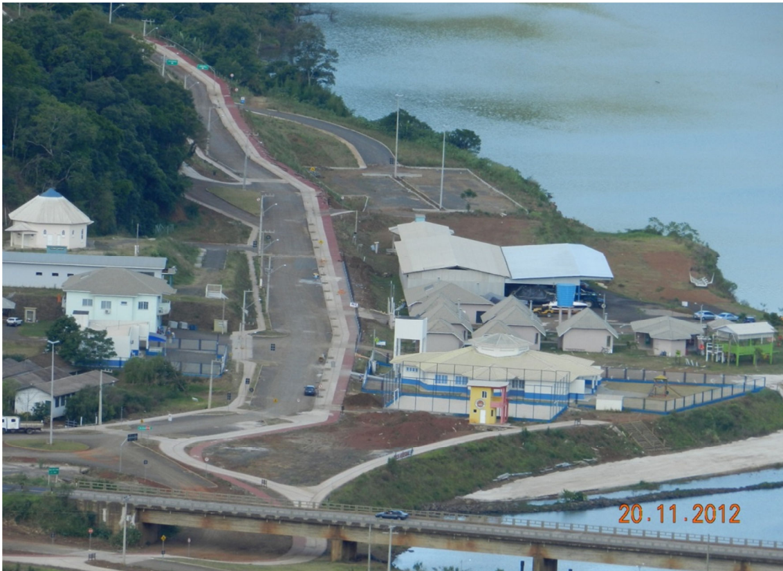
Núcleo relocado- Goio-en / SC