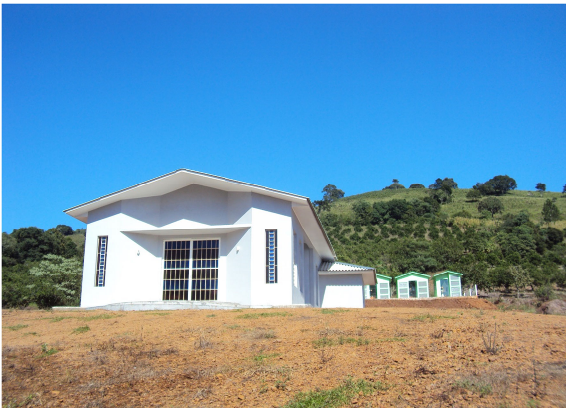
Núcleo relocado- Porto Mauá