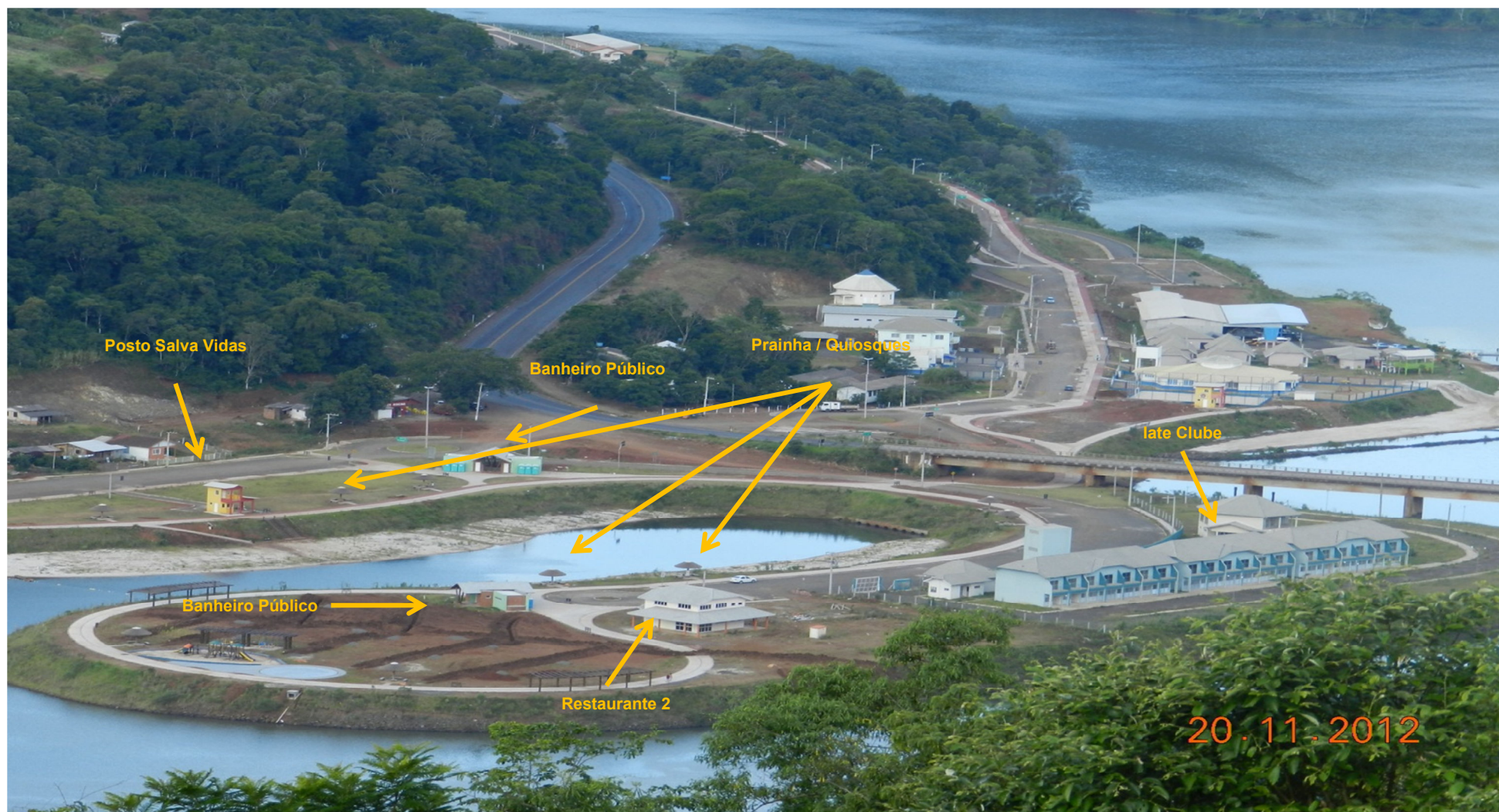
Núcleo relocado- Goio-en / SC