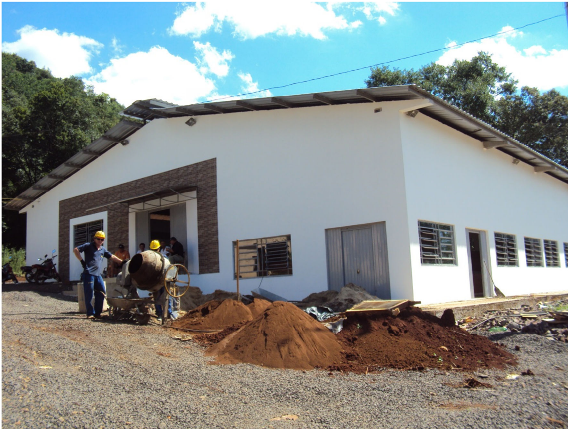
Núcleo relocado- Lajeado Grande