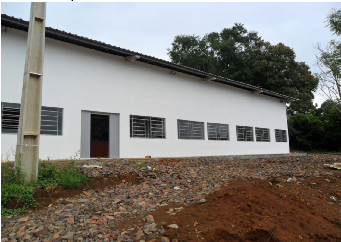
Núcleo relocado- Lajeado Grande