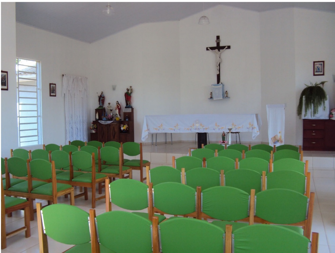
Núcleo relocado- Porto Mauá