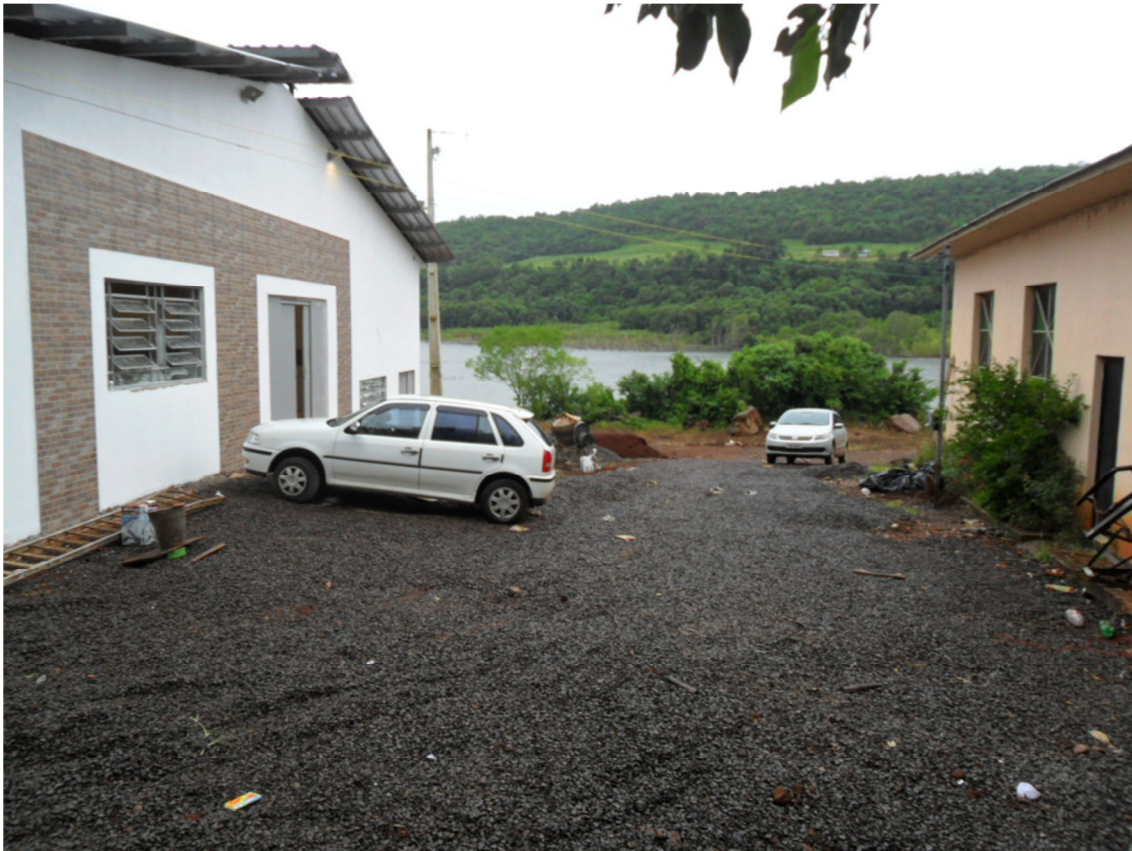
Núcleo relocado- Lajeado Grande