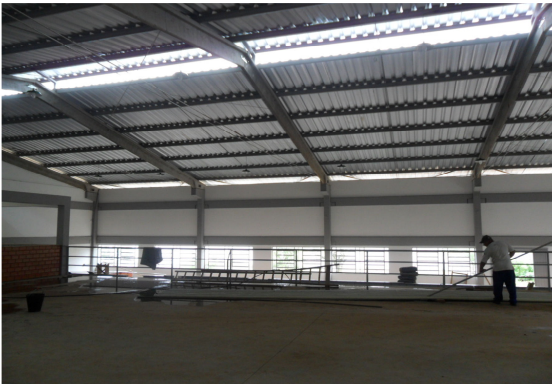
Núcleo relocado- Lajeado Grande