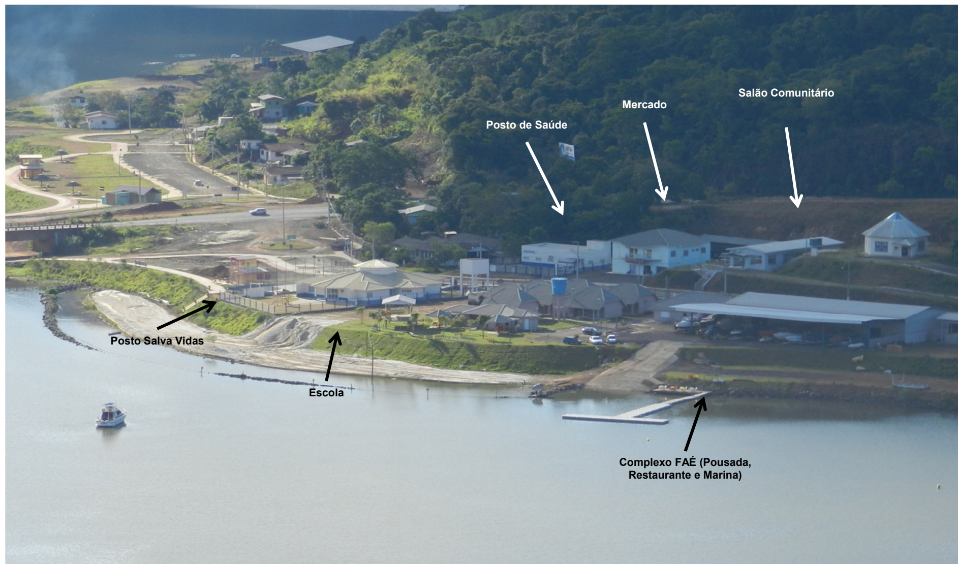
Núcleo relocado- Goio-en / SC