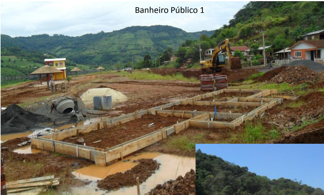
Banheiro Público 1