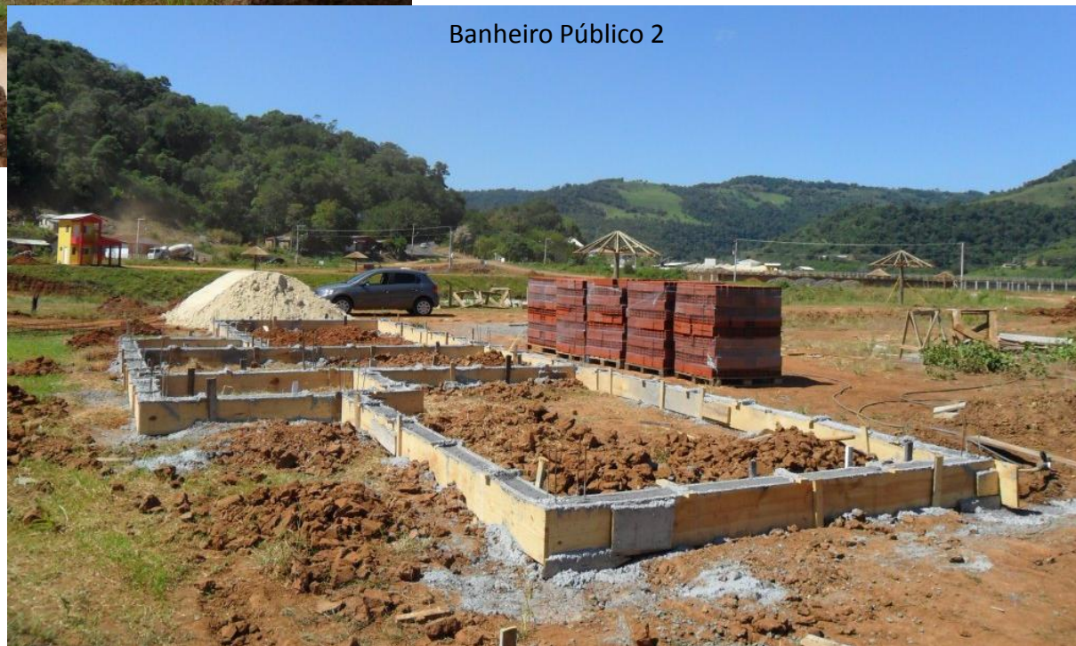
Banheiro Público 2