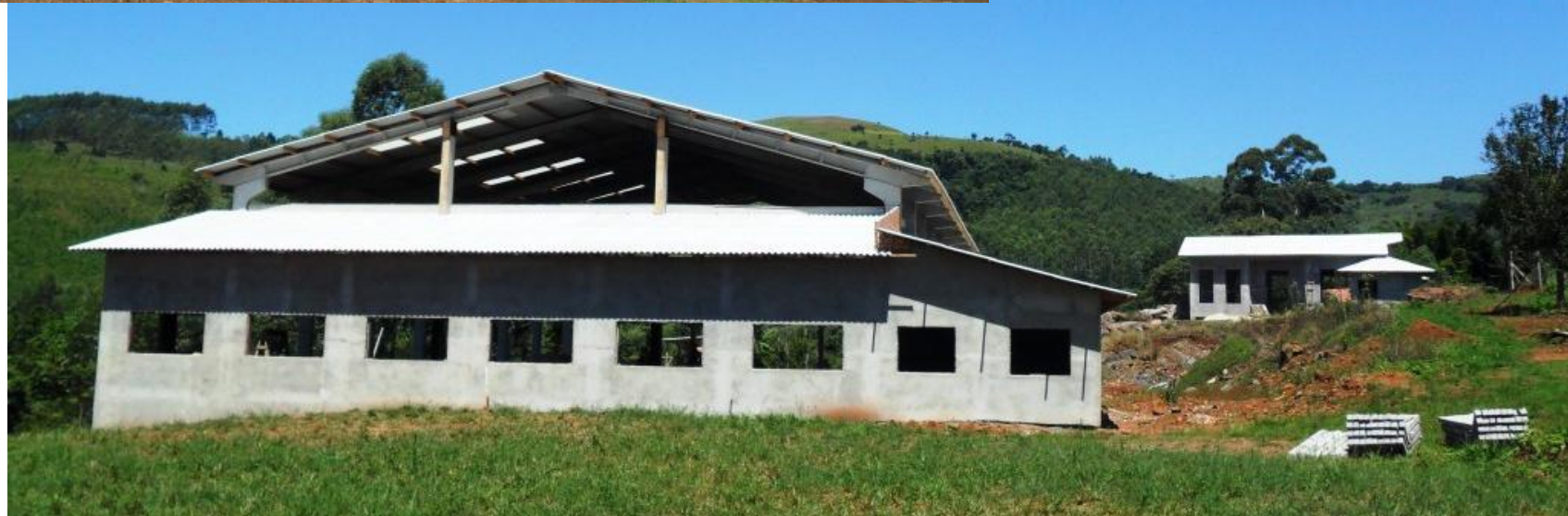
Núcleo Porto Mauá