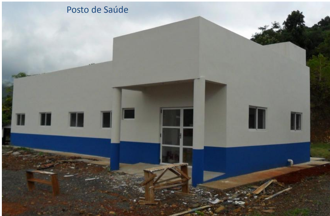
Posto de Saúde