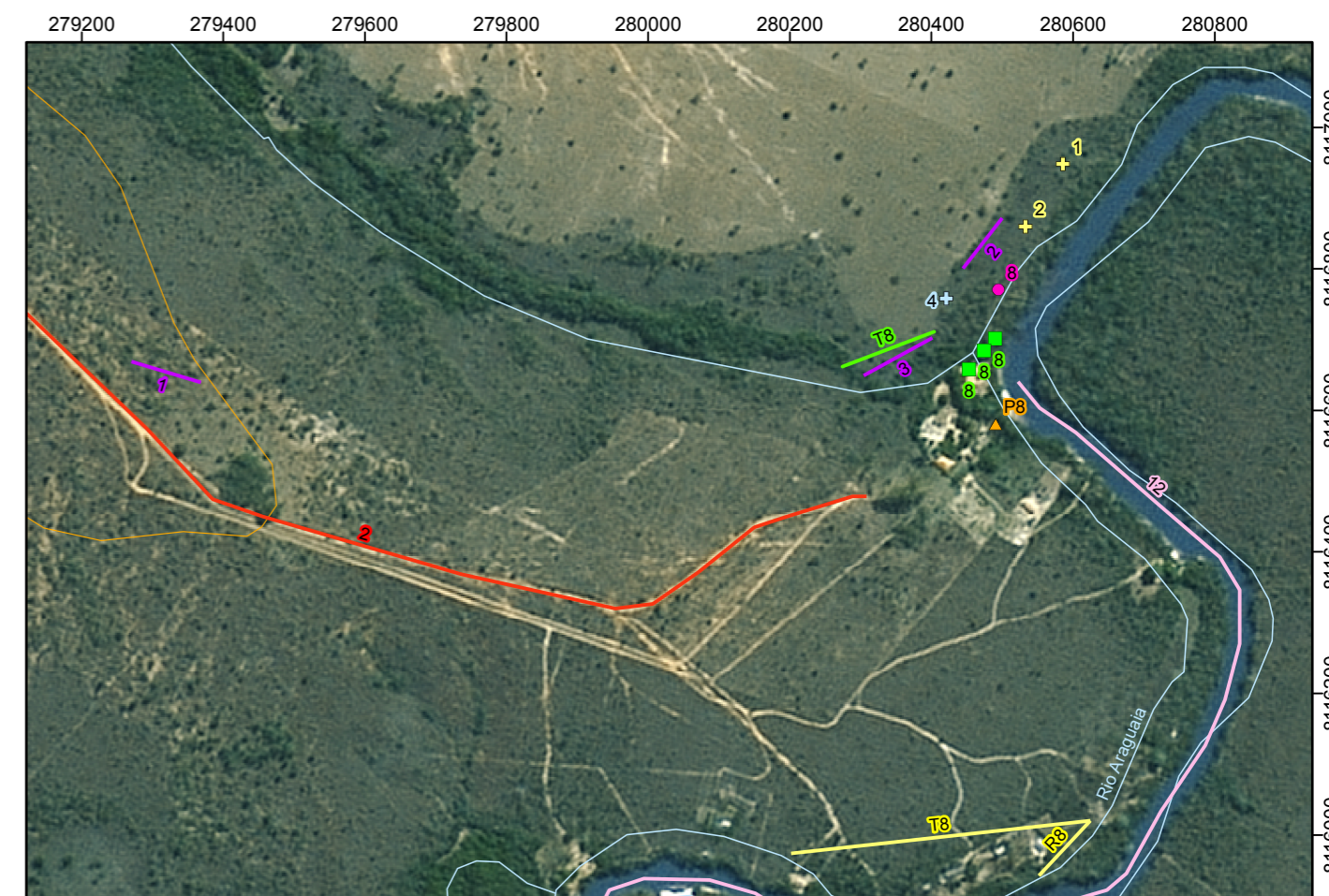
Detalhe 1 Escala 1:10.000

Escala 1:50.000 0 500 1.000 1.500 2.000 2.500 m Projeção UTM - Datum horizontal SAD 69 - Fuso 22S