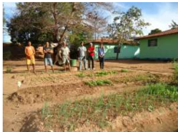
Comunidade Terapêutica Reviver