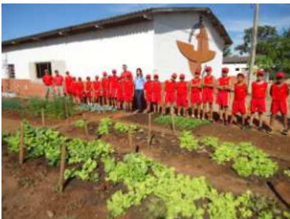
Corpo de Bombeiro

Dia 29 de maio visitamos as hortas que a UHE Cana Brava doou fertilizantes e apoio técnico. Fotos abaixo: