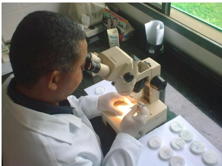
Figura 5. Identificação em laboratório de espécimes de dípteros.

Para a identificação dos flebotomíneos utiliza-se o Guia de Identificação e Distribuição Geográfica dos Lutzomyia (Diptera: Psychodidae) (Young & Duncan, 1994).