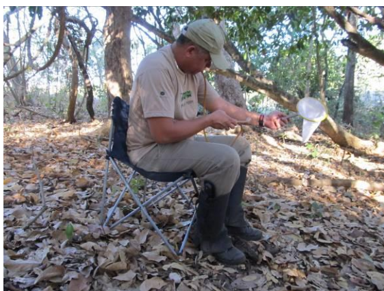
Figura 2. Coleta de dípteros com o aspirador bucal utilizado também no método de “isca-humana”.

Como metodologia complementar à captura de dípteros noturnos, utiliza-se também uma armadilha luminosa do tipo CDC ( Figura 3 ), que possui um motor – acoplado a uma ventoinha – e uma lâmpada de 3V e funciona com quatro pilhas de 1,5V. Esta armadilha fica exposta e permanece no ponto de coleta por 12 horas, no período entre 18:00h e 06:00h.