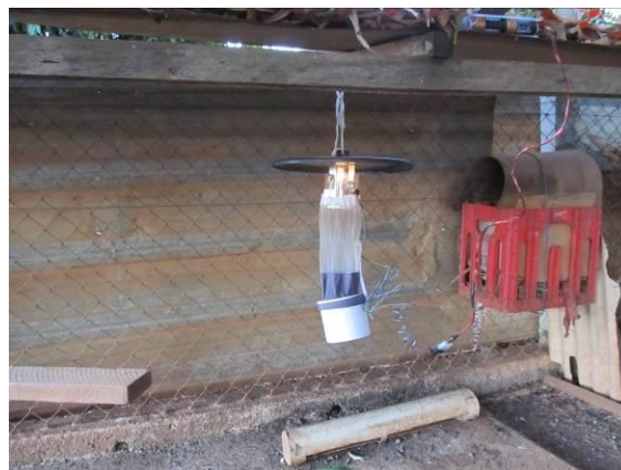
Figura 3. Armadilha luminosa CDC utilizada para coleta de insetos noturnos.