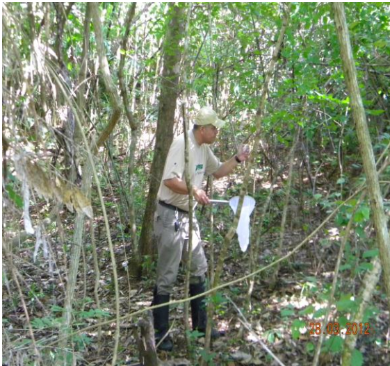
Acompanhamento a empresa Nature.