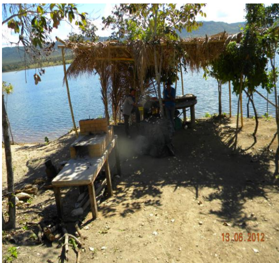
Abrigo na APP.