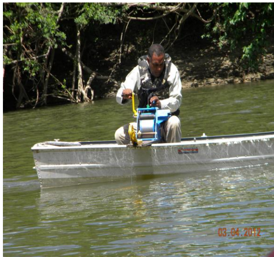
Acompanhamento a empresa Acqua Soluções ambientais.