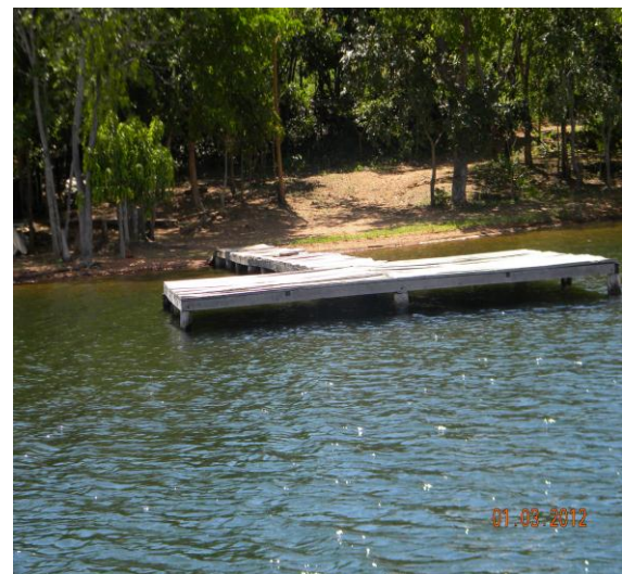
Trapiche fixo de madeira na cota de inundação.

RO-05 – Mortandade de peixes- Mortandades de peixes caracteriza-se como acidentes ambientais que podem causar prejuízos em cadeia tanto à água, quanto à população que a usa ou por ela é abastecida, podendo ter como origem, causas naturais como: variações bruscas da temperatura; elevação de temperatura; chuvas e inundações; decomposição de vegetais ou presença de estiagem; eutrofização ou floração de algas; superpopulação de peixes ou migração. Também pode ser causas antrópica, como: diminuição de OD (oxigênio dissolvido) por efluentes domésticos e/ou industriais; despejo de substâncias tóxicas; utilização de defensivos agrícolas; pesca predatória; operações de hidrelétricas.