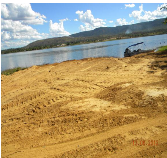
Aterro no reservatório.

RO-11 - Uso e/ou Ocupação Irregular das Terras do Concessionário e de Áreas não Vinculadas à Concessão - para registrar a ocorrência em áreas remanescentes e Área de Preservação Permanente (APP), em imóveis do empreendimento ou em imóveis vinculados à UHE.