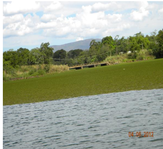
Macrófitas no Rio Bonito.

RO-11 - Uso e/ou Ocupação Irregular das Terras do Concessionário e de Áreas não Vinculadas à Concessão - para registrar a ocorrência em áreas remanescentes e Área de Preservação Permanente (APP), em imóveis do empreendimento ou em imóveis vinculados à UHE.