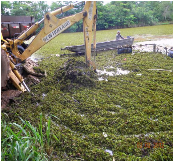
Retirada de Macrófitas Rio Bonito.

RO 10 Proliferação de macrófitas aquáticas - Nele são registrados os locais onde ocorre a formação de populações de macrófitas aquáticas, quantificando a biomassa, identificando as espécies assim como seu estado quanto à fase vegetativa, inicial, mediana ou final, incluindo observações de deslocamento do banco de macrófitas.