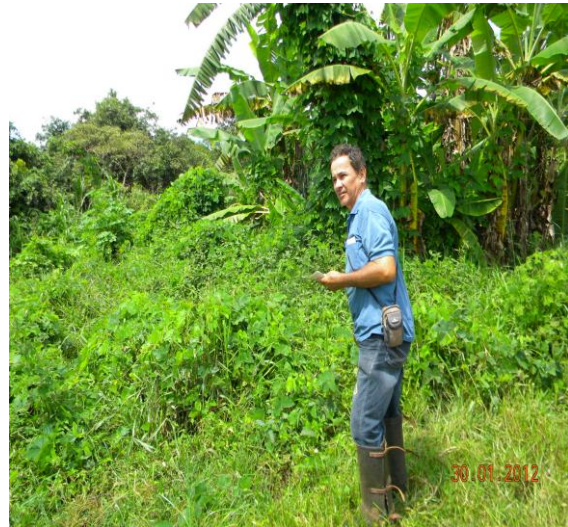
Acompanhamento a empresa Cerradão em ara para plantio