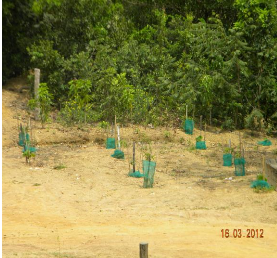
Vistoria em área reflorestada pela empresa Cerradão.

RE-02 – Vistoria Técnica - É aplicado para registrar sinteticamente quaisquer vistorias técnicas, programadas ou originadas por demanda, relacionadas diretamente aos monitoramentos ambientais da UH ou por ocorrências extraordinárias.