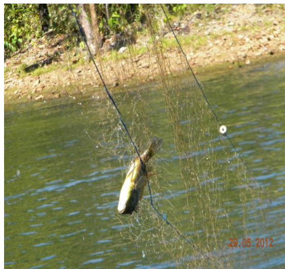
Rede de pesca no reservatório.

Neste período foram realizadas 47 vistorias no reservatório da Usina Hidrelétrica de Cana Brava, as quais foram distribuídas conforme a tabela abaixo.