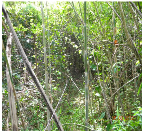
Local onde havia uma cerca com tela na APP.