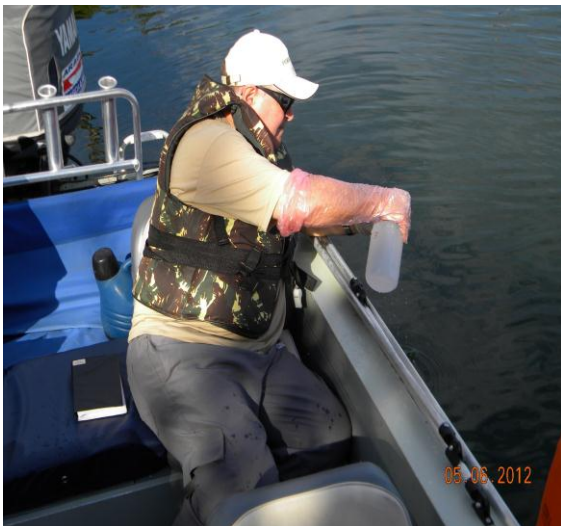
Acompanhamento a empresa Venturo Consultoria Ambiental.