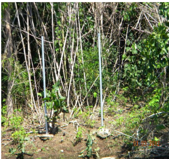
Roubo de placa de Ilha

RO 14 - Ocorrências Gerais - Este formulário destina-se ao relato de ocorrências observadas durante as atividades de campo, mesmo fora do âmbito do objetivo específico do trabalho.