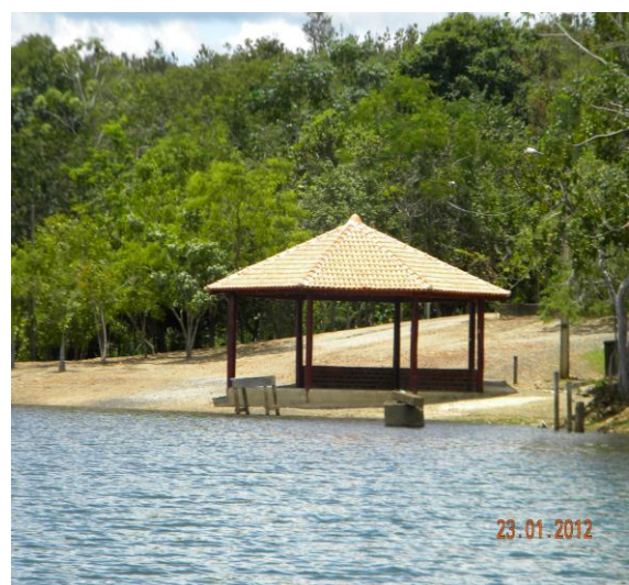
Quiosque de alvenaria na cota de inundação.