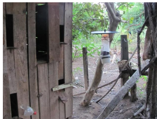
Figura 3. Armadilha luminosa CDC utilizada para coleta de insetos instalada próxima a um abrigo para aves.