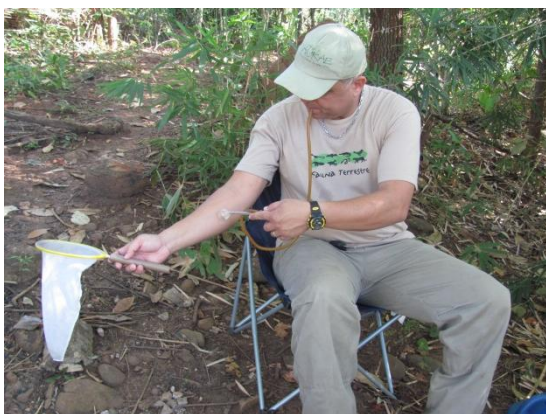
Figura 2. Coleta de dípteros pelo método de “isca-humana”.

Como metodologia complementar à captura de dípteros noturnos, utiliza-se também armadilha luminosa do tipo CDC (Figura 3), que possui um motor – acoplado a uma ventoinha – e uma lâmpada de 3V e funciona com quatro pilhas de 1,5V. Esta armadilha fica exposta e permanece no ponto de coleta por 12 horas, no período entre 18:00h e 06:00h.