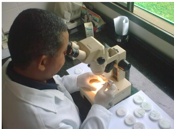
Figura 5. Identificação em laboratório de espécimes de dípteros.

Para a identificação dos flebotomídeos utiliza-se o Guia de Identificação e Distribuição Geográfica dos Lutzomyia (Diptera: Psychodidae) (Young & Duncan, 1994).