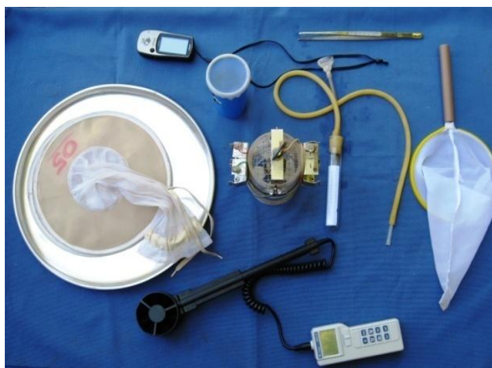
Figura 1. Materiais utilizados para a coleta de dípteros.

Armadilhas diferenciadas têm sido empregadas na coleta de invertebrados, principalmente insetos, para estudos relacionados com a fauna de uma região (Figura 1). Na ausência de um tipo de armadilha adequada à coleta de todas as espécies de insetos, para cada grupo têm sido empregadas aquelas que, após testes, mostraram-se mais eficazes em função da praticidade e dos resultados obtidos.