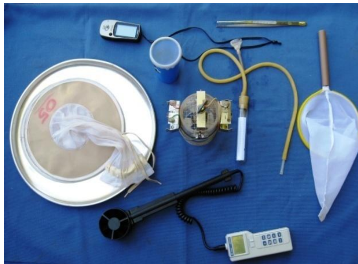
Figura 1. Materiais utilizados para a coleta de dípteros.

Armadilhas diferenciadas têm sido empregadas na coleta de invertebrados, principalmente insetos, para estudos relacionados com a fauna de uma região (Figura 1). Na ausência de um tipo de armadilha adequada à coleta de todas as espécies de insetos, para cada grupo têm sido empregadas aquelas que, após testes, mostraram-se mais eficazes em função da praticidade e dos resultados obtidos.