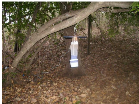
Figura 3. Instalação de armadilha luminosa CDC utilizada para a coleta de insetos.