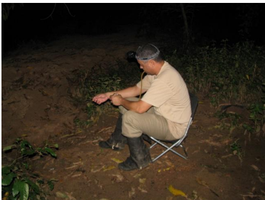
Figura 2. Coleta de dípteros pelo método de “isca-humana”.

Como metodologia complementar à captura de dípteros noturnos, utiliza-se também armadilha luminosa do tipo CDC (Figura 3), que possui um motor – acoplado a uma ventoinha – e uma lâmpada de 3V e funciona com quatro pilhas de 1,5V. Esta armadilha fica exposta e permanece no ponto de coleta por 12 horas, no período entre 18:00h e 06:00h.