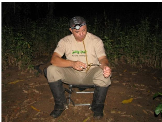
Figura 2. Coleta de dípteros pelo método de “isca-humana”.

Como metodologia complementar à captura de dípteros noturnos, utiliza-se também armadilha luminosa do tipo CDC (Figura 3), que possui um motor – acoplado a uma ventoinha – e uma lâmpada de 3V e funciona com quatro pilhas de 1,5V. Esta armadilha fica exposta e permanece no ponto de coleta por 12 horas, no período entre 18:00h e 06:00h.