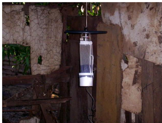
Figura 3. Armadilha luminosa CDC utilizada para a coleta de insetos.