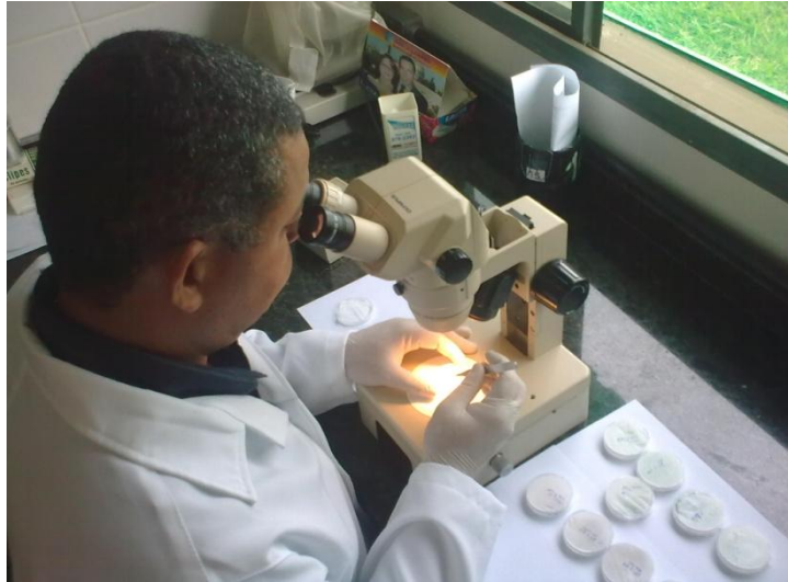
Figura 4. Identificação em laboratório de espécimes de dípteros.

Após a coleta, todos os exemplares de insetos são eutanasiados com acetato de etila e acondicionados em placas de petri com cânfora, para melhor preservação até sua posterior identificação em laboratório (Figura 4).