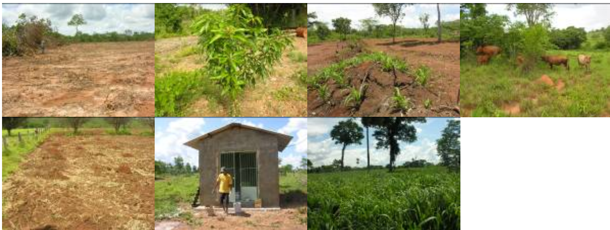
Foto 01: Início do preparo do solo para plantio de lavoura e pastagem RRIBRV Foto 02: Muda de árvore frutífera na fase de crescimento RRICO. Foto 03: Lavoura de milho na fase inicial MRRCX lote - 03. Foto 04: Bovinos oriundos do PAGR - RRIB. Foto 05: Área de lavoura após a gradeação feita em parceria dos produtores com a secretária de agricultura do Município para posterior plantio RRCBV lote 04. Foto 06: Galpão para implantação do tanque de expansão na fase de acabamento RRCP lote - 07. Foto 07: Área de pastagem com bom aspecto vegetativo RRCP lote - 09.