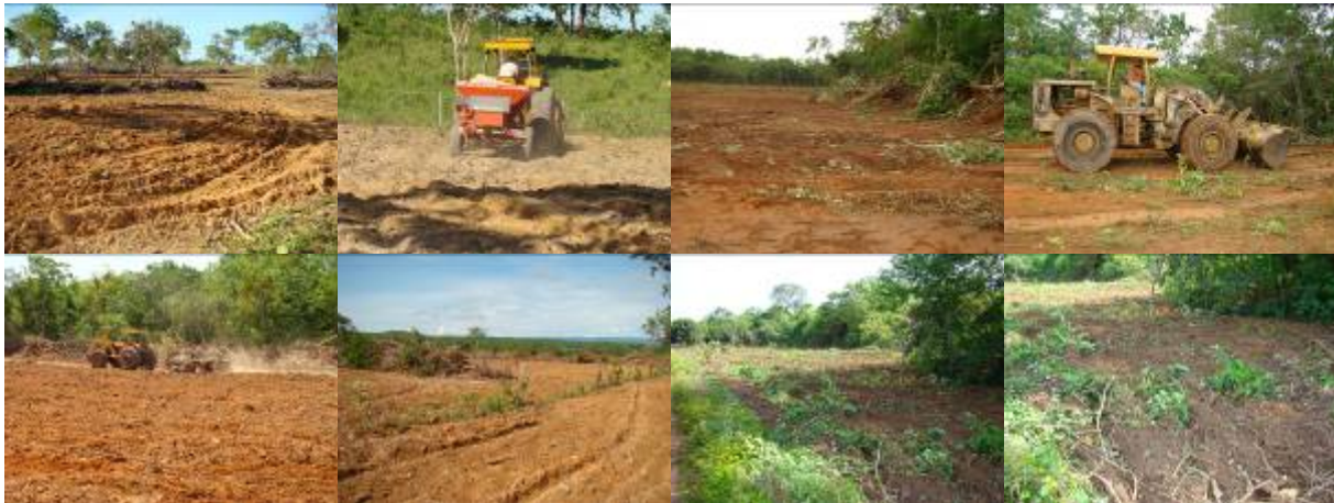
Foto 01: Solo após 1ª gradagem, MRRCI; Foto 02: Distribuição de calcário MRRCI. Fotos 03 e 04: Desmatado no RRIBRV. Fotos 05 e 6: Gradagem convencional no RRIBRV. Fotos 7 e 8: Limpeza de área com gradagem pesada no RRICO.