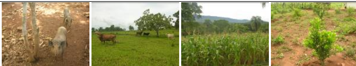
Foto 01: Lavoura de milho em estágio de granação das espigas lote – 05 RRCP. Foto 02: Lavoura de arroz e milho em estágio de desenvolvimento vegetativo lote – 06 RRCP. Foto 03: Planta frutífera bem conduzida lote – 04 RRCP. Foto 04: Orientação e demonstração do tratamento de mastite em bovinos leiteiros lote – 07 RRCP. Foto 05: Criação de suínos caipira lote – 02 RRCP. Foto 06: Bovinos oriundos do PAGR, RRIB. Foto 07: lavoura de milho em estágio final de granação das espigas lote – 02 MRRCX. Foto 08: planta frutífera com bom aspecto sanitário e vegetativo lote – 03 MRRCX.