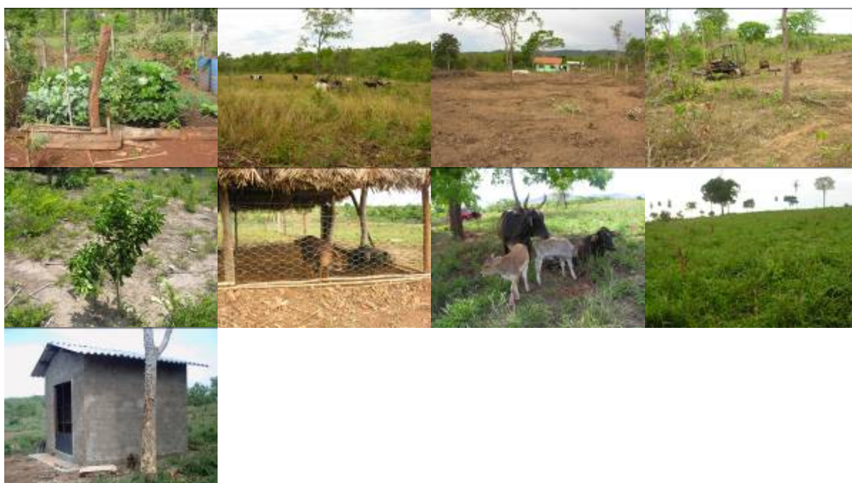
Foto 01: horta domestica fase final da produção MRRCX lote - 02. Foto 02: bovinos leiteiros MRRCBV lote - 02. Foto 03: área desmatada MRRCI lote - 02. Foto 05: mudas de citrus RRICO. Foto 06: criação de suínos RRCP lote - 03. Foto 07: bovinos leiteiros RRCP lote - 06. Foto 08: área de pastagem em fase de descanso RRCP lote - 08. Foto 09: galpão de proteção do tanque de expansão RRCP lote - 07.

Fotos 01, 02, 03: Entrega do galpão para o Sr. João Soares e Esposa Aparecida Pio ARRCP. Fotos 04 e 05: Medição de áreas APP e Reserva Legal do RRCP para o Projeto de Reflorestamento. Foto 06 e 07: Fabricação de queijo – Propriedade Sr. Marinho. Foto 08: Engorda de porcos para venda - Propriedade Sr. Marinho. Foto 09: Criação de aves para venda - Propriedade Sr. Marinho. Foto 10: Avaliação de gado – lote 04 RRCABV. Foto 11: Avaliação das pastagens nos reassentamentos RRCABV. Foto 12: Criação de suínos RRIIB. Foto 13: Colheitas de lavouras – lote 05 RRCP. Foto 14: Pomar lote 04 ARRCP. Foto 15: Horta – lote 02 RRCABV.