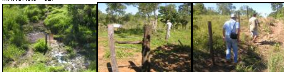
Fotos 01: passagem de animais de difícil acesso lote - 05. Fotos 02 e 03: Cerca construída na área de Reserva Legal lote – 06