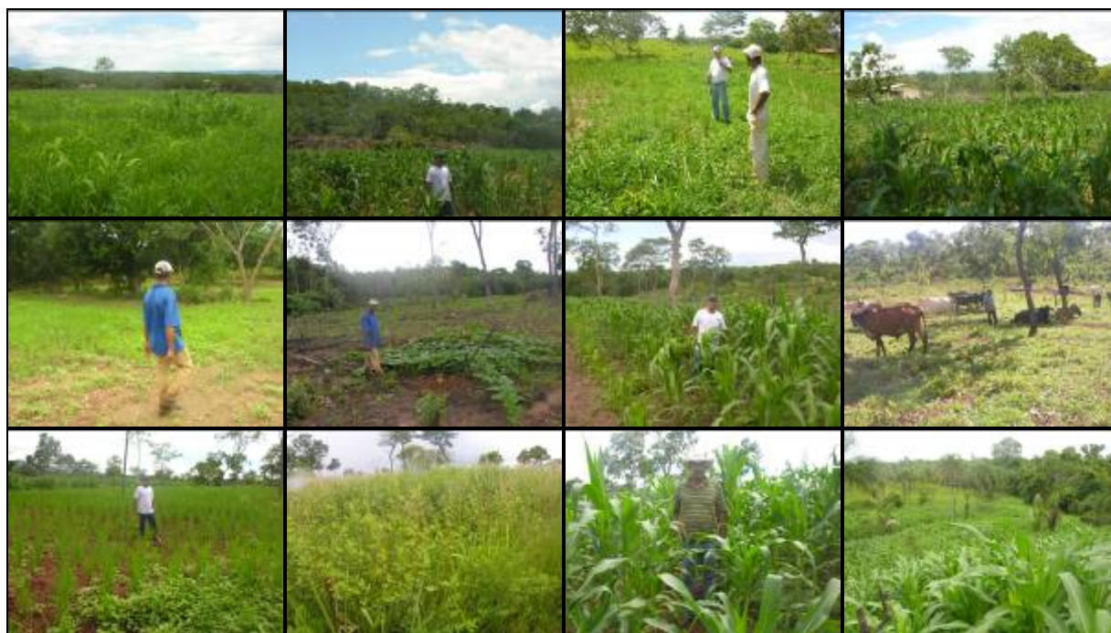
Foto 01: Área de pastagem consorciada com capim brachiaria RRIBRV. Foto 02: Lavoura de milho em estágio de desenvolvimento vegetativo RRIBRV. Foto 03: Área de pastagem consorciada com capim Kikuiu MRRCI. Foto 04: Lavoura de milho em estágio de desenvolvimento vegetativo MRRCI. Foto 05: Área de pastagem em estágio de desenvolvimento RRICO. Foto 06: Lavoura de arroz em estágio de desenvolvimento vegetativo RRICO. Foto 07: Lavoura de milho em estágio de desenvolvimento vegetativo MRRCI. Foto 08: Bovinos leiteiros oriundos do PAGR e adquiridos pelo proprietário MRRCBV lote 01. Foto 09: Área de pastagem formada em 2009 lote - 07 RRCABV. Foto 10 e 11: