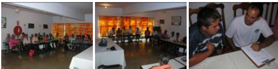
Foto 01 e 02: Reunião com as famílias e a equipe técnica e social. Foto 03: Aplicação do questionário para levantamento atualizado de produção e despesas das propriedades e família.