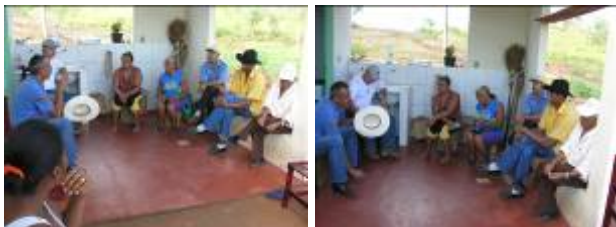
Fotos: 01 e 02 – Reunião com as famílias Reassentamento Pitangueiras