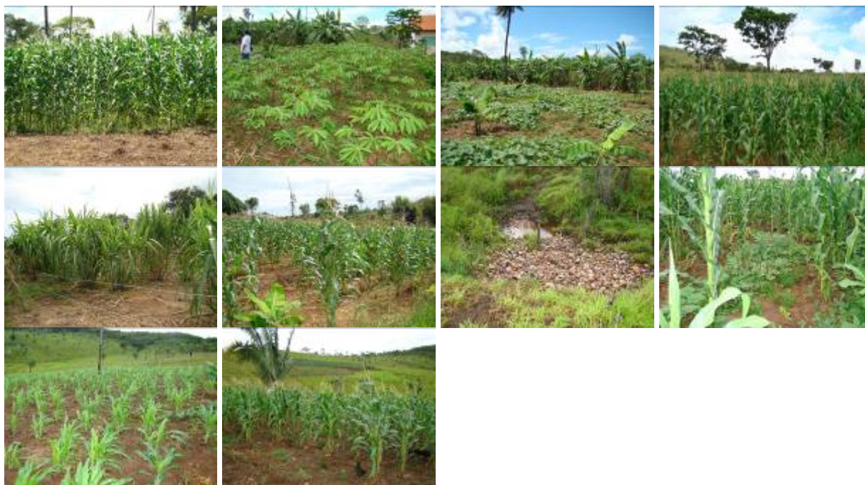
Fotos 01, 02 e 03: Plantio de milho, mandioca, abóbora, banana e cana de açúcar RRCABV Lt 02, Foto 04: Plantio de milho, lote RRCABV Lt-03; Fotos 05 e 06: Plantio de cana de açúcar, milho e banana consorciada com a lavoura de milho RRCABV Lt 04; Fotos 07: Pedras colocadas no bebedouro para evitar que o gado atole , Foto 08: plantio de milho consorciado com feijão, amendoim e banana RRCABV Lt 05; Foto 09: Plantio de milho em fase de desenvolvimento vegetativo RRCABV Lt 05; Foto 10: Plantio de milho em fase de floração e desenvolvimento das espigas RRCABV Lt 06