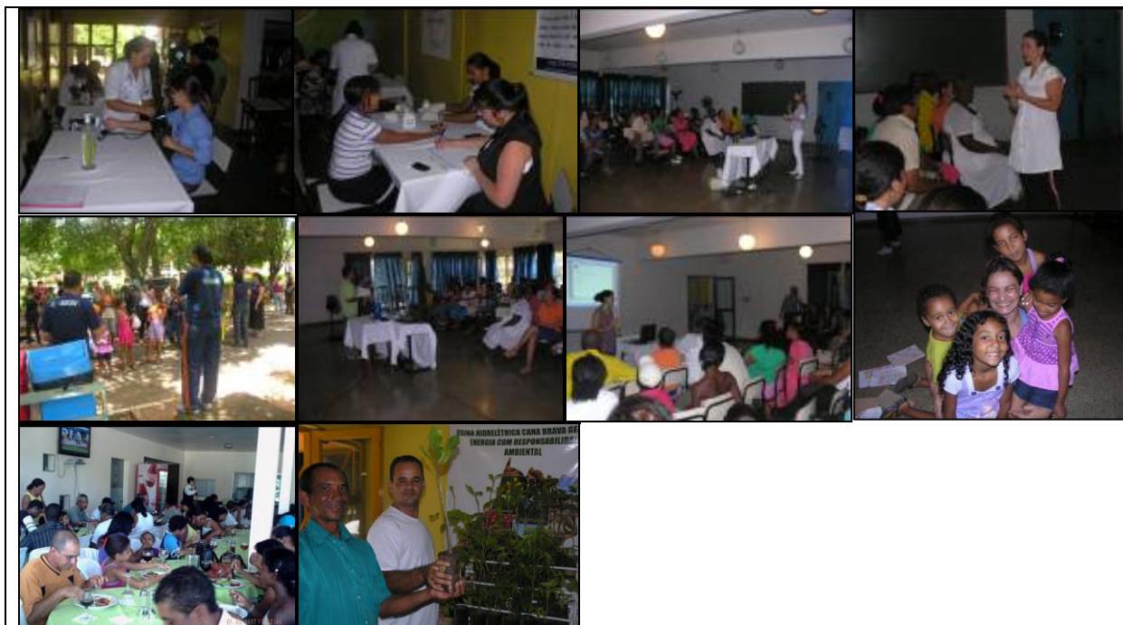
Foto 01: Avaliação da pressão arterial. Foto 02: Exame de clicose. Foto 03: Palestra saúde bucal. Foto 04: Palestra saúde preventiva. Foto 05: Atividades dinâmicas. Foto 06: Palestras alcoolismo. Foto 07: Palestra saúde alimentar. Foto 08: Almoço com as famílias Foto 09: Almoço oferecido às famílias participantes. Foto 10: Mudanças de árvores nativas da região.