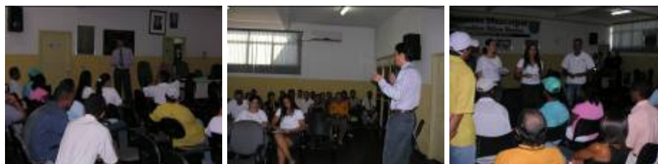
Fotos 01 e 02: Palestra com Gerente BB e famílias, sobre PRONAF. Foto 03: Informações repassadas pela equipe social e agrônômica