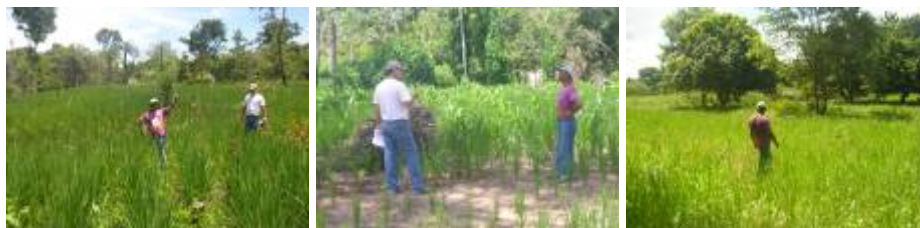
Foto 01: Plantio de arroz, RRICO; Foto 02: Área não gradeada e plantada manualmente com a cultura do arroz; Fotos 03 : Plantio de capim Brachiaria Brizantha, consorciado com Estilosante Campo Grande.