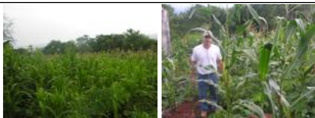
Fotos 01 e 02: Plantio de milho em fase de floração e maturação de grãos, MRRBV Lt-02.