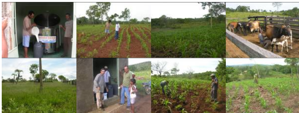
Foto 01: Acompanhamento da entrega do leite no tanque de expansão, primeiro dia RRCP lote – 07. Foto 02: Lavoura de milho na fase inicial de desenvolvimento RRCP lote – 07. Foto 03: Lavoura de milho com bom aspecto sanitário e vegetativo MRRCX lote - 03. Foto 04: Ordenha de vaca leiteira oriunda do PAGR, RRCABV lote - 02. Foto 05: Área de pastagem em fase de recuperação e no estágio de maturação das sementes RRCABV lote – 07. Foto 06: Acompanhamento da entrega do leite no tanque de expansão, primeiro dia RRCABV lote – 02. Foto 07: Lavoura de milho, sendo realizados os tratos culturais MRRCBV lote – 02. Foto 08: Lavoura de milho MRRCI lote – 02.