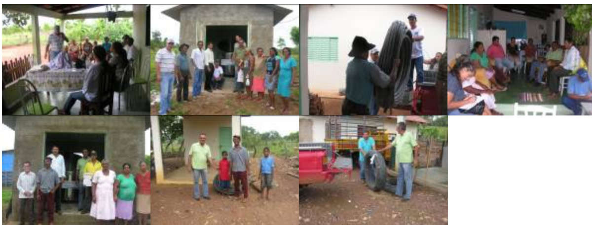
Foto 01: Reunião com as famílias do RRCP. Foto 02: Entrega do tanque de expansão para as famílias do RRCP. Foto 03: Entrega dos materiais para manutenção do sistema de abastecimento de água do RRCP. Foto 04: Reunião com as famílias do RRCABV. Foto 05: Entrega do tanque de expansão RRCABV. Foto 06: Entrega dos materiais para manutenção do sistema de água RRCABV lote – 04. Foto 07: Entrega dos materiais para manutenção do sistema de água RRCABV lote – 06.