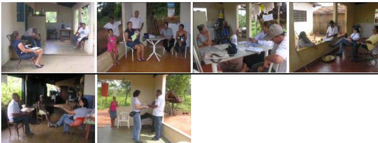
Fotos: 01 RRICO. 02: MRRCBV lote – 02. 03: RRCABV lote – 08. 04: RRCP lote – 02. 05: MRRCX lote - 02 e 06: MRRCX lote 03: