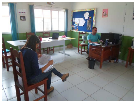
Figura - 10 – Coleta de dados de matrículas - escola Padre Leo Schneider - Brasil Novo - set/15