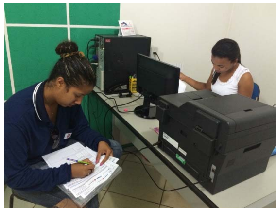
Figura - 2 – Coleta de dados do Lixo-Anapu – jan/15