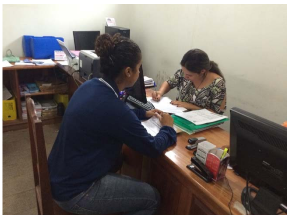
Figura – 3 - Coleta de dados da Água e Alvarás- Senador José Porfírio – fev/15