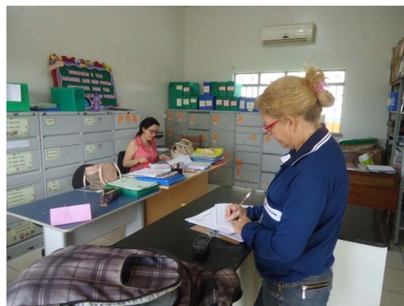
Figura - 4 – Coleta de dados de matrículas - EMEF Dr. Octacilio Lino - Altamira Urbana – mar/15