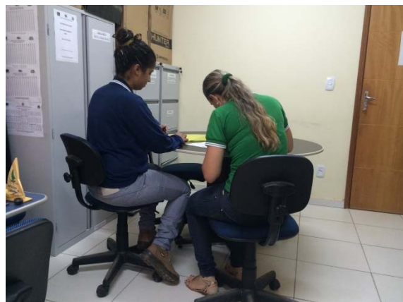
Figura - 8 – Coleta de dados de Licenças- Vitória do Xingu - jul/15.