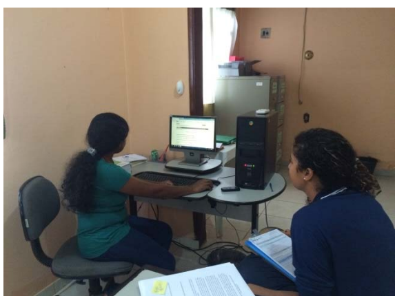
Figura - 5 – Coleta de dados do CREAS- Altamira - abr/15