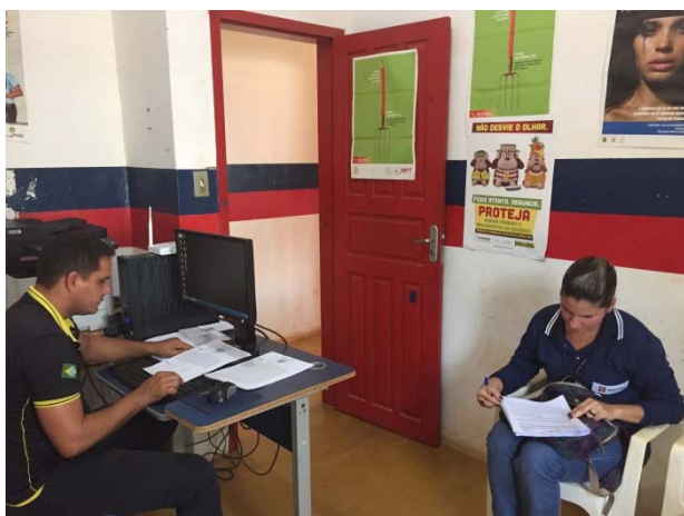
Figura - 11 – Coleta de dados do Conselho Tutelar- Anapu - out/15