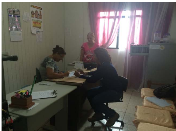
Figura - 1 – Coleta de dados do Conselho Tutelar- Brasil Novo – jan/15