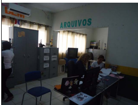
Figura - 6 – Coleta de dados de matrículas - EMEF Dulcinéia Almeida do Nascimento - Vitória do Xingu - mai/15.