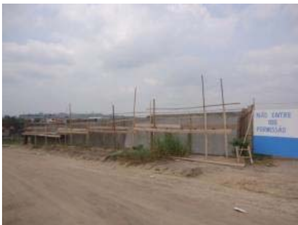
Figura 57 – Fachada Frontal – Armação da viga de amarração e reboco.