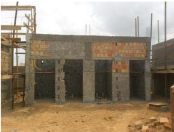
Figura 21 – Sanitários individuais – Chapisco e reboco