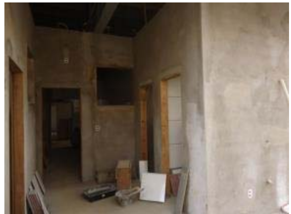
Figura 40 – Área de serviço – Instalação dos requadros das portas e assentamento de cerâmica.