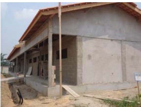
Figura 63 – Salas de aula – Concretagem da canaleta de drenagem e rampa de acesso, instalação da rede elétrica e execução do piso de nivelamento.