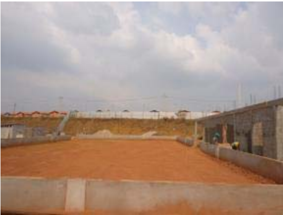
Figura 31 – Quadra poliesportiva – Compactação do solo para execução do contrapiso e finalização do reboco da mureta