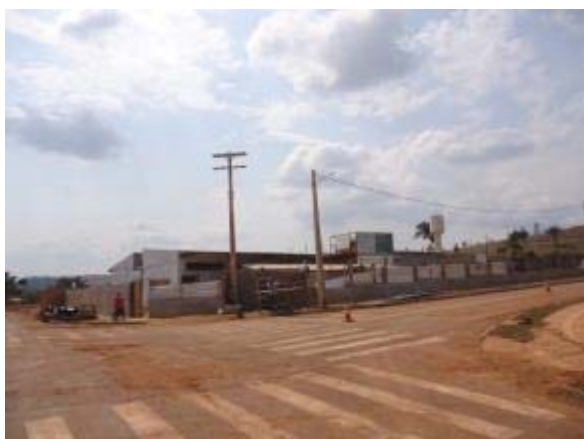
Figura 9 – Fachada frontal – Instalação do gradil metálico.