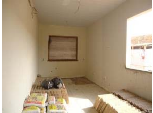
Fachada 36 – Fraldário – Assentamento do piso, do forro de pvc e pintura.