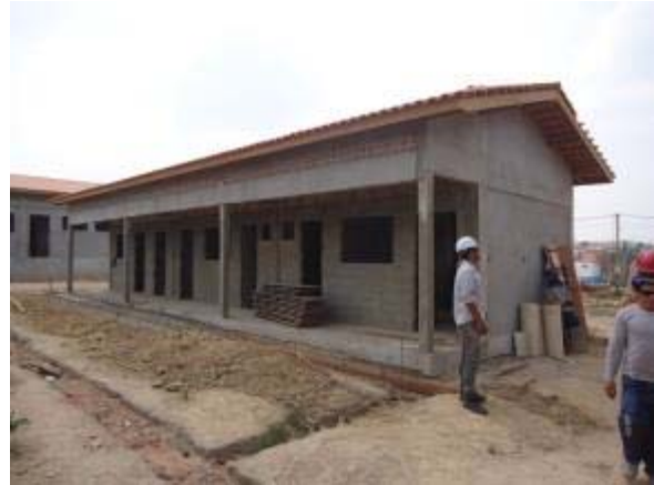
Figura 66 – Bloco administrativo – Concretagem das canaletas de drenagem e instalação dos portais de madeira das portas.