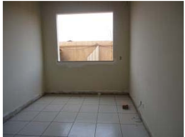
Figura 38 – Sala diretoria – Assentamento das cerâmicas de piso, peitoril e soleira.