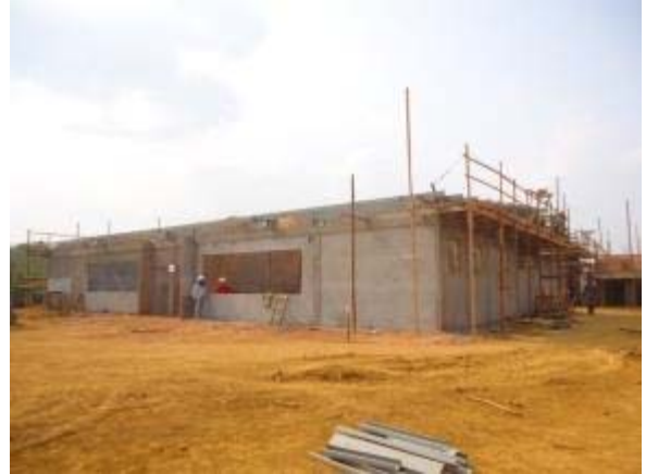
Figura 26 – Salas de apoio – Montagem da estrutura da cobertura, reboco e instalação da rede elétrica.