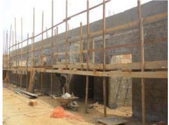
Figura 20 – Bloco Cozinha e Sanitários – Execução de chapisco e instalações hidráulicas.