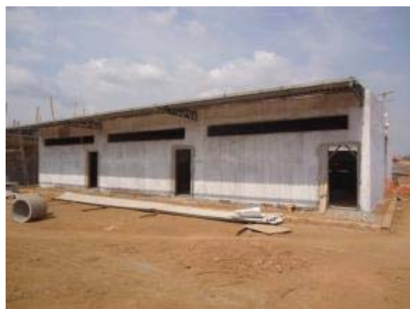
Figura 10 – Salas de aula – Pintura, execução dos requadros das esquadrias e demarcação da passarela de acesso às salas.