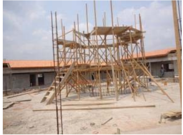
Figura 60 – Recreio Coberto – Armação dos pilares para implantação da cobertura.