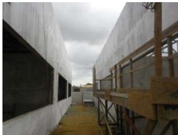
Figura 2 – Salas de Aula – Pintura, instalação da cobertura metálica e instalações elétricas.