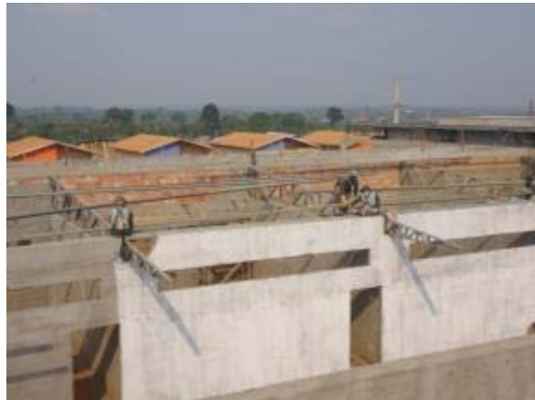
Figura 50 – Salas de aula – Montagem da cobertura e pintura.