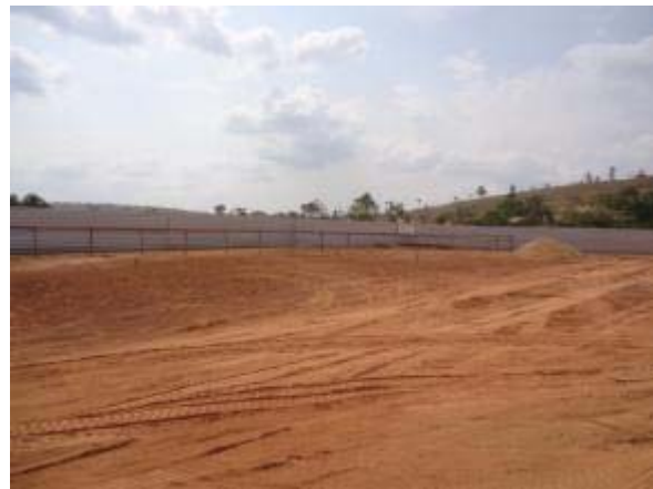
Figura 16 – Quadra poliesportiva – Demarcação da área para implantação da quadra.