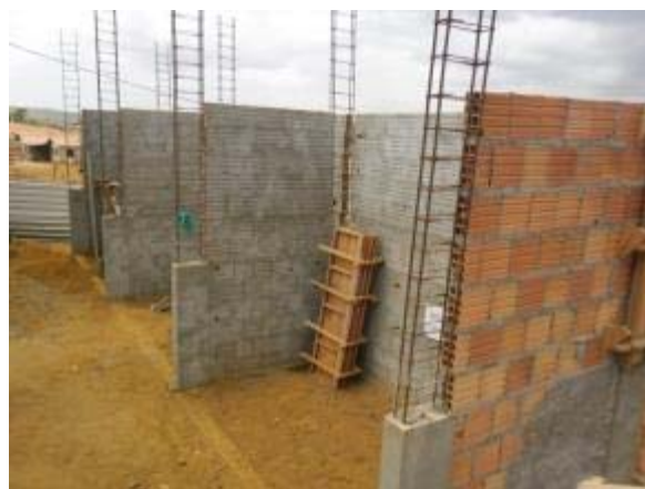
Figura 6 – Bloco de serviços – Armação dos