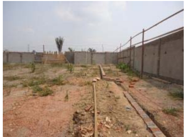
Figura 62 – Estacionamento – Execução da fundação tipo baldrame.