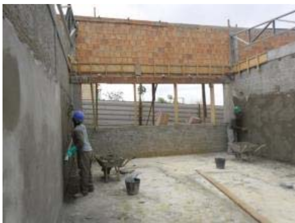
Figura 7 – Salas secundárias – Reboco e montagem da cobertura