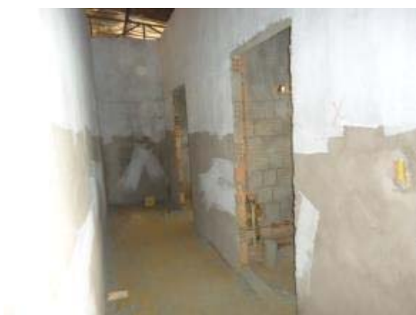
Figura 45 – Sanitários coletivos – Pintura e instalação da rede hidráulica.