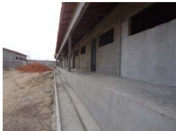
Figura 58 – Salas de aula – Reboco externo, instalação dos portais de madeira das portas e instalação da rede elétrica e drenagem.