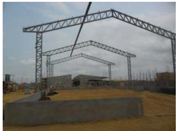
Figura 24 – Quadra poliesportiva – Instalação da estrutura metálica da cobertura.