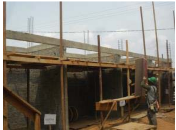
Figura 22 – Bloco de serviços – Armação dos pilares e execução de alvenaria.