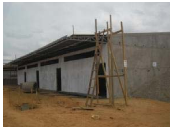
Figura 18 – Salas de aula – Pintura interna e externa, instalação da manta termo acústica e