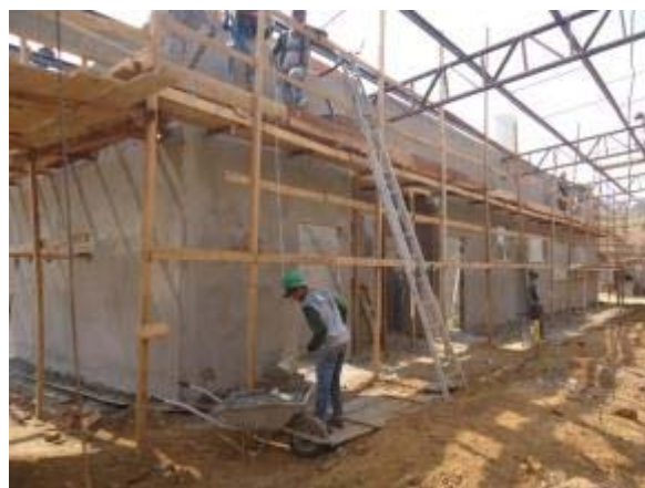
Figura 12 – Bloco Cozinha – Montagem da cobertura, execução de alvenaria e reboco.