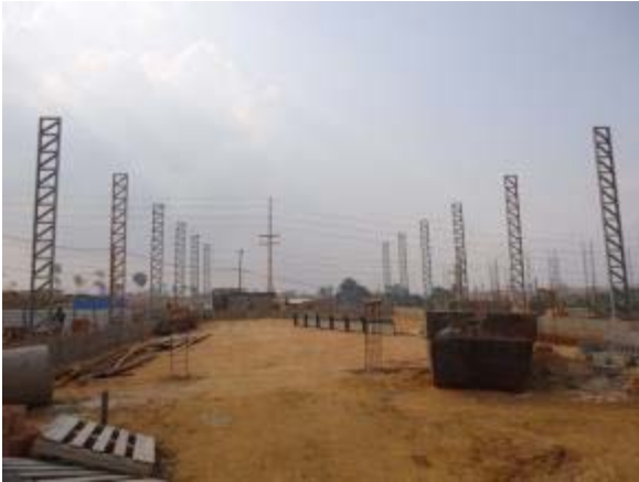
Figura 47 – Quadra poliesportiva – Montagem da estrutura metálica da cabertira.