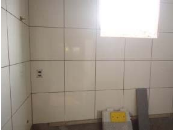
Figura 35 – Vestiário PNE – Assentamento da cerâmica de parede e instalação dos acabamentos elétricos.