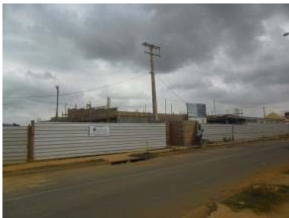
Figura 1 – Fachada frontal - Chapisco e reboco do muro de divisa da edificação.