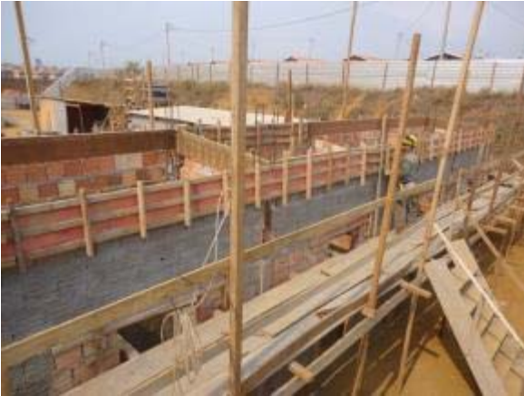
Figura 29 – Bloco de serviços – Armação e montagem das formas para concretagem da viga de amarração.