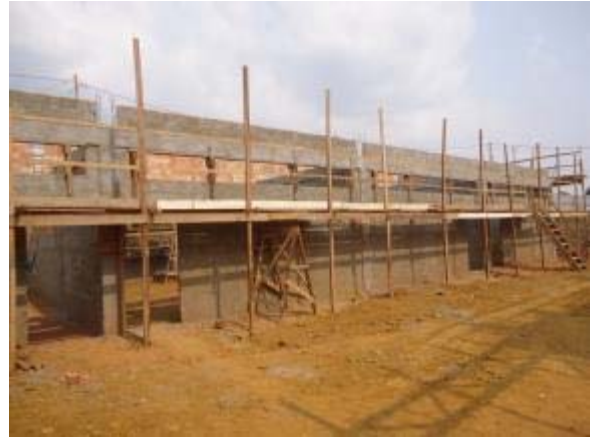
Figura 30 – Salas secundárias – Chapisco e reboco interno e externo dos ambientes.