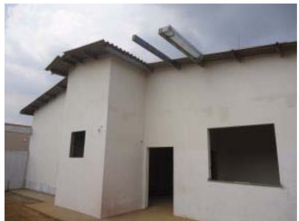
Figura 34 – Fachada posterior – Pintura das fachadas.