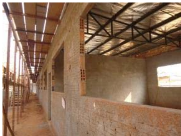
Figura 42 – Salas de aula – Instalação da telhas e manta da cobertura, reboco interno e externo, compactação e concretagem do contrapiso.