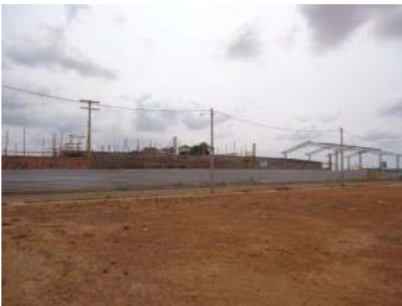
Figura 17 – Fachada frontal – Reboco do muro de divisa da obra e escavação das