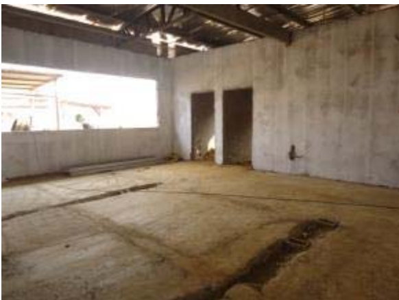
Figura 51 – Salas de apoio – Pintura, finalização da instalação da cobertura e execução do contrapiso.