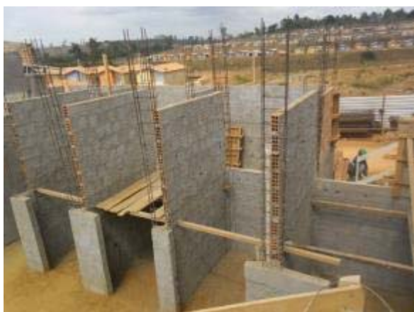
Figura 5 – Banheiros individuais – Armação