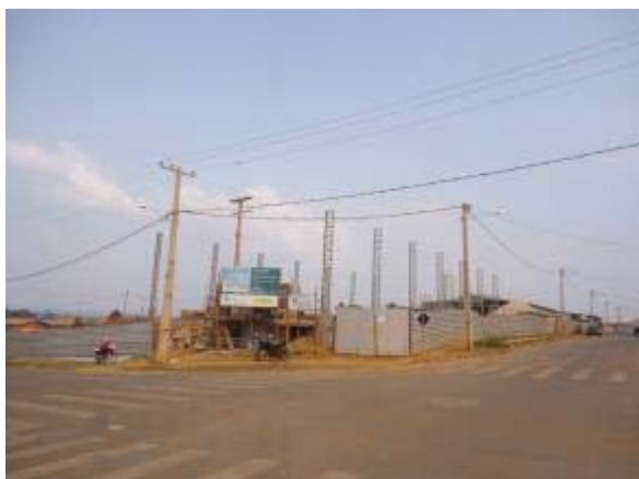
Figura 41 – Fachada frontal – Reboco do muro de divisa da edificação.