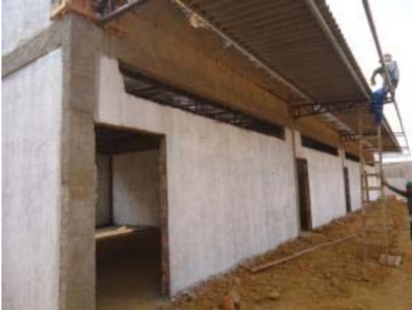
Figura 25 – Salas de Aula – Pintura, instalação das telhas e mantas da cobertura.