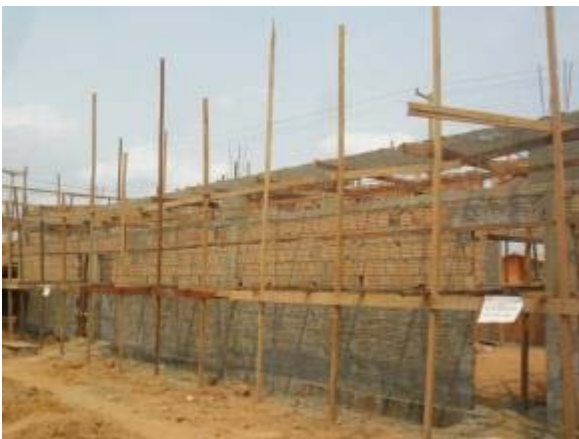
Figura 23 – Salas secundárias – Chapisco interno e externo, execução da alvenaria de fechamento da cobertura e instalações elétricas.