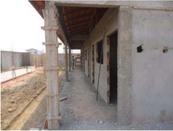
Figura 59 – Bloco administrativo – Desforma dos pilares, reboco externo e interno e escavação da vala de drenagem.