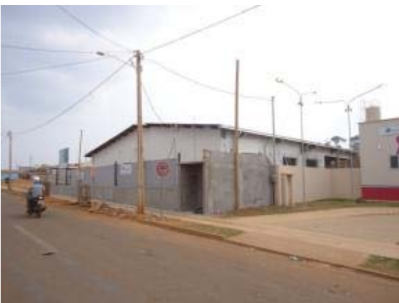
Figura 33 – Fachada frontal -