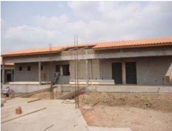
Figura 61 – Bloco de serviços – Execução da rampa de acesso e concretagem da canaleta de drenagem.