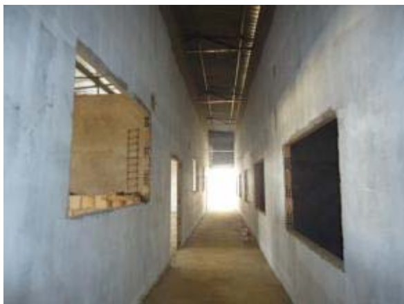
Figura 43 – Salas de apoio e Salas Secundárias – Pintura interna e externa, instalações da rede hidráulica e execução da alvenaria de fechamento.