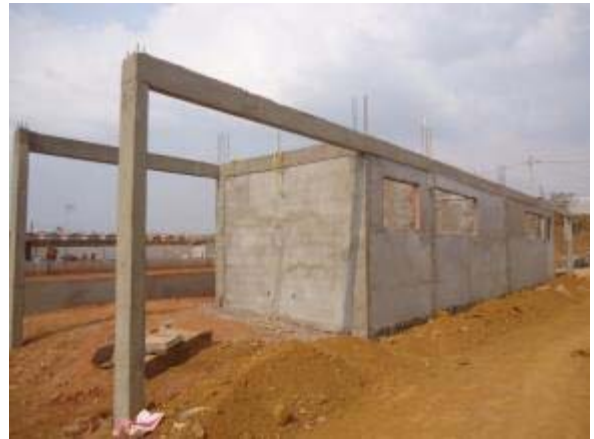
Figura 32 – Vestiários – Reboco externo e interno.