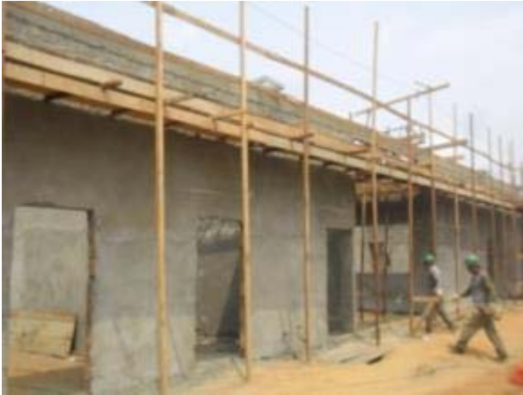
Figura 19 – Salas de apoio – Montagem da cobertura e reboco interno e externo.