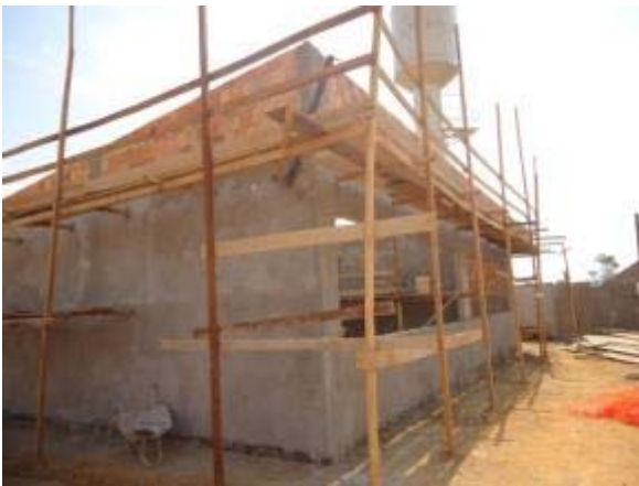
Figura 15 – Salas secundárias – Chapisco e reboco interno e externo.