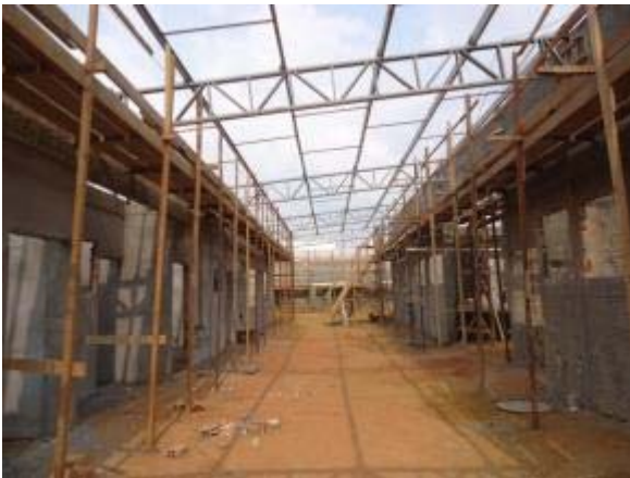
Figura 27 – Bloco cozinha e Sanitários – Execução da alvenaria de fechamento, chapisco, reboco e instalações elétricas e hidráulicas.