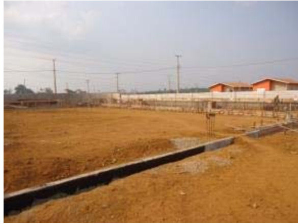
Figura 54 – Quadra poliesportiva – Concretagem da viga baldrame de fundação e sua impermeabilização.