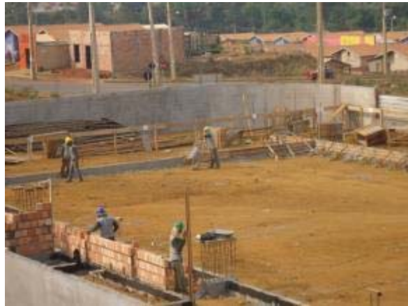
Figura 56 – Vestiário e Quadra poliesportiva – Execução de alvenaria e armação dos pilares dos vestiários e concretagem da fundação da quadra.