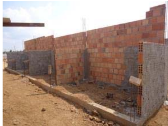
Figura 14 – Bloco de serviços - Execução de alvenaria, chapisco, reboco e armação dos pilares.