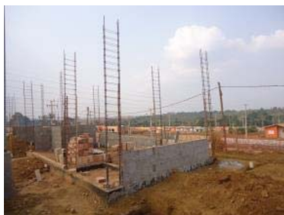
Figura 46 – Vestiários – Armação dos pilares, execução da alvenaria, chapisco e instalação da rede hidráulica.