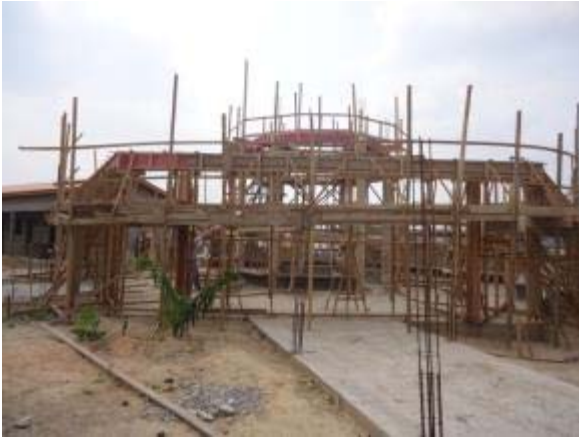
Figura 65 – Recreio coberto – Concretagem dos pilares, montagem das formas das vigas de cintamento e montagem da estrutura.