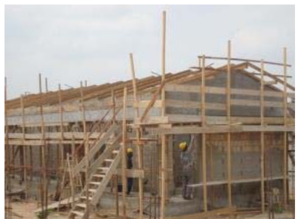
Figura 64 – Bloco de serviços – Montagem da estrutura de cobertura, chapisco e reboco externo e concretagem dos pilares.