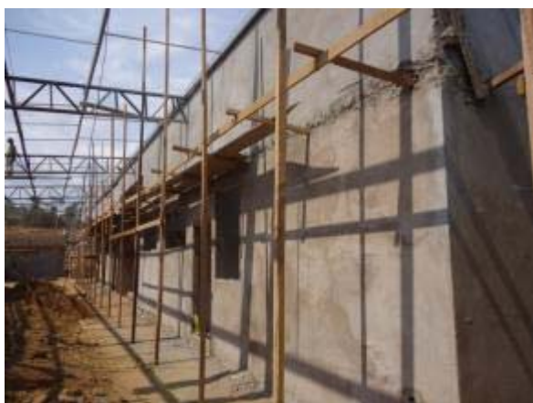
Figura 11 – Salas de apoio – Instalação da cobertura, reboco externo e instalações