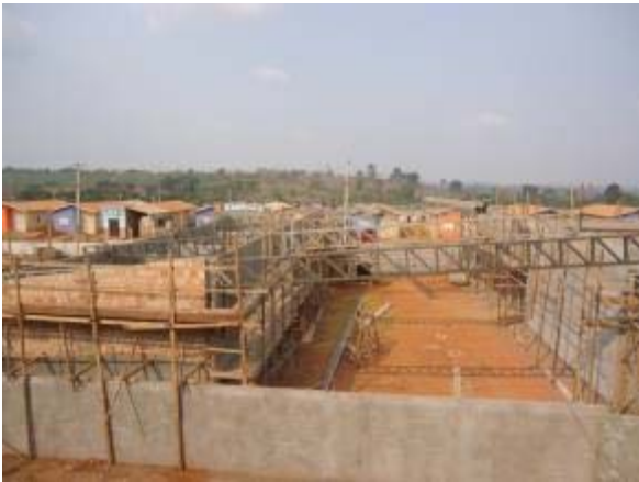
Figura 55 – Pátio coberto – Montagem da cobertura metálica.