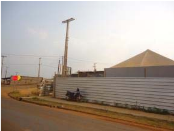
Figura 49 – Fachada Frontal – Reboco e concretagem dos pilares do muro de divisa.