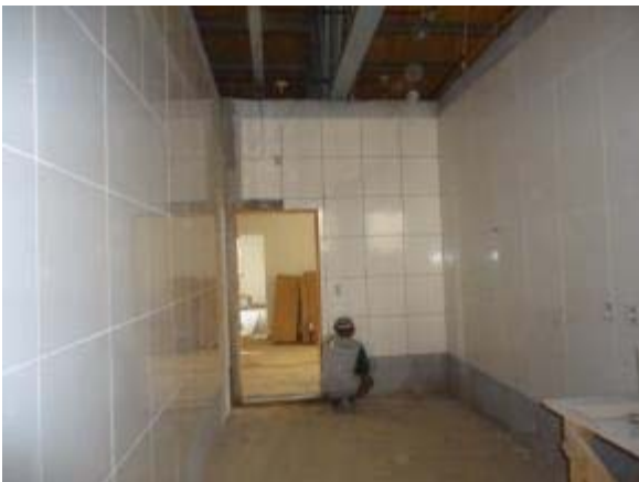
Figura 39 – Cozinha – Assentamento da cerâmica de parede e acabamentos elétricos.