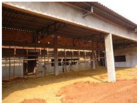
Figura 44 – Pátio Coberto – Aterro e compactação do solo para execução do contrapiso.