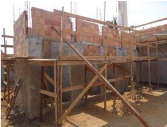
Figura 13 – Banheiros individuais – Execução de alvenaria, chapisco, reboco e armação dos pilares.