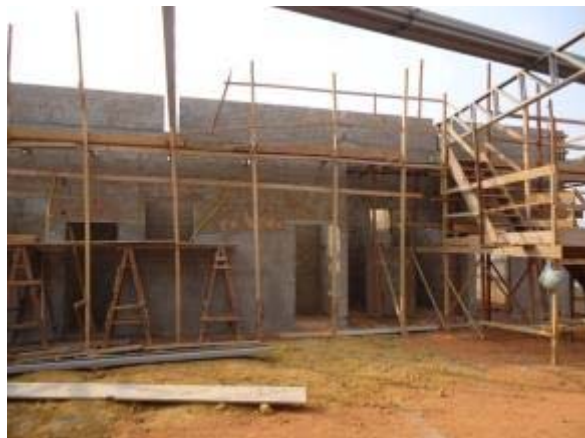
Figura 52 – Bloco cozinha e sanitários – Montagem da cobertura e reboco.