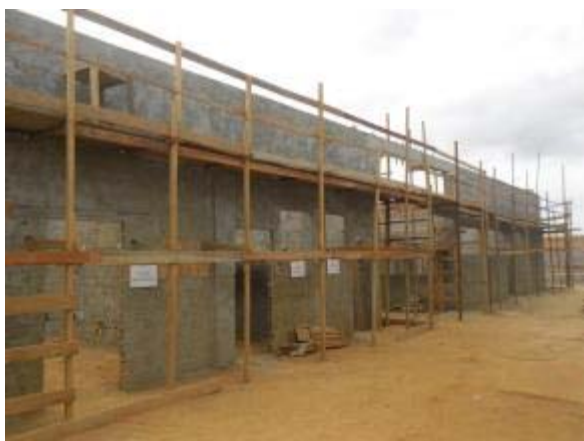
Figura 3 – Salas de apoio – Concretagem das vigas, chapisco interno e externo.