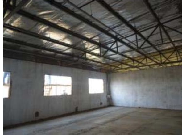
Figura 48 – Salas secundárias – Pintura interna e externa.