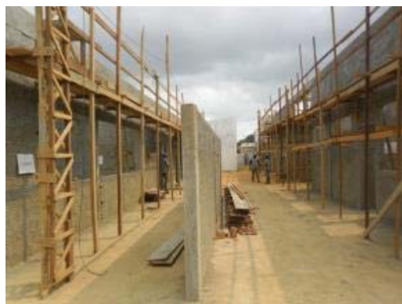
Figura 4 – Bloco Cozinha e Sanitários – Instalação da rede hidráulica e chapisco.