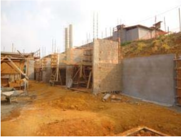
Figura 53 – Bloco de serviços – Armação e montagem das formas para concretagem dos pilares.