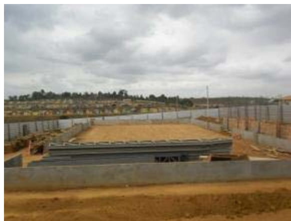
Figura 8 – Quadra poliesportiva – Início da montagem da cobertura.