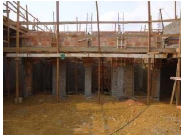
Figura 28 – Banheiros individuais – Armação e montagem das formas para concretagem dos pilares.