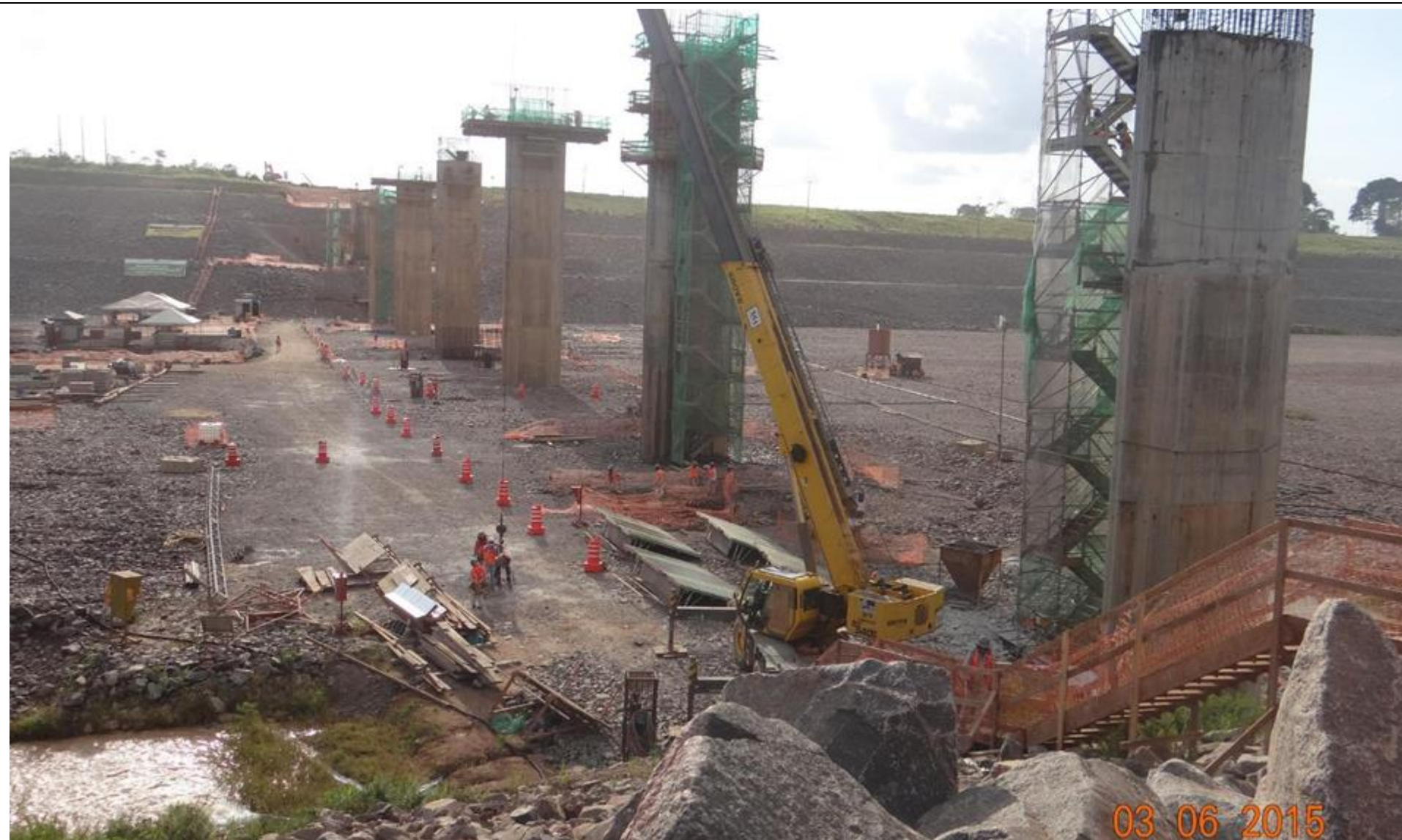
Figura 2 - Construção dos pilares para a ponte sobre o Canal de Derivação – ligação Travessão 27