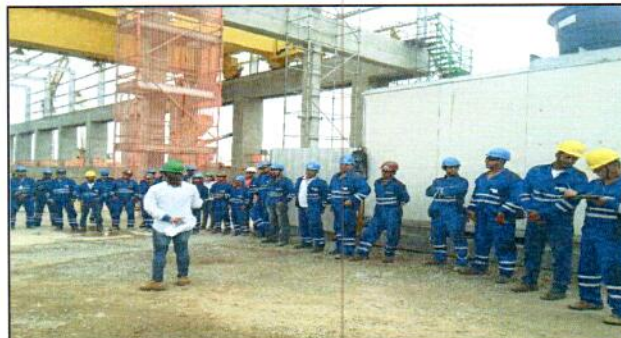
3.0 Os colaboradores da casa de força participaram atentante do tema abordado.