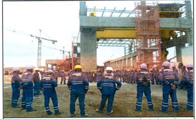
2.0 O tema abordado foi sobre resíduos gerados nas frente de serviço