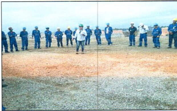
1.0 Em cumprimento ao PBA-Projeto Básico Ambiental, o PEAT-Programa de educação Ambiental para os Trabalhadores foi realizado palestra de educação ambiental.