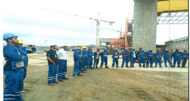
4.0 Todas as equipes da casa de força participaram da palestra.