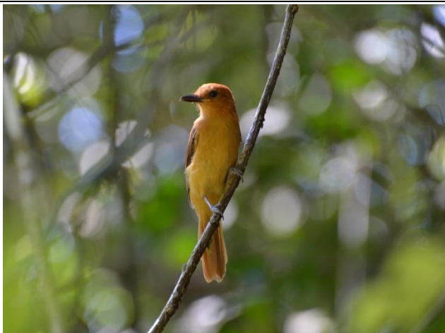
Figura - 44 – Attila cinnamomeus (Tinguaçu-ferrugem).