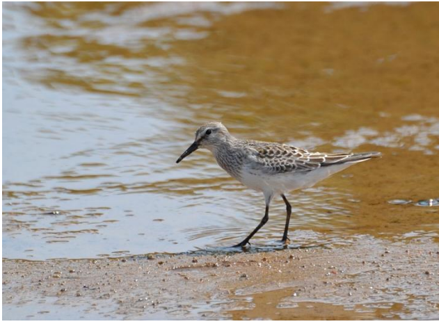
Figura - 25 – Calidris fuscicollis (Maçarico-de-sobre-branco).