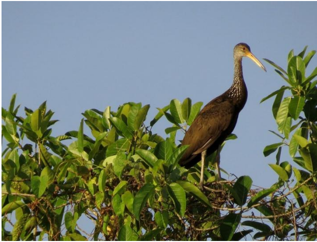
Figura - 19 – Aramus guarauna (Carão).