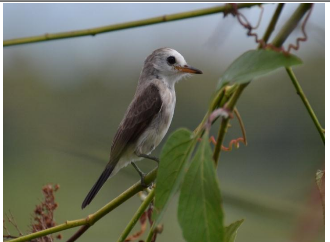
Figura - 45 – Arundinicola leucocephala (Freirinha).