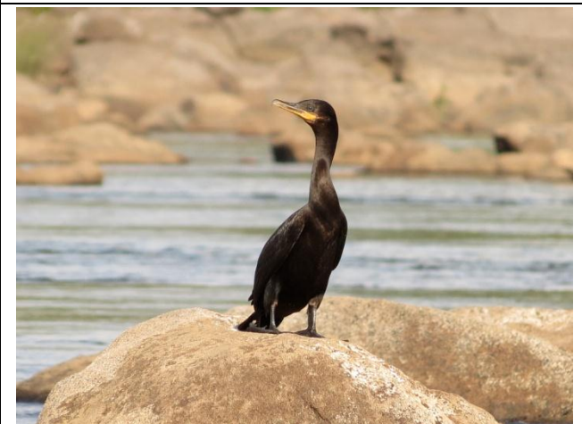
Figura - 4 – Phalacrocorax brasilianus (Biguá).