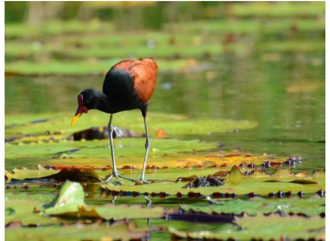
Figura - 26 – Jacana jacana (Jaçanã).