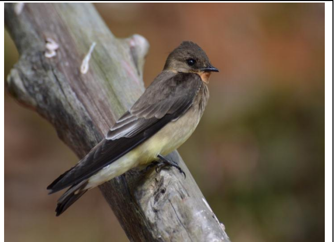
Figura - 49 – Stelgidopteryx ruficollis (Andorinha-serradora).