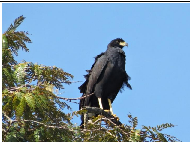
Figura - 34 – Urubitinga urubitinga (Gavião-preto).