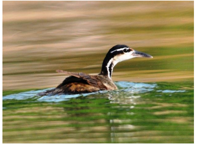
Figura - 20 – Heliornis fulica (Picaparra).