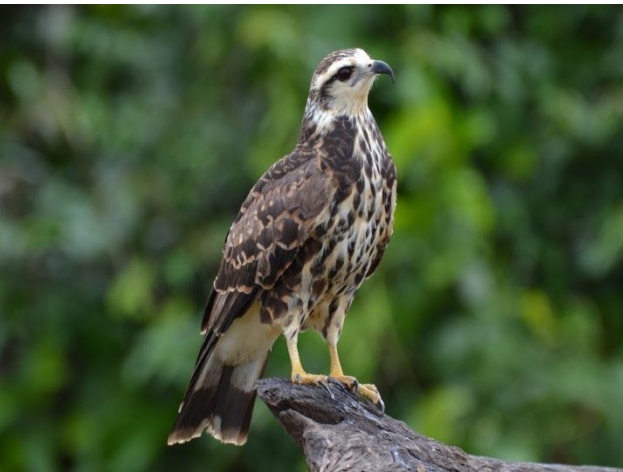
Figura - 17 – Rostrhamus sociabilis (Gavião-caramujeiro).