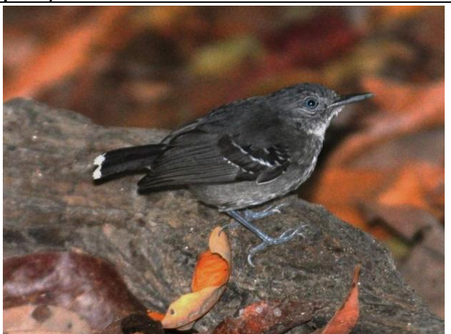
Figura - 39 – Hypocnemoides maculicauda (Solta-asa).