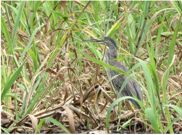
Figura - 7 – Butorides striata (Socozinho).