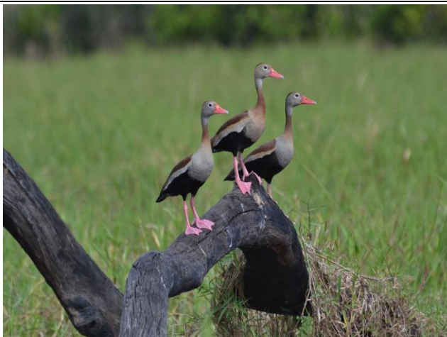
Figura - 1 – Dendrocygna autumnalis (Asa-branca).