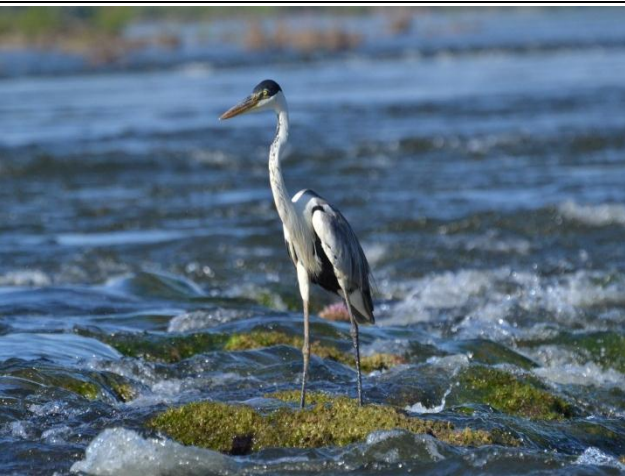
Figura - 9 – Ardea cocoi (Garça-moura).