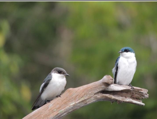
Figura - 48 – Tachycineta albiventer (Andorinha do rio).