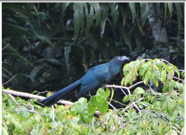
Figura - 38 – Crotophaga major (Anu-coroca).