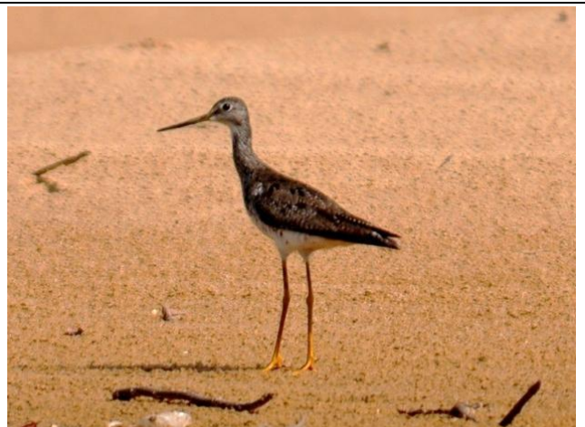
Figura - 24 – Tringa flavipes (Maçarico-de-perna-amarela).