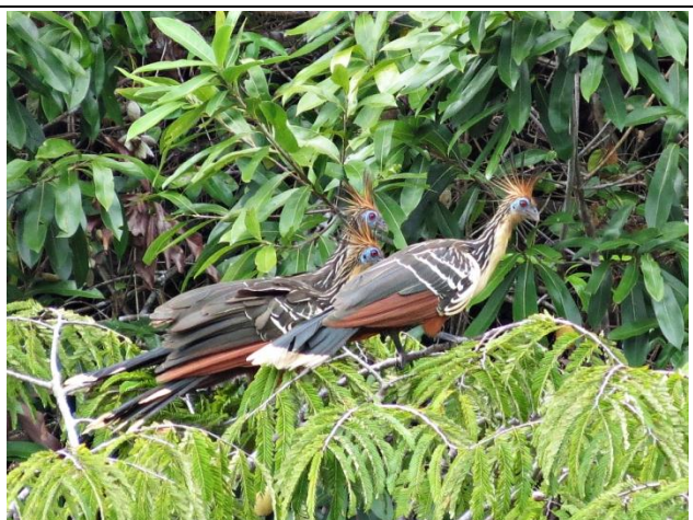
Figura - 36 – Opisthocomus hoazin (Cigana).