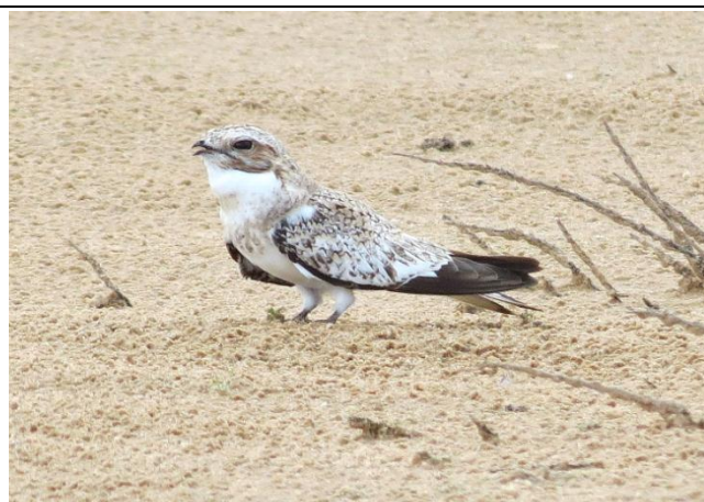
Figura - 37 – Chordeiles rupestris (Bacurau-da-prata).