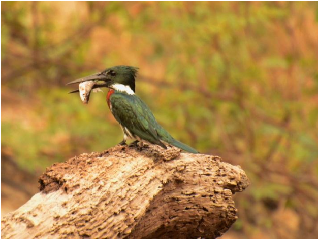
Figura - 31 – Chloroceryle amazona (Martim-pescador-verde).