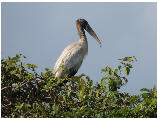
Figura - 3 – Jovem de Mycteria americana (Cabeça-seca).