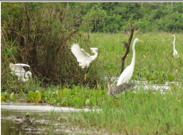
Figura - 11 – Ardea alba (Garça-branca-grande), Egretta thula (Garça-branca-pequena) e Butorides striata (Socozinho)