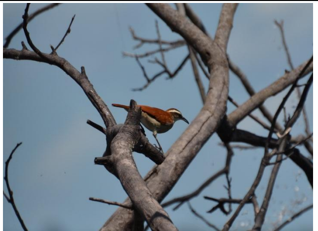
Figura - 43– Furnarius figulus (Casaca-de-couro-da-lama).