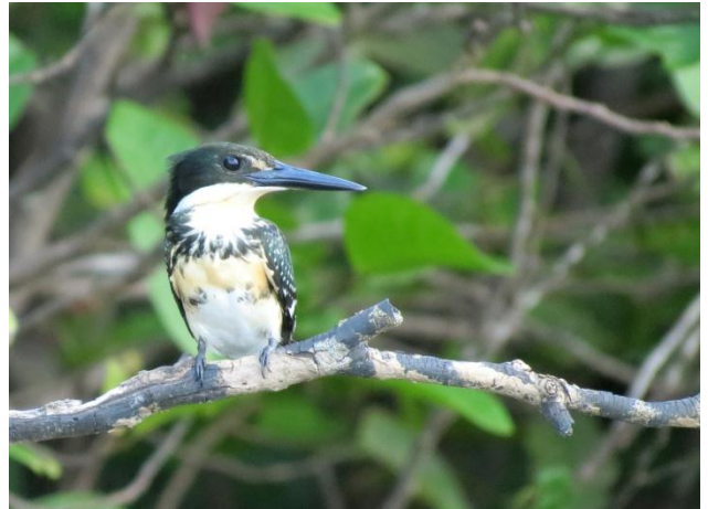
Figura - 32 – Chloroceryle americana (Martim-pescador-pequeno).