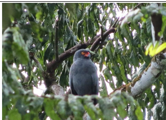
Figura - 35 – Buteogallus schistaceus (Gavião-azul).