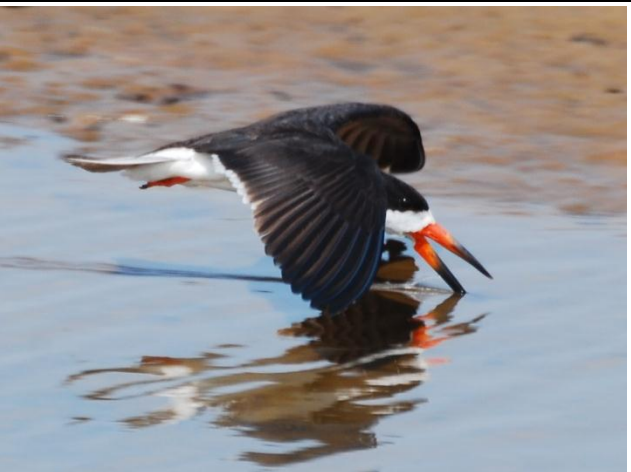
Figura - 29 – Rynchops niger (Talha-mar).