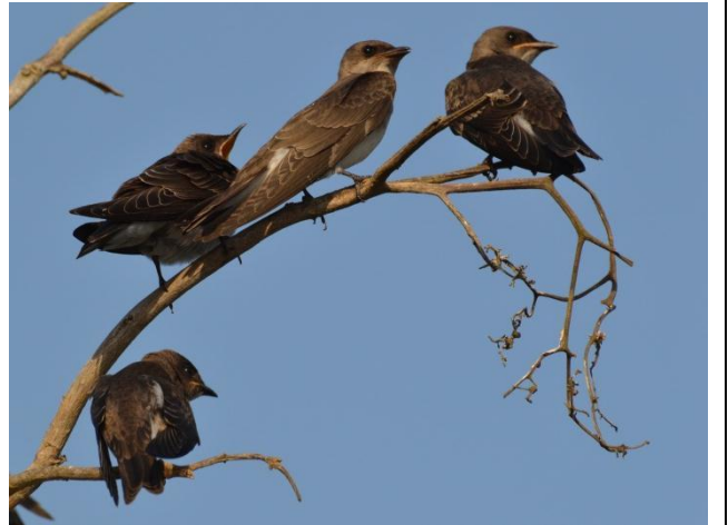
Figura - 47 – Jovens de Progne tapera (Andorinha-do-campo).