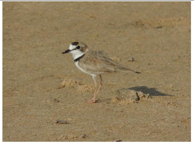
Figura - 22 – Charadrius collaris (Batuíra-de-coleira).