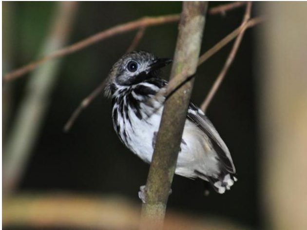
Figura - 40 – Hylophylax punctulatus (Guarda-várzea).