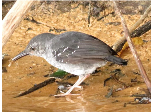
Figura - 41 – Sclateria naevia (Papa-formigado-igarapé).