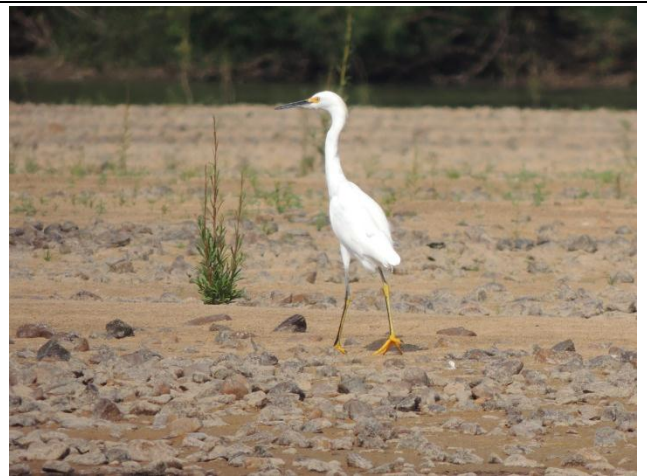
Figura - 10 – Egretta thula (Garça-branca-pequena).