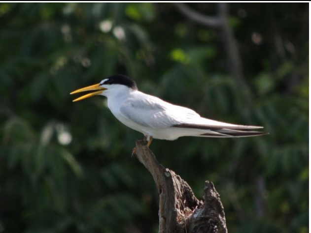
Figura - 27 – Sternula superciliaris (Trinta-réis-anão).