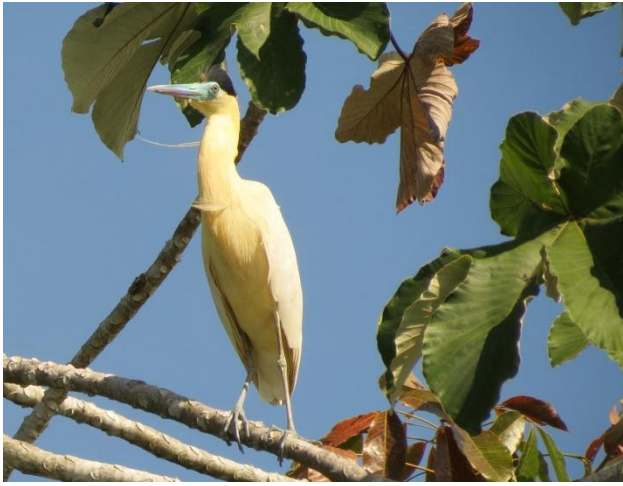
Figura - 13 – Pilherodius pileatus (Garça-real).