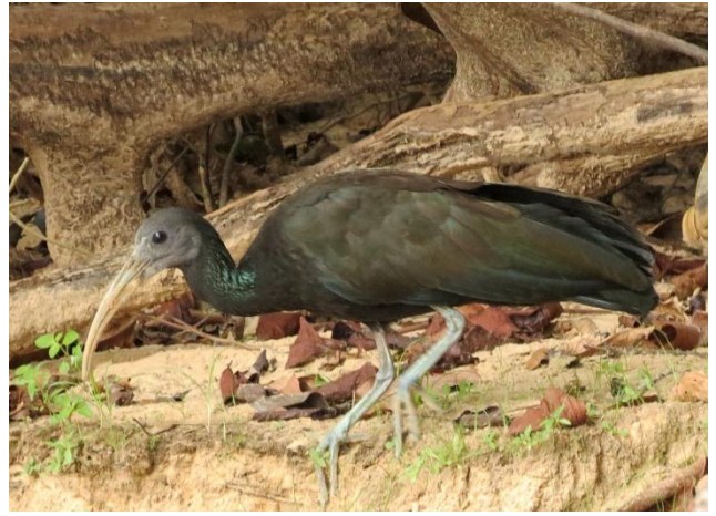
Figura - 14 – Mesembrinibis cayennensis (Coró-coró).