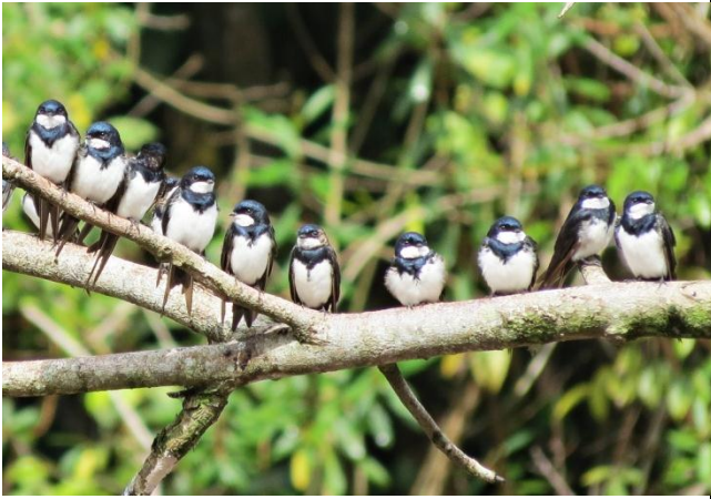
Figura - 46 – Pygochelidon melanoleuca (Andorinha-de-coleira).