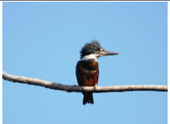
Figura - 30 – Megaceryle torquata (Martim-pescador-grande).