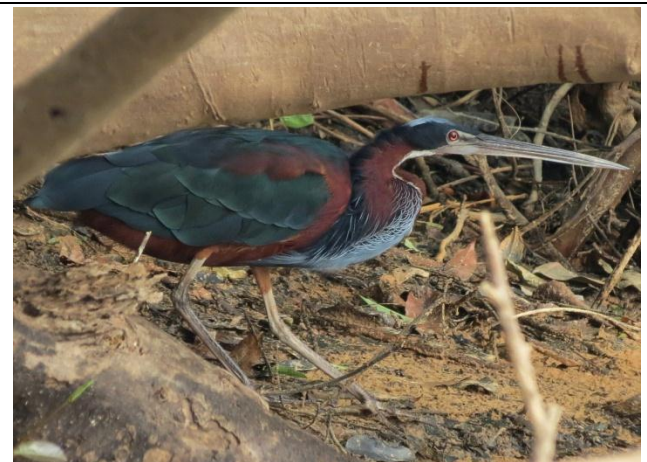
Figura - 12 – Agamia agami (Garça-tricolor).