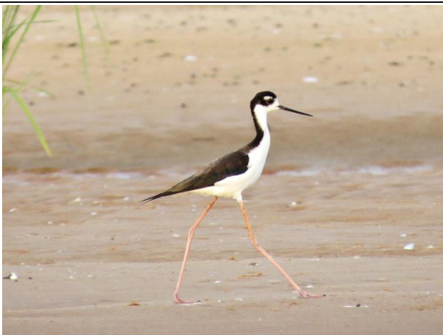
Figura - 23 – Himantopus mexicanus (Pernilongo-de-costas-negras).