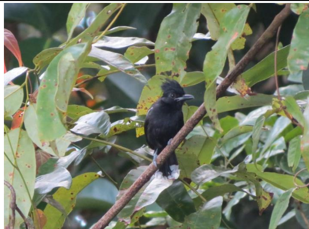
Figura - 42 – Sakesphorus luctuosus (Choca-d'água).