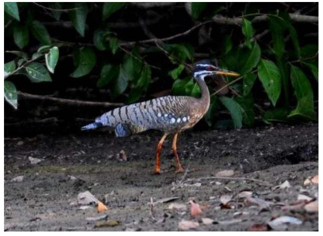
Figura - 18 – Eurypyga helias (Pavãozinho-do-pará).