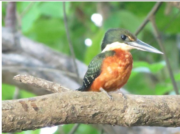
Figura - 33– Chloroceryle aenea (Martinho).