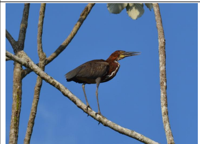
Figura - 6 – Tigrisoma lineatum (Socó-boi).