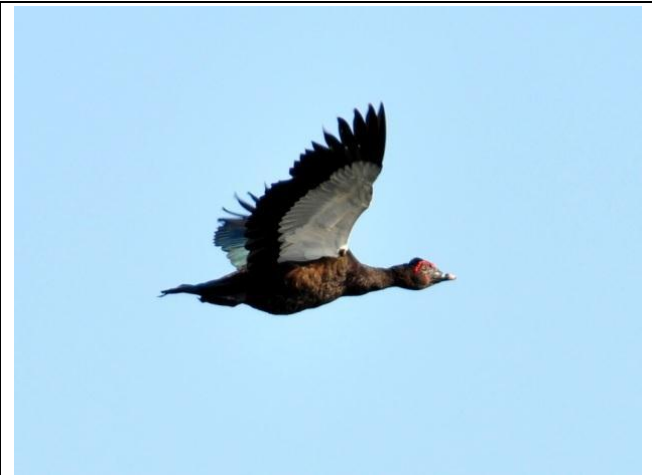
Figura - 2 – Cairina moschata (Pato-do-mato).