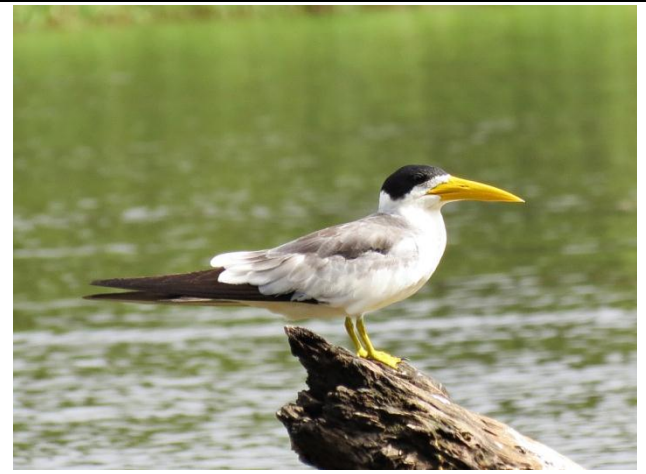
Figura - 28 – Phaetusa simplex (Trinta-réis-grande).