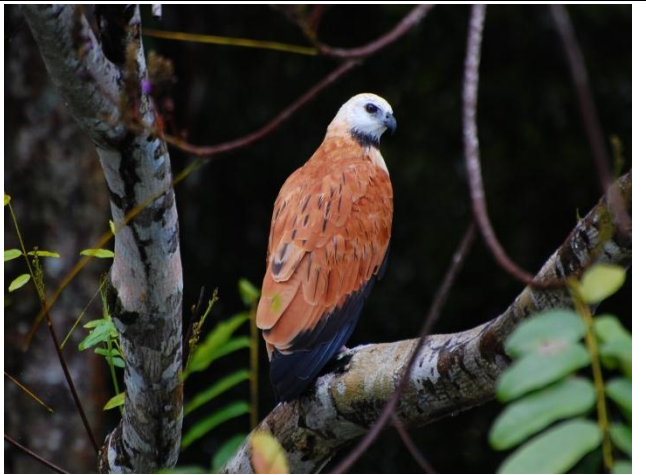
Figura - 16 – Busarellus nigricollis (Gavião-belo).