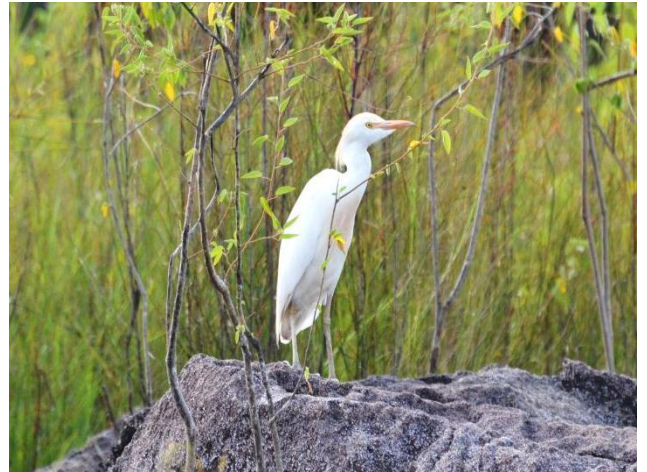
Figura - 8 – Bubulcus ibis (Garça-vaqueira).