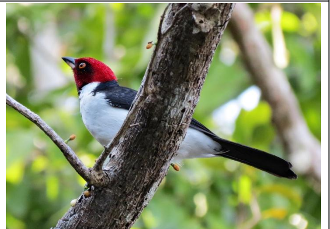
Figura - 51 – Paroaria gularis (Cardeal-da-amazônia).