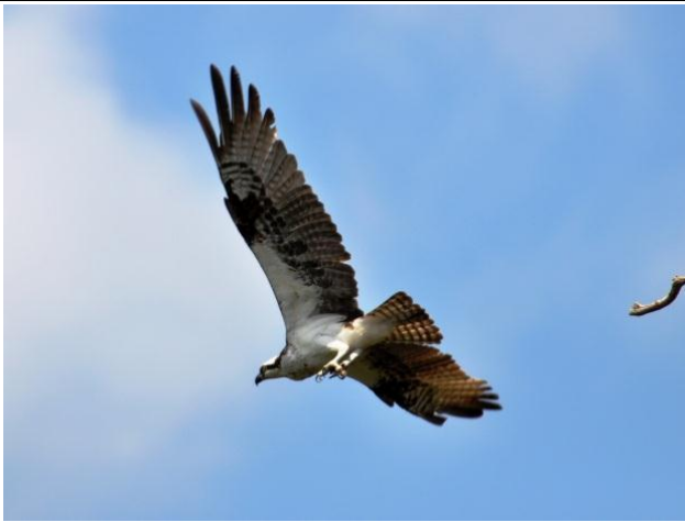
Figura - 15 – Pandion haliaetus (Águia-pescadora).