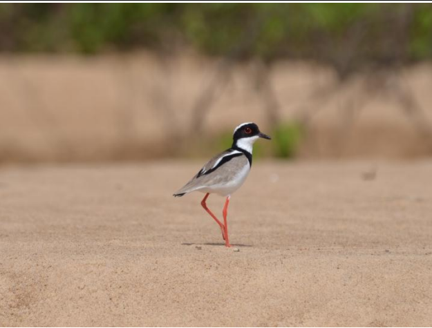
Figura - 21 – Vanellus cayanus (Batuíra-de-esporão).