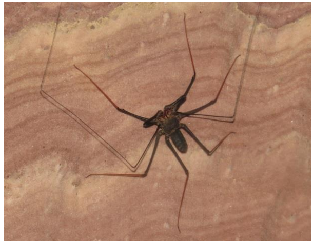
Figura 10 – Amblipígeo na parede no interior da caverna Pedra da Cachoeira.