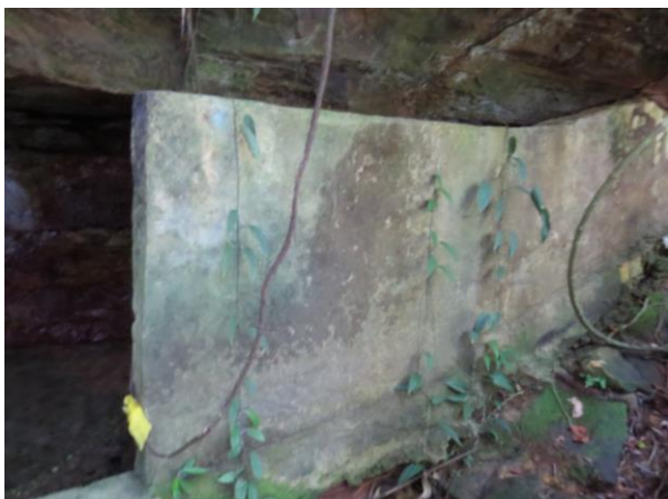
Figura 1 – Entrada da caverna Pedra do Navio.