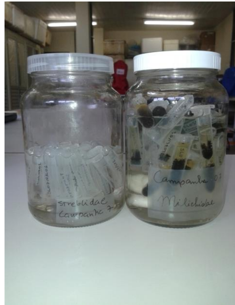
Figura 32 – Curadoria do material para a coleção científica: Streblidae e Milichidae .