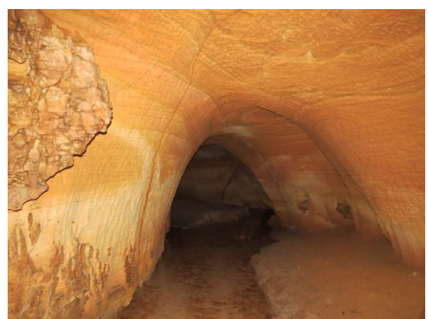
Figura 24 – Córrego no interior da caverna Kararão.