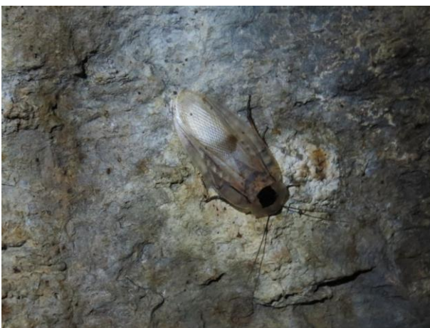
Figura 29 – Blaberus giganteus no interior da caverna Leonardo da Vinci.