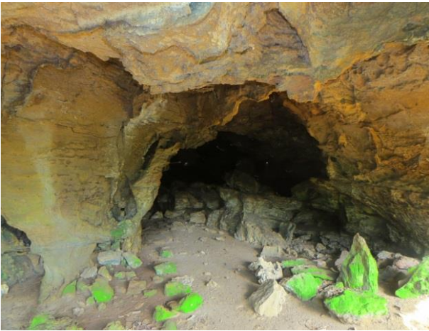
Figura 25 – Entrada da caverna Cama de Vara.