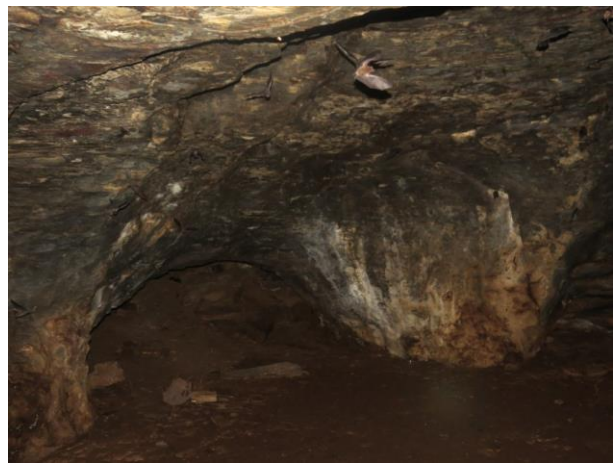
Figura 28 – Paredes e interior da caverna Leonardo da Vinci.