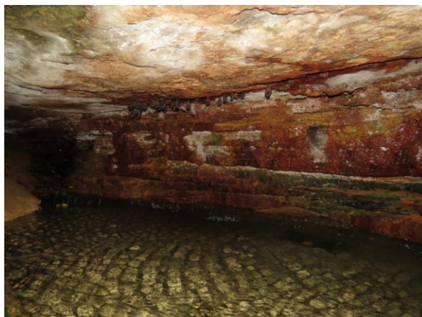
Figura 2 – Interior da caverna Pedra do Navio com morcegos ao fundo.