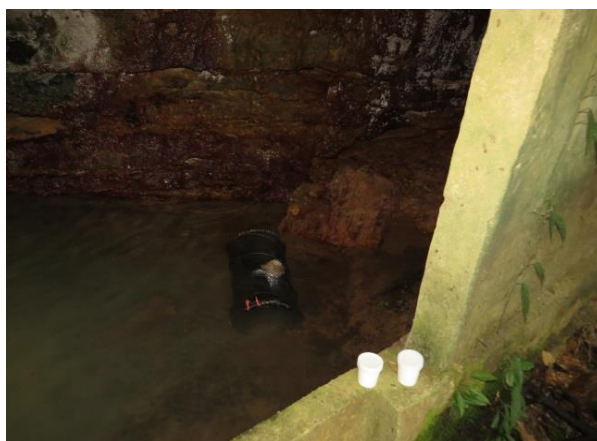
Figura 4 – Armadilha covo no interior da caverna Pedra do Navio.