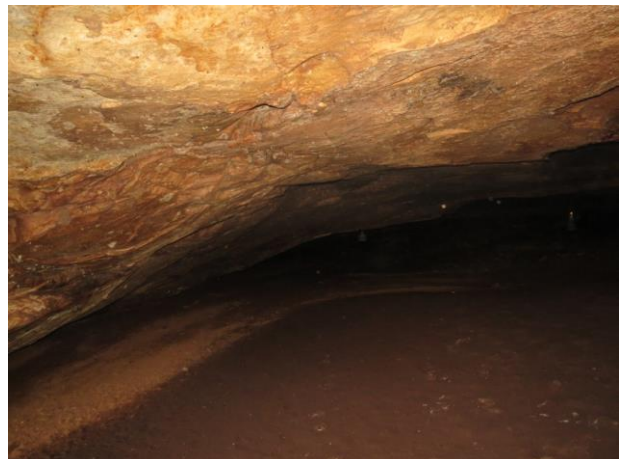
Figura 16 – Paredes no interior da caverna Nova Kararaô.