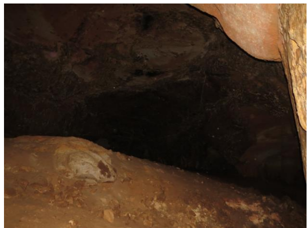
Figura 22 – Interior da caverna Kararão.