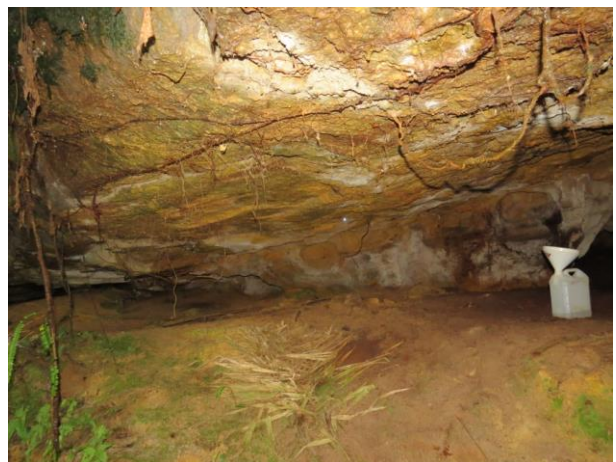
Figura 12 – Entrada do Abrigo do Igarapé.