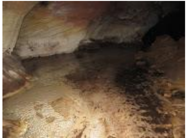
Figura 8 – Córrego no interior da caverna Pedra da Cachoeira.