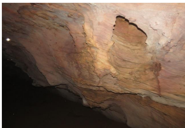
Figura 6 – Paredes no interior da caverna Pedra da Cachoeira.