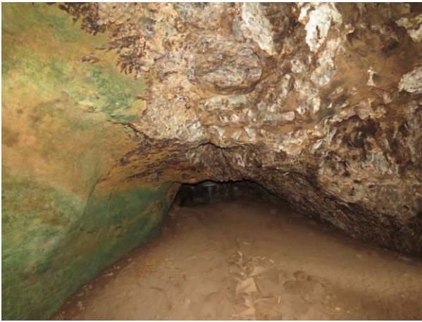
Figura 13 – Entrada do Abrigo do Mangá.