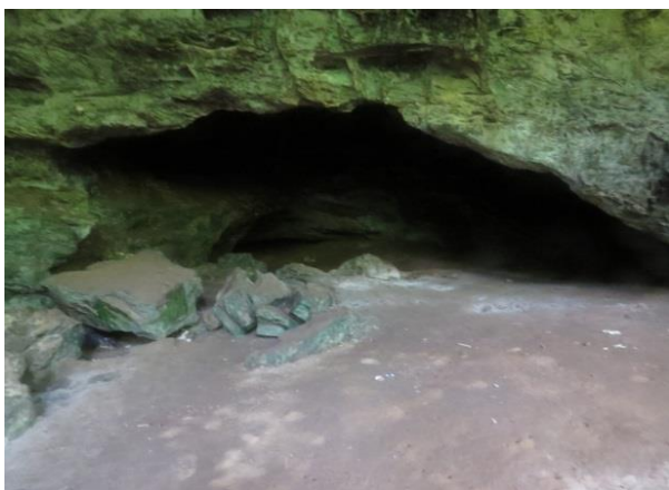
Figura 5 – Entrada da caverna Pedra da Cachoeira.