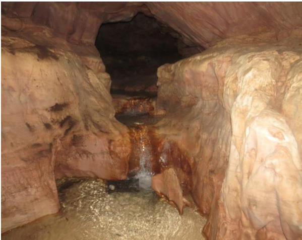
Figura 7 – Córrego no interior da caverna Pedra da Cachoeira.