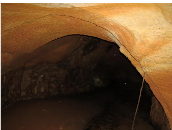
Figura 23 – Interior da caverna Kararão.