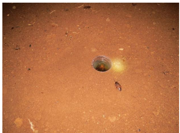
Figura 18 – Armadilha Pitfall no interior da caverna Nova Kararaô.