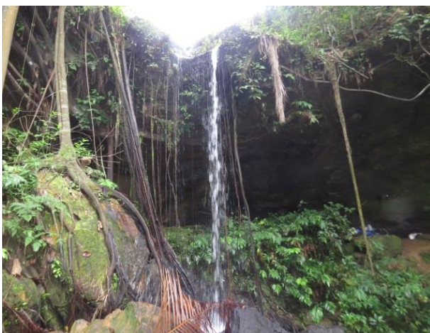
Figura 11 – Cachoeira próxima à entrada do Abrigo do Igarapé.