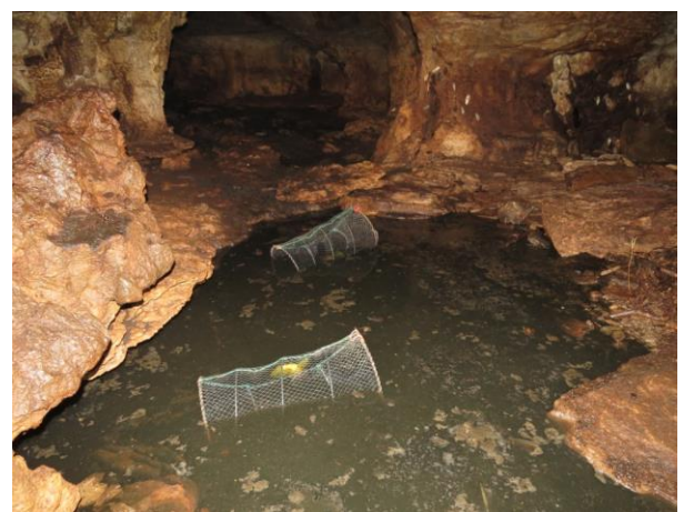
Figura 30 – Armadilha covo na caverna Leonardo da Vinci.