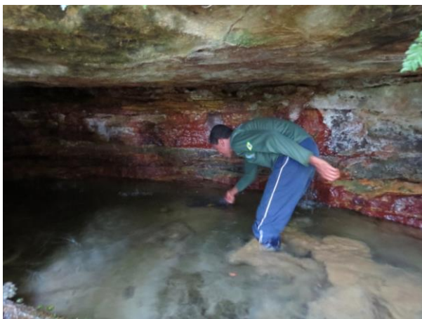
Figura 3 – Coleta por busca ativa no interior da caverna Pedra do Navio.