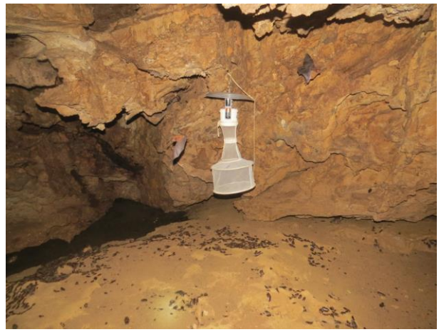
Figura 26 – Armadilha luminosa na caverna Cama de Vara.