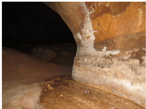
Figura 20 – Córrego no interior da caverna Kararão.