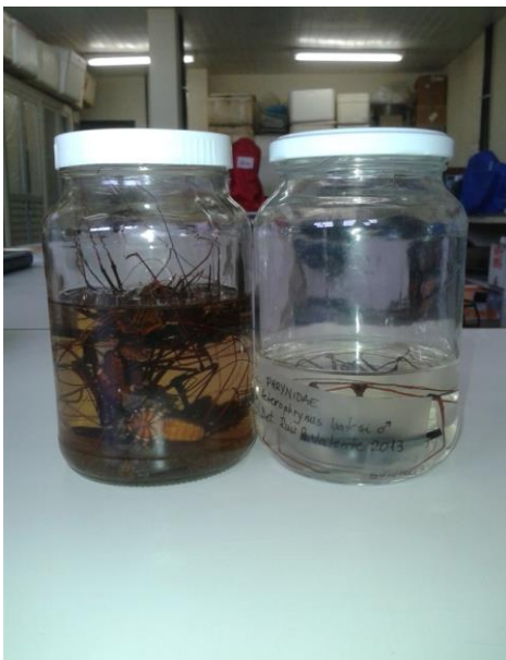
Figura 33 – Curadoria do material para a coleção científica: Amblipígeos .