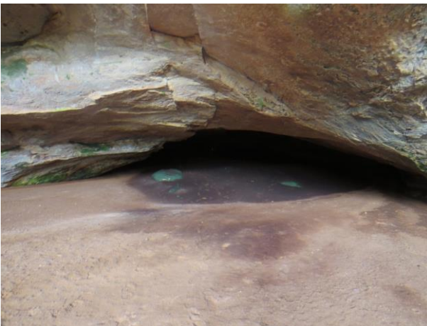
Figura 15 – Entrada da caverna Nova Kararaô.