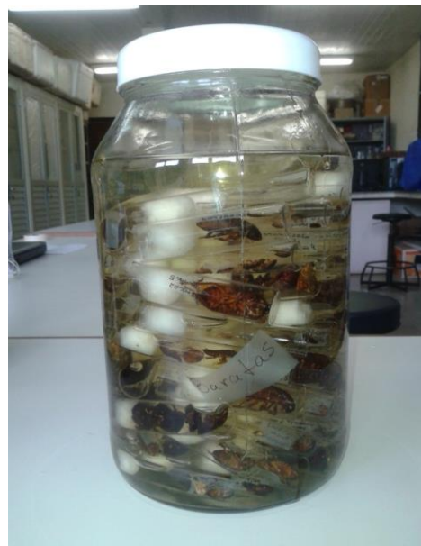
Figura 34 – Curadoria do material para a coleção científica: Baratas .