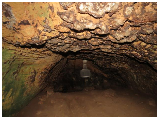
Figura 14 – Interior e paredes do Abrigo do Mangá.