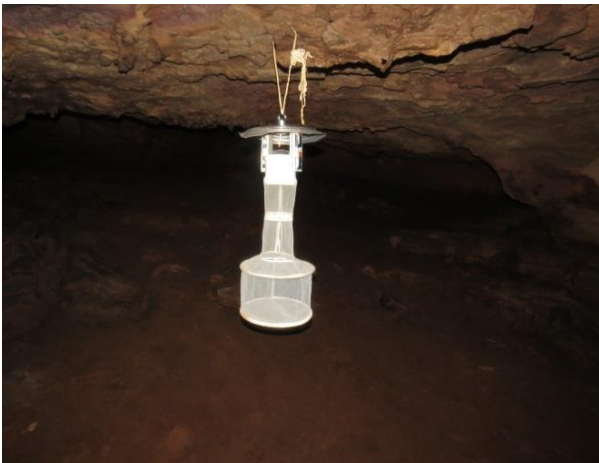
Figura 9 – Armadilha luminosa na caverna Pedra da Cachoeira.