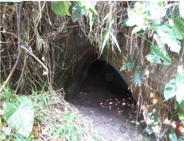
Figura 19 – Entrada da caverna Kararão.