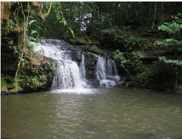
Figura 27 – Cachoeira próximo da entrada da caverna Leonardo da Vinci.