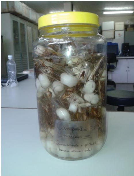
Figura 31 – Curadoria do material para a coleção científica: Endecous .