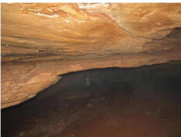
Figura 17 – Interior da caverna Nova Kararaô.