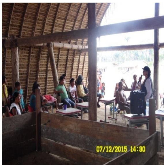
Figura 9.3-1 - Reunião na Tawiwa - 07/12/2015 - Aldeia Ita-aka

A reunião com a comunidade da aldeia Ita-aka realizou-se na casa grande, na tawiwa, onde foi desenvolvida com a explicação detalhada de cada programa sob a responsabilidade da nova empresa executora do PBA-CI, com a participação e perguntas da comunidade.