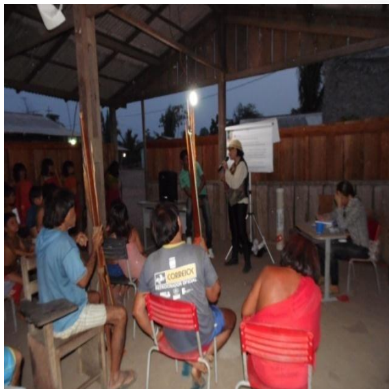
Figura 9.3-27 - Reunião com a comunidade - 10/12/2015 - Aldeia Paratitim