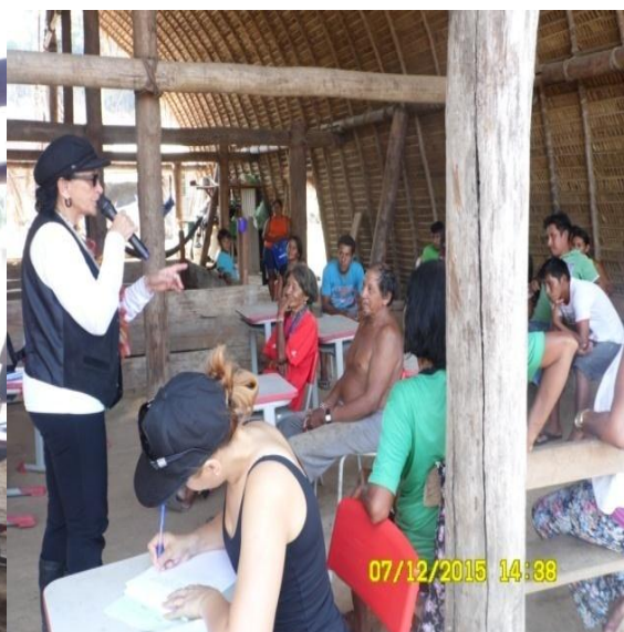
Figura 9.3-2 - Reunião na Tawiwa - 07/12/2015 - Aldeia Ita-aka