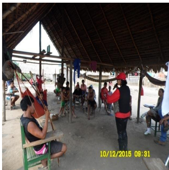
Figura 9.3-21 - Reunião com a comunidade - 10/12/2015 - Aldeia Ta-akati