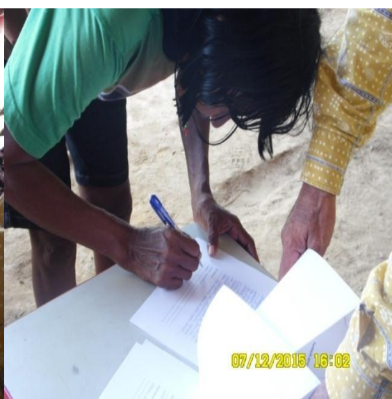
Figura 9.3-4 - Reunião na Tawiwa - 07/12/2015 - Aldeia Ita-aka