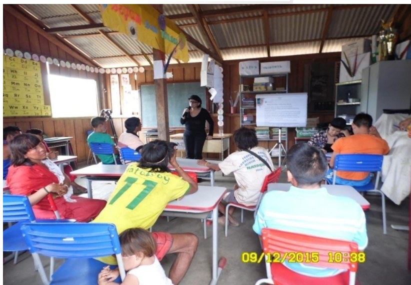
Figura 9.3-16 - Reunião com a comunidade - 09/12/2015 - Aldeia Araditi