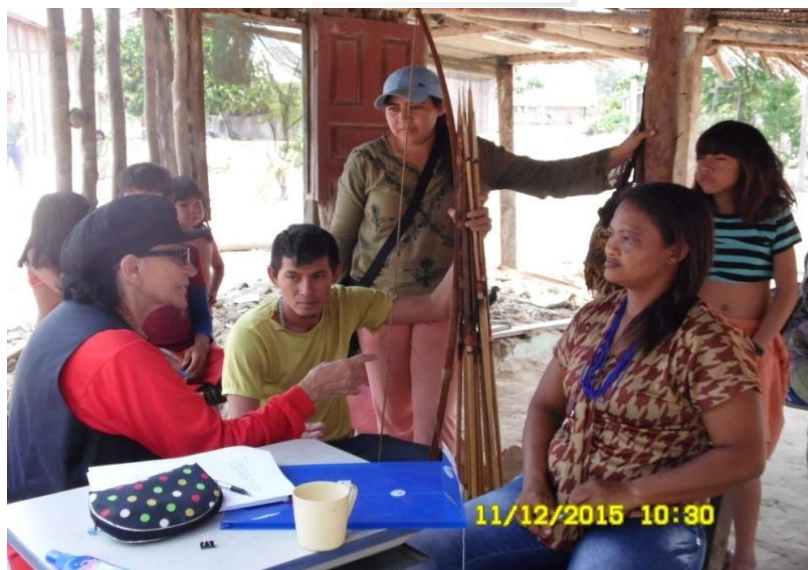
Figura 9.3-30 - Reunião com os professores - 11/12/2015 - Aldeia Juruãti

Na abordagem sobre o Programa de Educação Escolar Indígena – PEEI foi apontada uma questão como preocupante, uma vez que o povo Araweté não tem professores indígenas, qualificados, lembrando que oito iniciaram o curso de magistério, mas apenas um se formou e atua na aldeia Ipixuna.