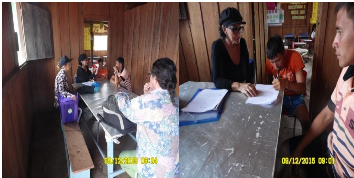
Figura 9.3-14 - Reunião com as lideranças - 09/12/2015 - Aldeia Araditi Figura 9.3-15 - Reunião com as lideranças - 09/12/2015 - Aldeia Araditi