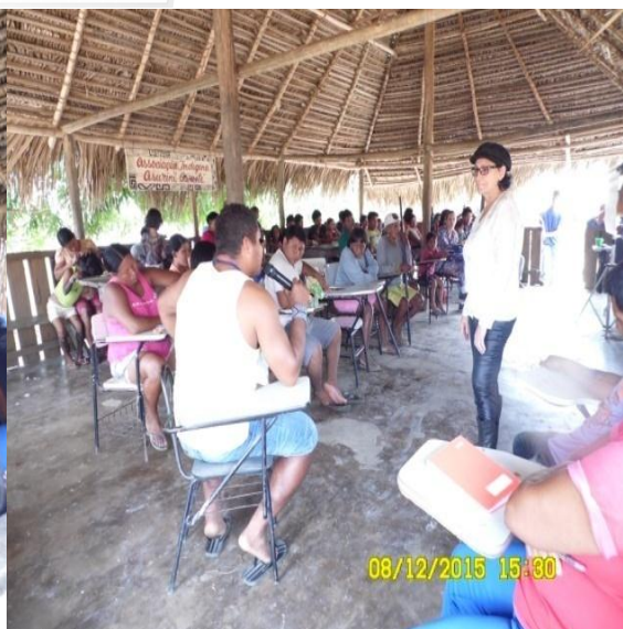
Figura 9.3-9 - Reunião com a comunidade - 08/12/2015 - Aldeia Kwatinemu

Na discussão do PEEI, foi explicado que também poderão participar das capacitações, além dos professores, outros indígenas com magistério e até o grupo que iniciou o processo de formação e não o concluiu.