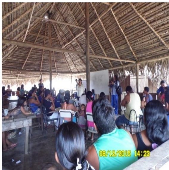
Figura 9.3-8 - Reunião com a comunidade - 08/12/2015 - Aldeia Kwatinemu