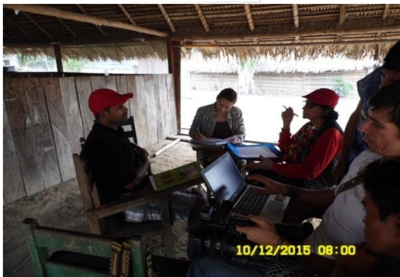
Figura 9.3-20 - Reunião com o professor - 10/12/2015 - Aldeia Ta-akati