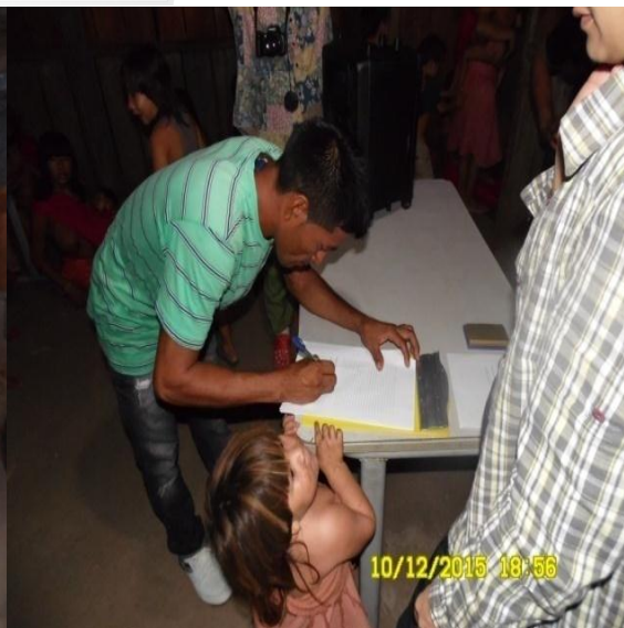
Figura 9.3-28 - Reunião com a comunidade (assinatura da ata) - 10/12/2015 - Aldeia Paratitim