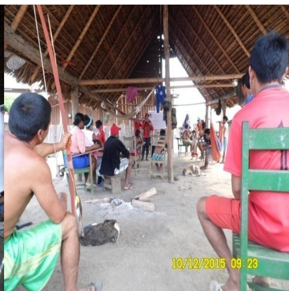
Figura 9.3-22 - Reunião com a comunidade - 10/12/2015 - Aldeia Ta-akati