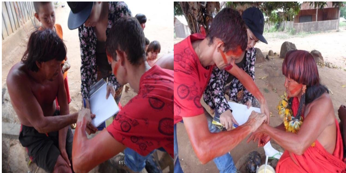
Figura 9.3-34 - Reunião com a comunidade (assinatura da ata) - 12/12/2015 - Aldeia Ipixuna