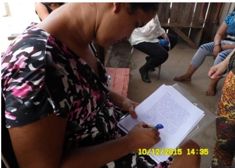
Figura 9.3-26 - Reunião com os professores - 10/12/2015 - Aldeia Paratitim

No início da noite do referido dia, deu-se início à realização de reunião com a comunidade da aldeia Paratitim ( Anexo 9.3-28 – Ata de reunião com a comunidade ). Na referida reunião foram itens de pauta: