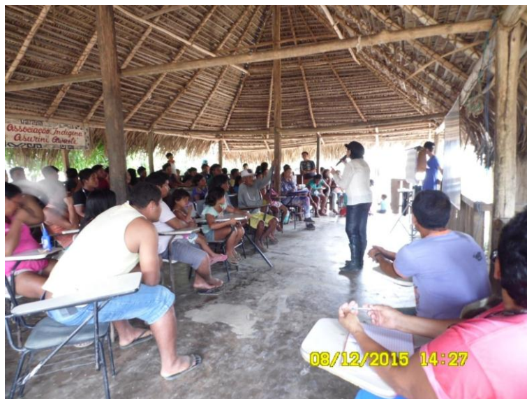
Figura 9.3-7 - Reunião com a comunidade - 08/12/2015 - Aldeia Kwatinemu

A reunião na aldeia Kwatinemu ocorreu no salão da Associação Indígena Asurini Araweté com a empresa executora e toda a comunidade da aldeia Asurini do Kwatinemu para a exposição da dinâmica dos programas do PBA-CI.