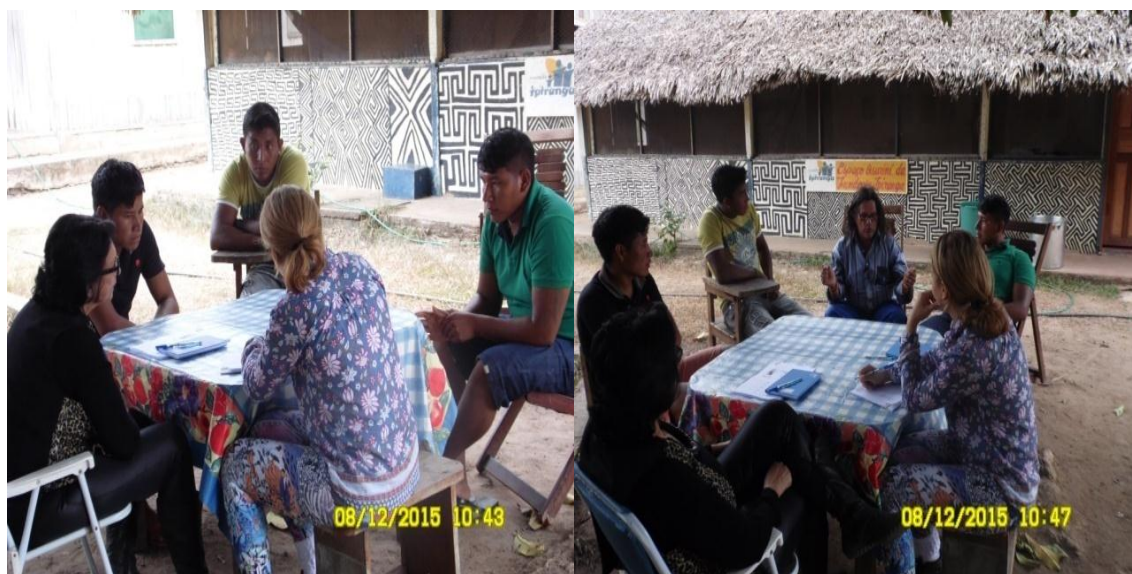
Figura 9.3-5 - Reunião com professores - 08/12/2015 - Aldeia Kwatinemu