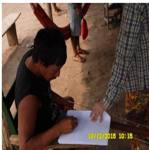
Figura 9.3-23 - Reunião com a comunidade (assinatura da ata) - 10/12/2015 - Aldeia Ta-akati