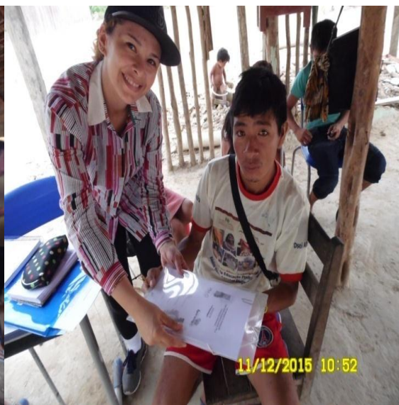
Figura 9.3-32 - Reunião com a comunidade (assinatura da ata) - 11/12/2015 - Aldeia Juruãti