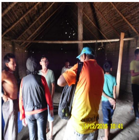
Figura 9.3-31 - Reunião com a comunidade - 11/12/2015 - Aldeia Juruãti