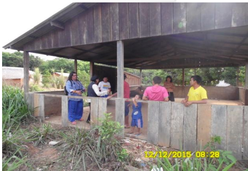
Figura 9.3-33 - Reunião com as lideranças - 12/12/2015 - Aldeia Ipixuna

Na oportunidade, também realizou-se reunião com a comunidade da aldeia Ipixuna ( Anexo 9.3-35 – Ata de reunião com a comunidade ). Na referida reunião foram itens de pauta: