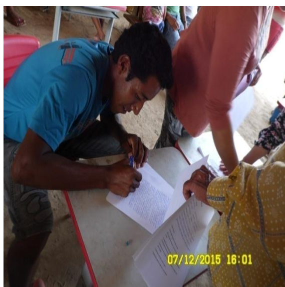
Figura 9.3-3 - Reunião na Tawiwa - 07/12/2015 - Aldeia Ita-aka