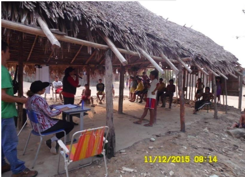
Figura 9.3-29 - Reunião com as lideranças - 11/12/2015 - Aldeia Juruãti

Na manhã do mesmo dia realizou-se a reunião com os professores ( Anexo 9.3-31 – Ata de reunião com professores ). Na referida reunião foram itens de pauta: