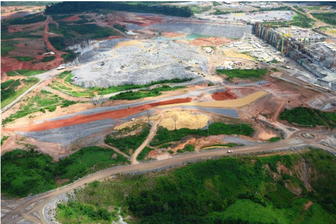
Figura 2 - 8 – Vista geral da Barragem de Fechamento Direita