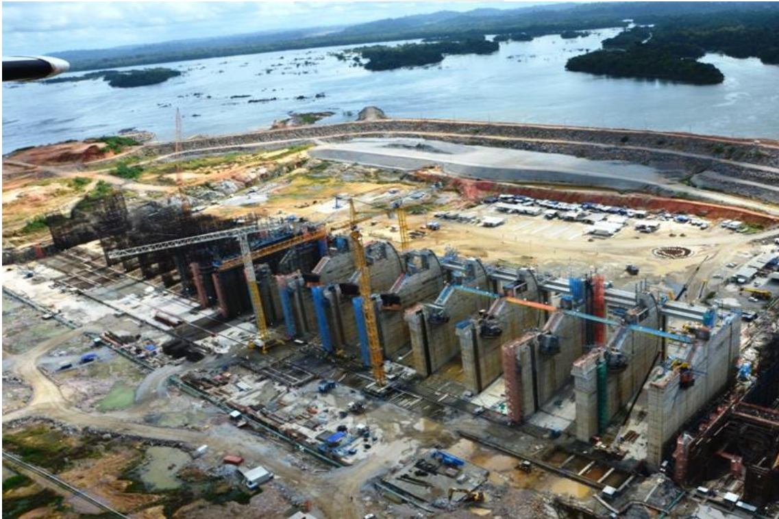
Figura 2 – 13 – Vista de jusante do Vertedouro