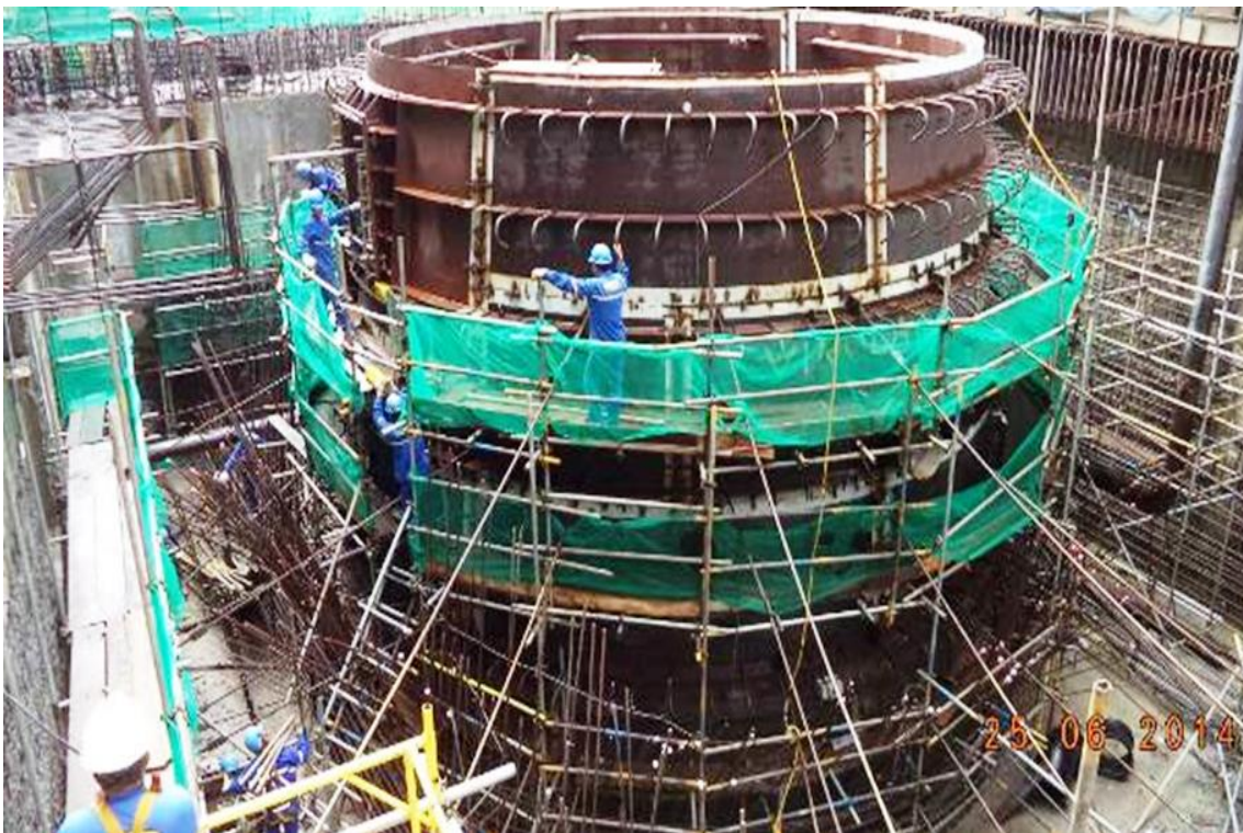
Figura 2 – 31 - Sitio Belo Monte – Montagem do Cone do Tubo de Sucção – UG 2