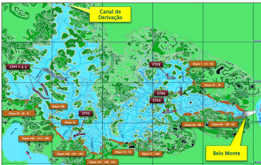
Figura 2 – 23 – Localização dos Canais de Transposição (CT's) e Diques do futuro Reservatório Intermediário

Por fim, encartam-se as Figuras 2-24 a 2-28 , ilustrando o avanço das obras relativas aos Canais de Transposição e Diques, valendo observar que, para fins de orientação do leitor, a Figura 2-23 apresenta a localização das referidas estruturas.