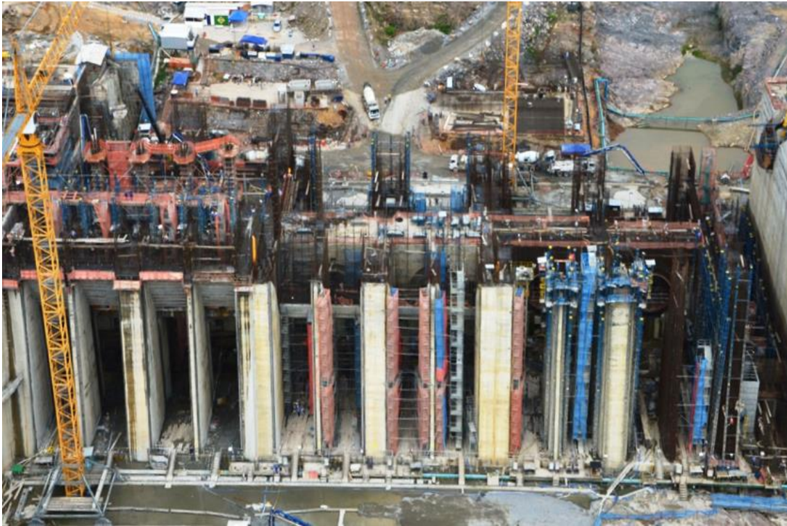
Figura 2 – 11 – Vista de montante da Tomada de Água Complementar