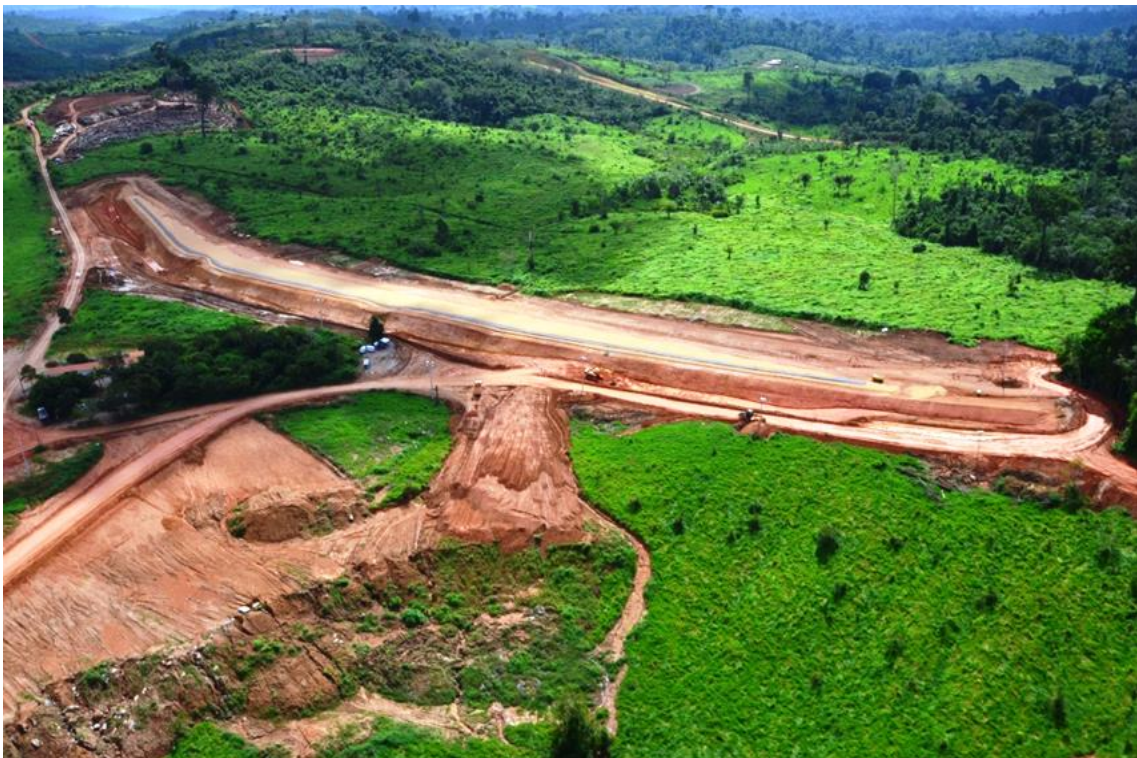
Figura 2 – 25 - Dique 11