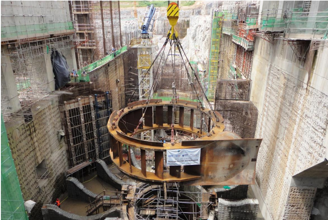
Figura 2 – 29 - Sitio Belo Monte – Descida do Pré-Distribuidor no poço – UG 01

As Figuras 2-29 a 2-31 , a seguir, ilustram aspectos de destaque dos serviços de montagem eletromecânica no período de abrangência deste 6º RC.