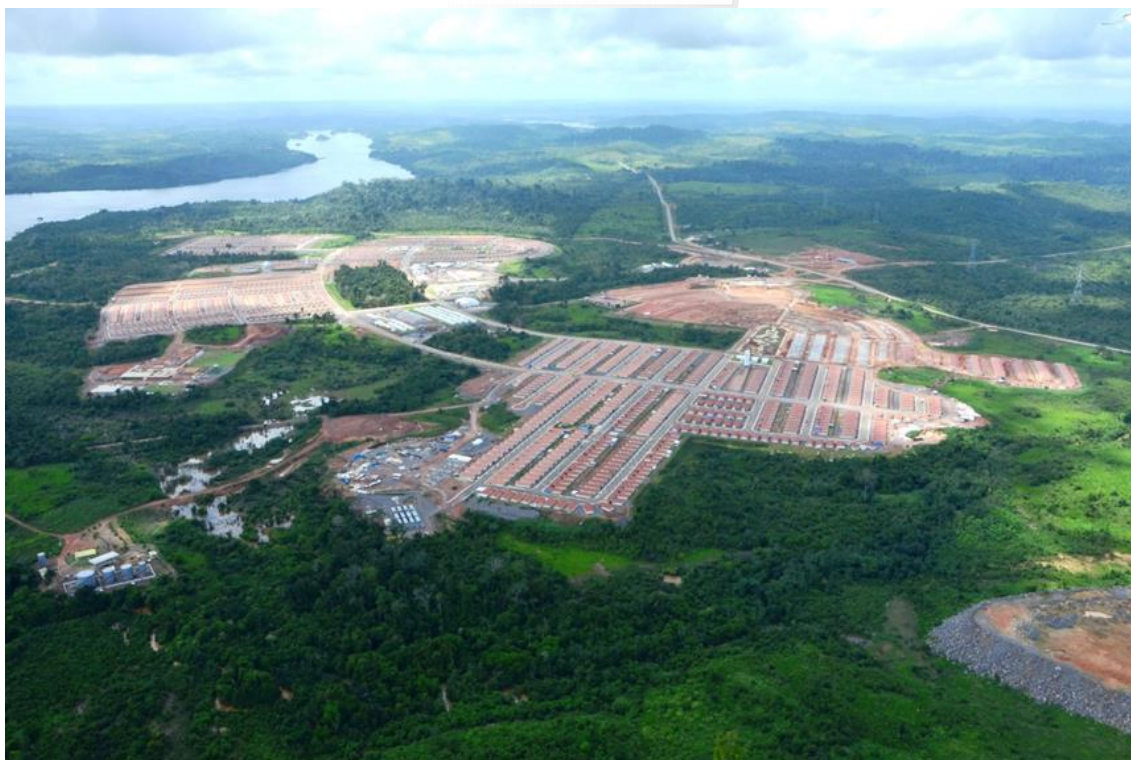
Figura 2 - 9 – Vista geral da Vila Residencial Belo Monte