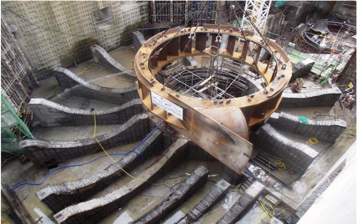
Figura 2 – 30 - Sitio Belo Monte – Pré-Distribuidor na base – UG 01