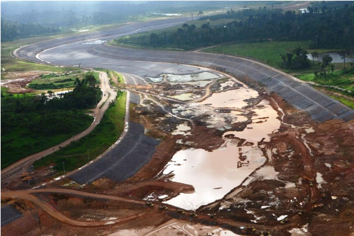
Figura 2 – 19 - Canal de Derivação – km 9,00 a 12,50