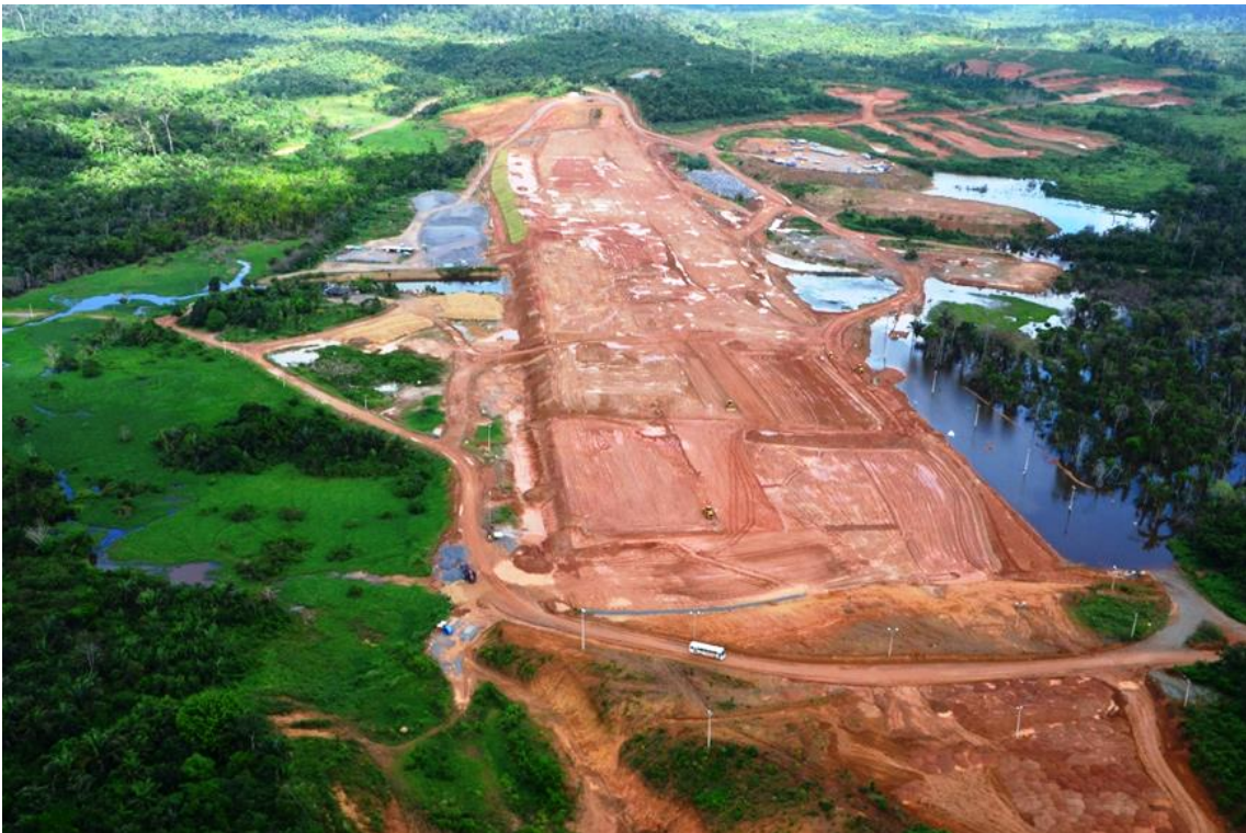
Figura 2 – 27 - Dique 19B