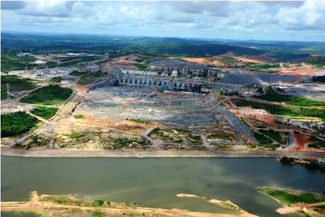
Figura 2 – 1 – Vista geral de jusante do Sítio Belo Monte