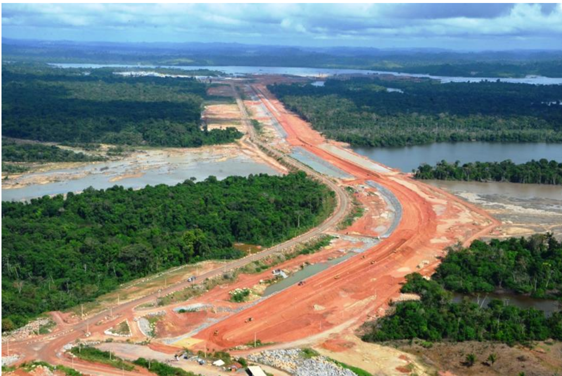
Figura 2 – 14 – Vista geral da Barragem Lateral Esquerda