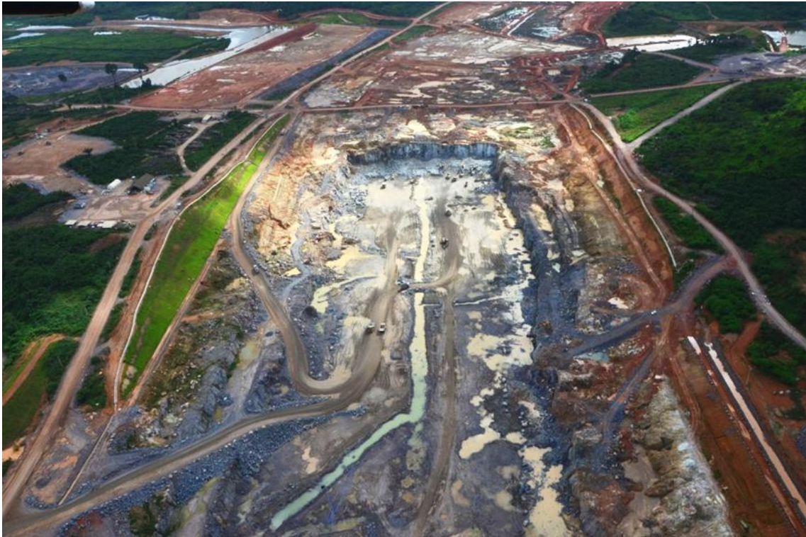
Figura 2 – 17 - Canal de Derivação — Km 3,50 a 6,00