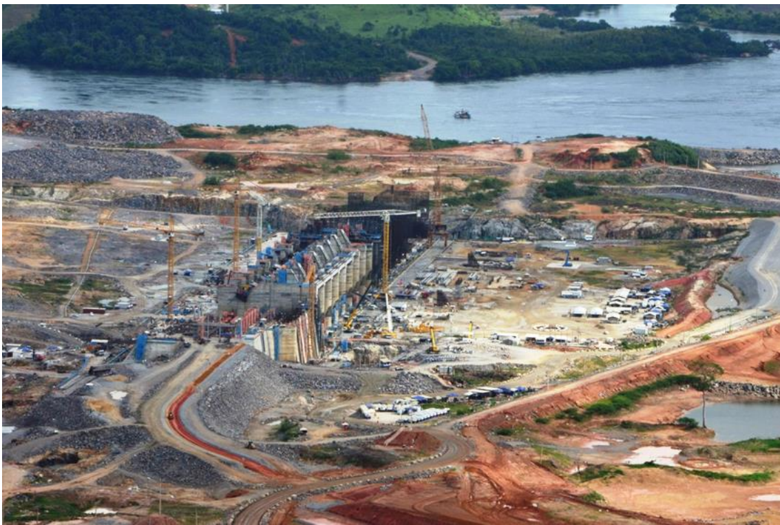
Figura 2 – 10 – Vista geral das obras de concreto – margem esquerda

Por fim, as Figuras 2-10 a 2-15 ilustram as obras principais no Sítio Pimental.