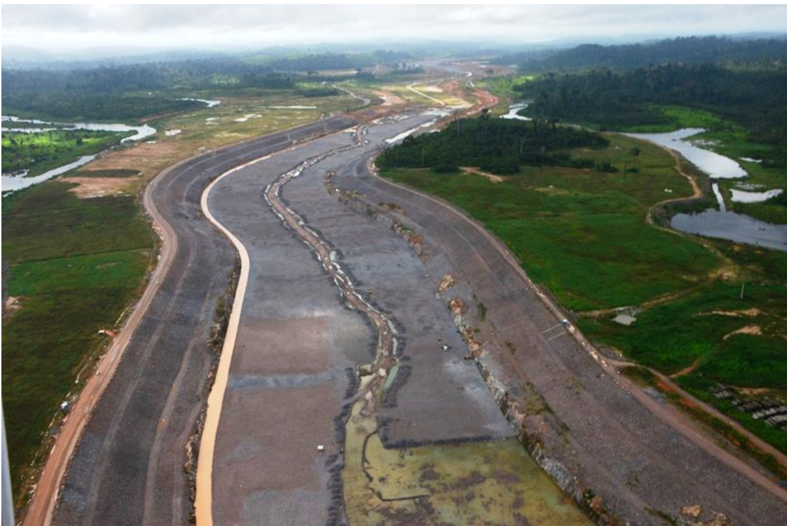
Figura 2 – 20 - Canal de Derivação – km 13,50 a 16,00