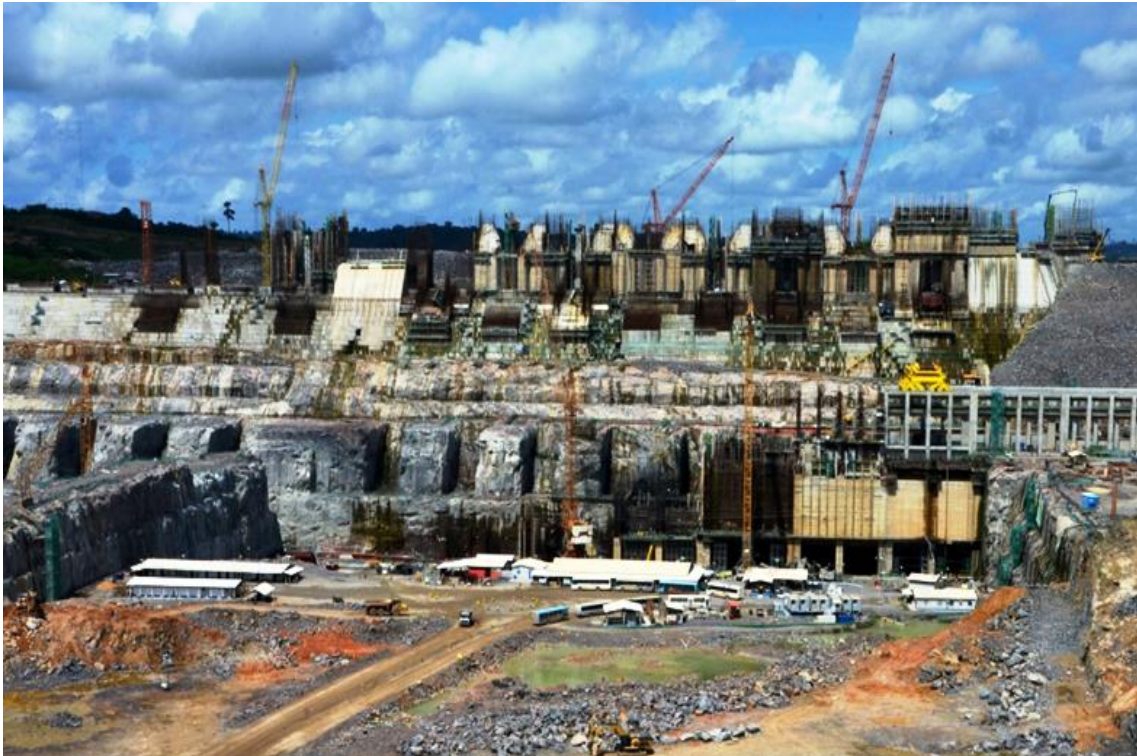
Figura 2 – 3 – Vista de jusante da Casa de Força Principal – Blocos CF01 a CF08