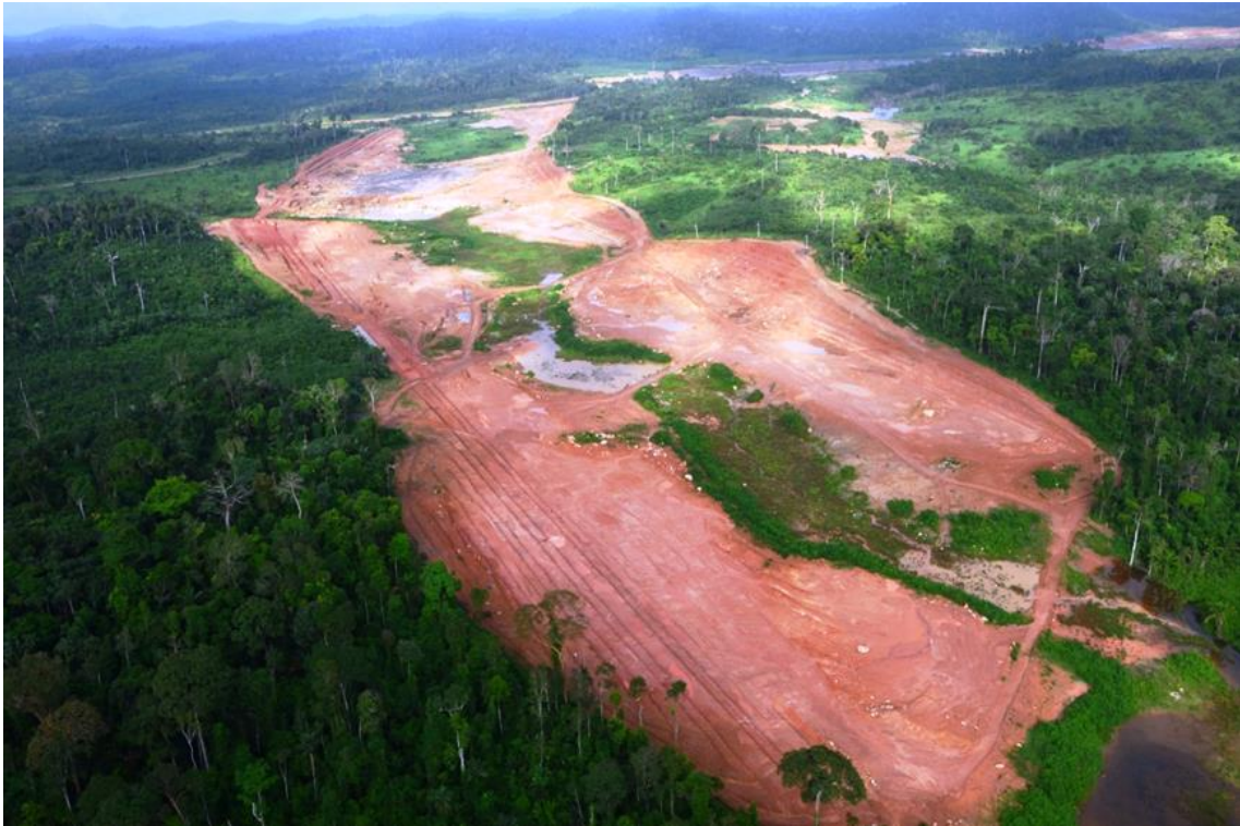
Figura 2 – 24 - CTPT1 - Canal de Transposição Paquiçamba Ticaruca