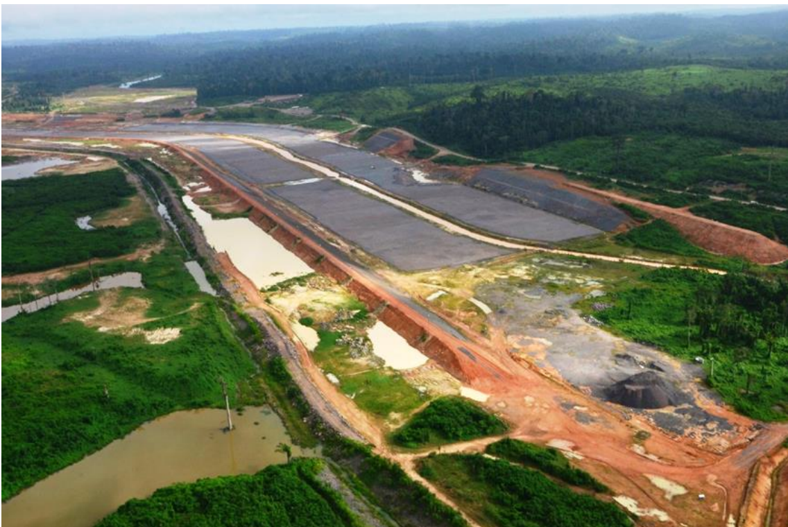
Figura 2 – 22 - Canal de Derivação – km 18,00 a 20,20