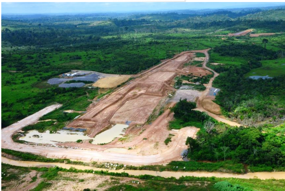
Figura 2 – 28 - Dique 28