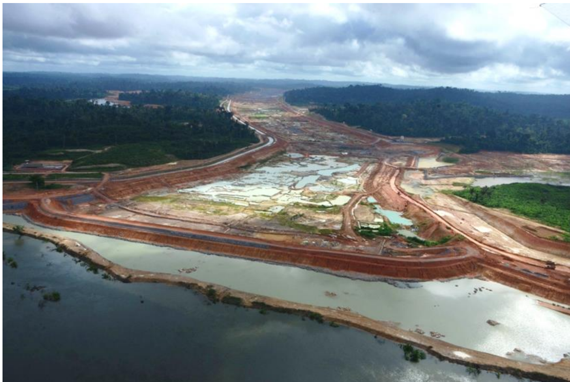
Figura 2 – 16 - Canal de Derivação – Km 0,00 a 3,00

Por fim, as Figuras 2-16 a 2-22 ilustram o andamento das obras no Sítio do Canal de Derivação.