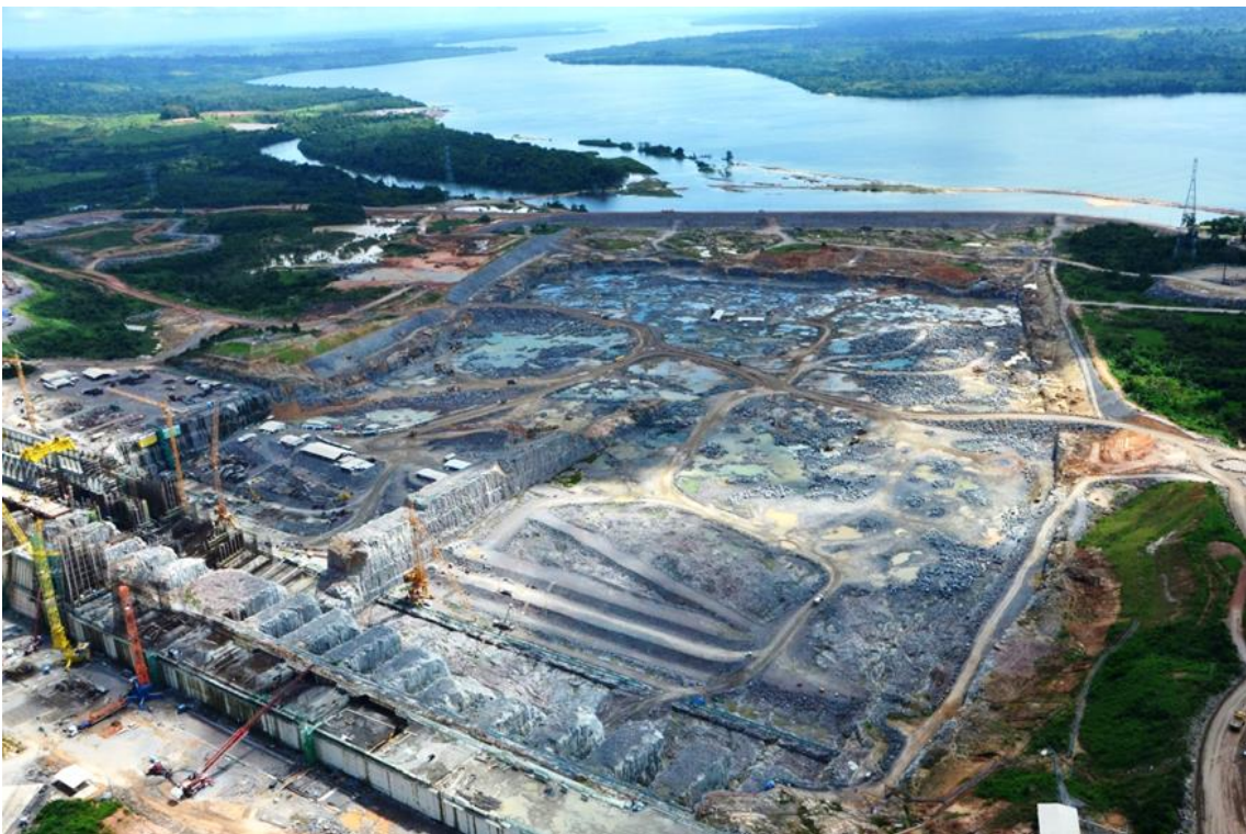
Figura 2 – 2 – Vista geral do Canal de Fuga com serviços de escavação em rocha em andamento