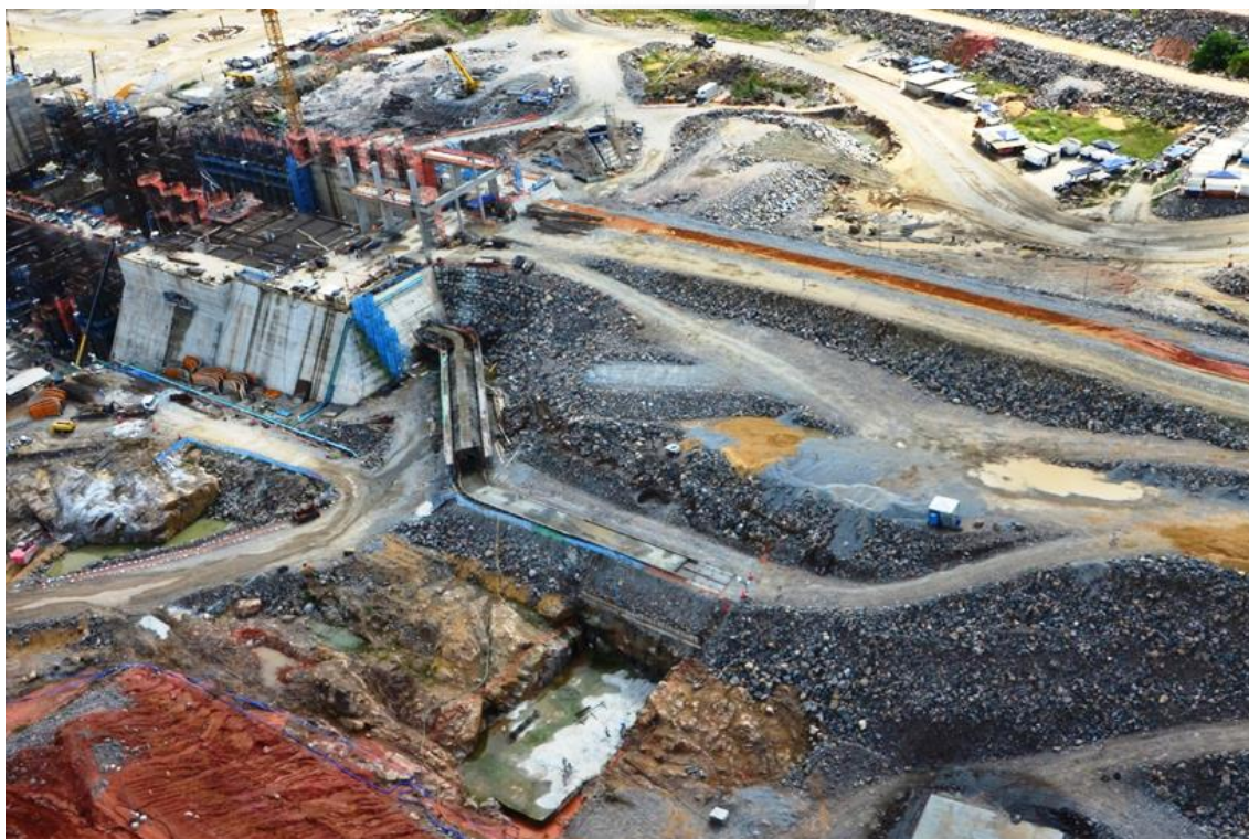
Figura 2 – 15 – Vista geral das obras do Sistema de Transposição de Peixes