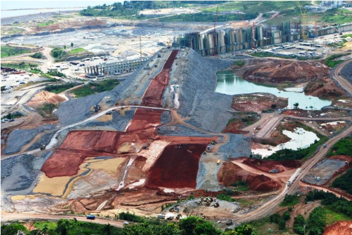
Figura 2 - 7 – Vista geral da Barragem de Fechamento Esquerda