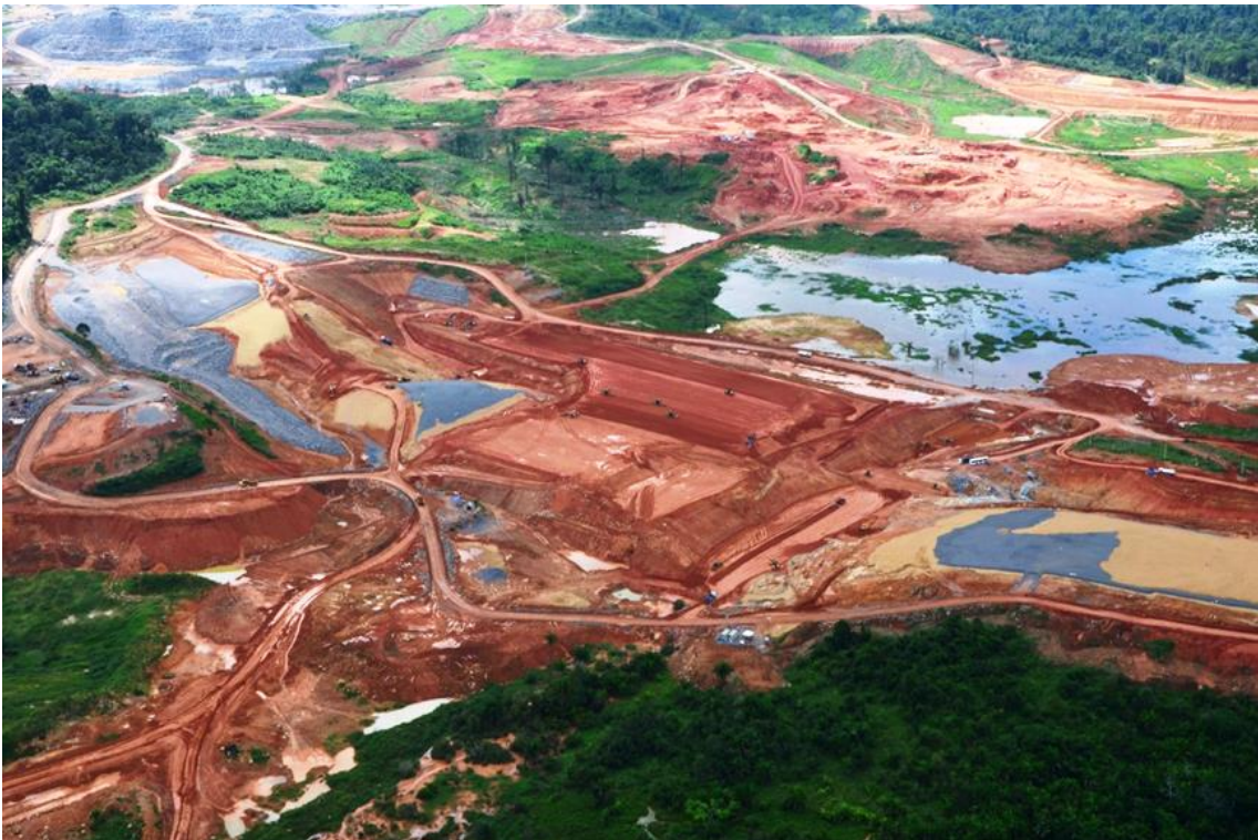
Figura 2 - 6 - Vista aérea da Barragem Vertente Santo Antônio