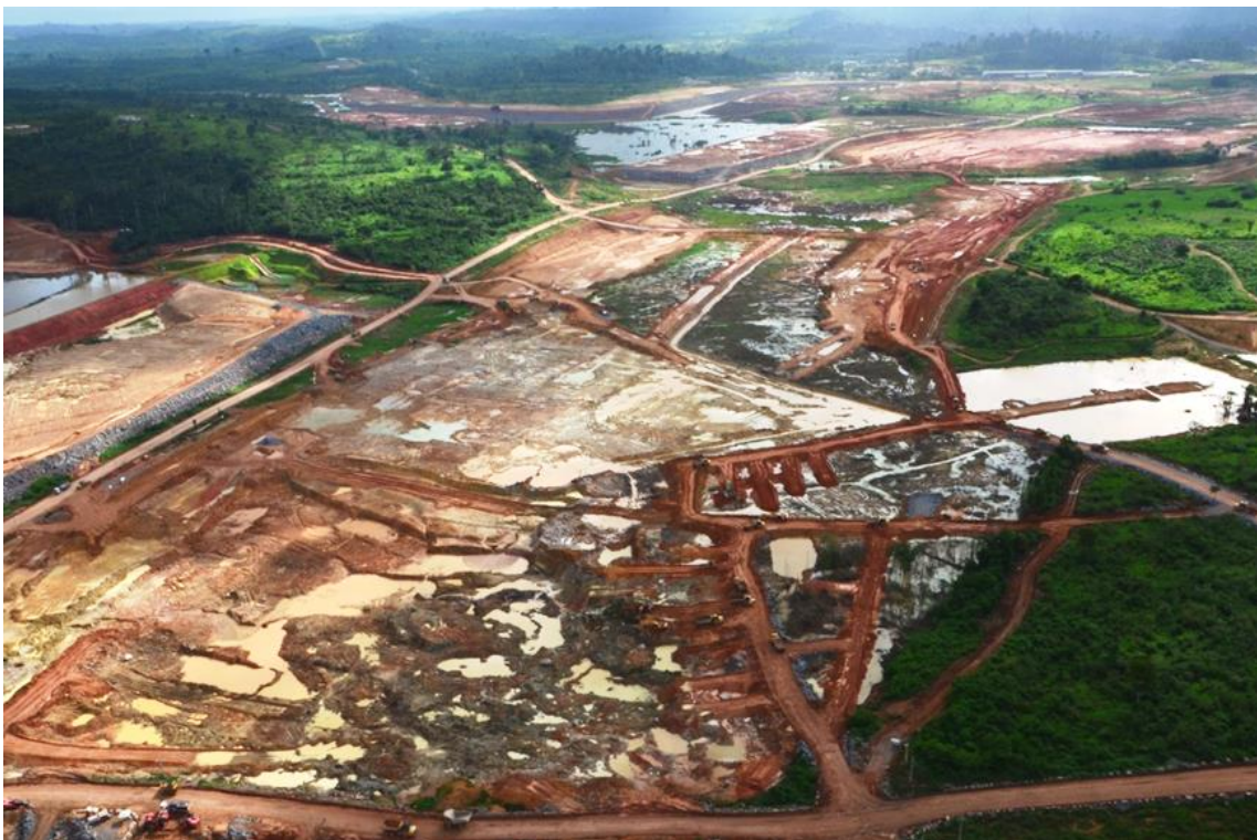
Figura 2 – 18 - Canal de Derivação — Km 6,50 a 9,00