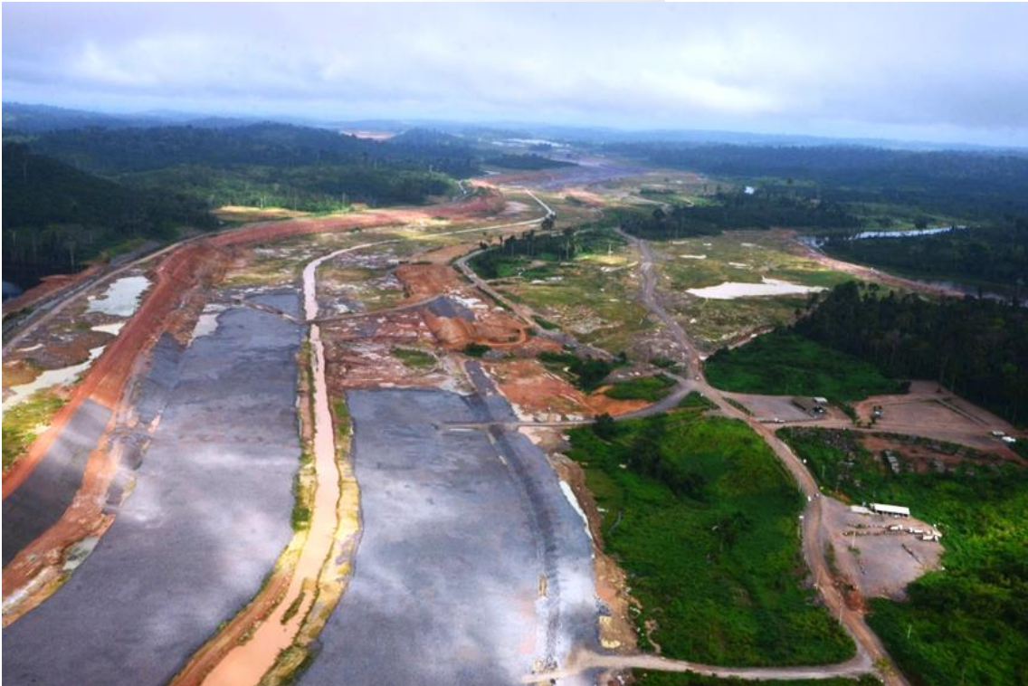
Figura 2 – 21 - Canal de Derivação – km 16,00 a 18,00