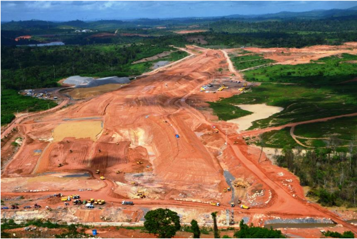
Figura 2 – 26 - Dique 13