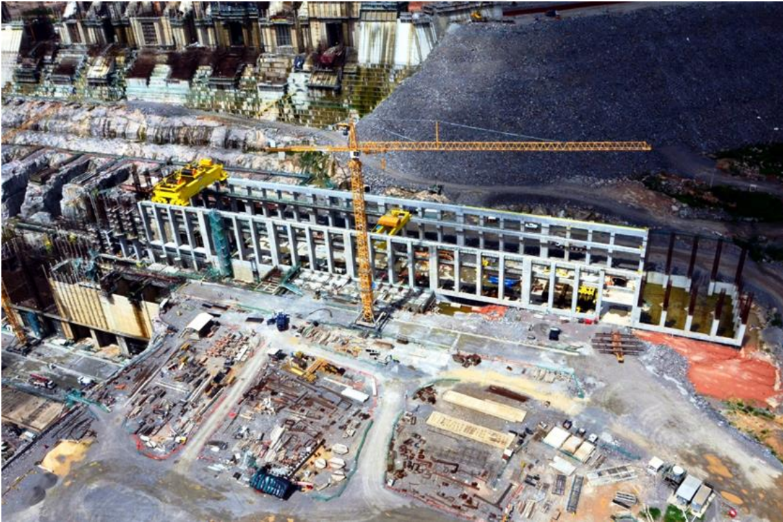
Figura 2 - 5 - Vista geral da Área de Montagem