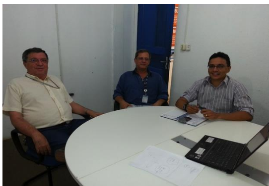
Figura 6.4 - 7 – Reunião com Setor Comercial do CCBM.