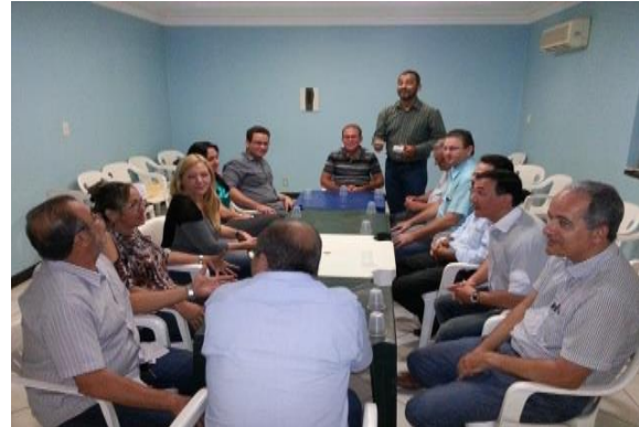
Figura 6.4 - 12 – Capacitação da ACIAPA, Altamira