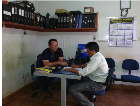
Figura 6.4 - 20 – Empresa WNORTE Construtora

No que se refere aos eventos realizados pela REDES existe um conjunto significativo de capacitações, envolvendo o fortalecimento da cultura empresarial e atividades específicas para o segmento de bares e restaurantes, ambos apresentados no Quadro 6.4 - 5– Eventos e nas Figuras 6.4 – 21 a 6.4 – 24 – Eventos realizados .