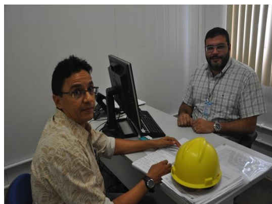
Figura 6.4 - 9 – Reunião com Setor Comercial do CCBM.