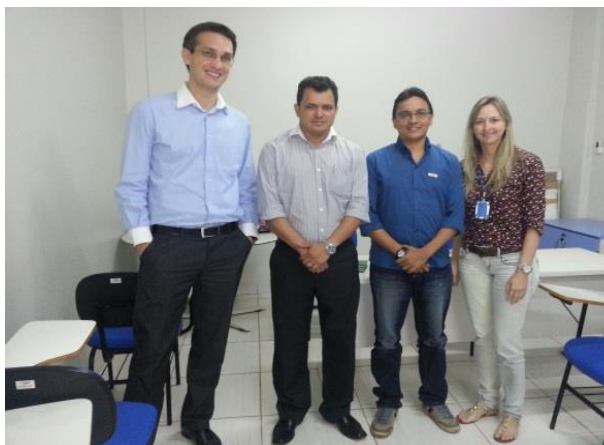
Figura 6.4 - 5 – Reunião com SEBRAE e Banco da Amazônia