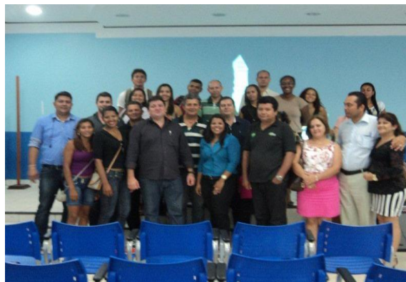
Figura 6.4 - 24 – Palestra logística empresarial – Correios, REDES, SEBRAE

Observou-se, no período deste relatório, 91 indicações de fornecedores por parte da REDES, para participar das compras diferenciadas, dando sequência à prática já observada no semestre anterior. A título de exemplo da eficácia dos procedimentos de indicação de fornecedores cabe registrar que cerca de 70% das empresas contratadas pela Norte Energia são do Pará.