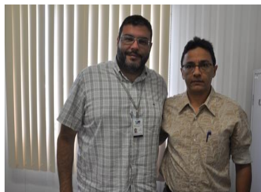
Figura 6.4 - 8 – Reunião com Setor Comercial do CCBM.