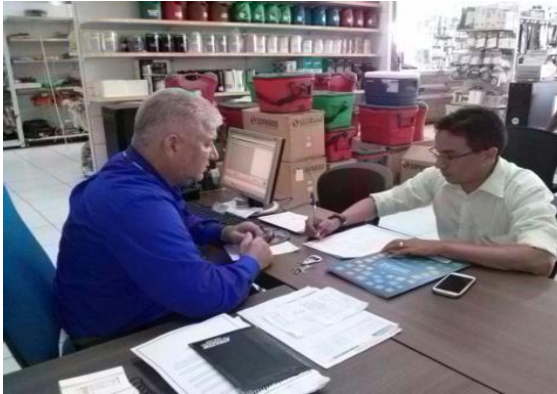
Figura 6.4 - 19 – Empresa Armazém da Construção