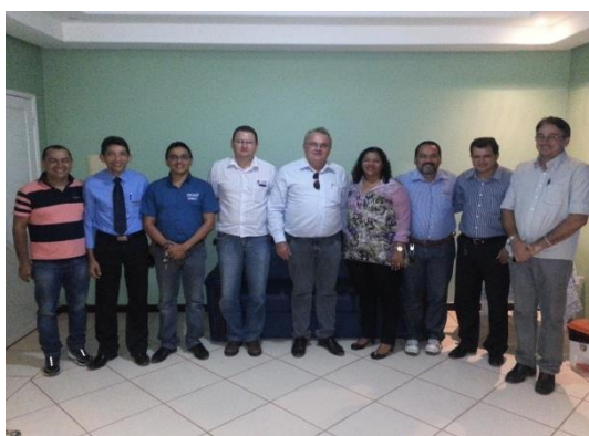
Figura 6.4 - 6 – Reunião com Superintendente do Banco da Amazônia

No que concerne à Formação de Fornecedores , deu-se continuidade às atividades realizadas no semestre anterior, dando-se apoio à organização empresarial, com ênfase para atividades induzidas pelo empreendimento, integrando-se ao produto relativo ao processo de Compras Diferenciadas .