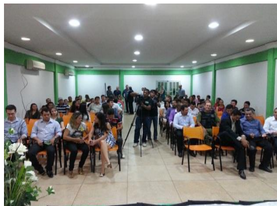
Figura 6.4 - 16 – Constituição da Associação Comercial e Industrial de Brasil Novo

Dentre as visitas a fornecedores descritas no Quadro 6.4 - 4 e cujas evidências de execução são apresentadas nas Figuras 6.4 - 17 a 6.4 - 20 – Visitas a Fornecedores , observa-se a preocupação da REDES no sentido de estimular os empreendedores locais e regionais a aproveitarem as oportunidades geradas pelo empreendimento e, particularmente, os mecanismos de compras diferenciadas, junto ao CCBM.