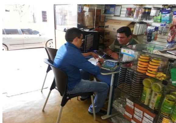
Figura 6.4 - 18 – Empresa FAG Materiais Elétricos