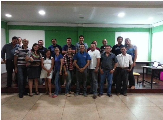
Figura 6.4 - 13 – Constituição da Associação Comercial e Industrial de Brasil Novo