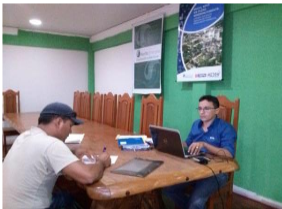
Figura 6.4 - 21 - Atendimento presencial a empresários de Brasil Novo