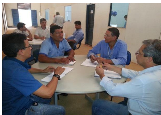
Figura 6.4 - 10 – Reunião com Setor Comercial do CCBM.