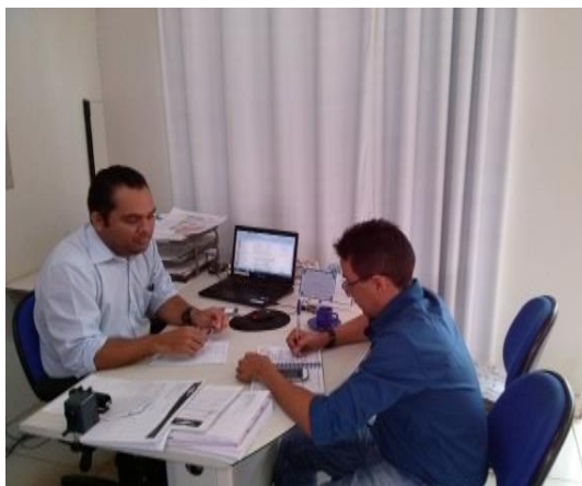
Figura 6.4 - 4 – Reunião de alinhamento, SEBRAE Altamira