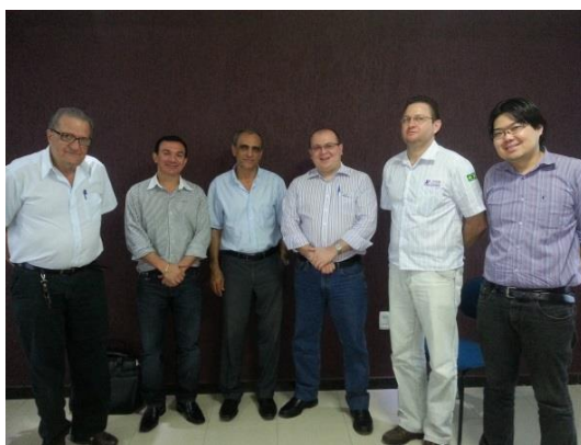
Figura 6.4 - 2 – Reunião com ACIAPA - Altamira

As evidências indicadas nas Figuras 6.4 - 2 a 6.4 - 6 – Fotos de reuniões de parcerias desenvolvidas com outras instituições demonstram de modo inequívoco o relevo dos relacionamentos desenvolvidos pelas REDES ao longo do semestre corrente.