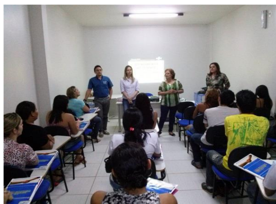
Figura 6.4 - 22 – Curso de atendimento ao cliente – REDES / SEBRAE