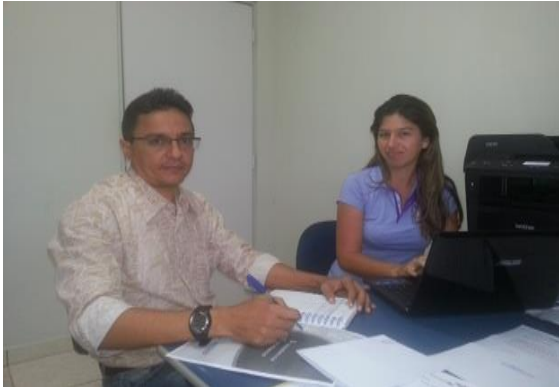
Figura 6.4 - 11 – Reunião com Associação de Dirigentes Lojistas – Vitória do Xingu