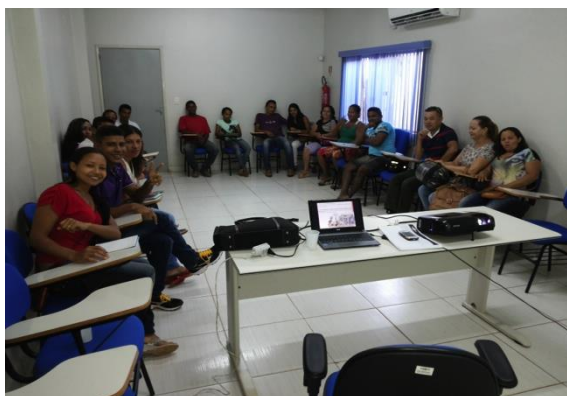
Figura 6.4 - 23 – Curso de manipulação de alimentos