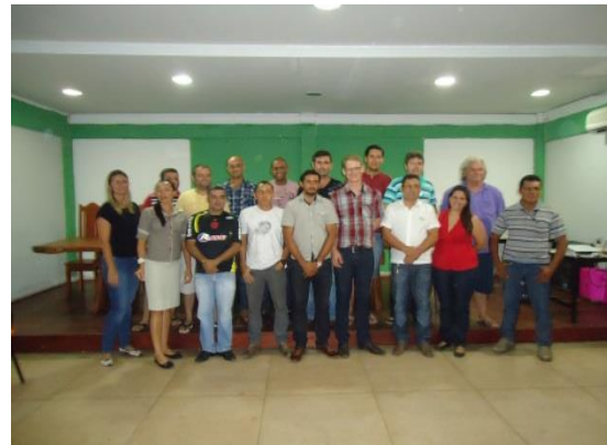
Figura 6.4 - 14 – Constituição da Associação Comercial e Industrial de Brasil Novo