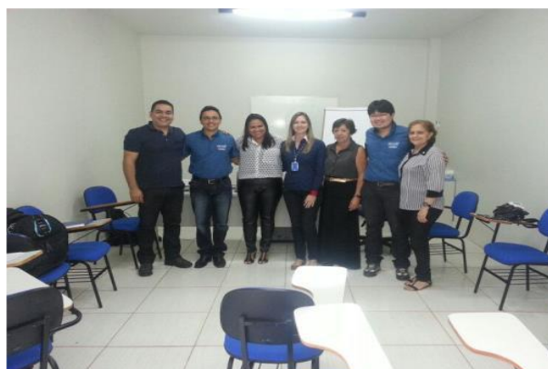
Figura 6.4 - 2 – Reunião com equipe técnica SEBRAE – Belém