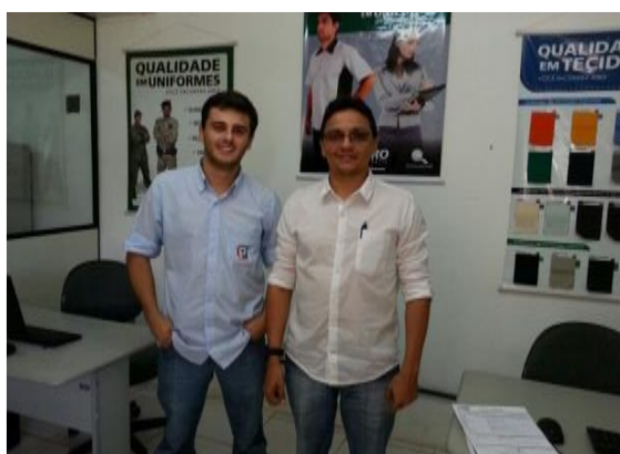
Figura 6.4 - 17 – Empresa Protefer Seguros