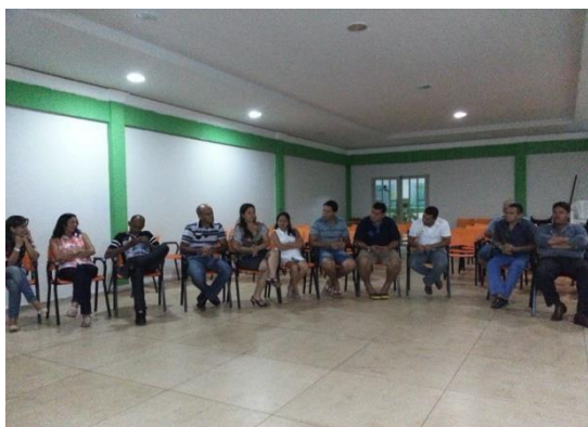
Figura 6.4 - 15 – Constituição da Associação Comercial e Industrial de Brasil Novo