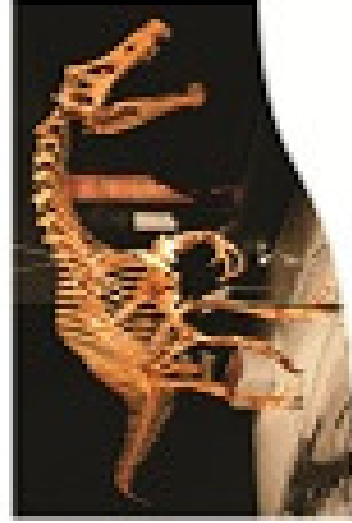
PEMATOCHALLERUS - OMAHA, BRASIL