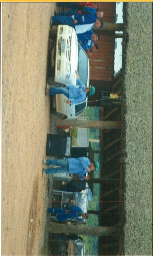
1 Treinamento dos funcionários no PO CCBM 220 11 (preservação da fauna e flora) com foco na mitigação de impactos pela perda de animais da fauna por atropelamento.