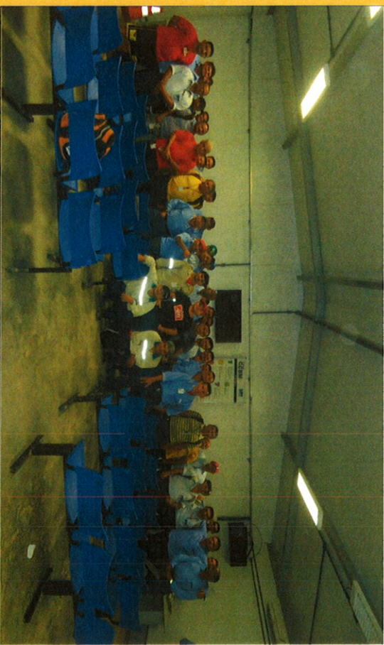
1 Palestra sobre a importancia da Preservação da fauna e da flora para os motoristas de ônibus da Empresa Markosul Transporte em cumprimento ao PO CCBM 220 11.