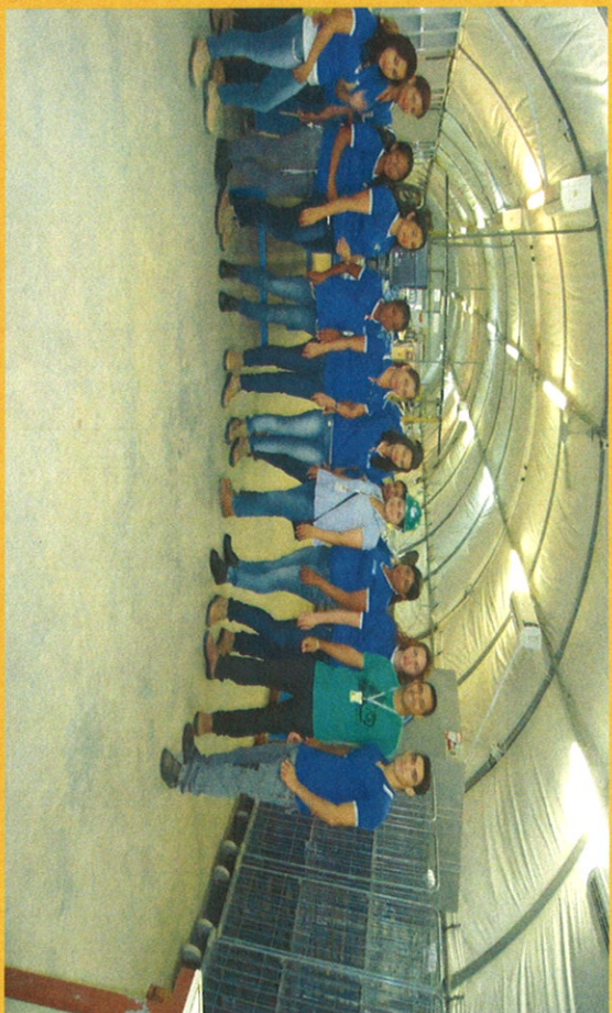
1 Treinamento com os funcionários da Lavanderia Triunfo, sobre coleta seletiva de forma organizada, conforme PO CCBM 220 08.