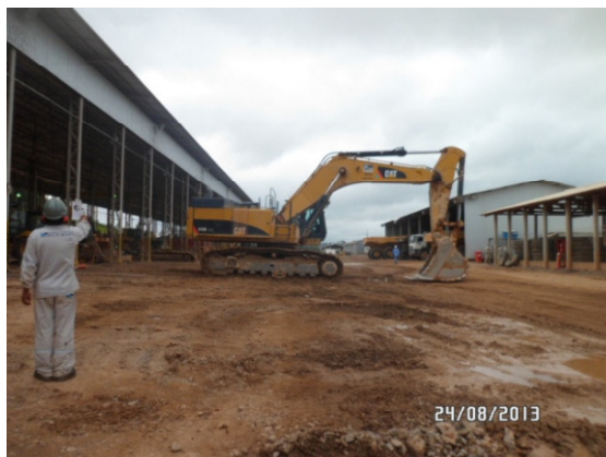
Figura - 4 – Monitoramento de fumaça preta realizada pela equipe de manutenção