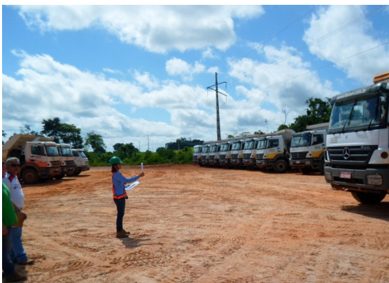
Figura - 3 – Monitoramento de fumaça preta realizada pela equipe de manutenção