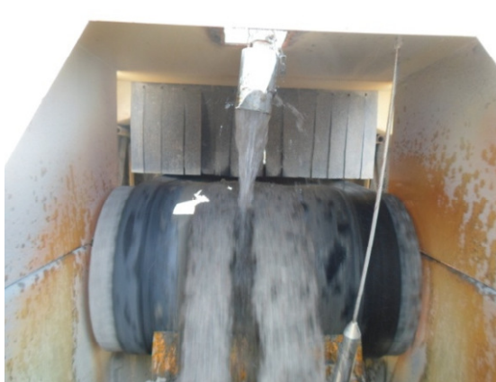
Figura - 6 – Sistema de controle de material particulado na central de britagem do canteiro de Belo Monte