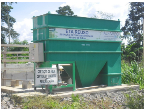
Figura - 3 – ETA de reuso instalada na Central de Concreto – Sítio Canais e Diques