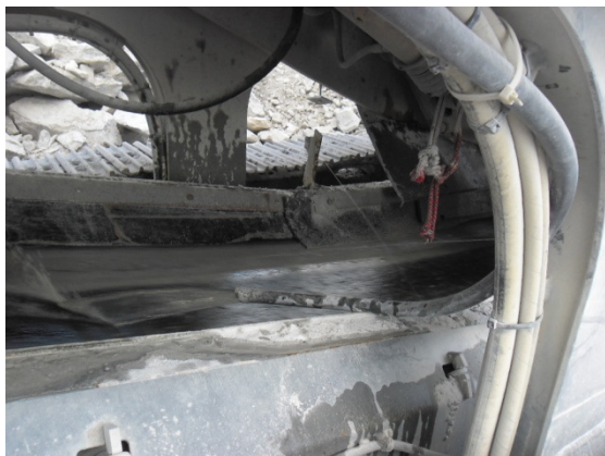
Figura - 1 – Sistema de aspersão de água nos equipamentos de britagem – Sítio Pimental