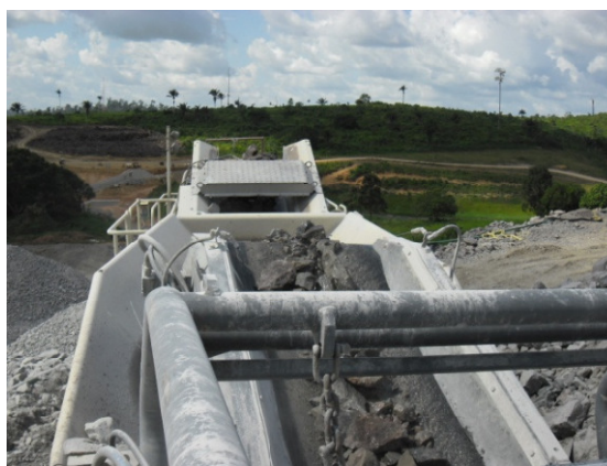
Figura - 4 – Sistema de controle de material particulado na central de britagem do canteiro de Canais e Diques