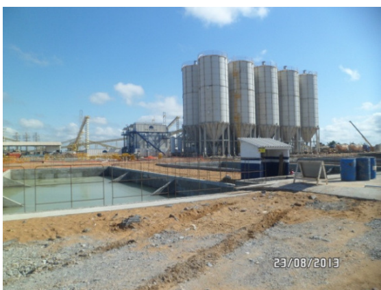
Figura - 5 – Visão da bacia de decantação, corretor de Ph e central de concreto da ilha Marciana do sítio Pimental