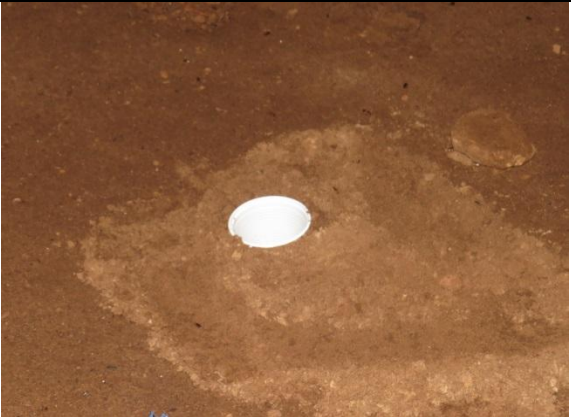
Figura 18 – Armadilha Pitfall no interior da caverna Nova Kararaô.