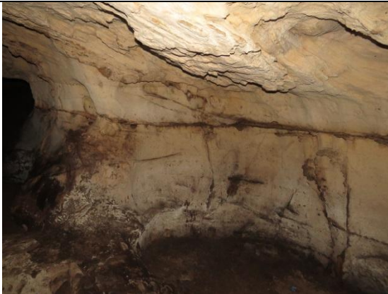
Figura 9 – Paredes no interior da Bat-loca.