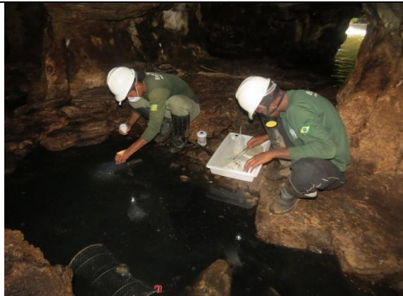
Figura 29 – Coleta por busca ativa no córrego no interior da caverna Leonardo da Vinci.