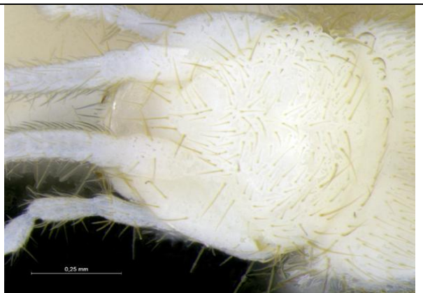
Figura 34 – Cabeça da traça em vista dorsal, com destaque para a ausência de olhos, caverna Nova Kararaô.