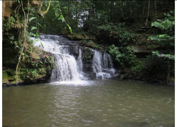
Figura 26 – Cachoeira próxima à entrada da caverna Leonardo da Vinci.