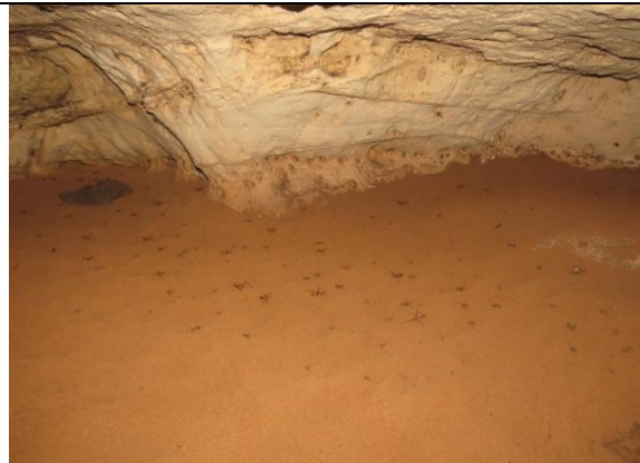
Figura 11 – Grande quantidade de grilos no chão da caverna Bat-loca.