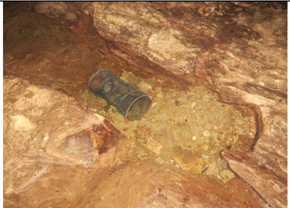
Figura 28 – Armadilha covo no interior da caverna Leonardo da Vinci.