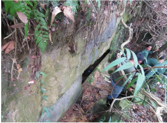
Figura 1 – Entrada da caverna Pedra do Navio.