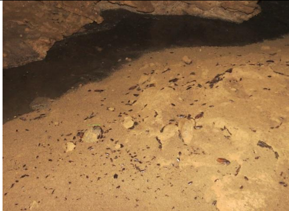
Figura 25 – Grande quantidade de baratas no interior da caverna Cama de Vara.