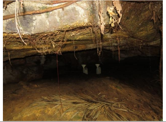
Figura 14 – Interior do Abrigo do Igarapé.