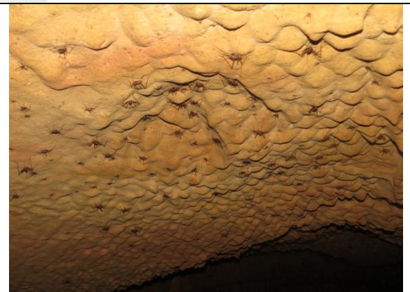
Figura 20 – Grande quantidade de grilos Endecous sp. no teto da caverna Nova Kararaô.