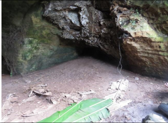
Figura 15 – Entrada do Abrigo do Mangá.