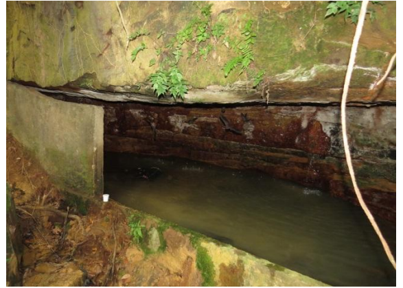
Figura 2 – Entrada e interior da Pedra do Navio.