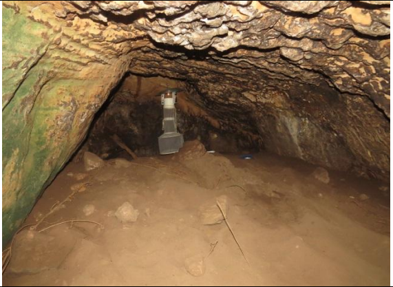
Figura 16 – Interior e paredes do Abrigo do Mangá.