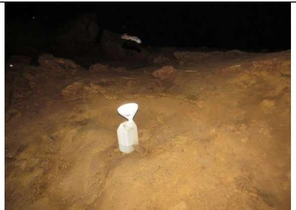
Figura 6 – Goteira no interior da Pedra da Cachoeira.