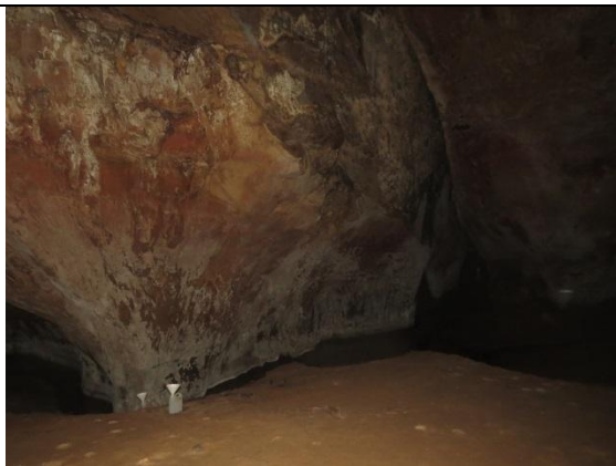
Figura 21 – Paredes e interior da caverna Kararaô.