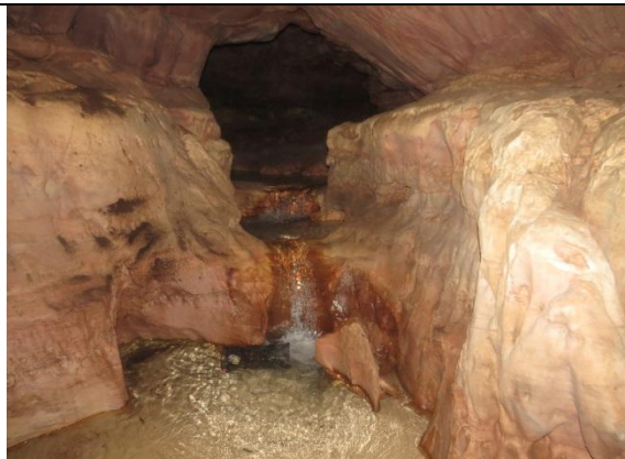
Figura 5 – Córrego no interior da Pedra da Cachoeira.