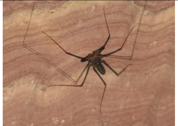
Figura 8 – Amblipígeo no interior da Pedra da Cachoeira.