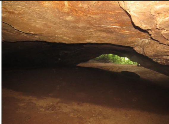
Figura 17 – Entrada da caverna Nova Kararaô.