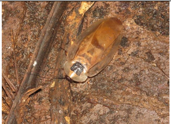
Figura 30 – Blaberus giganteus no interior da caverna Leonardo da Vinci.