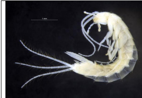
Figura 31 – fêmea de traça (Zygentoma: Nicoletiidae) encontrada na zona afótica da caverna Nova Kararaô, com destaque para a ausência de pigmentos.