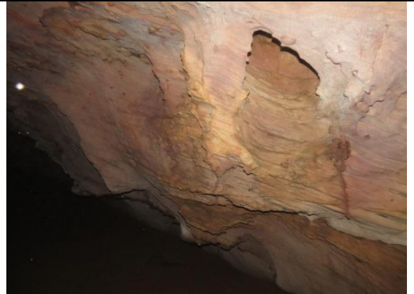
Figura 4 – Paredes no interior da caverna Pedra da Cachoeira.