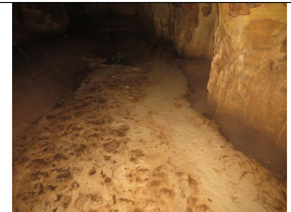
Figura 22 – Córrego no interior da caverna Kararaô.