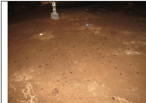
Figura 19 – Grande quantidade de baratas no chão Nova Kararaô.