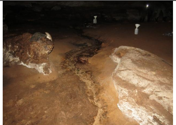
Figura 10 – Pequeno córrego no interior da caverna Bat-loca.