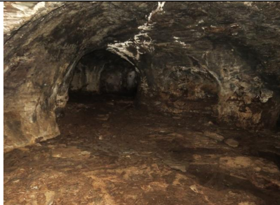
Figura 27 – Paredes e interior da caverna Leonardo da Vinci.