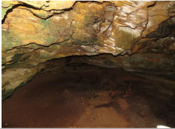
Figura 13 – Entrada do Abrigo do Igarapé.