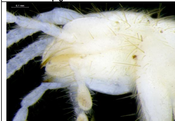
Figura 33 – Cabeça da traça em vista lateral, com destaque para a ausência de olhos, caverna Nova Kararaô.