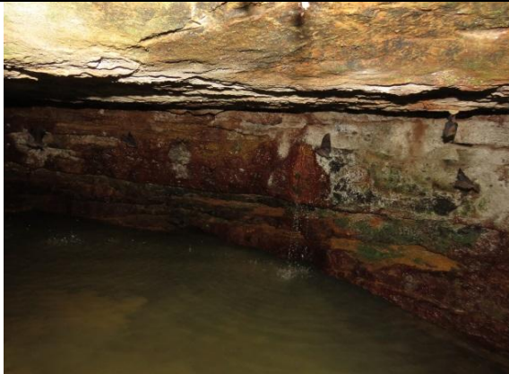
Figura 3 – Paredes no interior da Pedra do Navio.