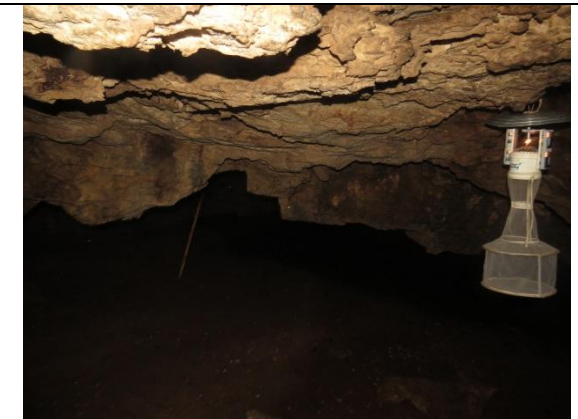
Figura 24 – Interior da caverna Cama de Vara.