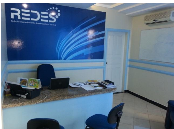
Figura 6.4 - 2 – Sede da REDES/DIEPA junto à Associação Comercial, Industrial e Agropecuária de Altamira – ACIAPA, detalhe

As Figuras 6.4 – 2 e 3 apresentam detalhes da sede da REDES/DIEPA junto à Associação Comercial, Industrial e Agropecuária de Altamira – ACIAPA.