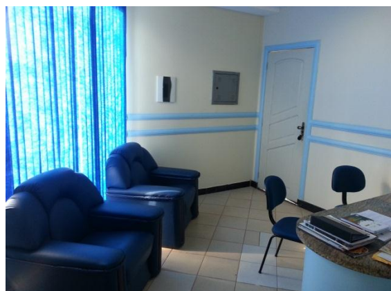
Figura 6.4 - 3 – Sede da REDES/DIEPA junto à Associação Comercial, Industrial e Agropecuária de Altamira – ACIAPA, detalhe

Deste modo, a partir da base local da REDES vem sendo realizado um vigoroso trabalho de estímulo à economia local, movimentando-se para tanto todo o empresariado dos municípios da AID, bem como instituições de grande relevo para fins de desenvolvimento local e regional, de que são exemplos o Serviço Brasileiro de Apoio às Micro e Pequenas Empresas – SEBRAE, Serviço Nacional de Aprendizagem Industrial – SENAI, Serviço Social da Indústria – SESI, além de sindicatos e associações patronais, congregados em torno da ACIAPA de Altamira (que é a instituição congênere mais consolidada na AID).