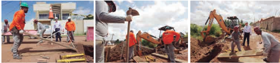
Vinte frentes de trabalho serão instaladas na cidade ao mesmo tempo

Além disso, será implantada a estação de tratamento do esgoto que vai tirar as impurezas contidas na água que já foi utilizada pela população. Essa água será devolvida limpa para o rio.