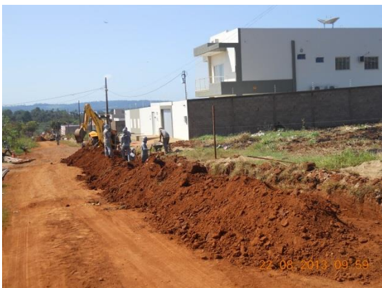
Figura – 5 - Execução de redes de água e esgoto no bairro Ibiza