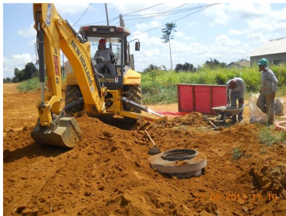
Figura - 15 – Execução de redes de água e esgoto no bairro Liberdade