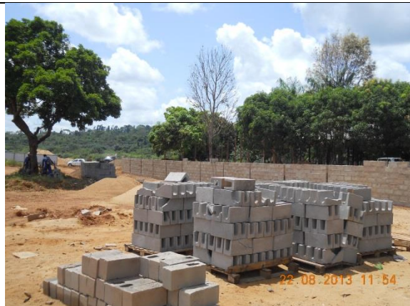
Figura - 17 – Serviços na Estação de Tratamento de Esgoto – Construção do muro