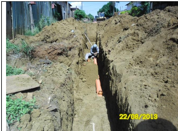
Figura - 13 – Execução de redes de água e esgoto no bairro Mutirão