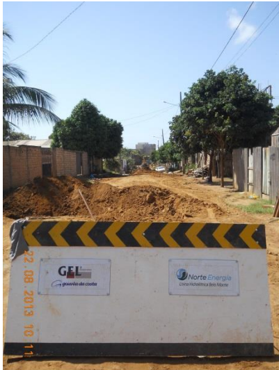
Figura – 3 - Execução de redes de água e esgoto no bairro Bela Vista