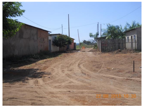
Figura - 10 – Execução de redes de água e esgoto no bairro Jardim Independente II em rua concluída