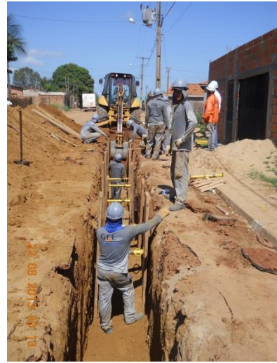
Figura - 2 – Execução de redes de água e esgoto no bairro Bela Vista