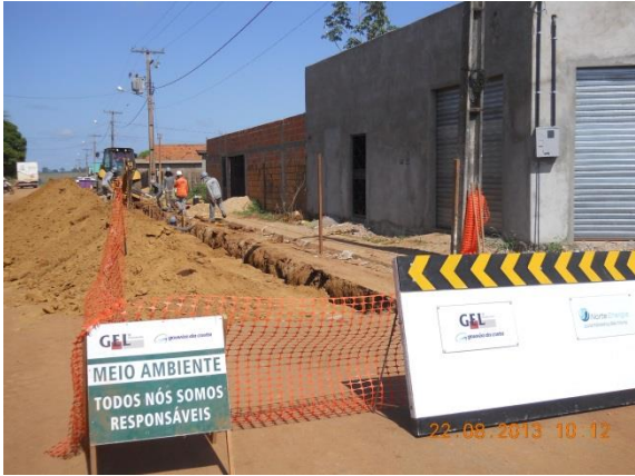
Figura - 1 – Execução de redes de água e esgoto no bairro Bela Vista