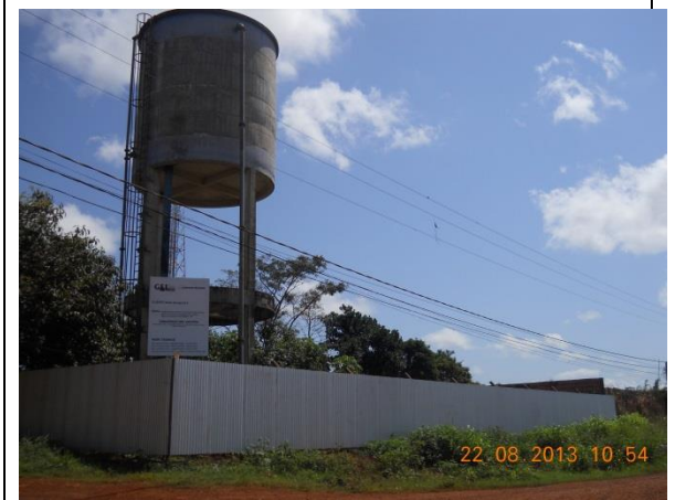
Figura - 20 - Ampliação dos Reservatórios Apoiados – RAPs – Bairro Brasília - Mirante