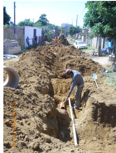
Figura – 4 - Execução de redes de água e esgoto no bairro Bela Vista