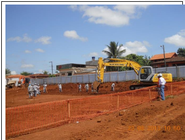
Figura - 19 - Construção dos Reservatórios Apoiados – RAPs – Bairro Brasília