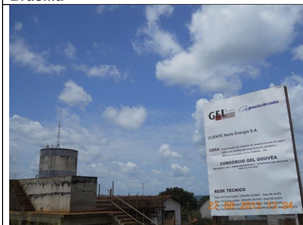
Figura - 20 - Reforma da Estação de Tratamento de Água – ETA