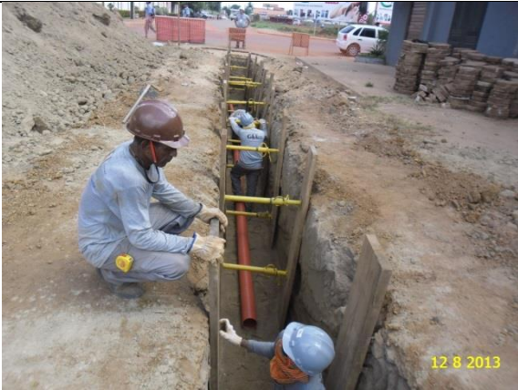
Figura - 11 – Execução de redes de água e esgoto no bairro Esplanada do Xingu