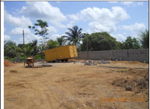
Figura - 18 – Reservatórios Apoiados – RAPs – Bairro Santa Ana