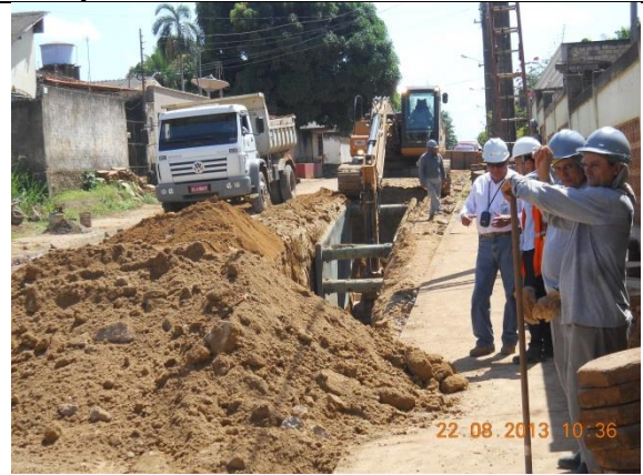
Figura - 12 – Execução de redes de água e esgoto no bairro Esplanada do Xingu