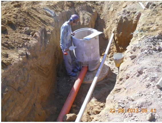
Figura - 7 – Execução de redes de água e esgoto no bairro Ibiza