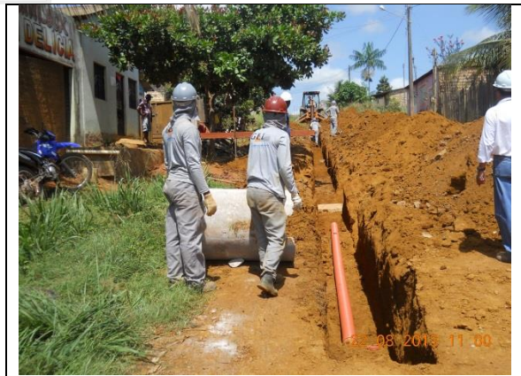
Figura - 14 – Execução de redes de água e esgoto no bairro Liberdade