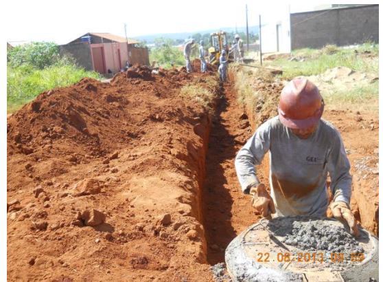
Figura – 6 - Execução de redes de água e esgoto no bairro Ibiza