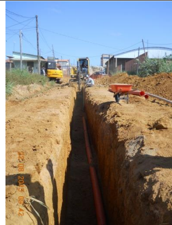
Figura - 8 – Execução de redes de água e esgoto no bairro Ibiza