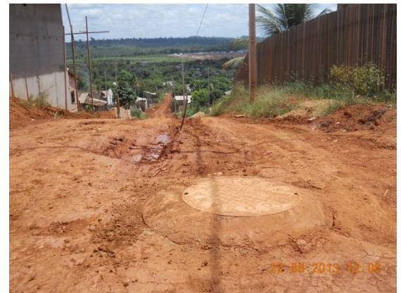
Figura - 16 – Execução de redes de água e esgoto no bairro São Domingos em rua concluída