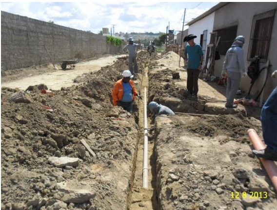
Figura - 9 – Execução de redes de água e esgoto no bairro Jardim Independente II