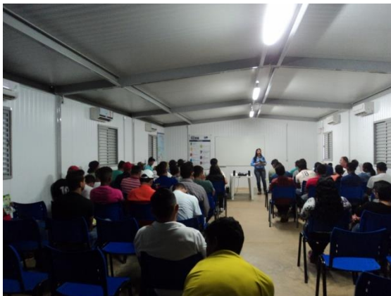
Figura - 6 – Curso de Ambientação realizado em Junho/13