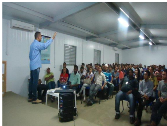
Figura - 2 – Curso de Ambientação realizado em Fevereiro/13