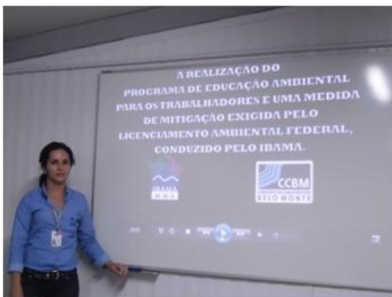
Figura - 3 – Curso de Ambientação realizado em Março/13