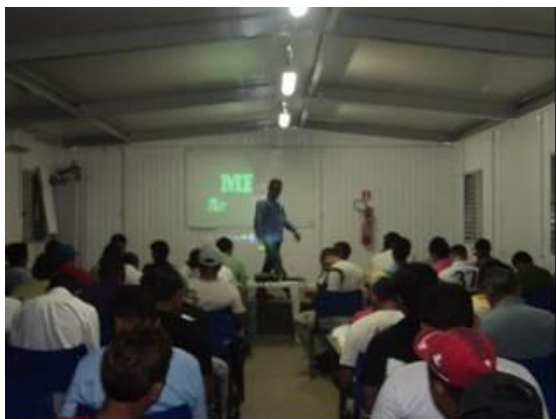
Figura - 1 – Curso de Ambientação realizado em Janeiro/13