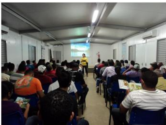
Figura - 5 – Curso de Ambientação realizado em Maio/13