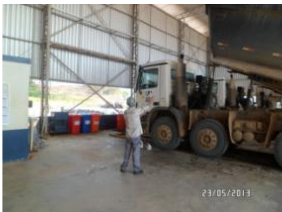
Figura - 3 – Monitoramento de fumaça preta realizada pela equipe de manutenção