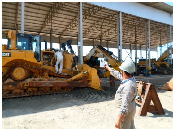
Figura - 1 – Monitoramento de fumaça preta realizada pela equipe de manutenção