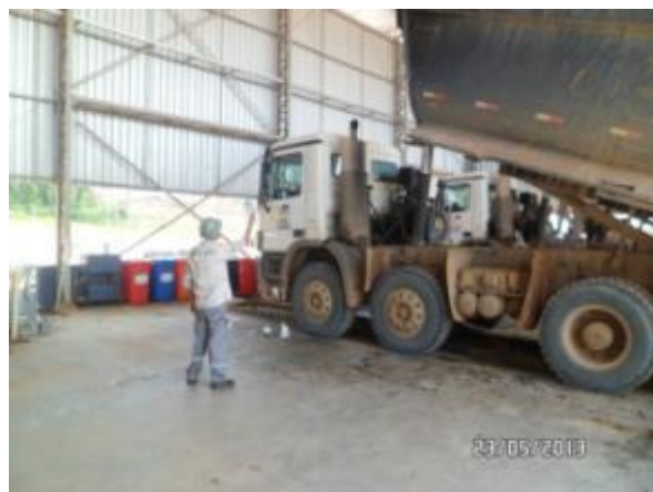
Figura - 4 – Monitoramento de fumaça preta realizada pela equipe de manutenção