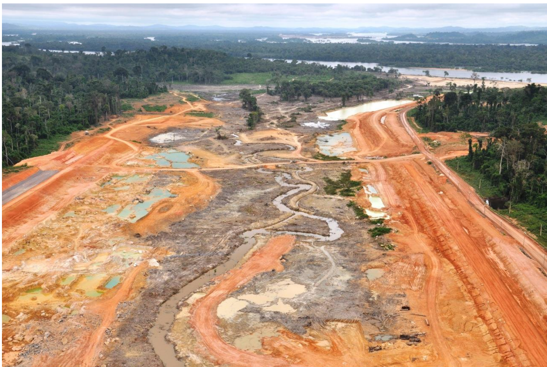
Figura 2 – 16 – Vista geral da área do emboque do Canal de Derivação (km 00 a km 05)

Por fim, as Figuras 2-16 a 2-19 ilustram o andamento das obras no Sítio do Canal de Derivação.