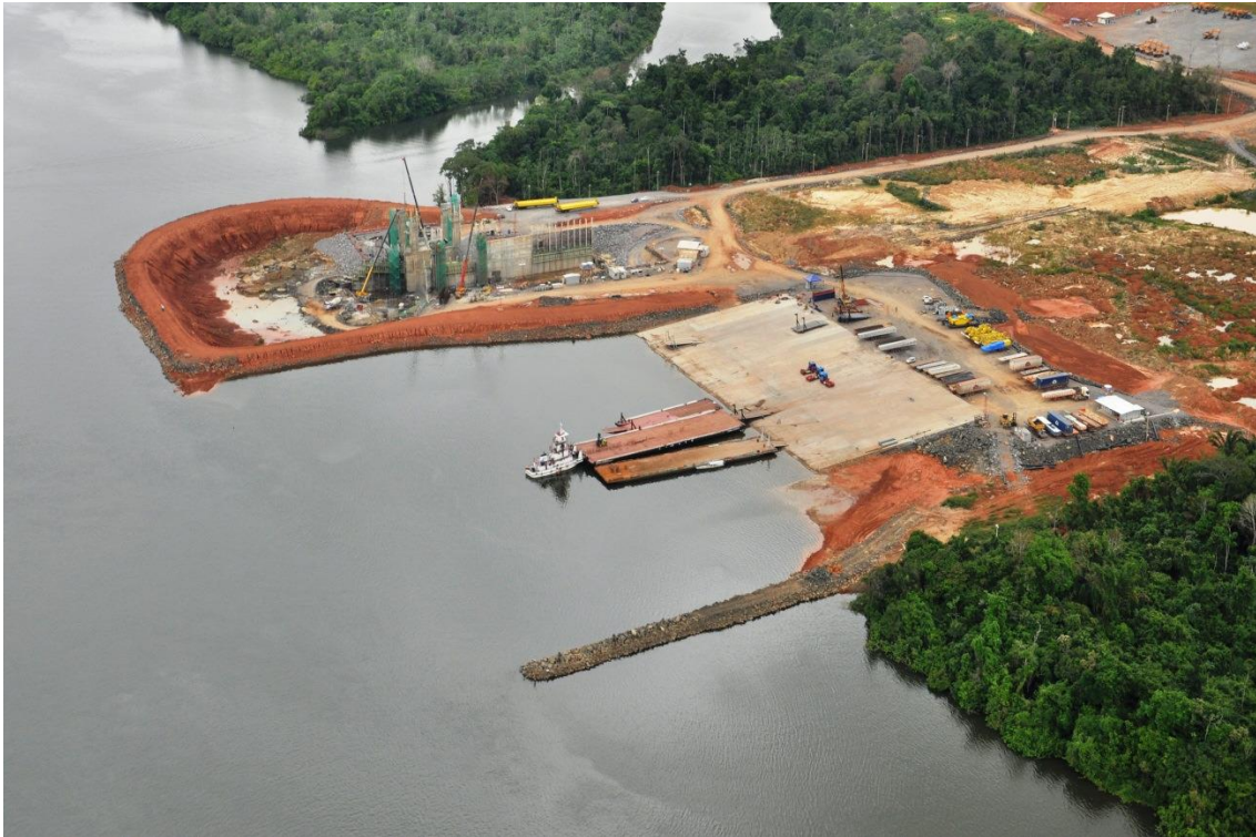
Figura 2 – 1 – Vista geral do Porto fluvial dedicado

Na sequência, encartam-se as Figuras 2-1 a 2-10 com o avanço das obras principais.