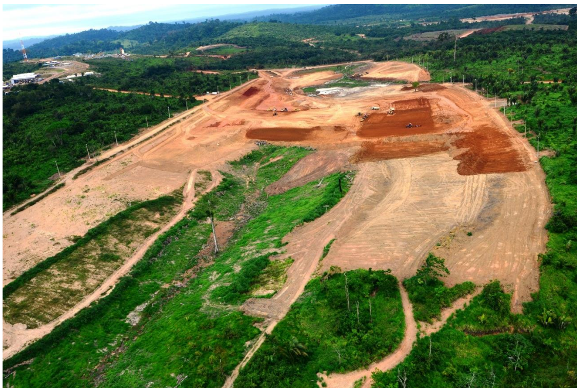
Figura 2 – 20 – Vista geral do Canal de Transposição Ticaruca Cajueiro – CTTC

Na sequência, encartam-se as Figuras 2-20 a 2-23 , ilustrando o avanço das obras relativas aos Canais de Transposição e Diques.