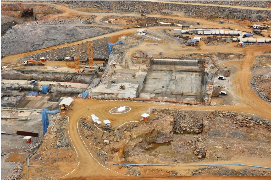
Figura 2 – 12 – Vista geral dos serviços de concretagem para a Casa de Força Principal, Tomada de Água Principal e Área de Montagem