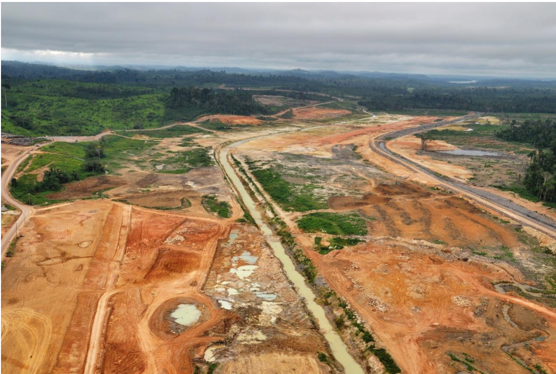
Figura 2 – 18 – Vista geral da canaleta de drenagem central no Canal de Derivação (km 18,5)