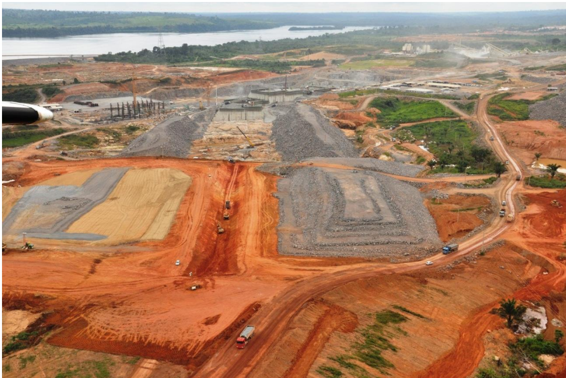
Figura 2 - 8 – Obras de terra em andamento na Barragem de Fechamento Esquerda