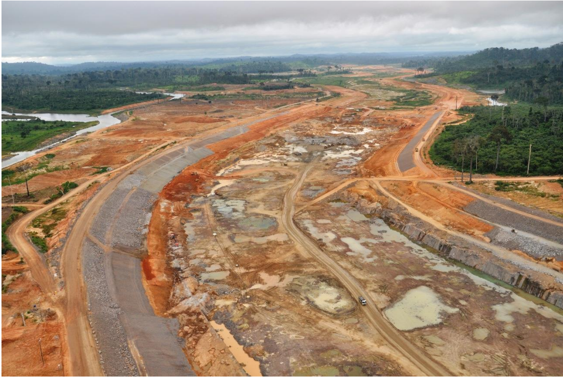
Figura 2 – 17 – Vista geral da área do Canal de Derivação, com serviços de escavação comum e em rocha e proteção dos taludes do canal com enrocamento (km 10 a km 14)