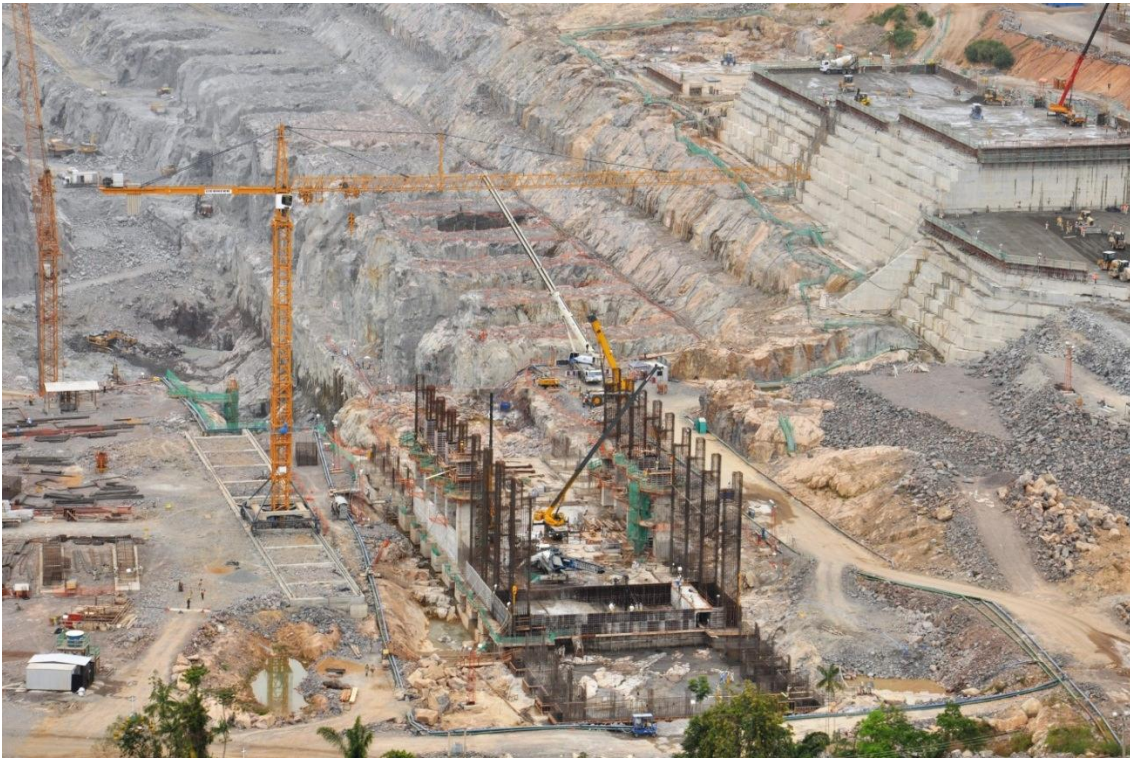
Figura 2 - 7 – Vista dos serviços de concretagem na Área de Montagem