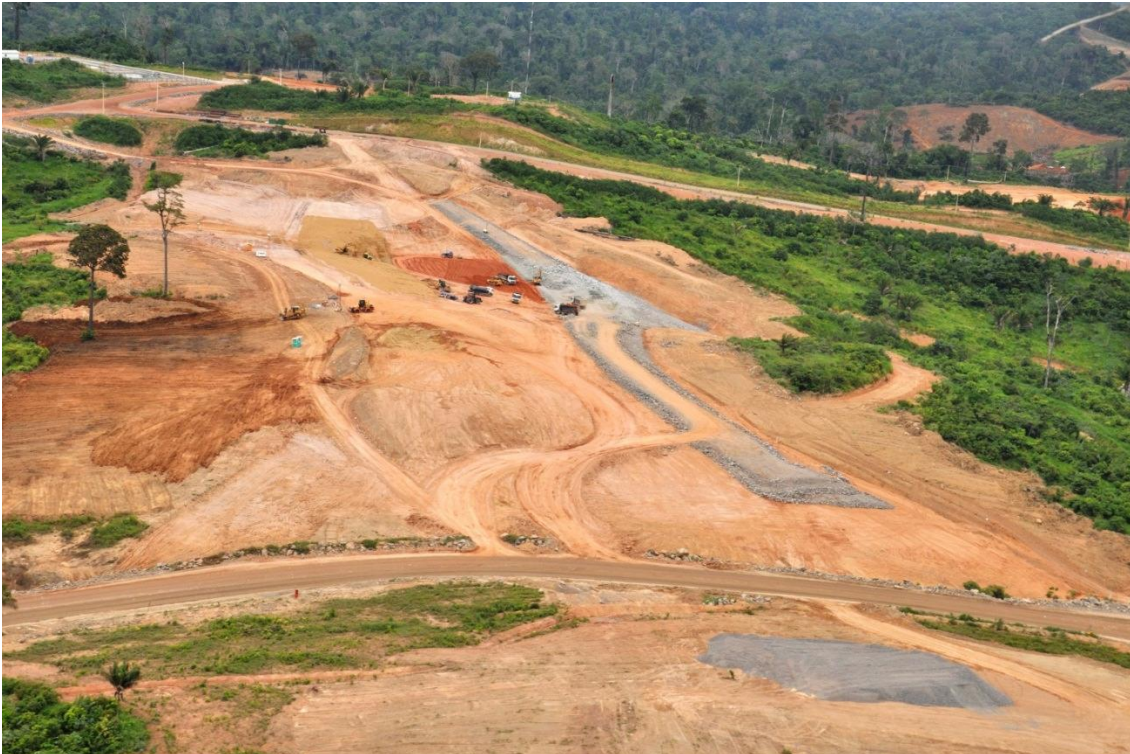
Figura 2 – 9 – Obras de terra em andamento na Barragem de Fechamento Direita