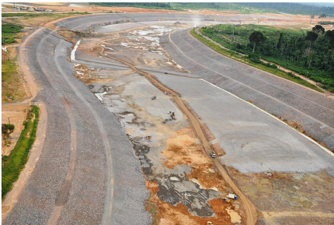
Figura 2 – 19 – Proteção de taludes e do fundo do Canal de Derivação