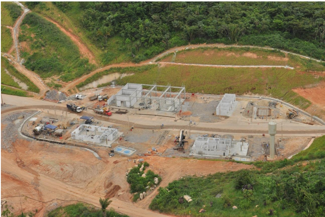
Figura 2 – 15 – Vista geral da área de apoio e oficina no Sistema de Transposição de Embarcações (STE)