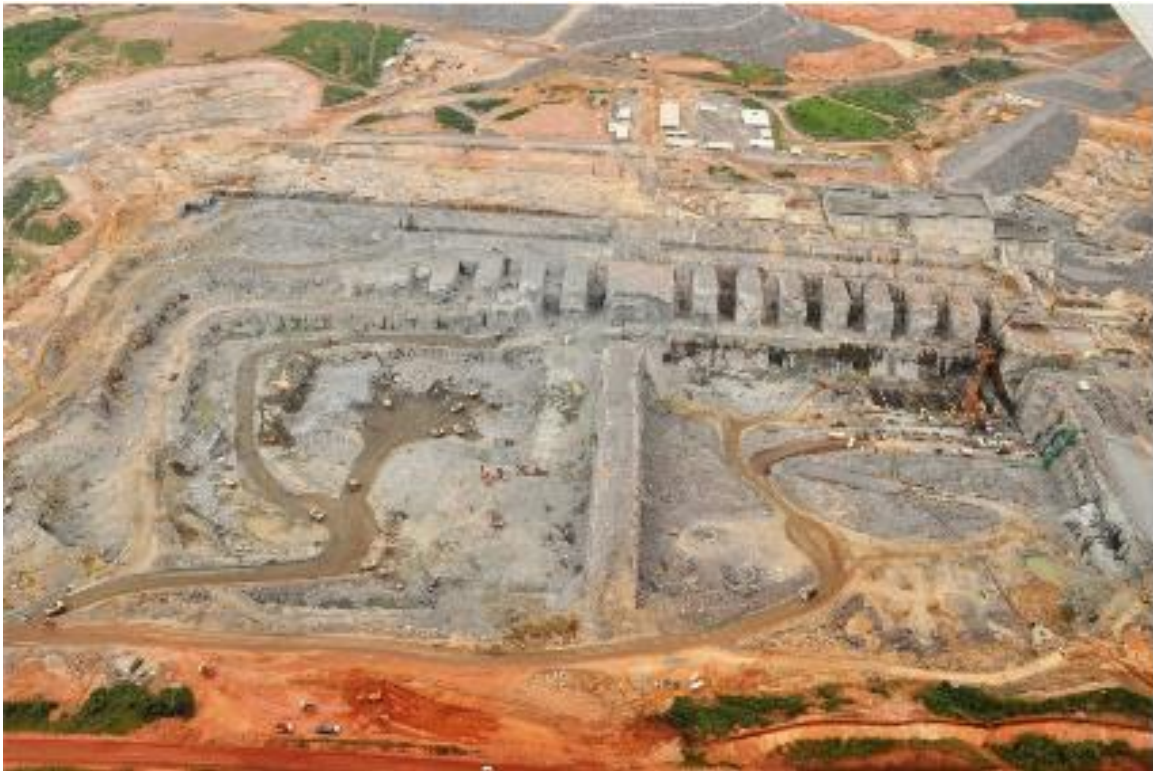
Figura 2 – 4 – Vista de jusante das escavações das estruturas dos Blocos 1 a 18 da Casa de Força Principal