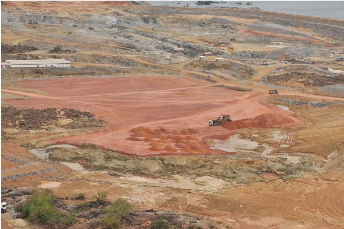
Figura 2 – 14 – Execução do aterro da subestação 230/69/13,8 kV