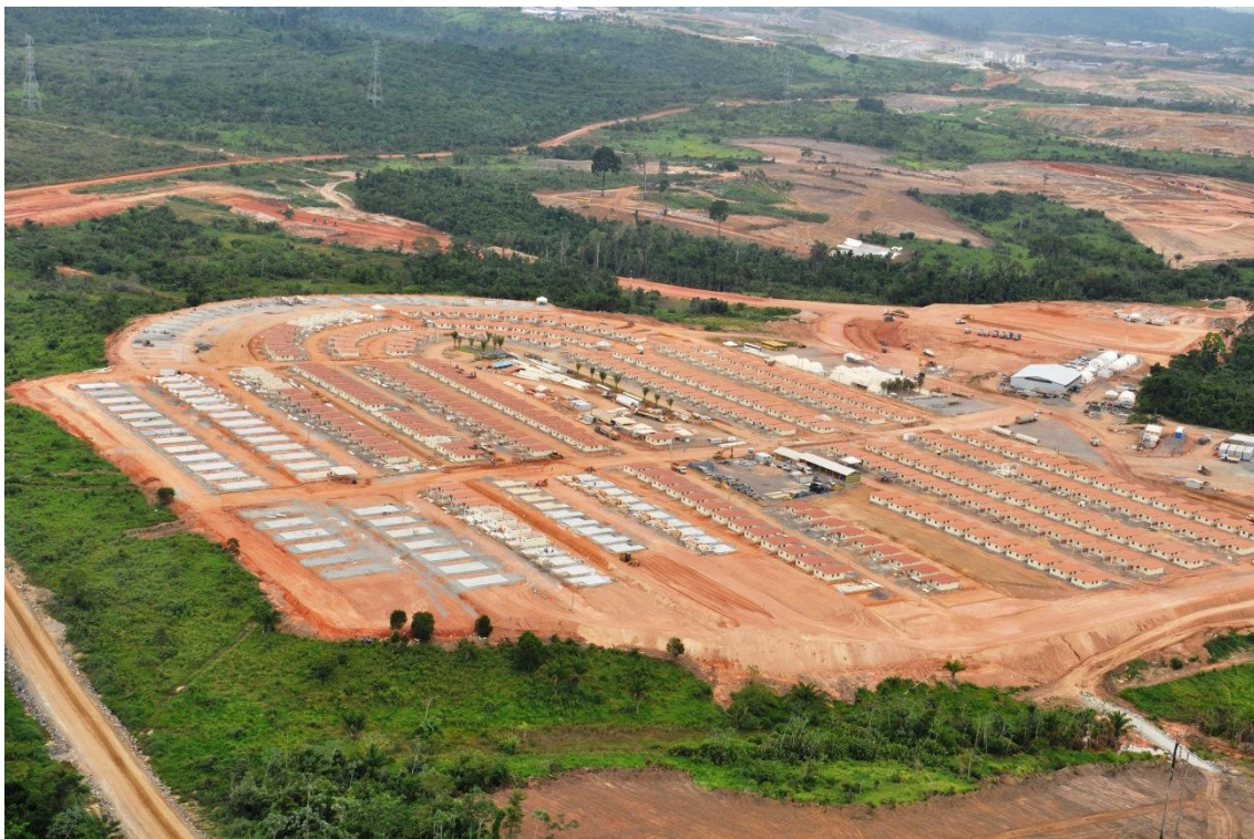
Figura 2 – 2 – Vista geral da Vila Residencial Belo Monte, em implantação