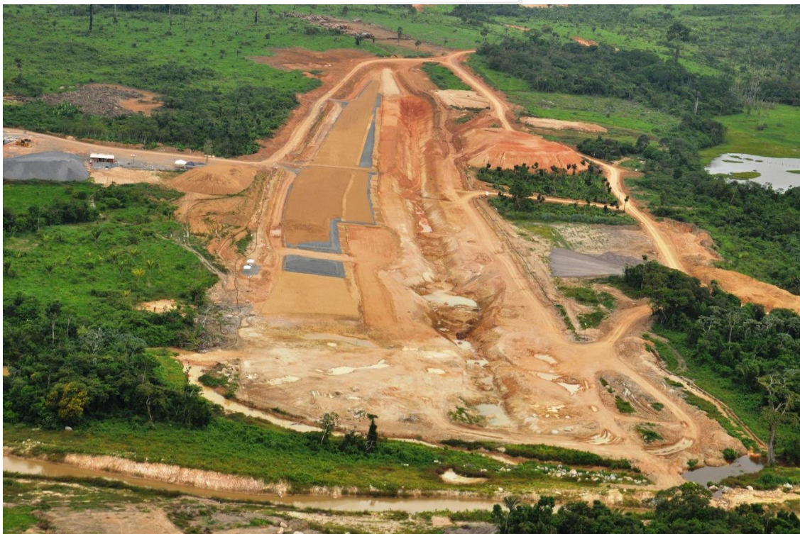
Figura 2 – 23 – Vista geral da área do Dique 28, em execução