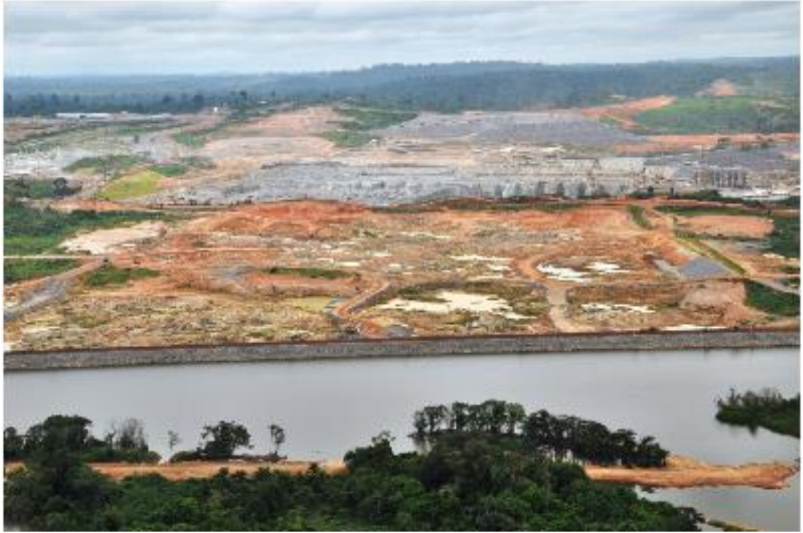
Figura 2 – 3 – Vista de jusante da Ensecadeira de 2ª Fase e Canal de Fuga