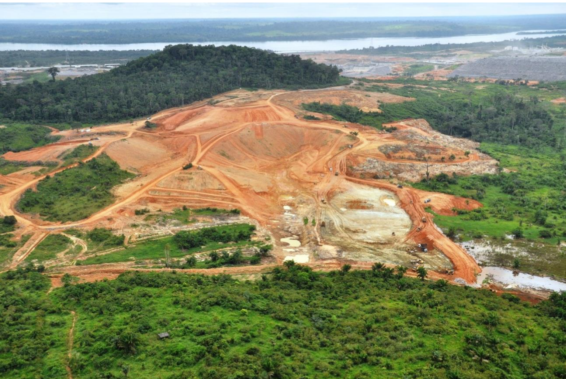
Figura 2 – 10 – Obras de terra em andamento na Barragem Vertente Santo Antônio