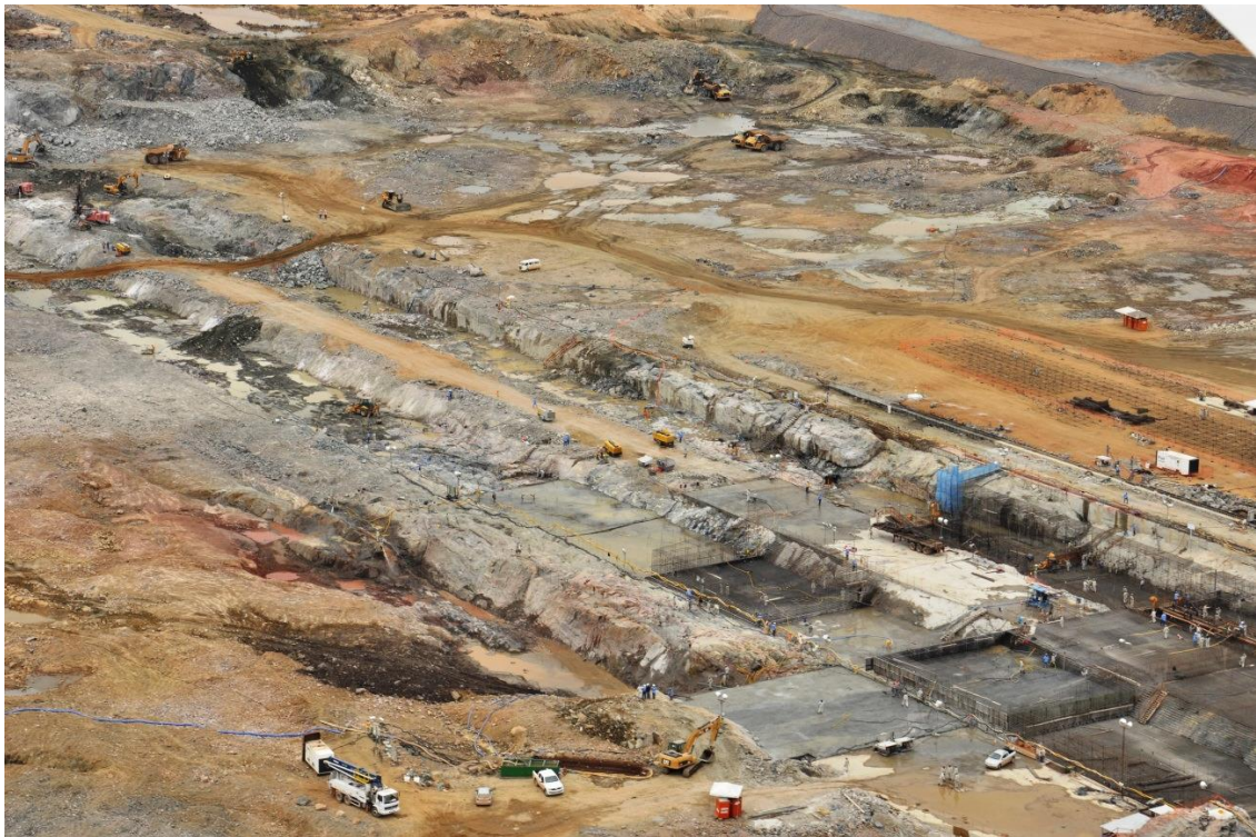
Figura 2 – 13 – Serviços de escavação e de concretagem na área do Vertedouro