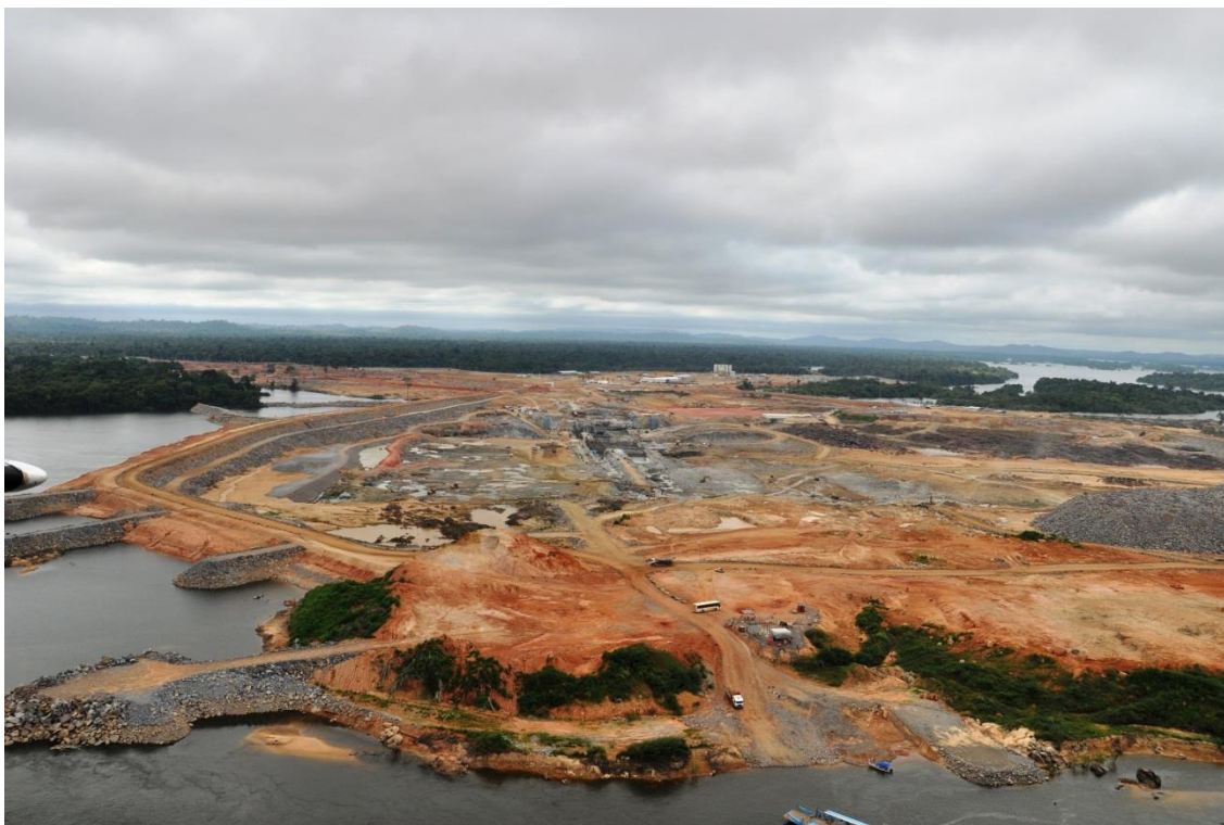
Figura 2 – 11 – Vista geral da área ensecada, na margem direita

Por fim, as Figuras 2-11 a 2-15 ilustram as obras principais no Sítio Pimental.