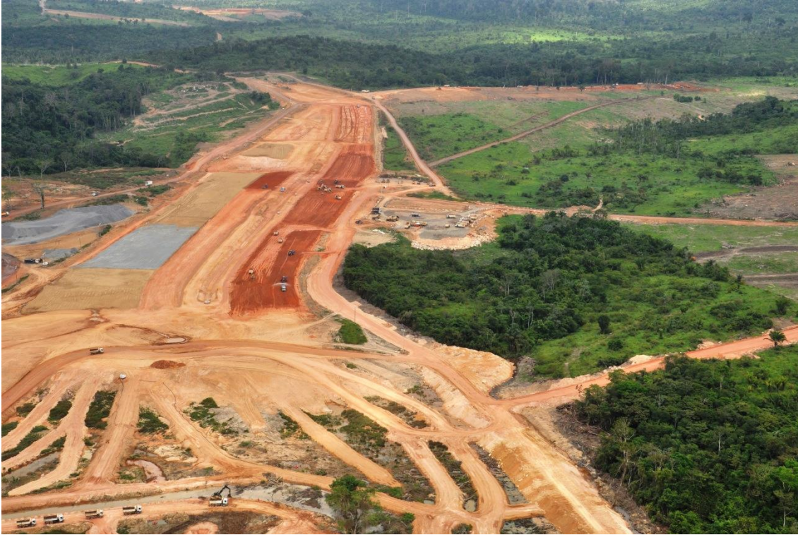
Figura 2 – 21 – Vista geral da área do Reservatório Intermediário e do Dique 13, em execução