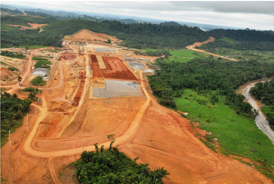
Figura 2 – 22 – Vista geral da área do Reservatório Intermediário e do Dique 19B, em execução