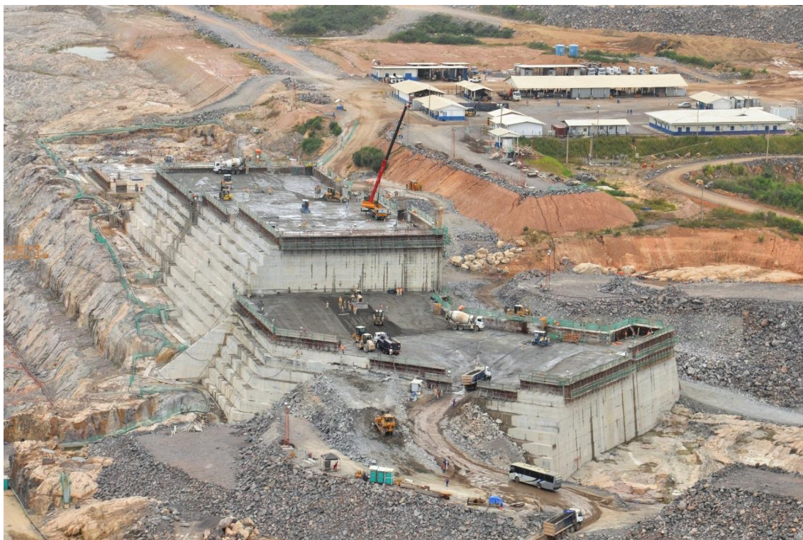
Figura 2 - 6 – Tomada de Água Principal e Muro de Fechamento Esquerdo – Vista da Estrutura de CCR