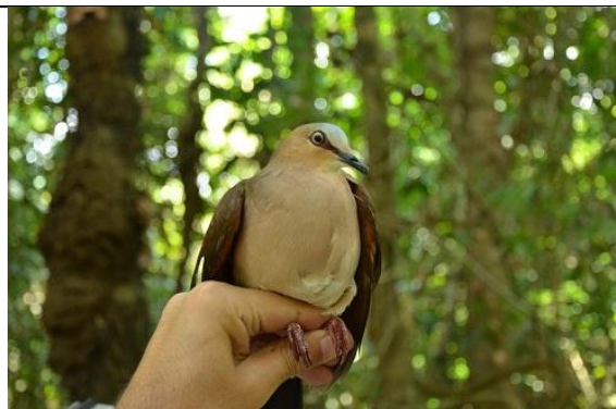
Figura - 21 – Leptotila rufaxilla