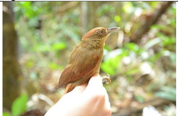
Figura - 14 – Automolus rufipileatus