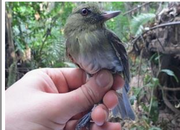
Figura - 11 – Attila spadiceus