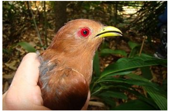
Figura - 2 – Coccycua minuta