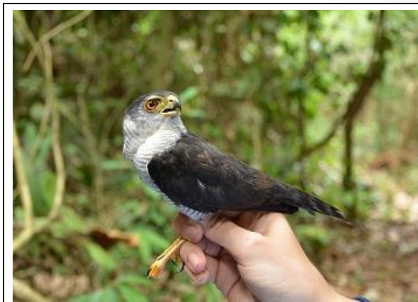
Figura - 17 – Accipiter superciliosus