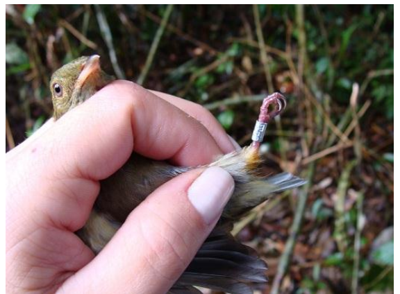
Figura - 6 – Espécime anilhado