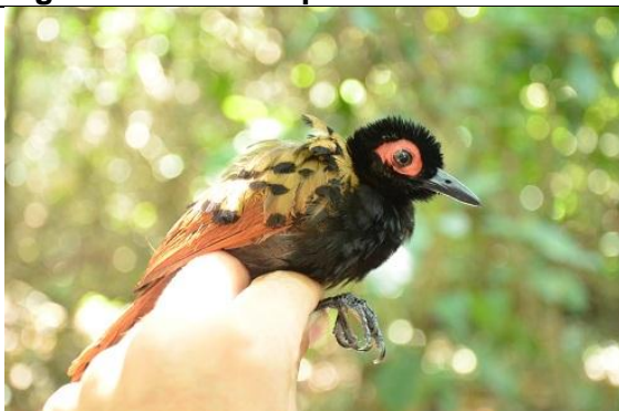
Figura - 24 - Phlegopsis nigromaculata