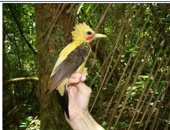
Figura - 18 – Celeus flavus