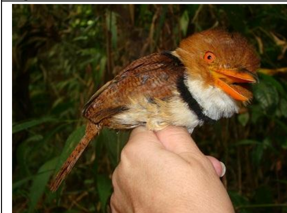
Figura - 15 – Bucco capensis