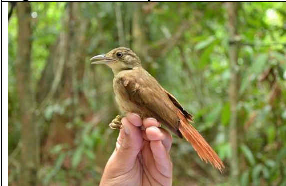
Figura - 13 – Automolus paraensis