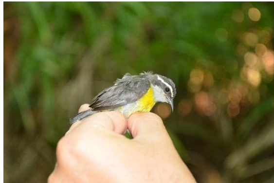
Figura - 3 – Coereba flaveola