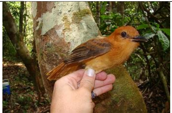
Figura - 10 – Attila cinnamomeus