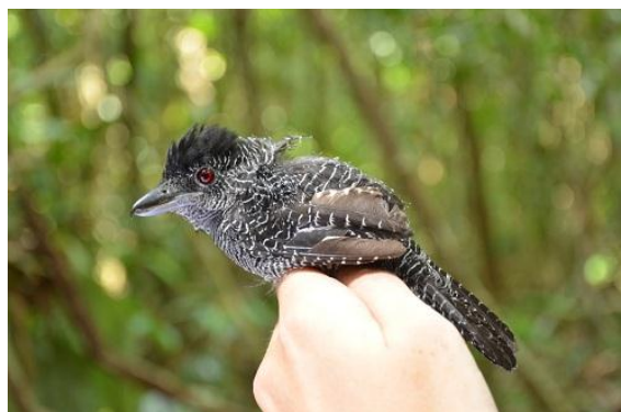
Figura - 19 – Cymbilaimus lineatus Macho