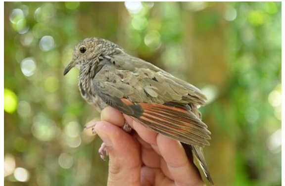
Figura - 4 – Columbina passerina