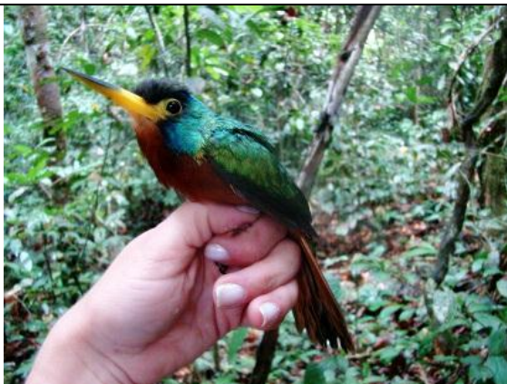
Figura - 20 – Galbula cyanicollis