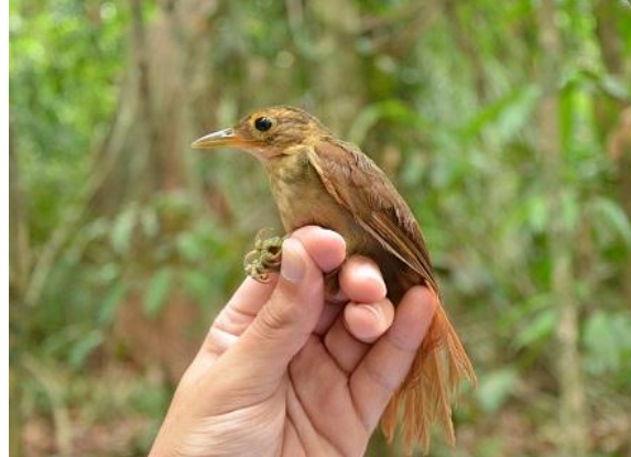
Figura - 12 – Automolus ochrolaemus