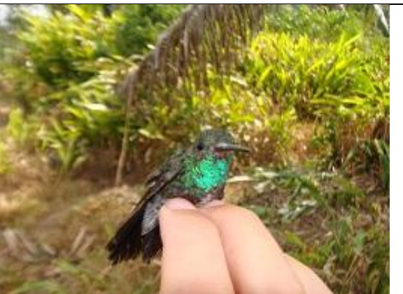
Figura - 8 – Amazilia versicolor