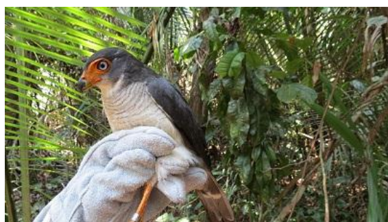
Figura - 23 – Micrastur mintoni