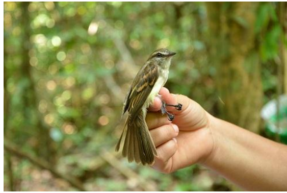
Figura - 1 – Cnemotricus fuscatus