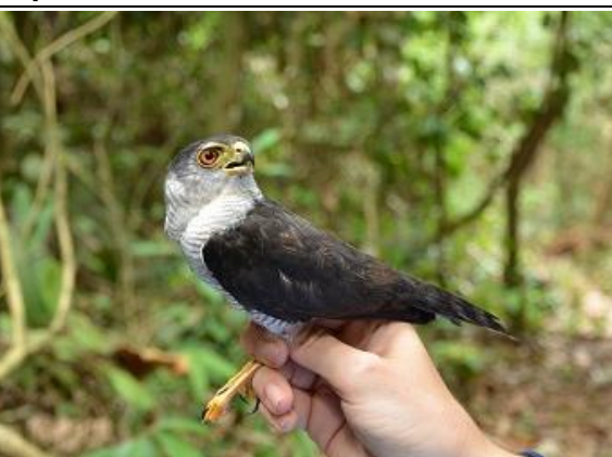
Figura - 7 – Accipiter superciliosus