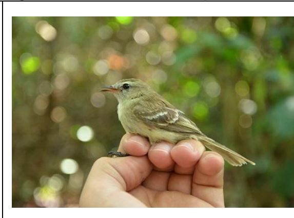
Figura - 16 – Camptostoma obsoletum