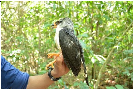
Figura - 22 - Leucopternis kuhli