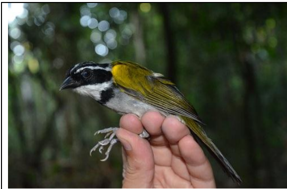
Figura - 9 – Arremon taciturnus