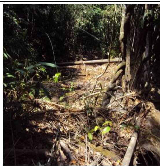
Figura 37– SEBM – IG. STO ANTONIO.