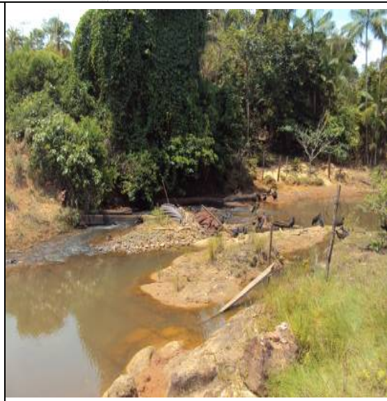
Figura 35 – PACBM-J – STA HELENA – JUSANTE CANTEIRO BELO MONTE