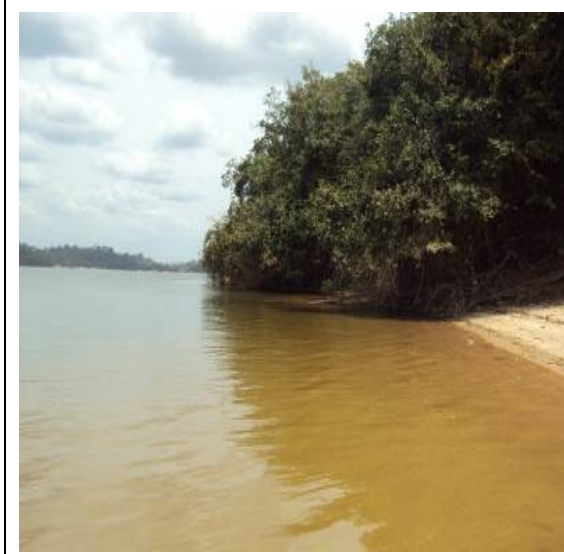
Figura 9 – RX 17