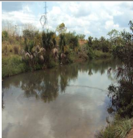
Figura 34 – PCIBM LAGOA