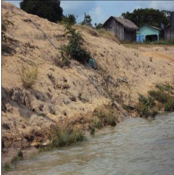
Figura 3 – RESSACA