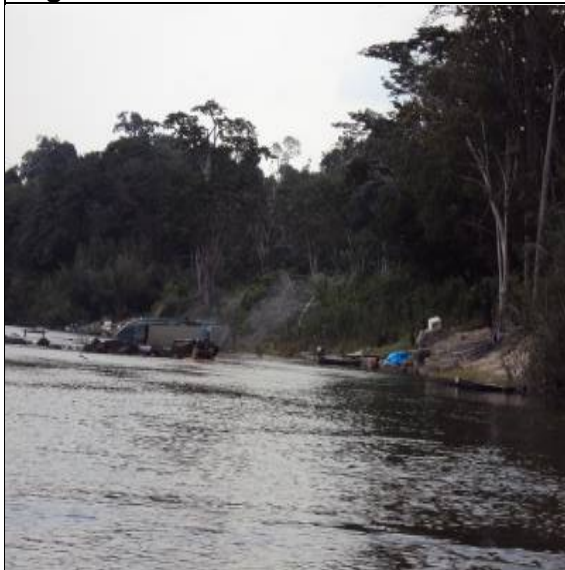
Figura 5 – RX 20