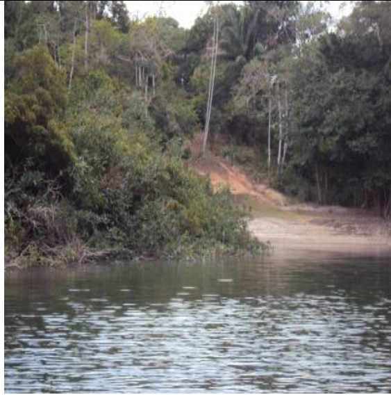
Figura 13 – IGCHOCAÍ