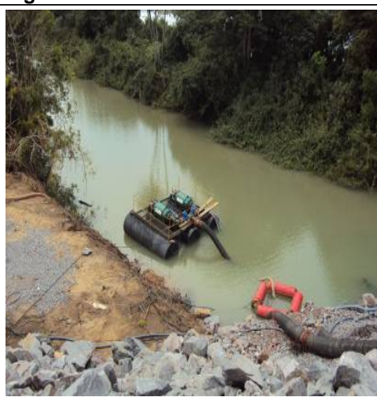
Figura 45 – PTO 02