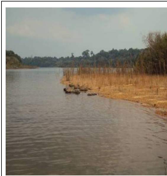
Figura 7 – RX 06