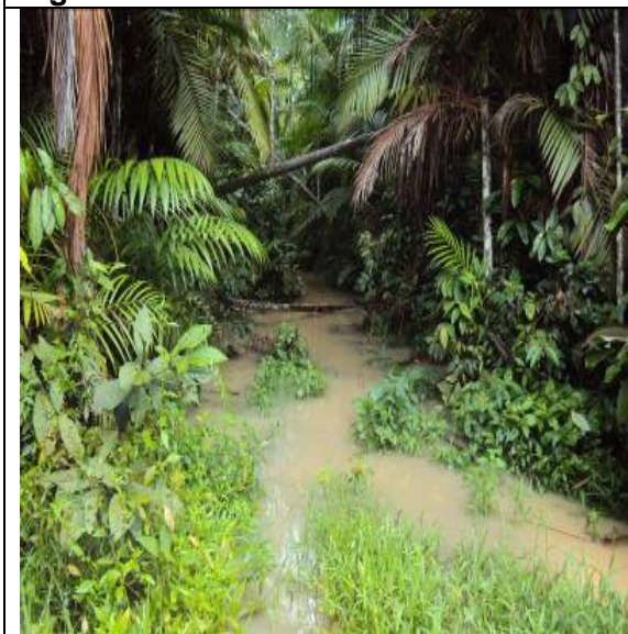
Figura – 44 – PTO 01