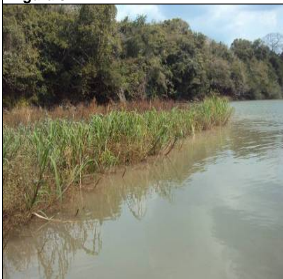
Figura – 11 – BAC 02