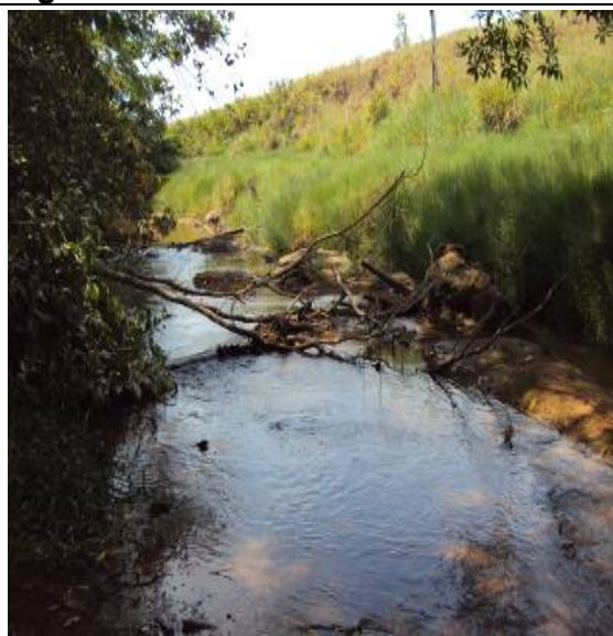
Figura – 38 – PACBM-M – STA HELENA MONTANTE