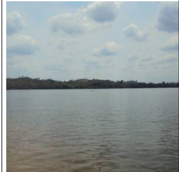
Figura 10 – RX 11