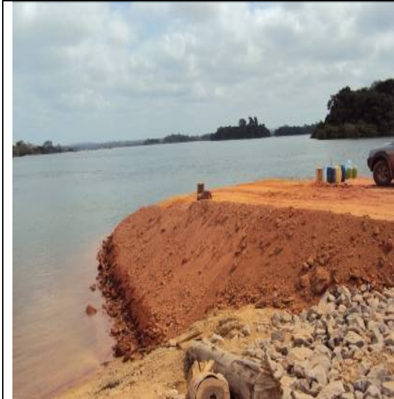
Figura 42 – SEPIM