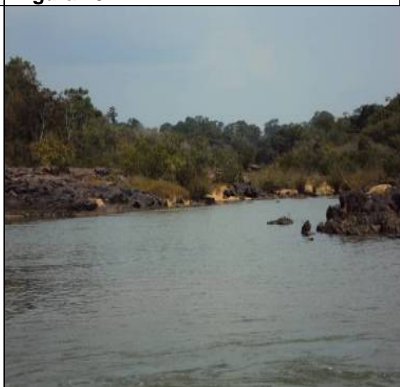
Figura 12 – BAC 03