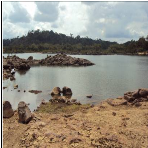
Figura 8 – RX 21