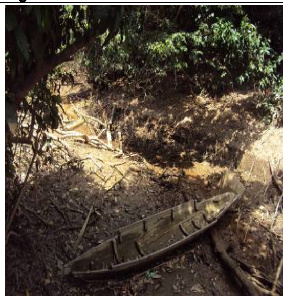
Figura 39 – RX 07 – FOZ STO ANTONIO COM XINGU