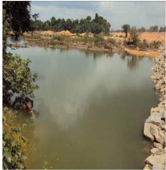
Figura 41– PACPIM-M