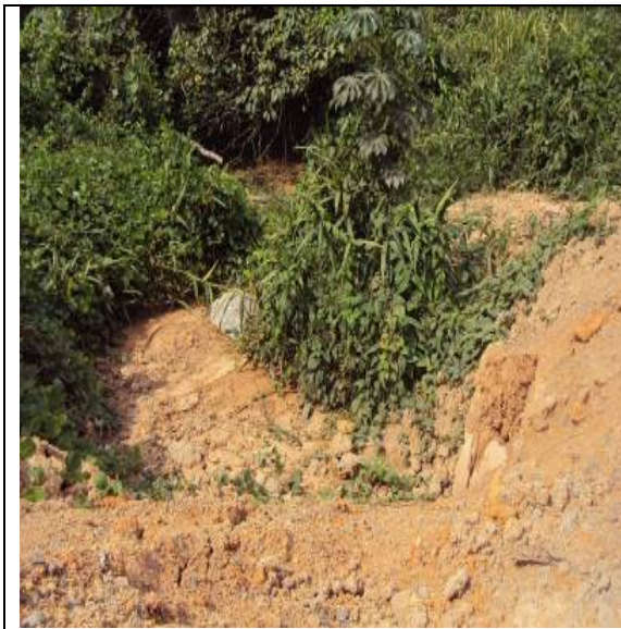
Figura 40 – PACPIM-J