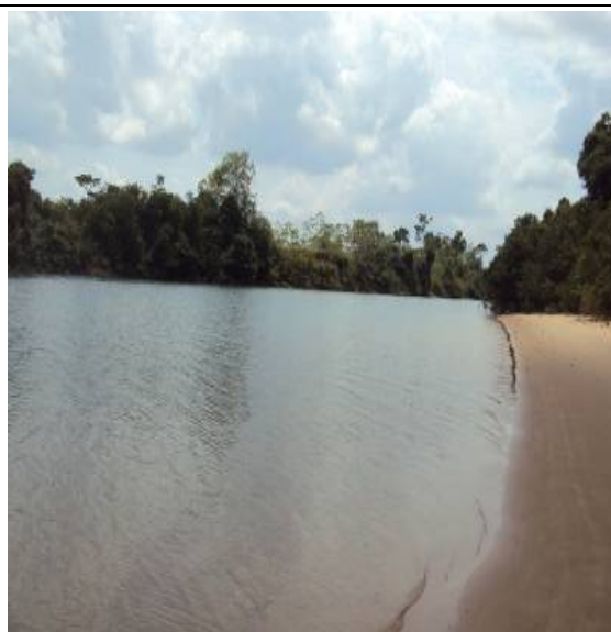
Figura 36 – RXTP