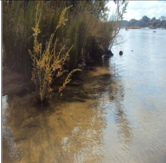
Figura 4 – RX 04