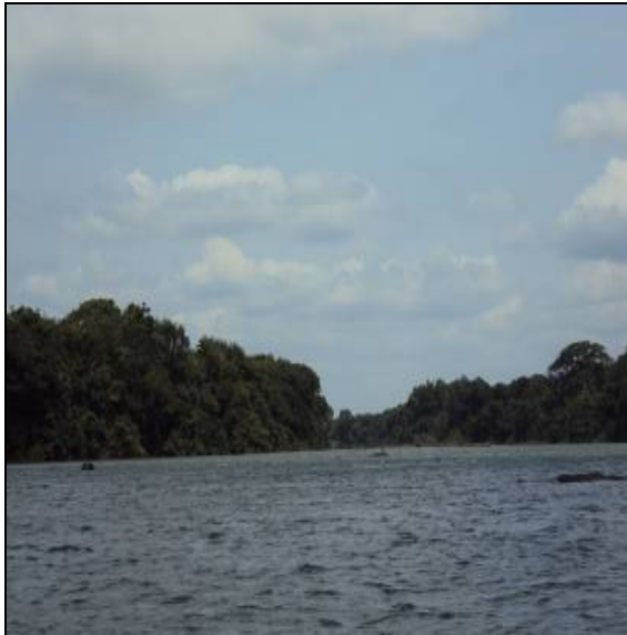
Figura 1 – RX 23