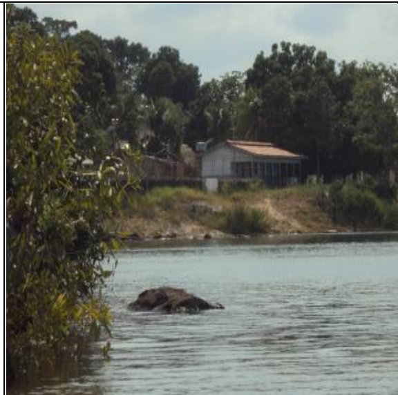
Figura 2 – FAZENDA