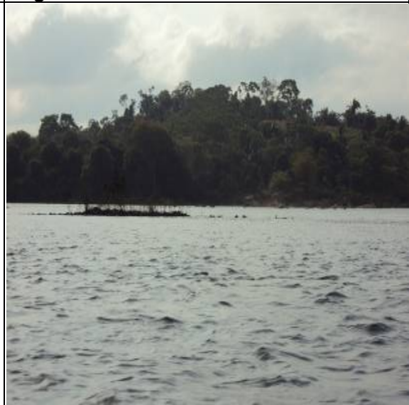
Figura 6 – RX 05