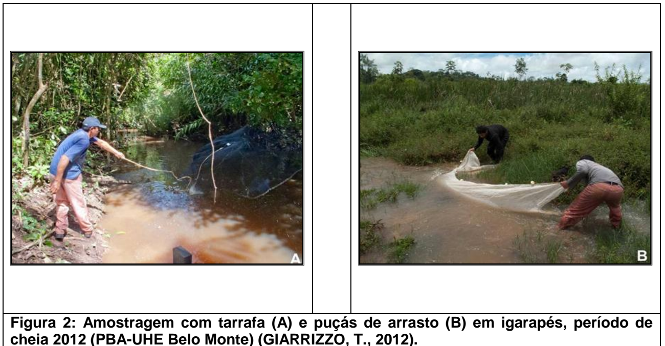
Figura 2: Amostragem com tarrafa (A) e puçás de arrasto (B) em igarapés, período de cheia 2012 (PBA-UHE Belo Monte) (GIARRIZZO, T., 2012).

Quando a largura do igarapé não permitiu o bloqueio (como nos igarapés de segunda ou terceira ordem, que transbordaram no período chuvoso) as amostras foram padronizadas pelo esforço, sendo utilizadas dez amostragens de peneiras, dez de tarrafas e três arrastos com rede em cada igarapé amostrado. Estes últimos foram realizados de forma equidistantes e buscando a menor interferência entre eles, evitando afugentar os peixes.