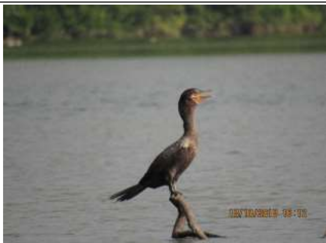
Figura - 4 - Nannopterum brasilianus (Biguá).