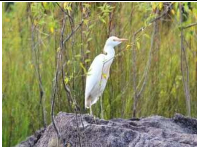
Figura - 8 – Bubulcus ibis (Garça-vaqueira).