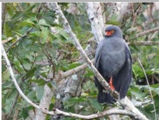
Figura - 36 – Buteogallus schistaceus (Gavião-azul).