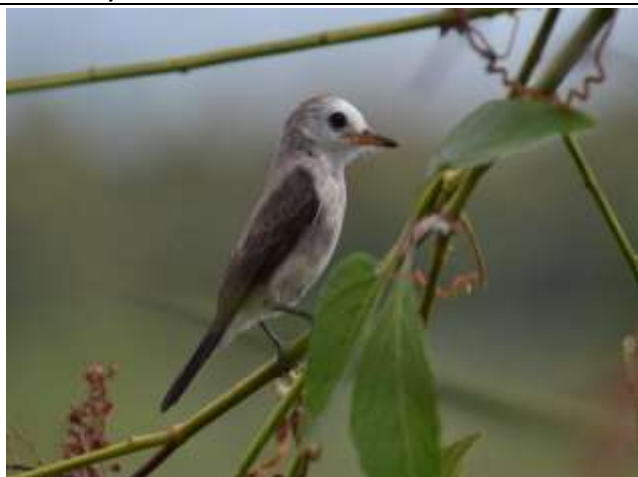
Figura - 46 – Arundinicola leucocephala (Freirinha).