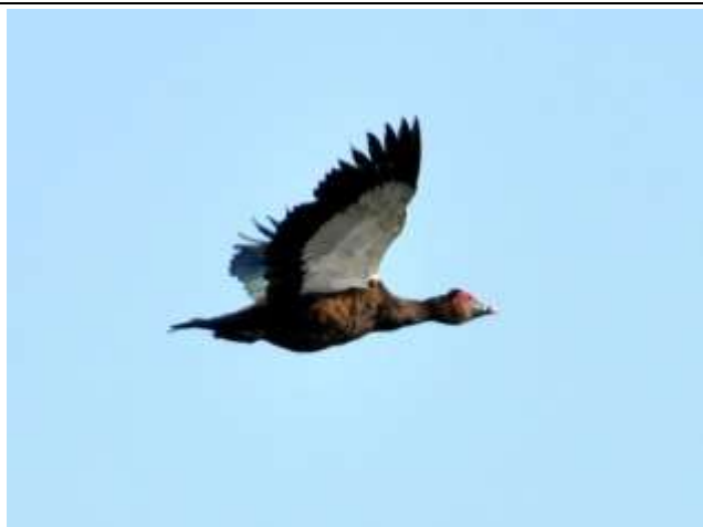
Figura - 2 - Cairina moschata (Pato-do-mato).