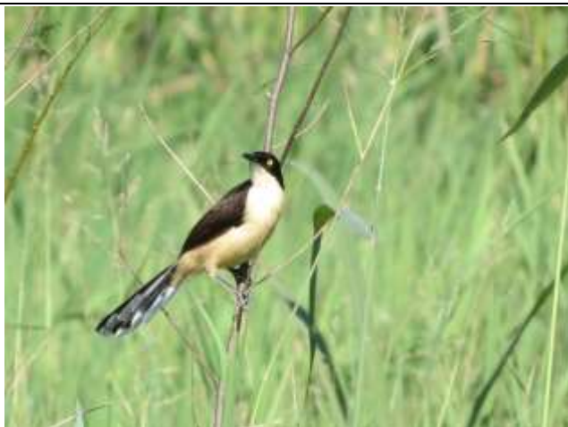
Figura - 51 - Donacobius atricapilla (Japacanim).