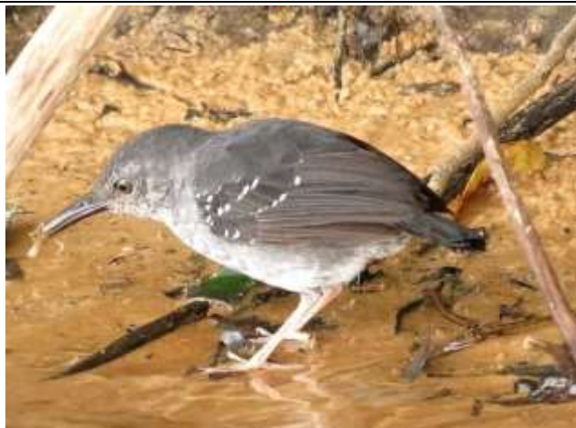
Figura - 42 – Sclateria naevia (Papa-formiga-do-igarapé).