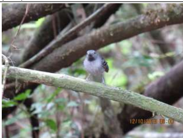
Figura - 40 – Hypocnemoides maculicauda (Solta-asa).