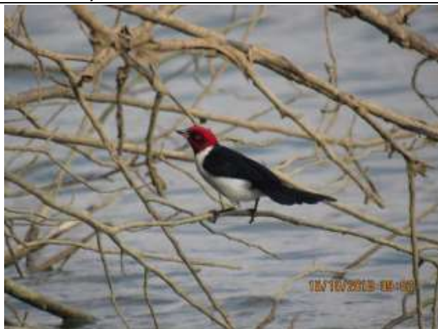
Figura - 52 - Paroaria gularis (Cardeal-da-amazônia).