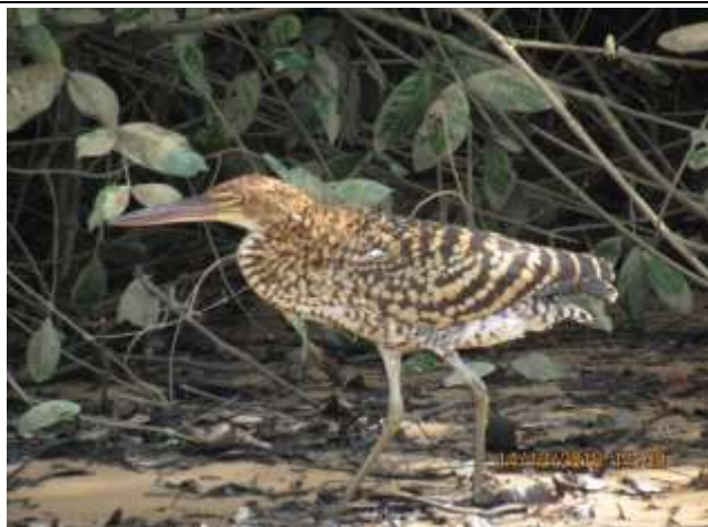
Figura - 6 - Tigrisoma lineatum (Socó-boi).