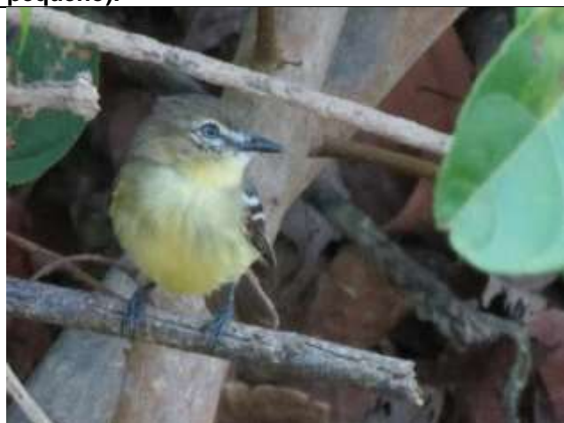
Figura - 55 – Inezia subflava (Amarelinho).