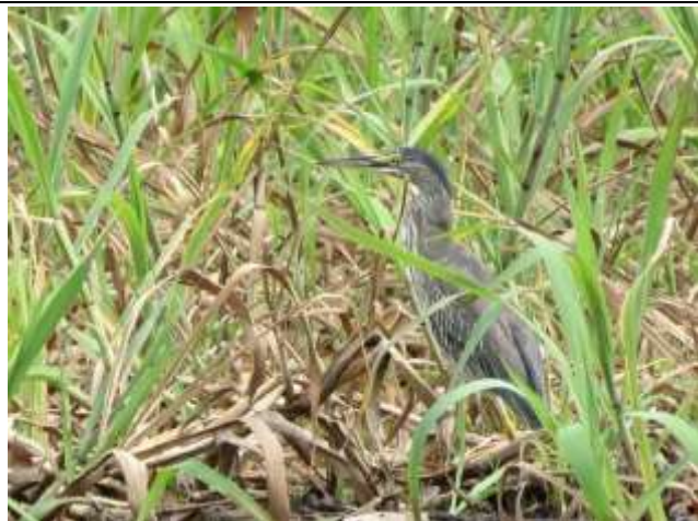
Figura - 7 – Butorides striata (Socozinho).