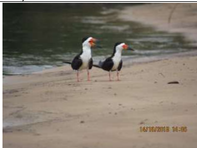
Figura - 30 – Rynchops niger (Talha-mar).