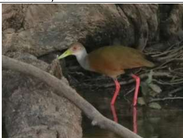
Figura - 62 – Aramides cajaneus (Saracura-três-potes).