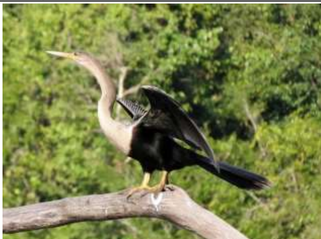
Figura - 5 - Anhinga anhinga (Biguatinga).