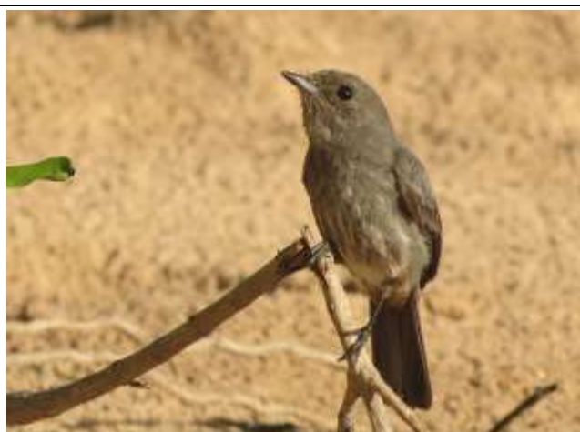
Figura - 39 – Knipolegus orenocensis (Maria-preta-ribeirinha).