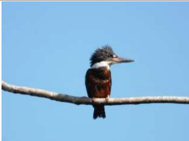
Figura - 31 – Megaceryle torquata (Martim-pescador-grande).