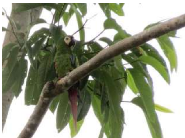
Figura - 54 – Ara severus (Maracanã-guaçu).