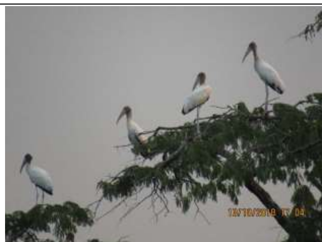
Figura - 56 – Mycteria americana (Cabeça-seca).