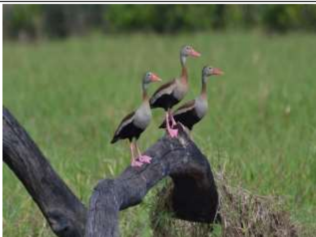
Figura - 1 - Dendrocygna autumnalis (Asa-branca).