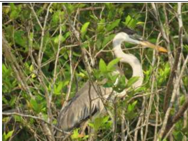
Figura - 9 – Ardea cocoi (Garça-moura).