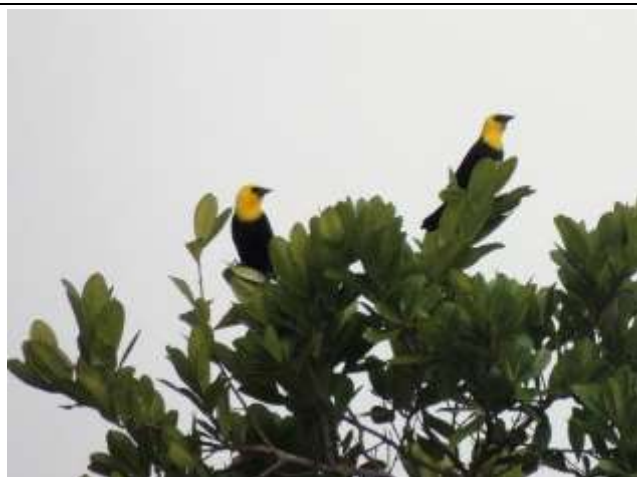
Figura - 53 – Chrysomus icterocephalus (Iratauí-pequeno).