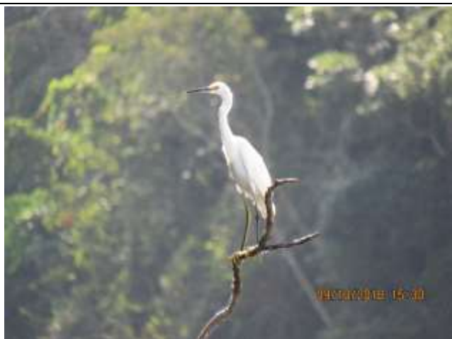
Figura - 10 – Egretta thula (Garça-branca-pequena).