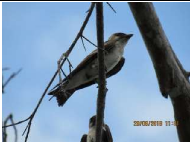
Figura - 48 - Jovens de Progne tapera (Andorinha-do-campo).