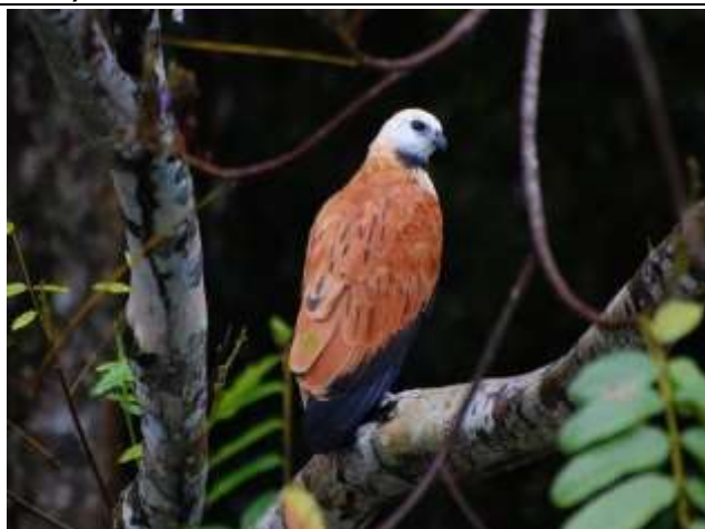
Figura - 16 – Busarellus nigricollis (Gavião-belo).