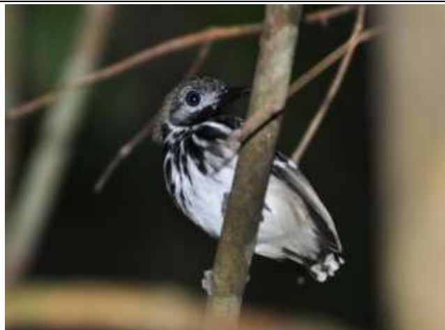
Figura - 41 – Hylophylax punctulatus (Guarda-várzea).