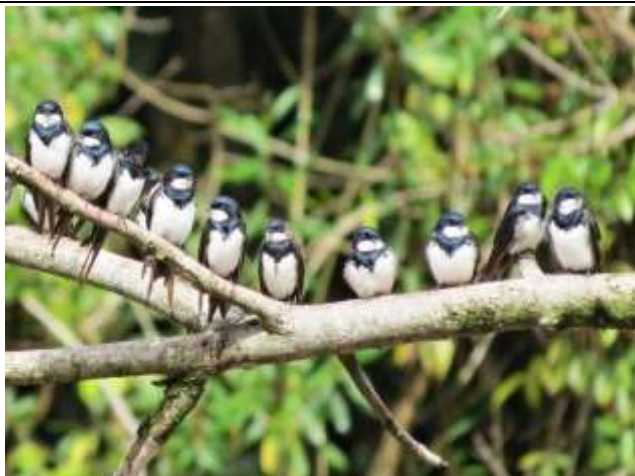
Figura - 47 - Pygochelidon melanoleuca (Andorinha-de-coleira).