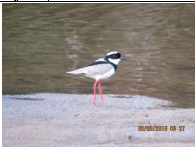
Figura - 22 – Vanellus cayanus (Batuíra-de-esporão).