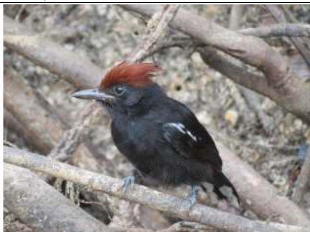
Figura - 43 – Sakesphorus luctuosus (Choca-d'água).