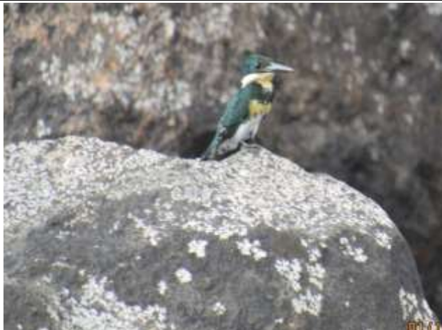
Figura - 33 – Chloroceryle americana (Martim-pescador-pequeno).