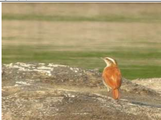
Figura - 44 – Furnarius figulus (Casaca-de-couro-da-lama).