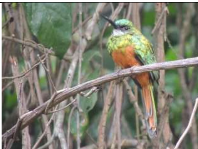
Figura - 61 – Galbula ruficauda (Ariramba-de-cauda-ruiva).