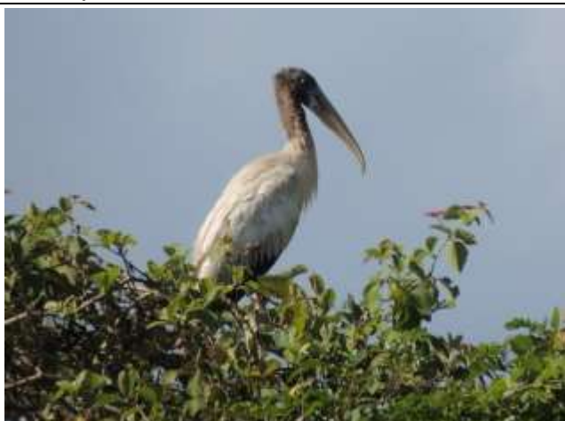
Figura - 3 - Jovem de Mycteria americana (Cabeça-seca).