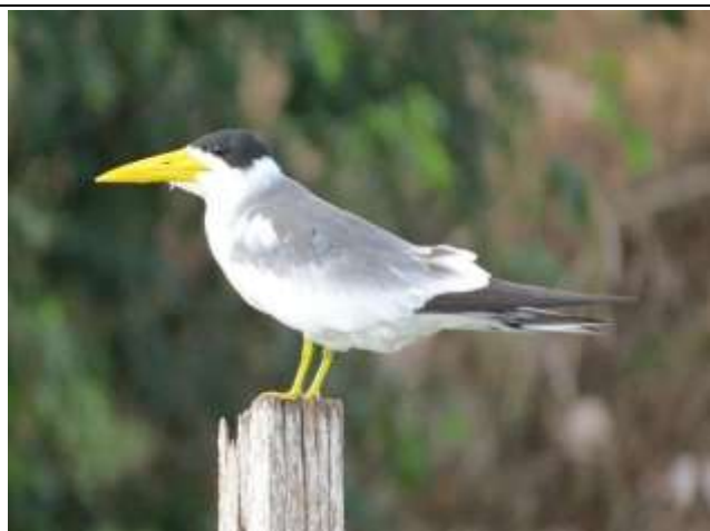
Figura - 29 – Phaetusa simplex (Trinta-réis-grande).