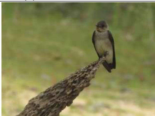
Figura - 50 - Stelgidopteryx ruficollis (Andorinha-serradora).