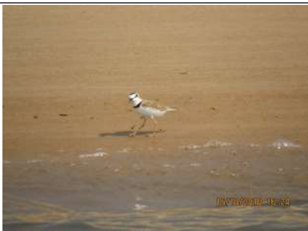
Figura - 23 – Charadrius collaris (Batuíra-de-coleira).