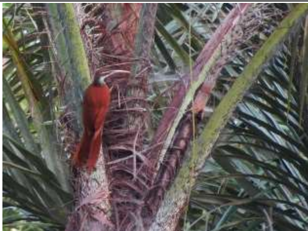
Figura - 59 – Nasica longirostris (Arapaçú-de-bico-comprido).