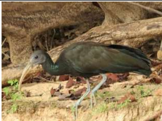
Figura - 14 – Mesembrinibis cayennensis (Corócoró).