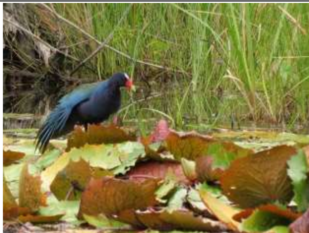
Figura - 20 – Porphyrio martinicus (Frango-d'água-azul).