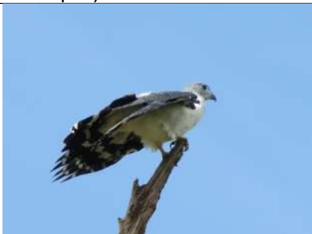
Figura - 61 – Leptodon cayanensis (Gavião-de-cabeça-cinza).