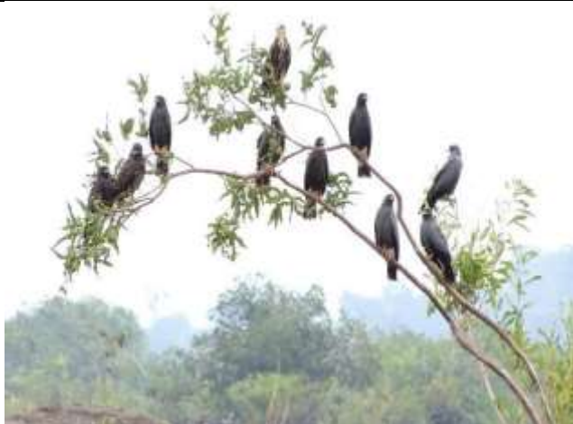
Figura - 17 – Rostrhamus sociabilis (Gavião-caramujeiro).