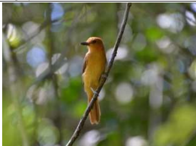
Figura - 45 – Attila cinnamomeus (Tinguaçu-ferrugem).