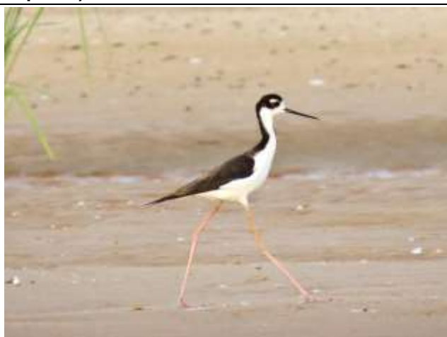
Figura - 24 – Himantopus mexicanus (Pernilongo-de-costas-negras).