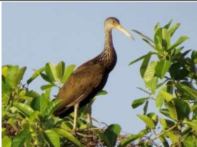
Figura - 19 – Aramus guarauna (Carão).