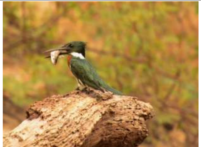
Figura - 32 – Chloroceryle amazona (Martim-pescador-verde).