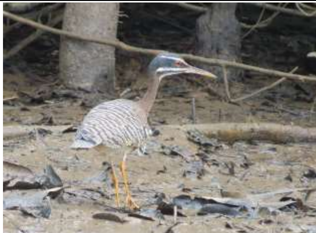
Figura - 18 – Eurypyga helias (Pavãozinho-do-Pará).