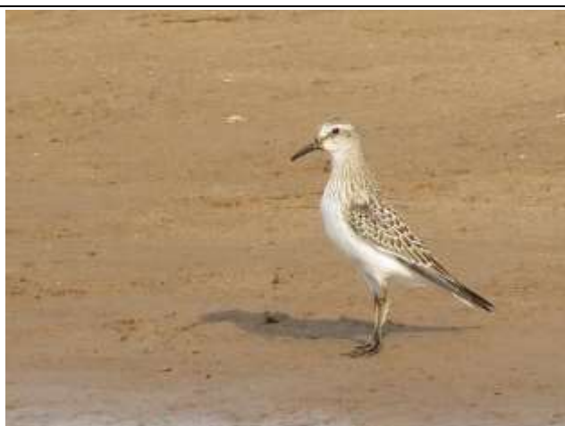
Figura - 62 – Calidris fuscicollis (Maçarico-de-sobre-branco).