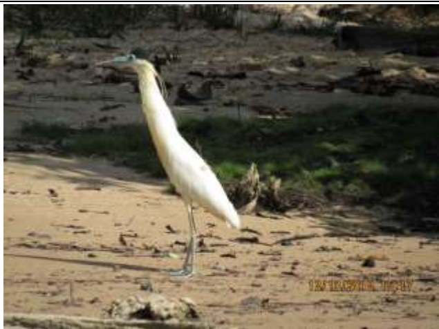
Figura - 13 – Pilherodius pileatus (Garça-real).