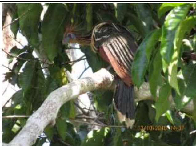
Figura - 37 – Opisthocomus hoazin (Cigana).