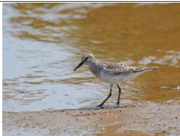
Figura - 26 – Calidris fuscicollis (Maçarico-de-sobre-branco).