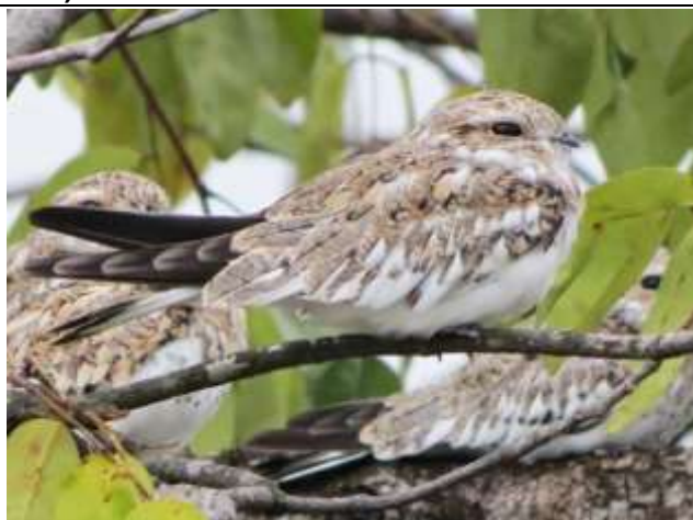
Figura - 38 – Chordeiles rupestris (Bacurau-da-prata).