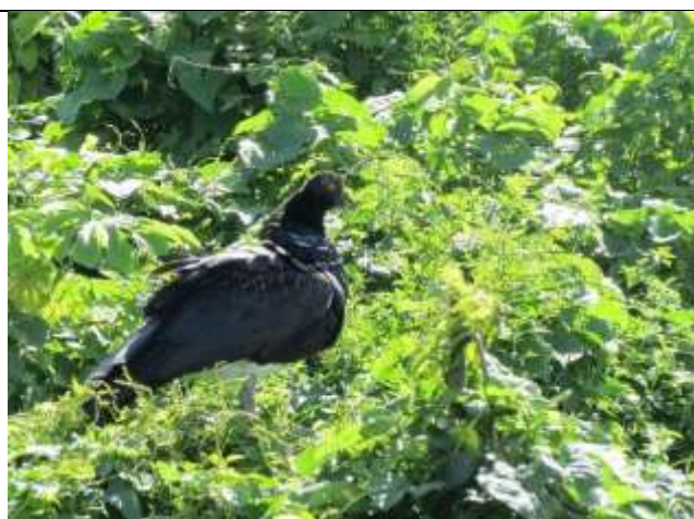
Figura - 57 – Anhima cornuta (Anhuma).