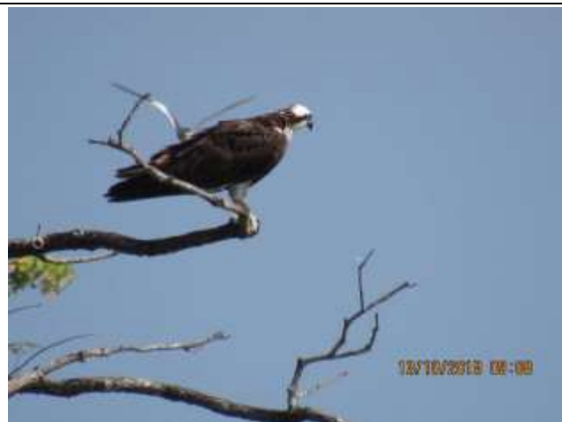
Figura - 15 – Pandion haliaetus (Águia-pescadora).