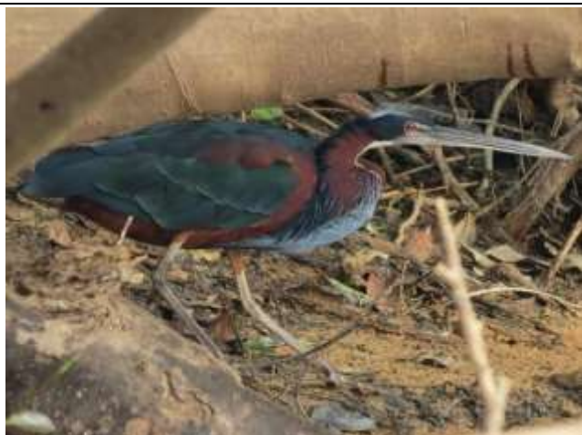
Figura - 12 – Agamia agami (Garça-tricolor).