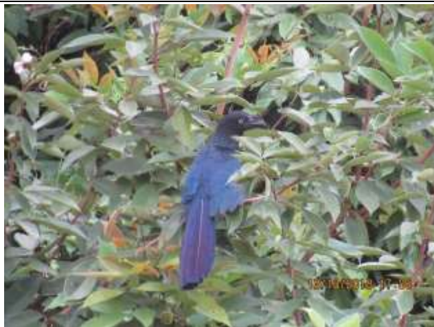
Figura - 60 – Crotophaga major (Anu-coroca).