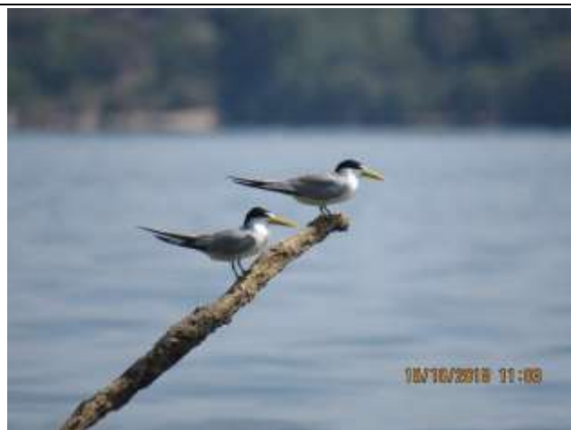
Figura - 28 – Sternula superciliaris (Trinta-réis-anão).