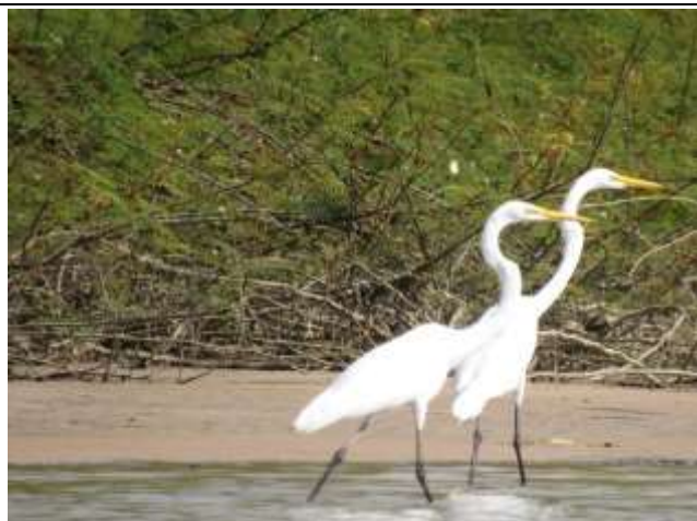
Figura - 11 – Ardea alba (Garça-branca-grande).