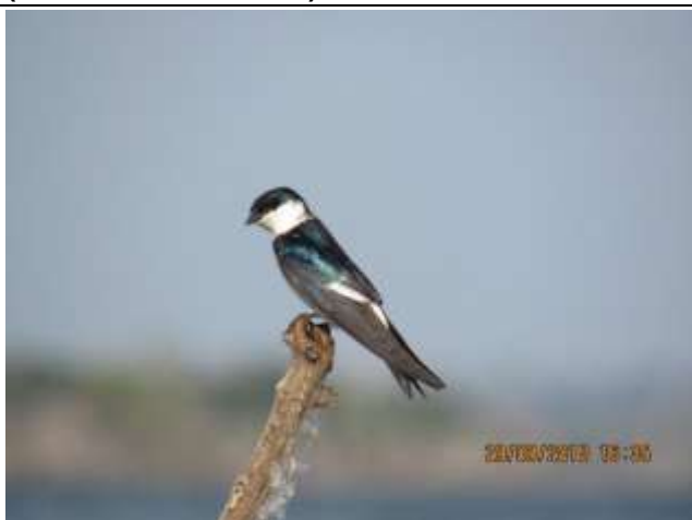
Figura - 49 - Tachycineta albiventer (Andorinha-do-rio).