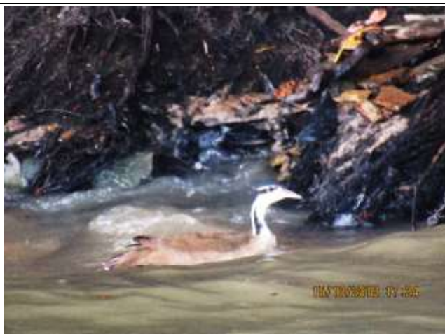
Figura - 21 – Heliornis fulica (Picaparra).