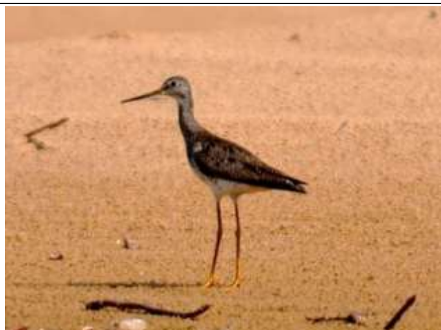
Figura - 25 – Tringa flavipes (Maçarico-de-perna-amarela).