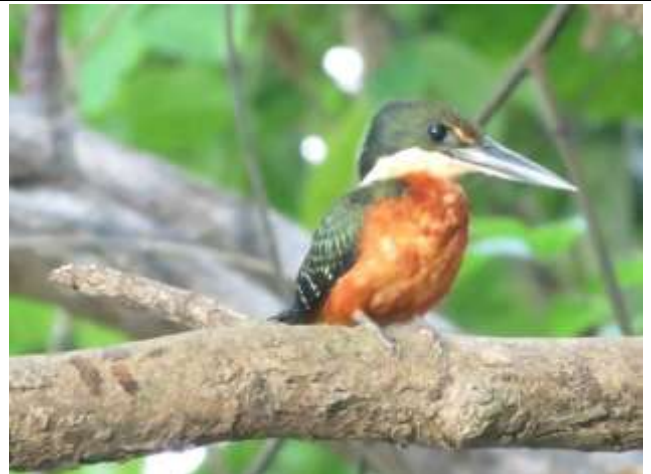
Figura - 34 – Chloroceryle inda (Martim-pescador-da-mata).