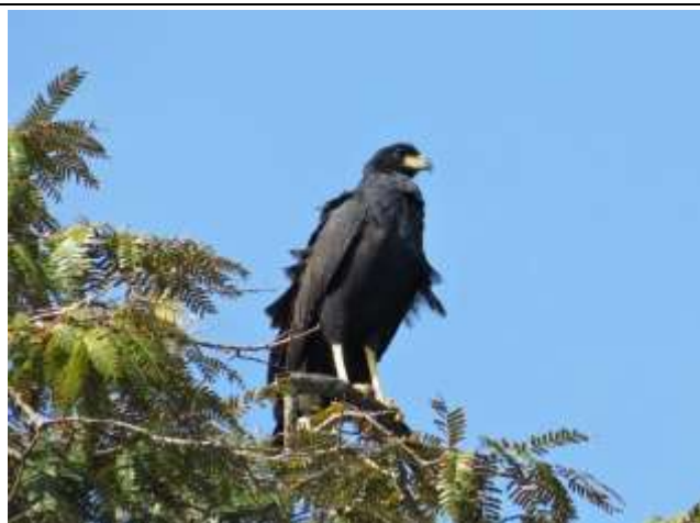
Figura - 35 – Urubitinga urubitinga (Gavião-preto).