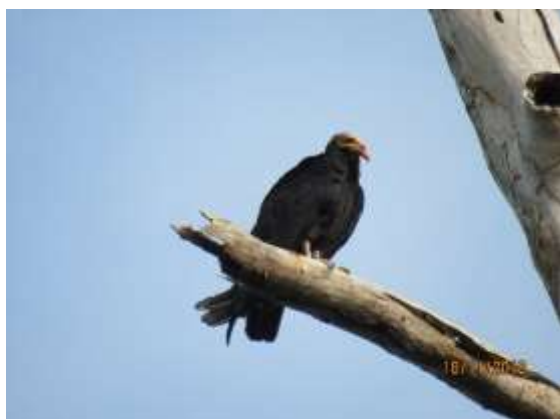
Figura 13 – Urubu-da-mata ( Cathartes melambrotus ) registrada no módulo M3.