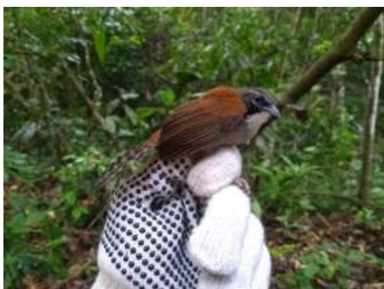
Figura 65 – Garrinchão-coraia ( Pheugopedius coraya ) registrada no módulo M6.