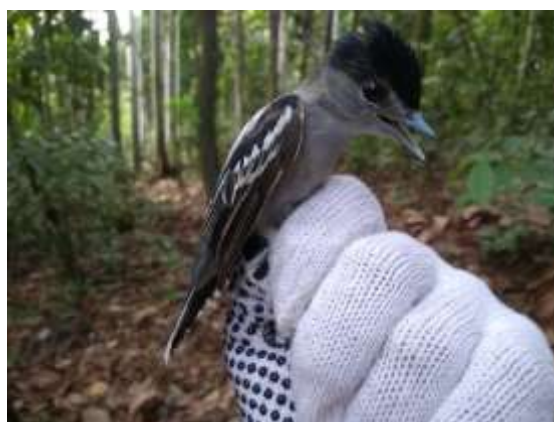
Figura 58 – Caneleiro-bordado ( Pachyramphus marginatus ) registrada no módulo M7.