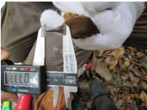
Figura 11 – Biometria de culmen.