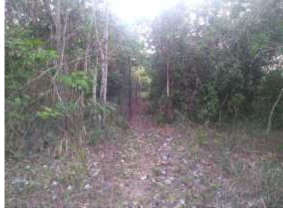
Figura 2 – Montagem de redes de neblina (M5T2).