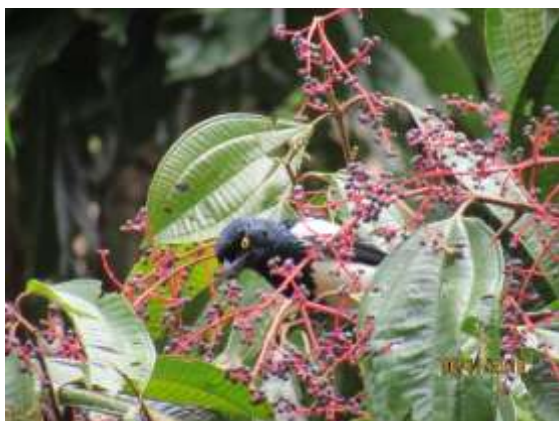
Figura 71 – Tietinga ( Cissopis leverianus ) registrada no módulo M3.