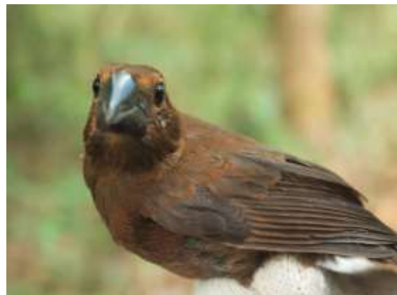
Figura 78 – Azulão-da-amazônia ( Cyanoloxia rothschildii ) registrada no módulo M2.