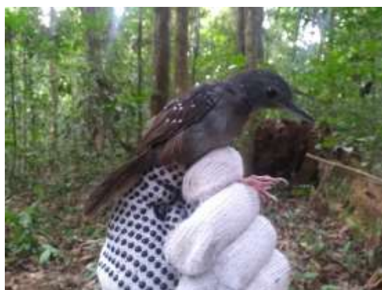
Figura 42 – Formigueiro-de-cara-ruiva ( Myrmelastes rufifacis ) registrada no módulo M6.