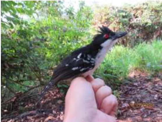
Figura 45 – Choro-boi ( Taraba major ) registrada no módulo M7.