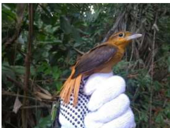
Figura 53 – Limpa-folha-vermelho ( Philydor pyrrhodes ) registrada no módulo M3.