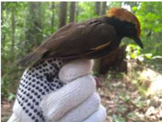
Figura 47 – Galinha-do-mato ( Formicarius colma ) registrada no módulo M6.