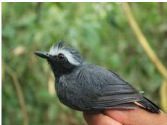
Figura 37 – Papa-formiga-de-sobrancelha ( Myrmoborus leucophrys ) registrada no módulo M2 (macho).