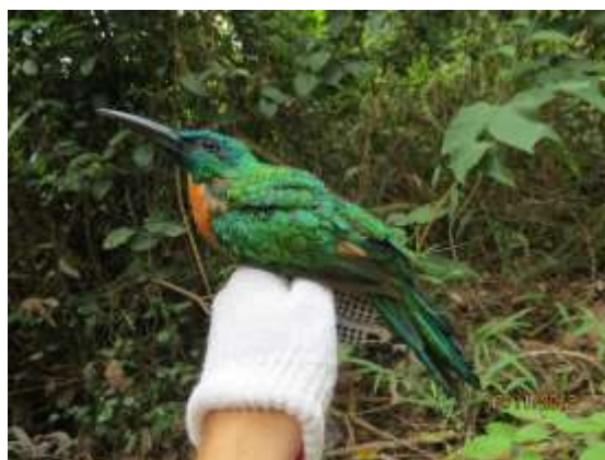
Figura 26 – Jacamarazu ( Jacamerops aureus ) registrada no módulo M7.