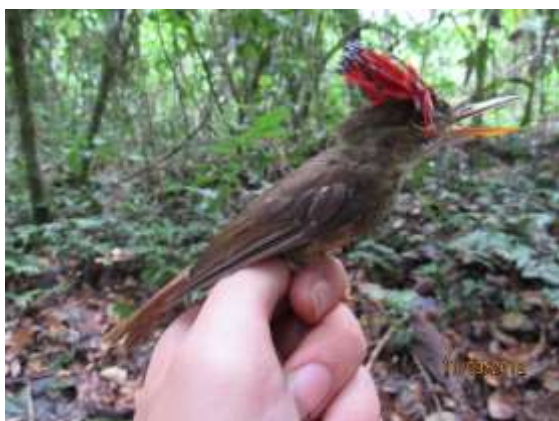
Figura 55 – Maria-leque ( Onychorhynchus coronatus ) registrada no módulo M6.