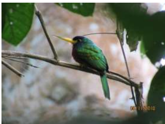
Figura 25 – Ariramba-da-mata ( Galbula cyanicollis ) registrada no módulo M5.