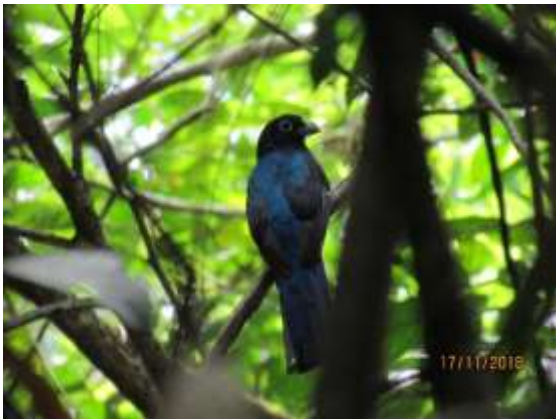
Figura 23 – Surucuá-de-barriga-vermelha ( Trogon curucui ) registrada no módulo M5.