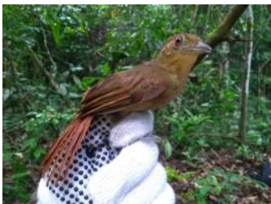
Figura 51 – Barranqueiro-de-coroa-castanha ( Automolus rufipileatus ) registrada no módulo M6.