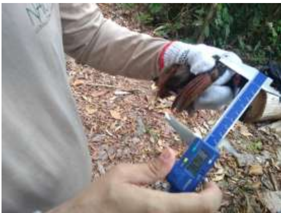
Figura 9 – Biometria da asa.