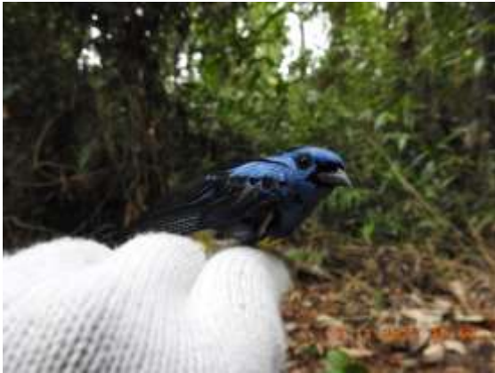
Figura 73 – Saíra-de-bando ( Tangara mexicana ) registrada no módulo M7.