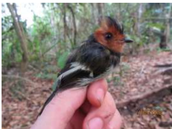
Figura 61 – Maria-bonita ( Taeniotriccus andrei ) registrada no módulo M3.