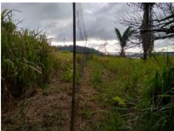
Figura 5 – Montagem de redes de neblina (M3T2).