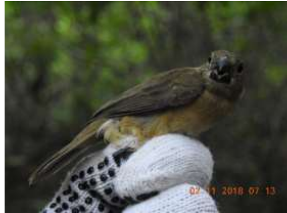
Figura 74 – Curió ( Sporophila angolensis ) registrada no módulo M2.