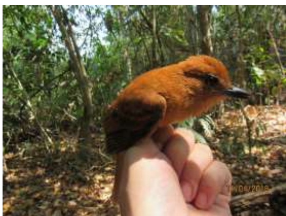
Figura 63 – Tinguáçu-ferrugem ( Attila cinnamomeus ) registrada no módulo M3.