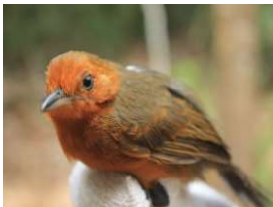
Figura 40 – Chororó-negro ( Cercomacroides nigrescens ) registrada no módulo M2 (fêmea).