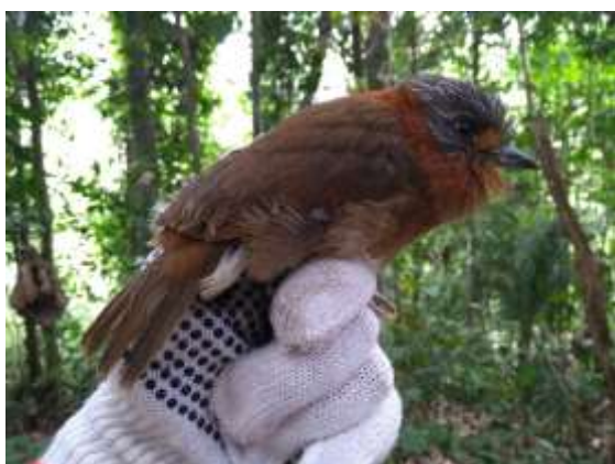
Figura 27 – Barbudo-de-pescoço-ferrugem ( Malacoptila rufa ) registrada no módulo M7.