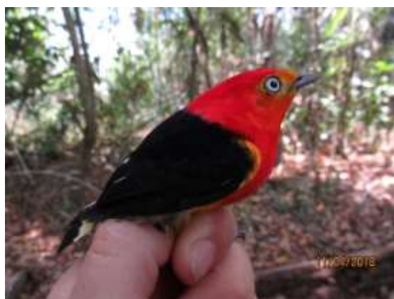
Figura 54 – Uirapuru-laranja ( Pipra fasciicauda ) registrada no módulo M3.