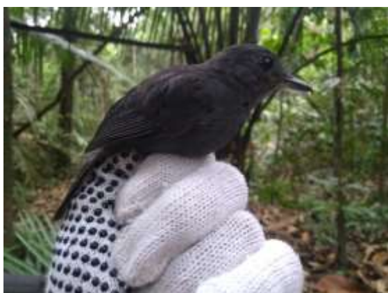
Figura 33 – Ipecuá ( Thamnomanes caesius ) registrada no módulo M5.