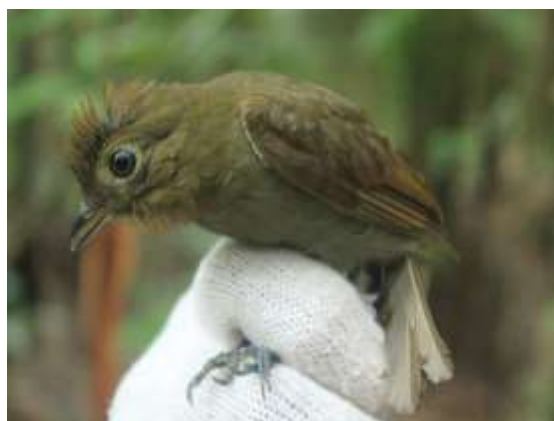
Figura 56 – Flautim-marrom ( Schiffornis turdina ) registrada no módulo M5.