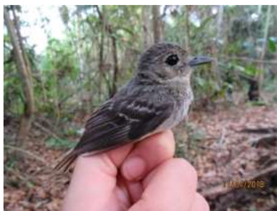
Figura 64 – Maria-preta-de-cauda-ruiva ( Knipolegus poecilocercus ) registrada no módulo M3 (fêmea).