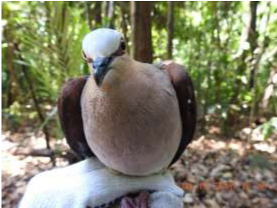
Figura 19 – Juruti-pupu ( Leptotila verreauxi ) registrada no módulo M2.