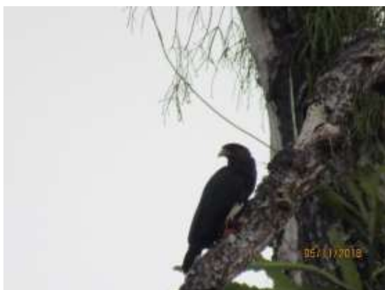
Figura 31 – Cancão ( Ibycter americanus ) registrada no módulo M6.