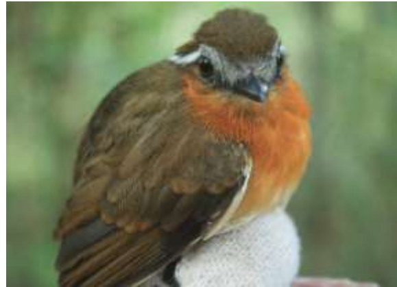
Figura 46 – Chupa-dente-de-cinta ( Conopophaga aurita ) registrada no módulo M5.