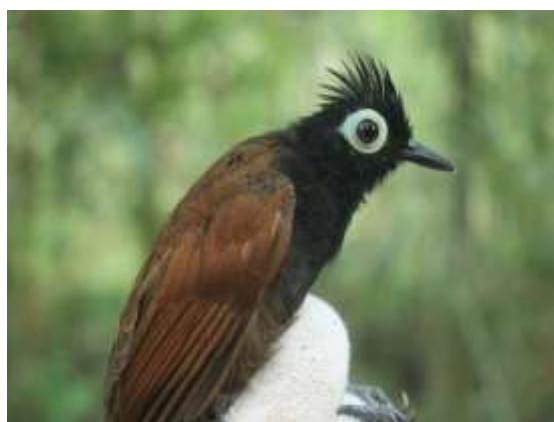
Figura 34 – Mãe-de-taoca-de-cara-branca ( Rhegmatorhina gymnops ) registrada no módulo M6.