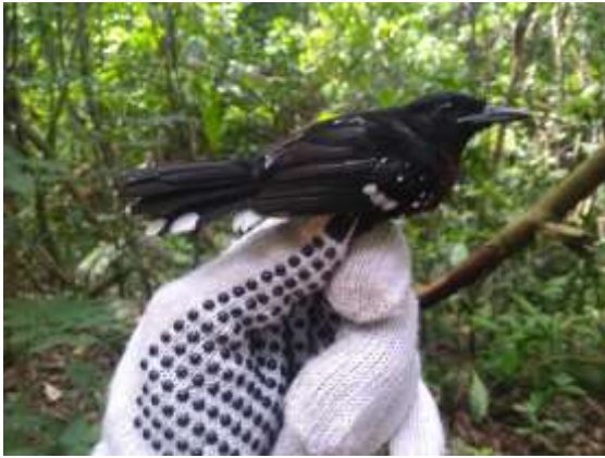
Figura 43 – Papa-formiga-de-bando ( Microrhophias quixensis ) registrada no módulo M6.