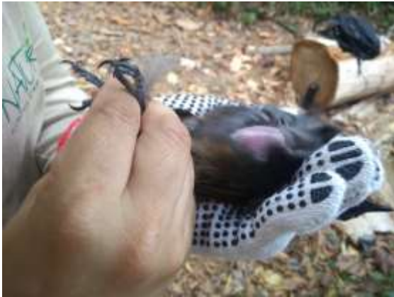
Figura 7 – Observação de formação de placas de incubação.