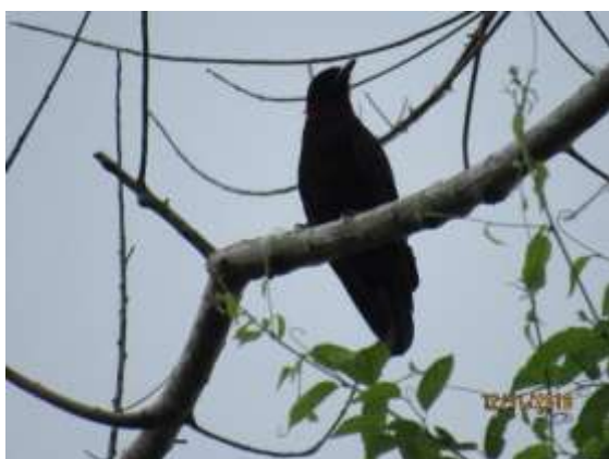
Figura 59 – Anambé-una ( Querula purpurata ) registrada no módulo M5.