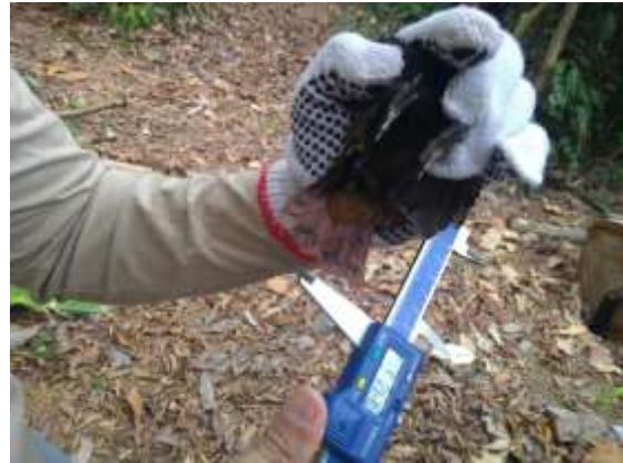
Figura 8 – Biometria de cauda.