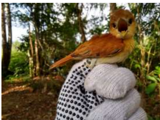
Figura 57 – Caneleiro-cinzento ( Pachyramphus rufus ) registrada no módulo M3.