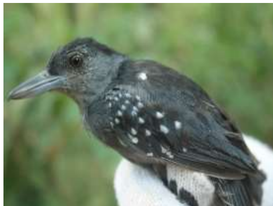
Figura 38 – Choca-cantadora ( Pygiptila stellaris ) registrada no módulo M2.