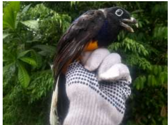
Figura 24 – Surucuá-grande-de-barriga-amarela ( Trogon viridis ) registrada no módulo M5.