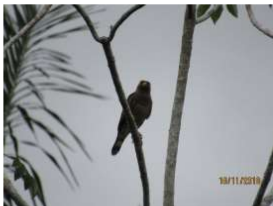
Figura 14 – Gavião-carijó ( Rupornis magnirostris ) registrada no módulo M5.