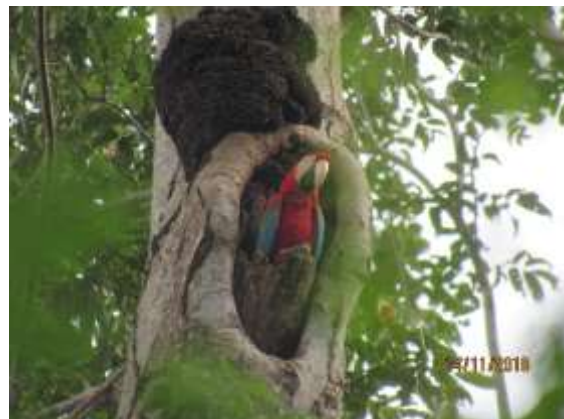
Figura 12 – Arara-vermelha ( Ara chloropterus ) registrada no M2.