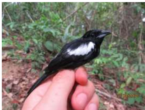
Figura 72 – Tem-tem-de-dragona-branca ( Lanio luctuosus ) registrada no módulo M5.