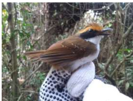
Figura 36 – Papa-formiga-de-sobrancelha ( Myrmoborus leucophrys ) registrada no módulo M2 (fêmea).