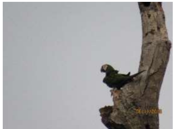
Figura 22 – Maracanã-guaçu ( Ara severus ) registrada no módulo M3.