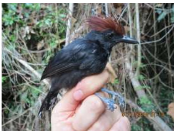
Figura 39 – Choca-d'água ( Sakesphorus luctuosus ) registrada no módulo M2.