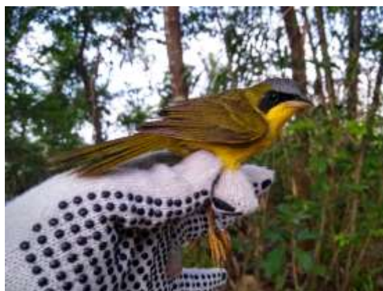
Figura 68 – Pia-cobra ( Geothlypis aequinoctialis ) registrada no módulo M3.