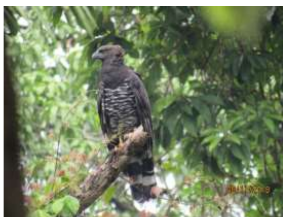
Figura 16 – Uiraçu ( Morphnus guianensis ) registrada no módulo M5.