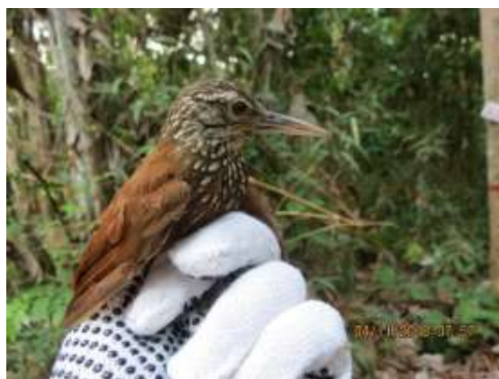
Figura 50 – Arapaçu-de-bico-branco ( Dendroplex picus ) registrada no módulo M3.