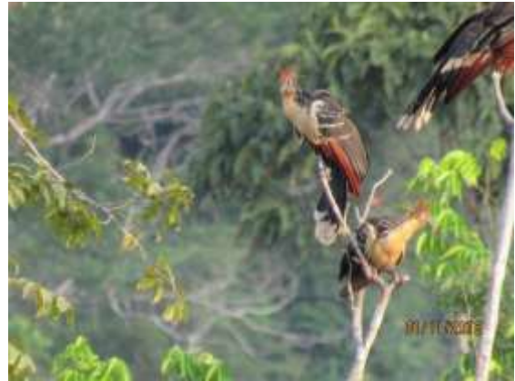
Figura 20 – Cigana ( Opisthocomus hoazin ) registrada no módulo M2.