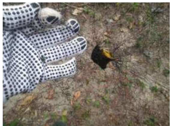
Figura 6 – Espécime capturado com redes de neblina.