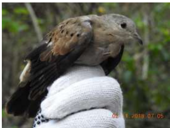
Figura 17 – Rolinha ( Columbina talpacoti ) registrada no módulo M2.