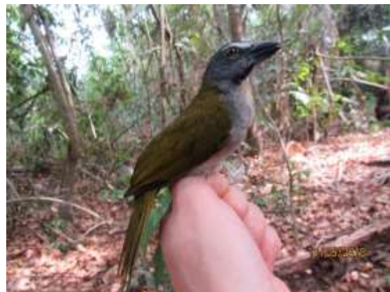
Figura 76 – Sabiá-gomgá ( Saltator coerulescens ) registrada no módulo M3.