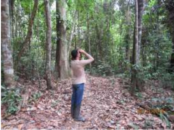
Figura 1 – Método de Censo e Pontos de escuta ao longo do transecto.