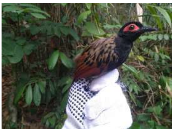
Figura 35 – Mãe-da-taoca ( Phleogopsis nigromaculata ) registrada no módulo M3.