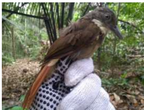
Figura 52 – Barranqueiro-do-pará ( Automolus paraensis ) registrada no módulo M3.