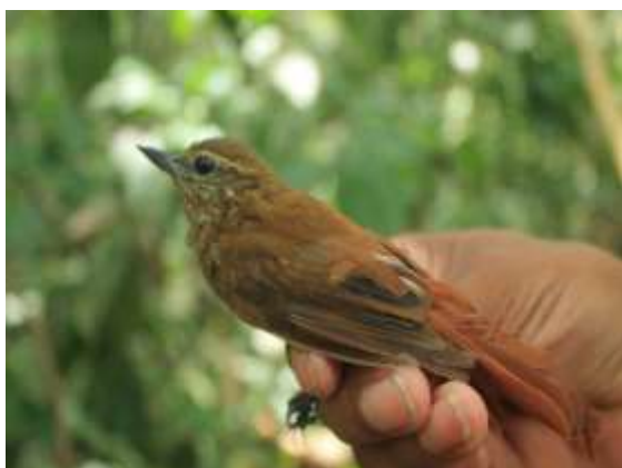
Figura 49 – Arapaçu-bico-de-cunha ( Glyphorhynchus spirurus ) registrada no módulo M2.