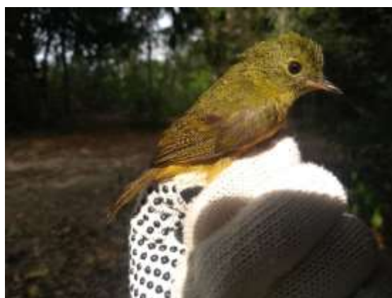
Figura 60 – Abre-asa ( Mionectes oleagineus ) registrada no módulo M5.