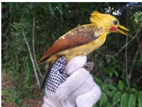
Figura 29 – Pica-pau-amarelo ( Celeus flavus ) registrada no módulo M5.