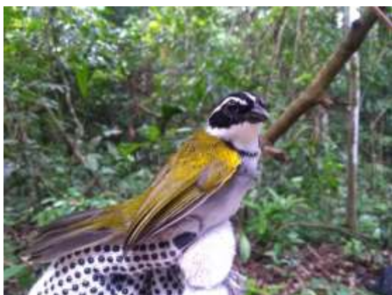
Figura 67 – Tico-tico-de-bico-preto ( Arremon taciturnus ) registrada no módulo M6.