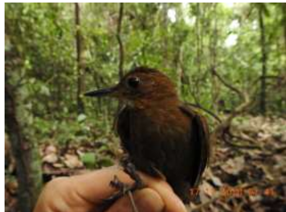
Figura 48 – Vira-folha-pardo ( Sclerurus caudacutus ) registrada no módulo M5.