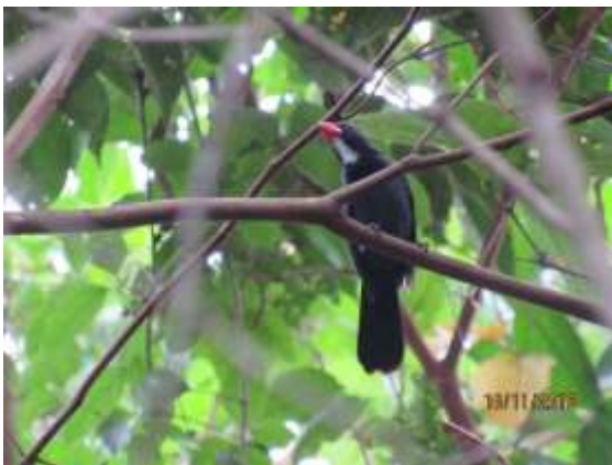
Figura 75 – Bico-encarnado ( Saltator grossus ) registrada no módulo M5.