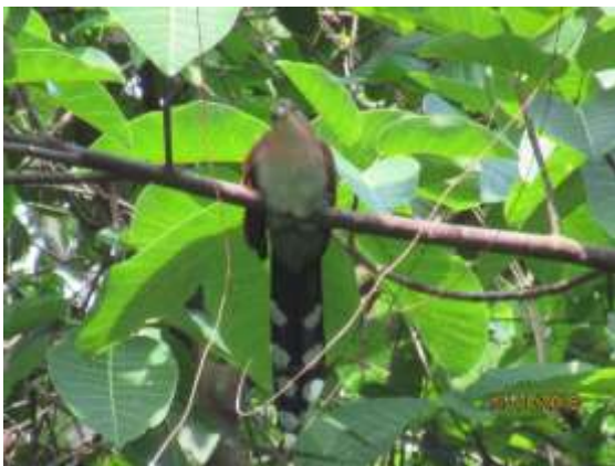
Figura 21 – Alma-de-gato ( Piaya cayana ) registrada no módulo M2.