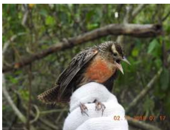
Figura 70 – Policia-inglesa-do-norte ( Sturnella militaris ) registrada no módulo M2.