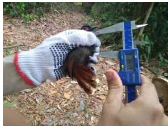
Figura 10 – Biometria de tarso.