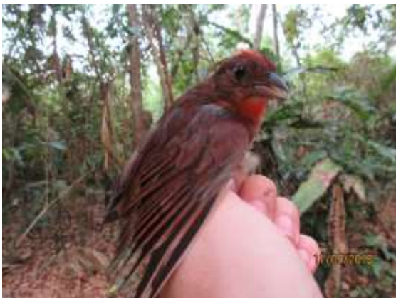
Figura 77 – Tiê-do-mato-grosso ( Habia rubra ) registrada no módulo M3.