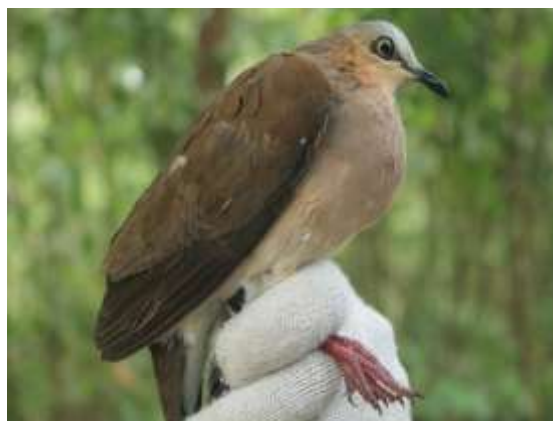
Figura 18 – Juruti-gemeadeira ( Leptotila rufaxilla ) registrada no módulo M5.