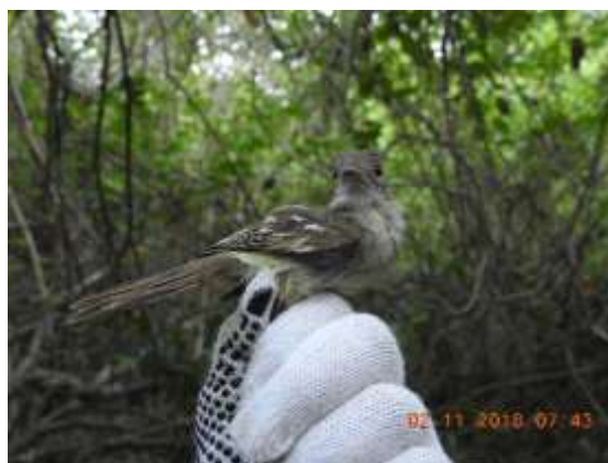
Figura 62 – Chibum ( Elaenia chiriquensis ) registrada no módulo M2.