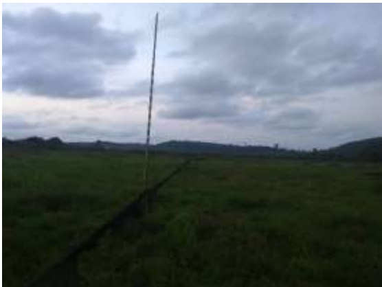
Figura 3 – Montagem de redes de neblina (M2T2).