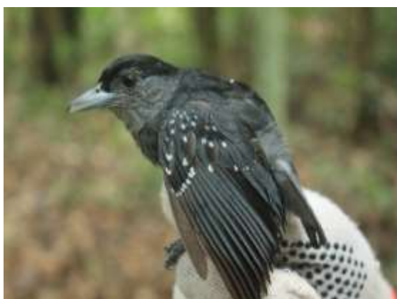
Figura 41 – Chororó-negro ( Cercomacroides nigrescens ) registrada no módulo M5 (macho).