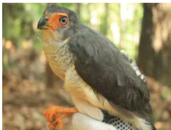
Figura 32 – Falcão-críptico ( Micrastur mintoni ) registrada no módulo M3.