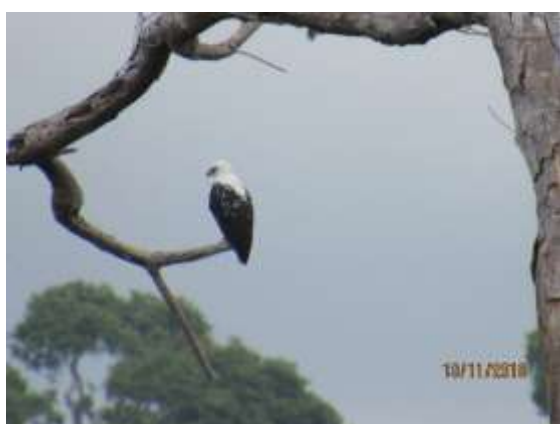
Figura 15 – Gavião-branco ( Pseudastur albicollis ) registrada no módulo M7.