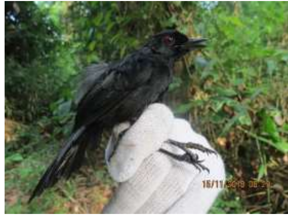
Figura 44 – Papa-taoca ( Pyriglena leuconota ) registrada no módulo M7.