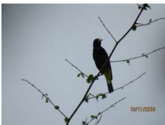
Figura 69 – Xexéu ( Cacicus cela ) registrada no módulo M3.