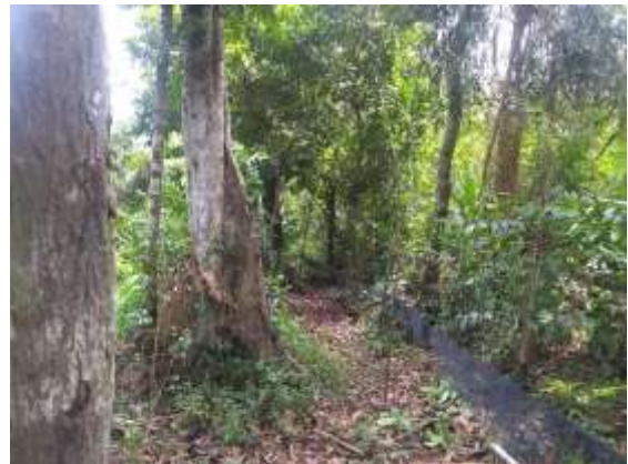
Figura 4 – Montagem de redes de neblina (M7T1).