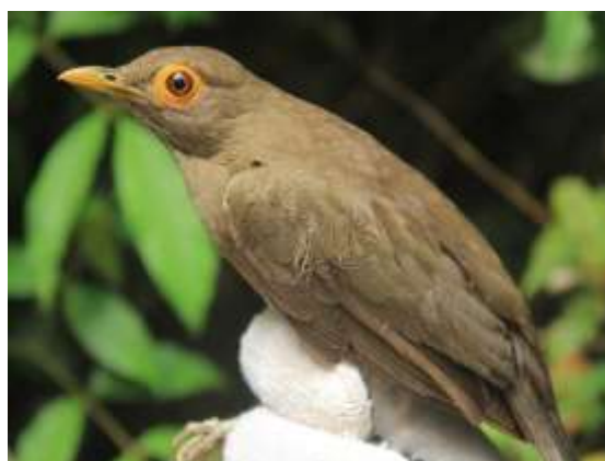
Figura 66 – Caraxué ( Turdus nudigenis ) registrada no módulo M7.