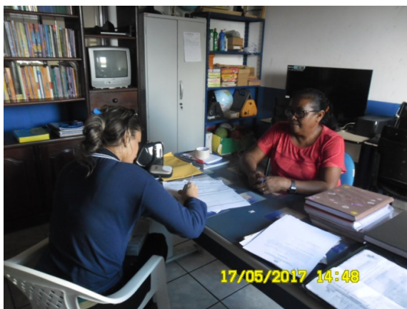
Figura - 11 – Coleta de dados na EMEF Maria do Carmo Farias (Rural) – Senador José Porfírio – mai/17