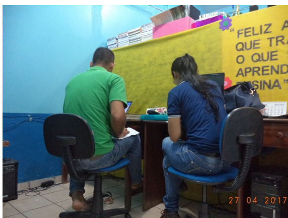
Figura - 9 – Coleta de dados na EMEF Cattete Pinheiro (Urbana) – Senador José Porfírio - abr/17