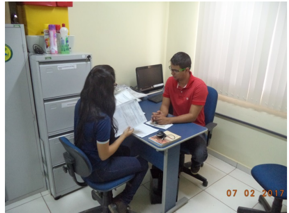
Figura - 2 – Coleta de dados de lixo – Vitória do Xingu – fev/17