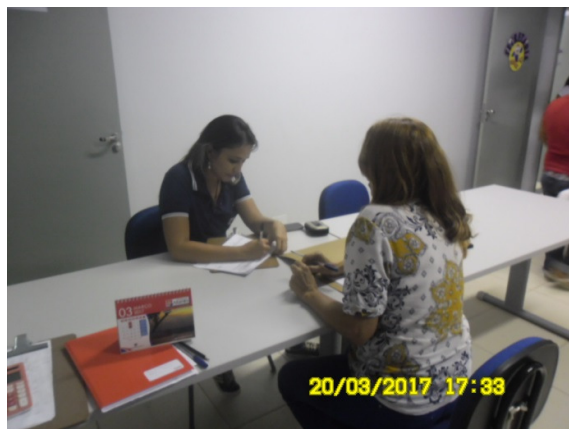
Figura - 8 – Coleta de dados na EMEIF Rui Barbosa – RUC Laranjeiras (Urbana) – Altamira - mar/17