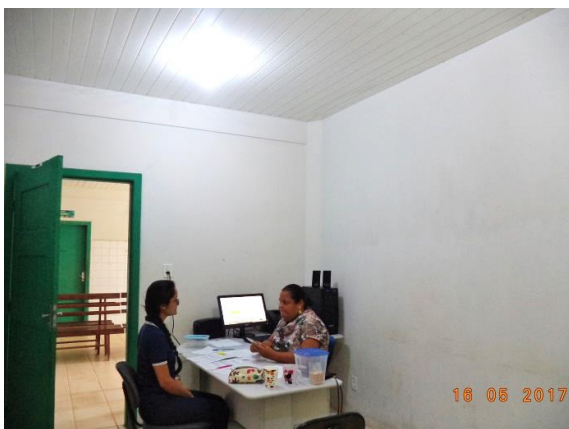
Figura - 5 – Coleta de dados das ocorrências do CREAS – Anapu – mai/17