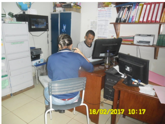
Figura - 7 – Coleta de dados na EMEF Ricardo Oliveira Junior (Urbana) – Anapu – fev/17