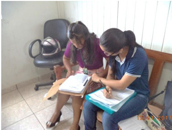
Figura - 1 – Coleta de dados de concelho tutelar – Brasil Novo – jan/17