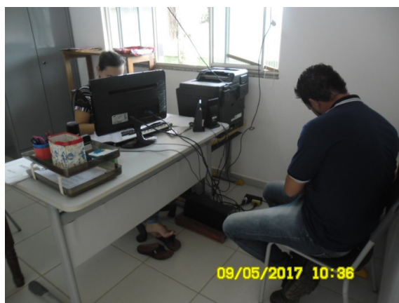
Figura - 10 – Coleta de dados na EMEI Criança Esperança (Urbana) – Brasil Novo - mai/17