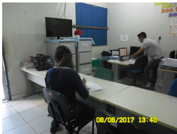
Figura - 12 – Coleta de dados na EEEM Padre Eurico (Urbana) – Vitória do Xingu – jun/17