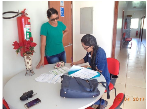
Figura - 4 – Coleta de dados das ocorrências do CRAS – Altamira – abr/17