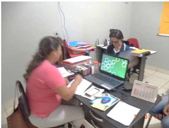
Figura - 3 – Coleta de dados das ocorrências do CRAS – Senador José Porfírio – mar/17