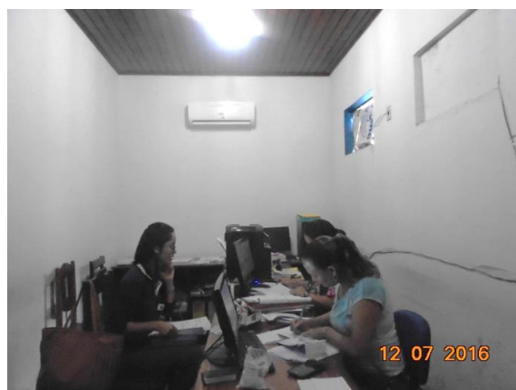
Figura - 2 – Coleta de dados de alvarás – Senador José Porfírio- jul/16