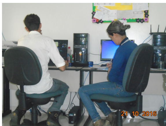
Figura - 11 – Coleta de dados na EMEF Leonardo Da Vinci (Rural) – Vitória do Xingu – out/16