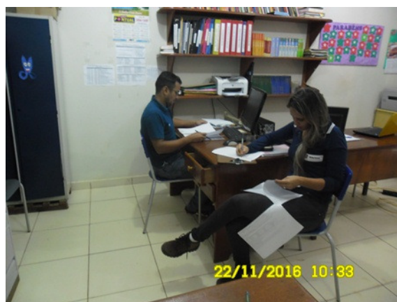
Figura - 10 – Coleta de dados na EMEI Professor Ricardo Oliveira Júnior (Urbana) – Anapu – nov/16