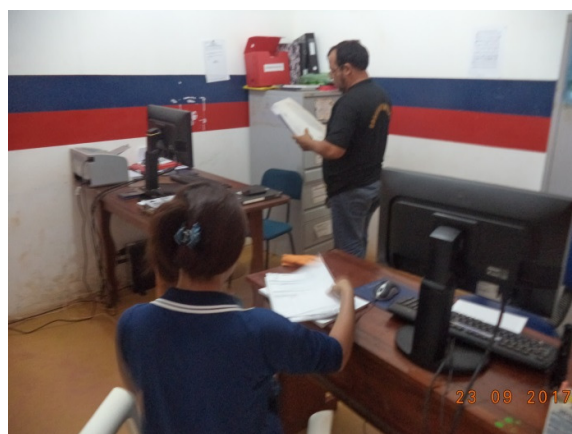
Figura - 4 – Coleta de dados do Conselho Tutelar – Anapu - set/16