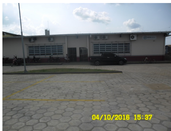
Figura - 12 – Entrada da Escola do RUC Jatobá