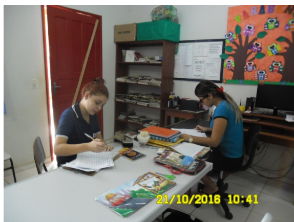
Figura - 9 – Coleta de dados na EMEF Paraíso (Urbana) – Brasil Novo - out/16