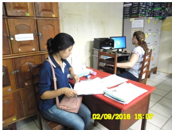
Figura - 8 – Coleta de dados na EMEF Carlos Leocárpio Soares (Urbana) – Altamira - set/16