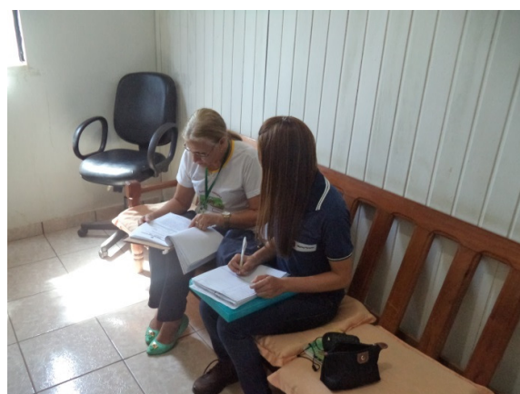
Figura - 6 – Coleta de dados do Conselho Tutelar – Brasil Novo – nov/16