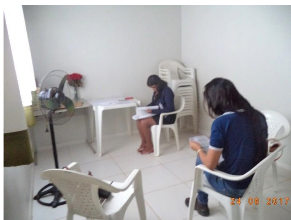
Figura - 3 – Coleta de dados do CREAS – Altamira – ago/16