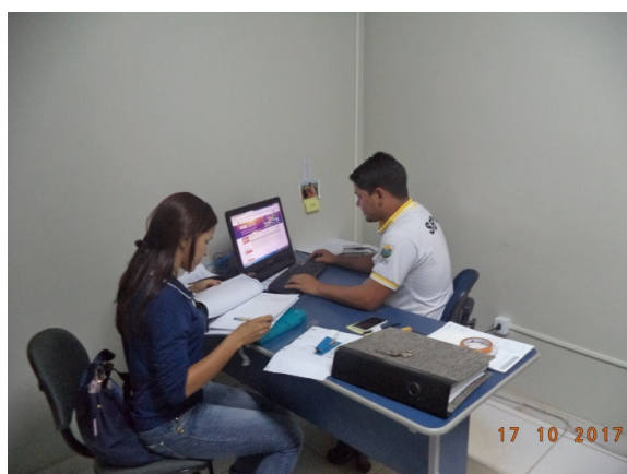
Figura - 5 – Coleta de dados de alvarás – Vitória do Xingu – out/16