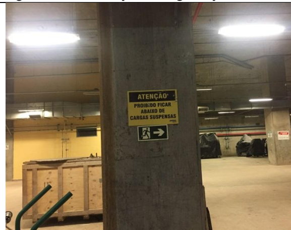
Figura 06 – Sinalização de segurança