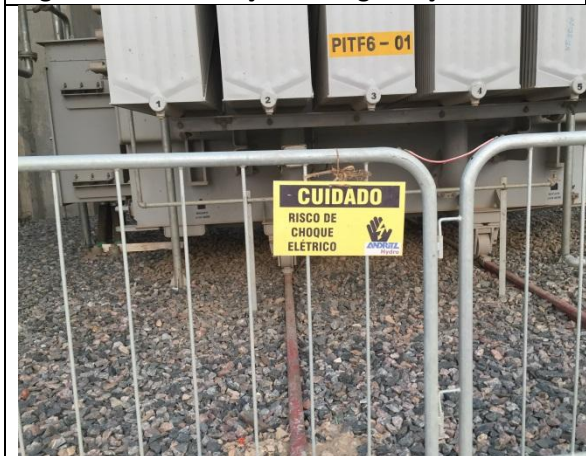
Figura 05 – Sinalização de segurança