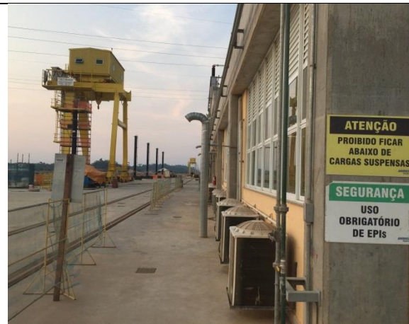
Figura 02 – Sinalização de segurança