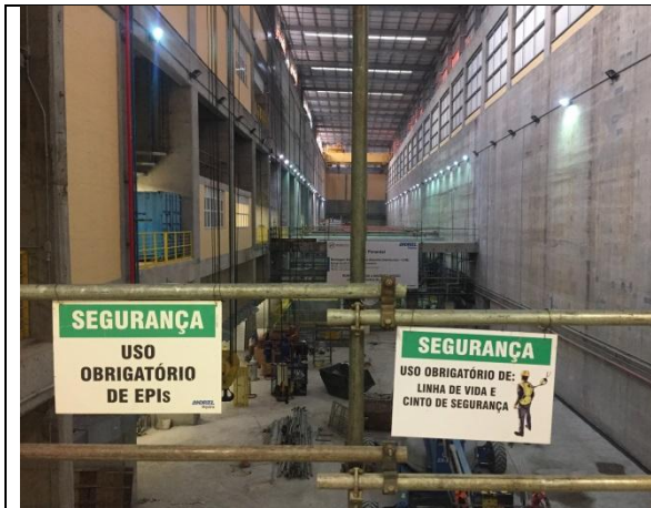
Figura 01 – Sinalização de segurança