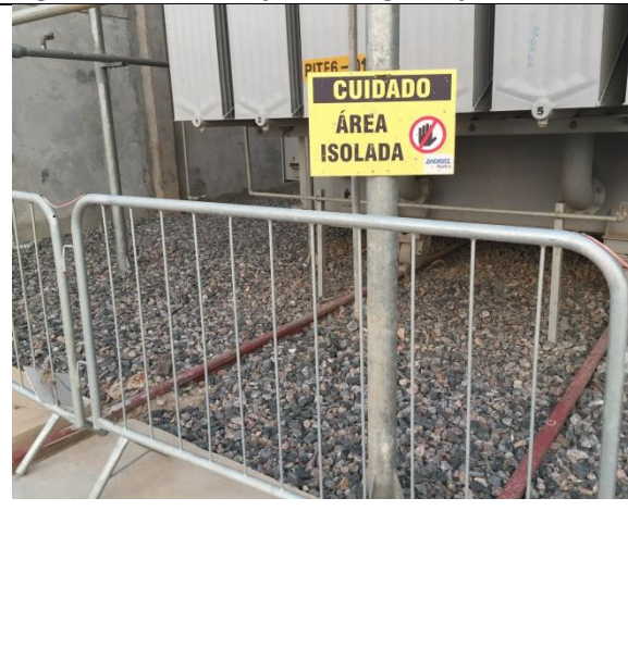
Figura 04 – Sinalização de segurança