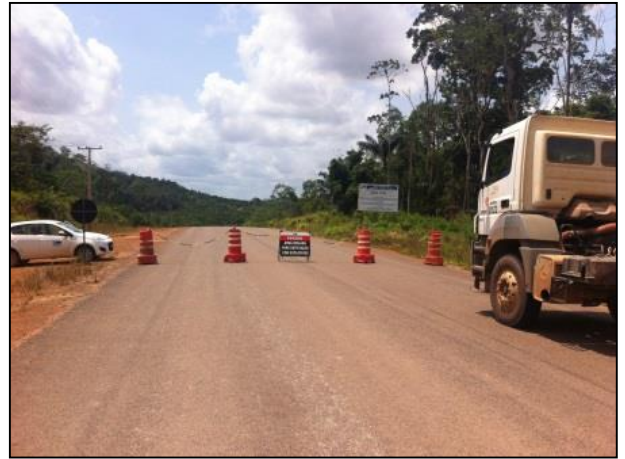
Anexo 3.4.2 – 1 – Sinalização para atividades de Detonação.