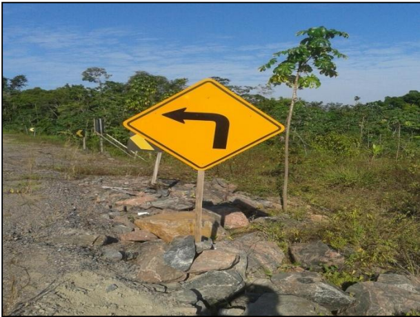
Anexo 3.4.2 – 1 – Sinalização dos acessos internos dos canteiros.