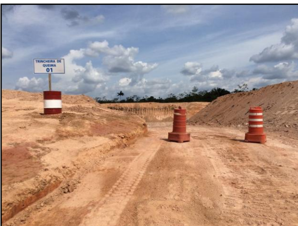
Anexo 3.4.2 –1– Sinalização das vias e acessos internos dos canteiros.