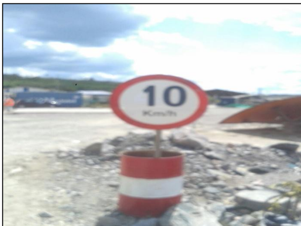
Anexo 3.4.2 – 1 – Sinalização dos acessos internos dos canteiros.