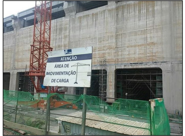
Anexo 3.4.2 – 1 – Sinalização de segurança nos Setores da obra.