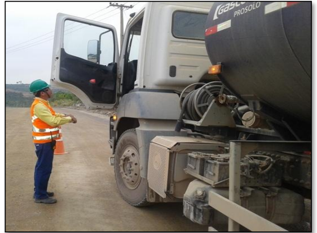
Anexo 3.4.2 – 1 – Blitz com abordagem orientativa sobre os limites de velocidade dentro dos canteiros de obra da UHE BM.