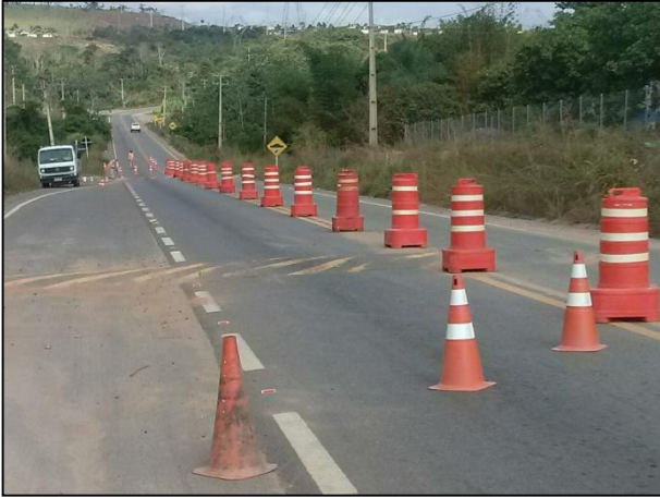
Anexo 3.4.2 – 1 – Sinalização das vias de acesso envolvendo comunidades.