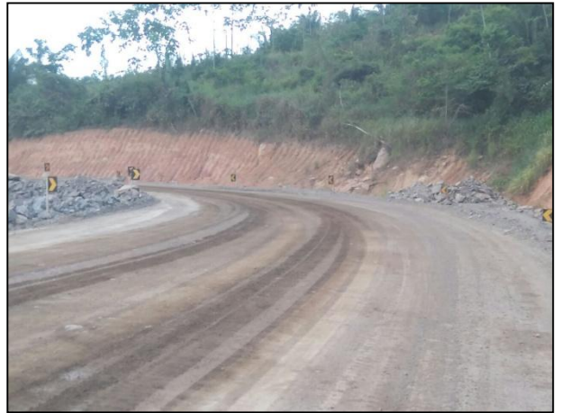
Anexo 3.4.2 – 1 – Sinalização dos acessos internos dos canteiros.