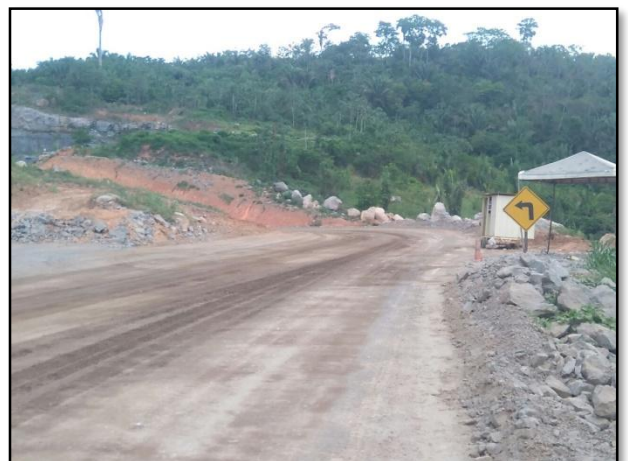
Anexo 3.4.2 –1– Sinalização das vias e acessos internos dos canteiros.