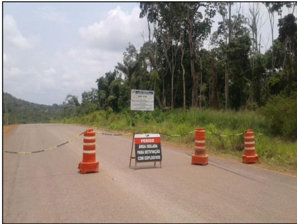
Anexo 3.4.2 – 1 – Sinalização para atividades de Detonação.