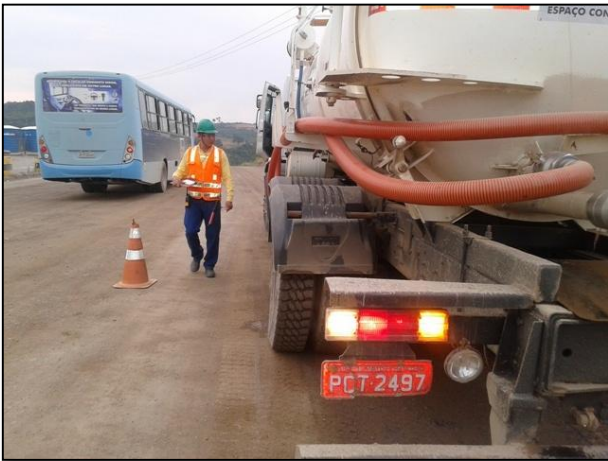
Anexo 3.4.2 – 1 – Blitz com abordagem orientativa sobre os limites de velocidade dentro dos canteiros de obra da UHE BM.