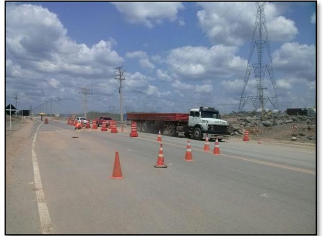
Anexo 3.4.2 – 1 – Sinalização das vias de acesso envolvendo comunidades.