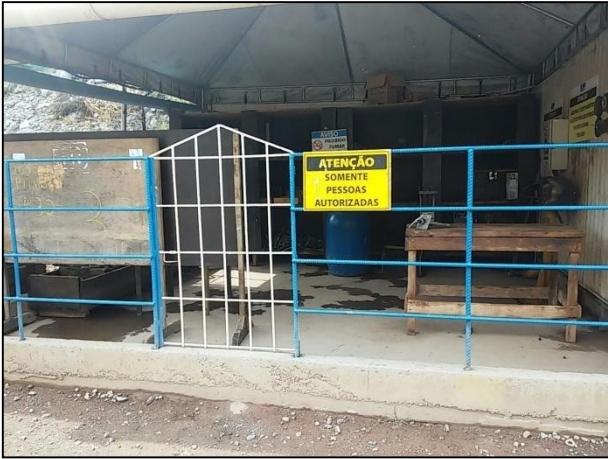
Anexo 3.4.2 – 1 – Sinalização de segurança nos Setores da obra.