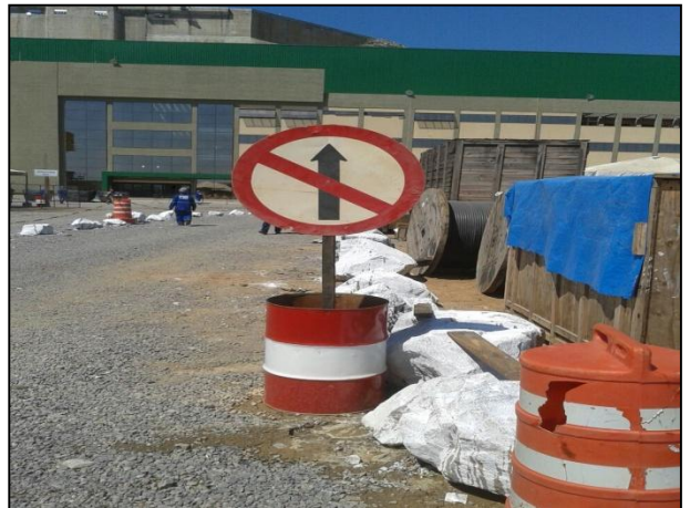
Anexo 3.4.2 – 1 – Sinalização dos acessos internos dos canteiros.