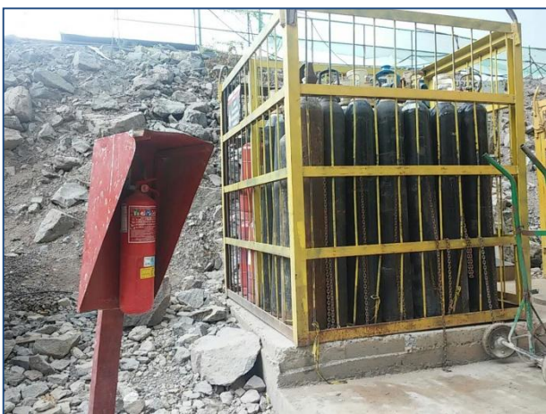
Anexo 3.4.2 – 1 – Sinalização de Atendimento à Emergências