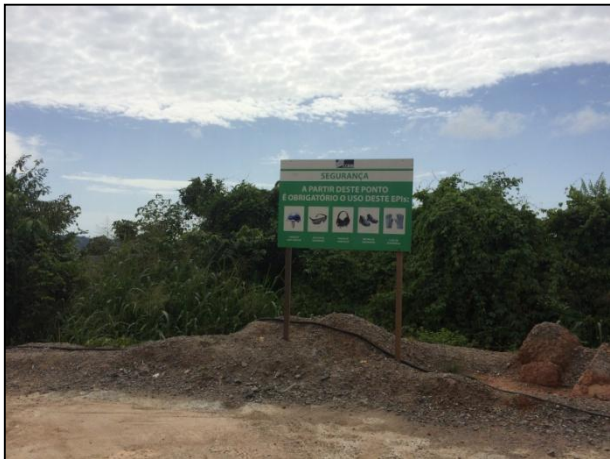
Anexo 3.4.2 – 1 – Sinalização dos acessos internos dos canteiros.