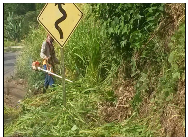
Anexo 3.4.2 – 1 – Sinalização dos acessos internos dos canteiros.