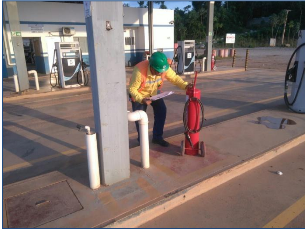
Anexo 3.4.2 – 1 – Sinalização de Atendimento à Emergências