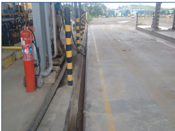
Anexo 3.4.2 – 1 – Sinalização de Atendimento à Emergências