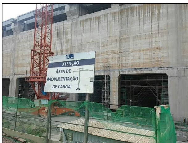
Anexo 3.4.2 – 1 – Sinalização de segurança nos Setores da obra.