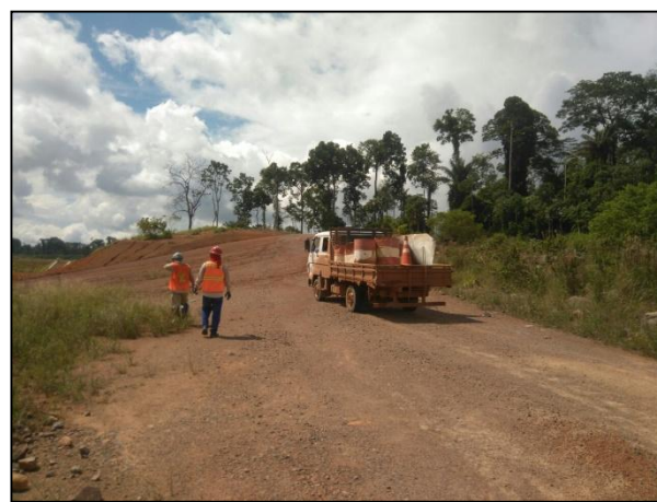
Anexo 3.4.2 – 1 – Desmobilização das placas de sinalização dos acessos internos dos canteiros.