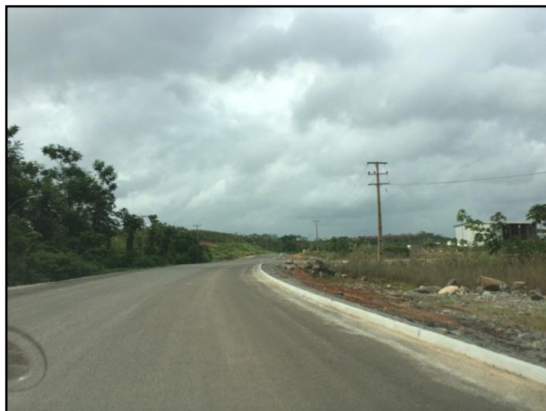
Anexo 3.4.2 – 1 – Pavimentação das vias de acesso envolvendo comunidades no canteiro de Pimental.