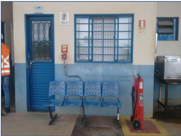
Anexo 3.4.2 – 1 – Sinalização de Atendimento à Emergências