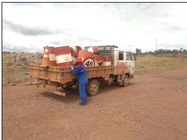
Anexo 3.4.2 – 1 – Desmobilização das placas de sinalização dos acessos internos dos canteiros.