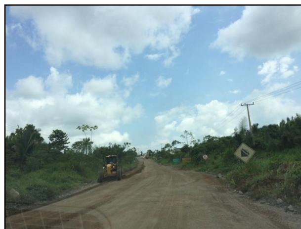
Anexo 3.4.2 –1– Sinalização das vias e acessos internos dos canteiros.