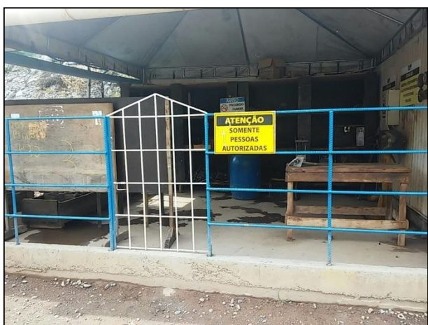
Anexo 3.4.2 – 1 – Sinalização de segurança nos Setores da obra.