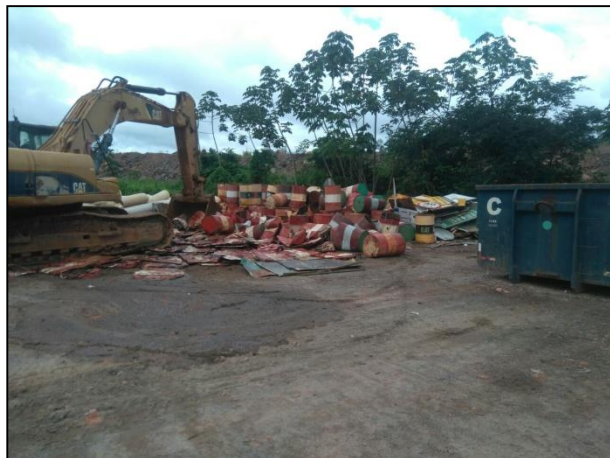
Anexo 3.4.2 – 1 – Desmobilização das placas de sinalização dos acessos internos dos canteiros.