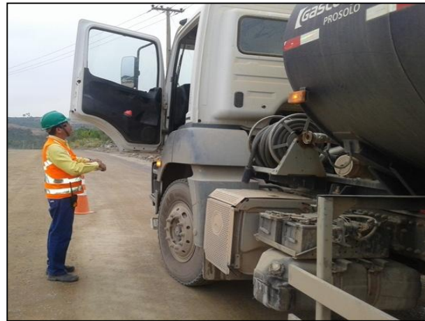
Anexo 3.4.2 – 1 – Blitz com abordagem orientativa sobre os limites de velocidade dentro dos canteiros de obra da UHE BM.