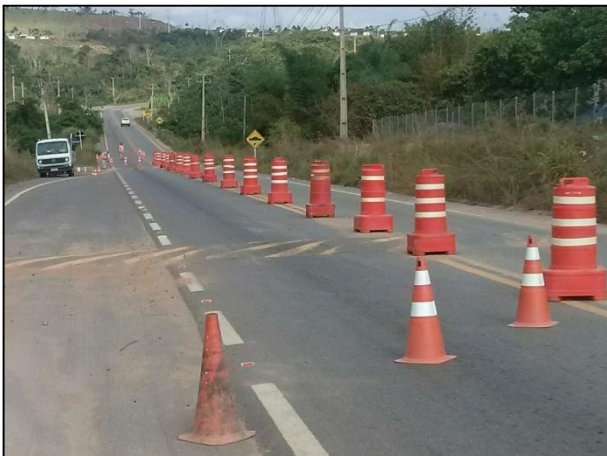
Anexo 3.4.2 – 1 – Sinalização das vias de acesso envolvendo comunidades.