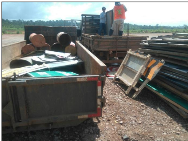
Anexo 3.4.2 – 1 – Desmobilização das placas de sinalização dos acessos internos dos canteiros.