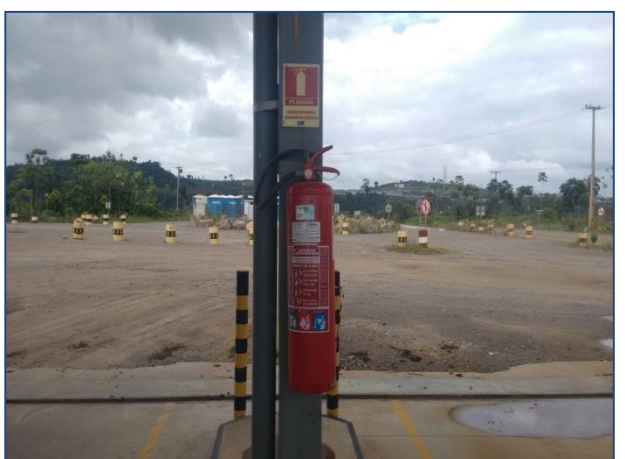
Anexo 3.4.2 – 1 – Sinalização de Atendimento à Emergências