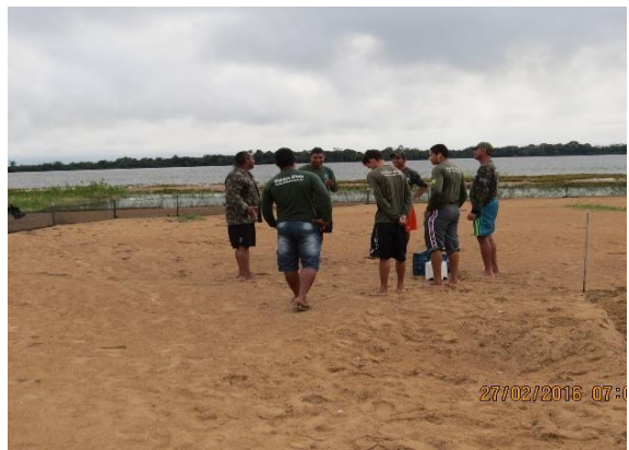
Figura 8 – Reunião entre PMQ e SEMAT para ações conjuntas na praia Juncal, no Tabuleiro do Embaubal.