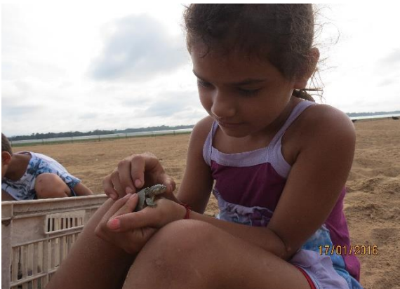
Figura 35 – Ações de manejo comunitário na praia Juncal, no Tabuleiro do Embaubal.