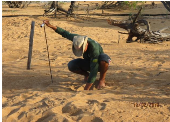
Figura 10 – Identificação de ninhos e manejo de filhotes de Podocnemis na praia Peterçu.