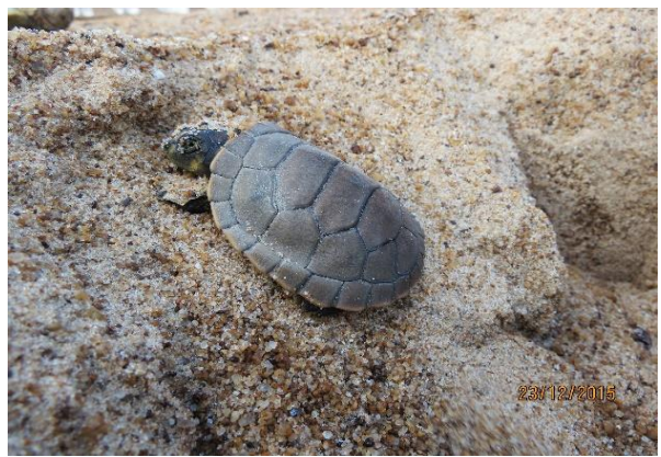
Figura 19 – Eclosão de P. unifilis no Tabuleiro do Embaubal.