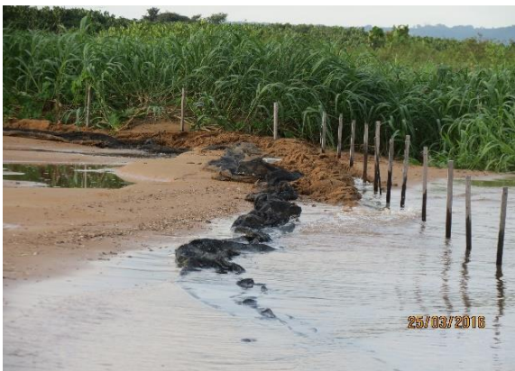
Figura 41 – Praia Juncal após remoção da tela de contenção.