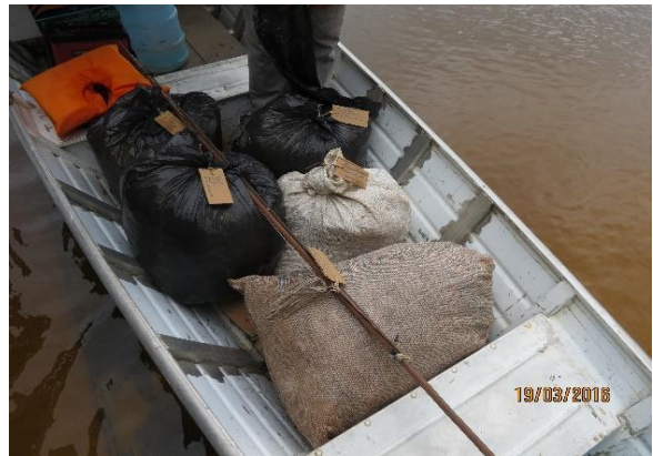
Figura 50 – Apreensão de artefatos para captura de quelônios pela equipe da SEMAT.