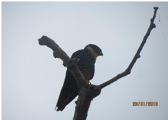
Figura 29 – Predador de filhotes de Podocnemis : Falco rufigularis , no Tabuleiro do Embaubal.