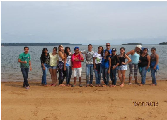
Figura 37 – Alunos e professores do CEEM Rosa Alvarez em ações de manejo comunitário. Tabuleiro do Embaubal.