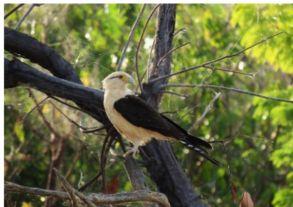
Figura 26 – Predador de filhotes de Podocnemis : Milvago chimachima , no Tabuleiro do Embaubal.