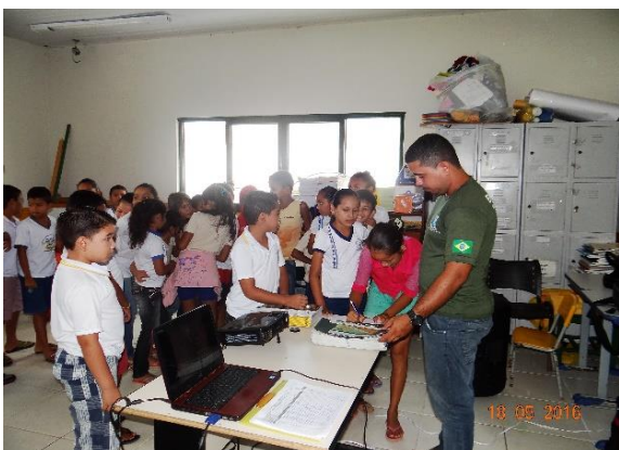
Figura 55 – Entrega das cartilhas “Quelônios do Xingu” aos alunos da EMEF Dulcinéia Almeida do Nascimento, município de Vitória do Xingu.