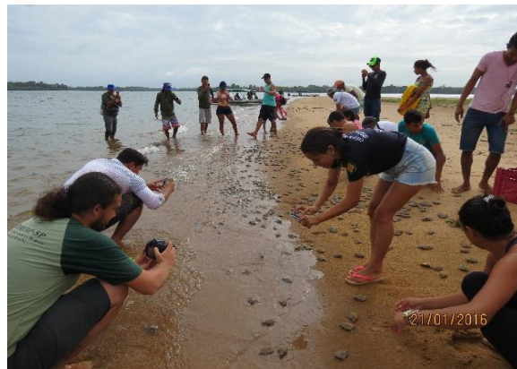
Figura 38 – Alunos e professor de graduação da UFPA. Tabuleiro do Embaubal.