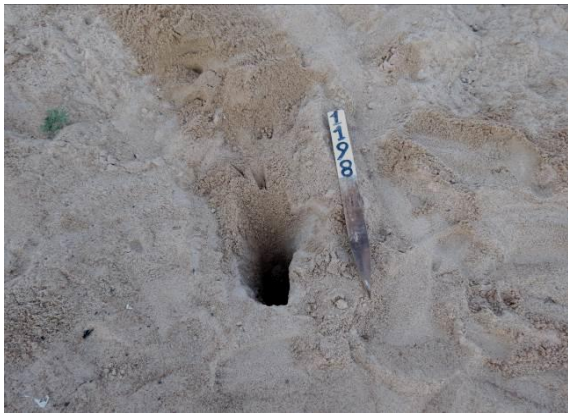
Figura 9 – Posturas de P. expansa removida na praia Carão, no Tabuleiro do Embaubal.