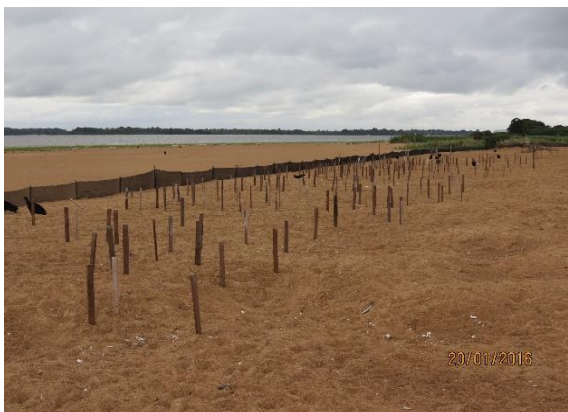
Figura 13 – Identificação de ninhos para as ações de manejo comunitário no Juncal, Tabuleiro do Embaubal.