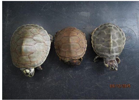
Figura 16 – Manejo de filhotes de Podocnemis para aferição biométrica no Tabuleiro do Embaubal.