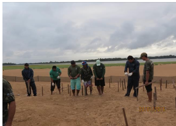
Figura 12 – Identificação de ninhos para as ações de Educação Ambiental e manejo comunitário.