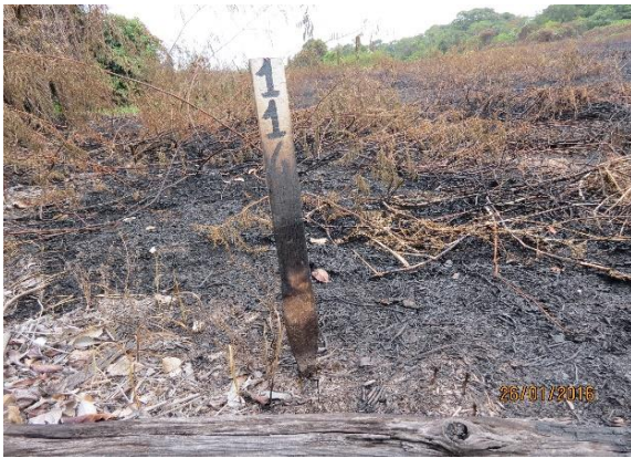
Figura 45 – Incêndio em área de desova de P. unifilis . Tabuleiro do Embaubal.