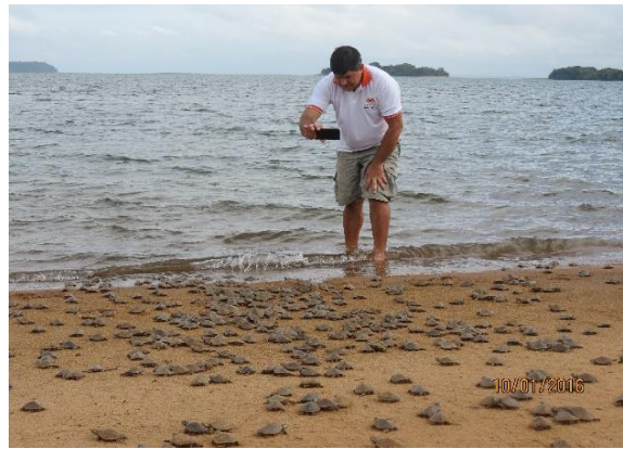
Figura 34 Ações de manejo comunitário na praia Juncal, no Tabuleiro do Embaubal.