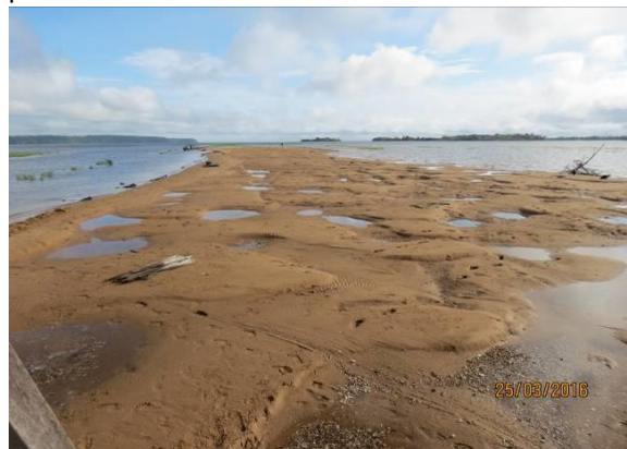
Figura 42 – Praia Juncal após remoção da tela de contenção.