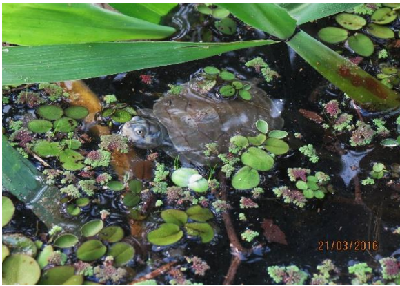
Figura 21 – Destinação de filhotes de P. expansa na praia Peteruçu. Tabuleiro do Embaubal.