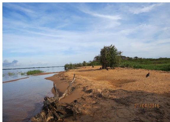
Figura 44 – Praia Peteruçu após remoção da tela de contenção.