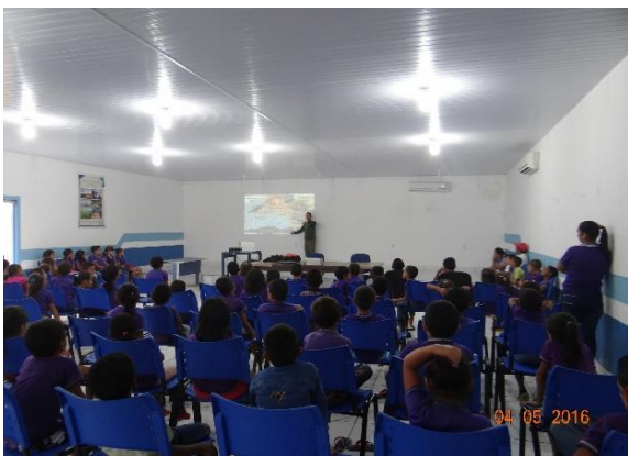
Figura 53 – Aplicação de atividade de EA na EMEF Cattête Pinheiro, em Senador José Porfírio.