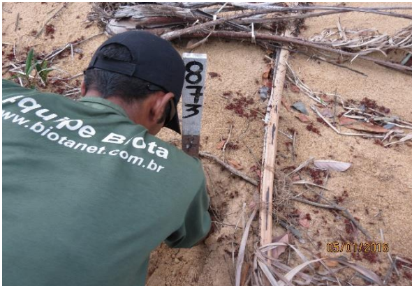
Figura 5 – Monitoramento das posturas de Podocnemis , no Tabuleiro do Embaubal.