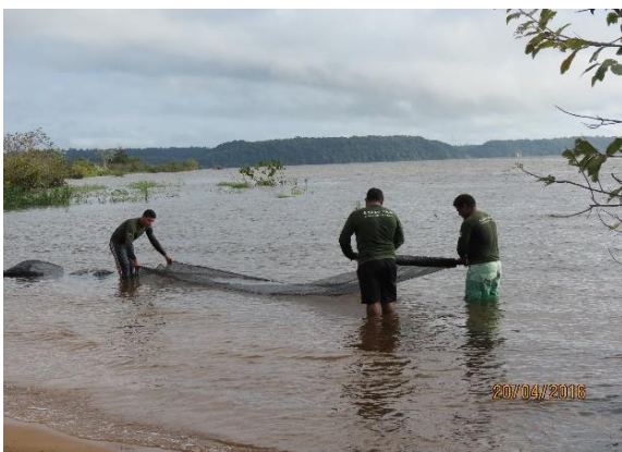
Figura 43 – Remoção da tela de contenção da praia Peteruçu.