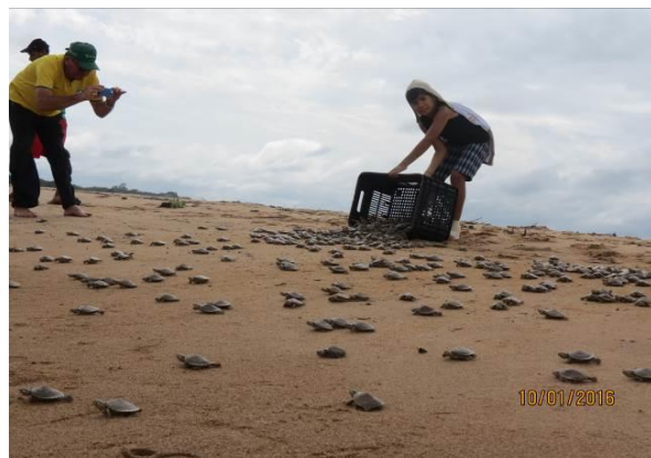
Figura 32 – Ações de manejo comunitário na praia Juncal, no Tabuleiro do Embaubal.