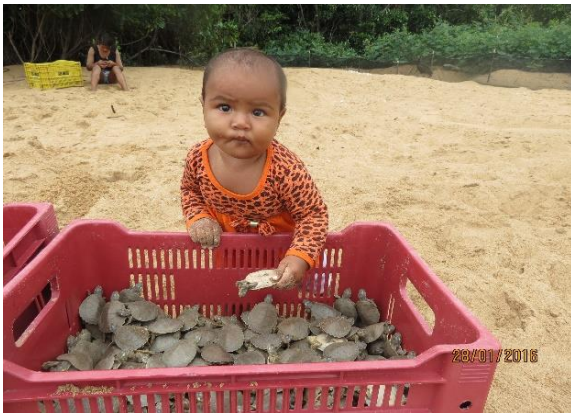
Figura 39 – Ações de EA e manejo comunitário na praia Peteruçu, no Tabuleiro do Embaubal.