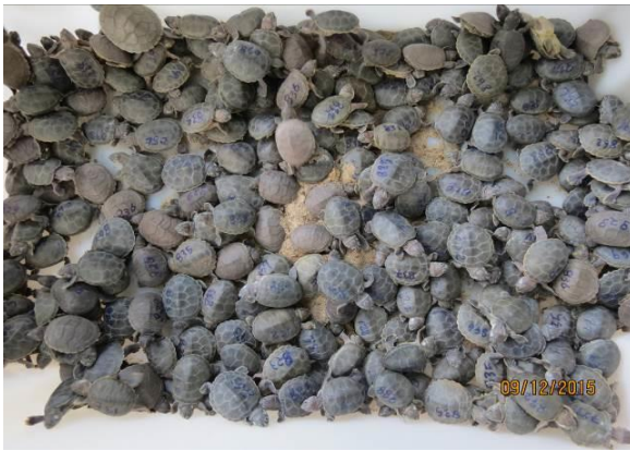
Figura 15 – Triagem de filhotes de Podocnemis para aferição biométrica.