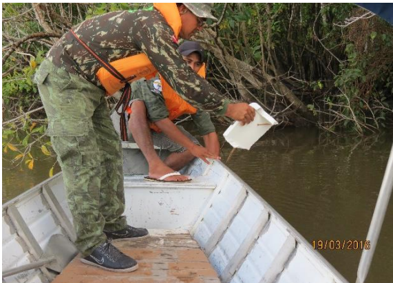
Figura 49 – Remoção de iscas de pesca de P. expansa no Peteruçu pela equipe da SEMAT.