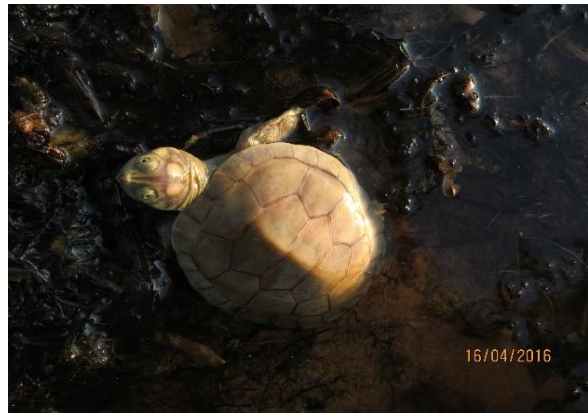
Figura 22 – Destinação de filhotes de P. expansa na praia Peteruçu. Tabuleiro do Embaubal.