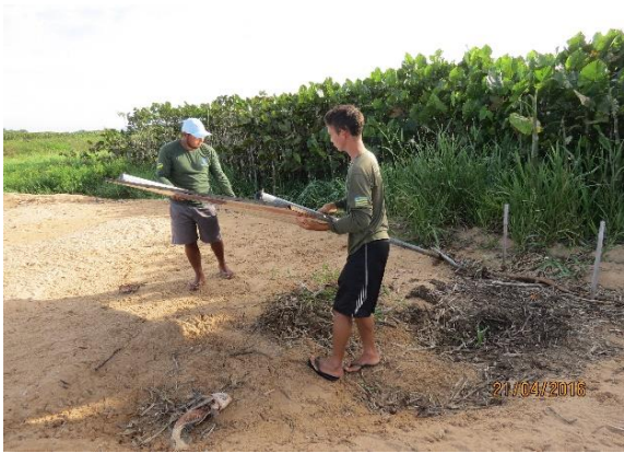
Figura 51 – Remoção de placa de sinalização das praias. Tabuleiro do Embaubal.