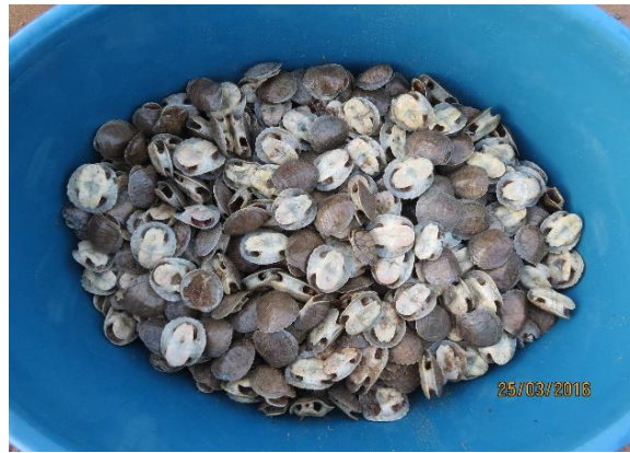
Figura 40 – Contabilização das estruturas de carapaça/plastrão de filhotes de P. expansa na praia Juncal.