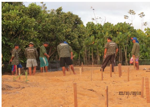
Figura 14 – Identificação de ninhos para as ações de manejo comunitário no Peterçu, Tabuleiro do Embaubal.