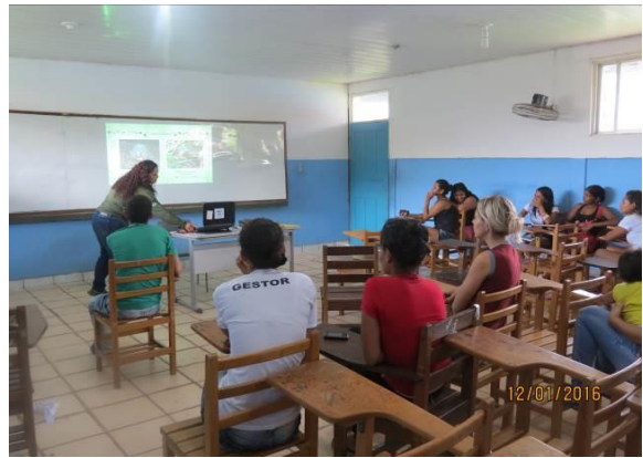
Figura 52 – Aplicação de palestra no CEE M Rosa Alvarez Rebelo, em Senador José Porfírio.