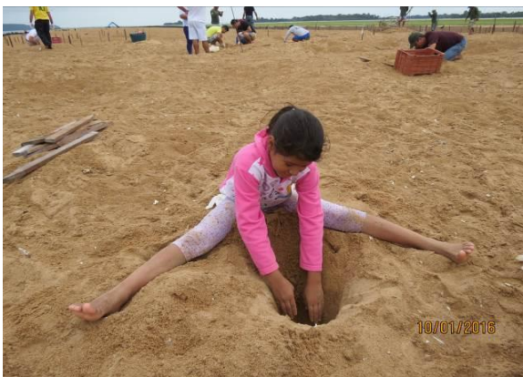
Figura 31 – Ações de manejo comunitário na praia Juncal, no Tabuleiro do Embaubal.