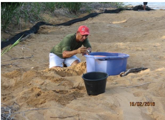
Figura 11 – Identificação de ninhos, manejo de filhotes de Podocnemis na praia Peterçu. As ações de remoção da tela.