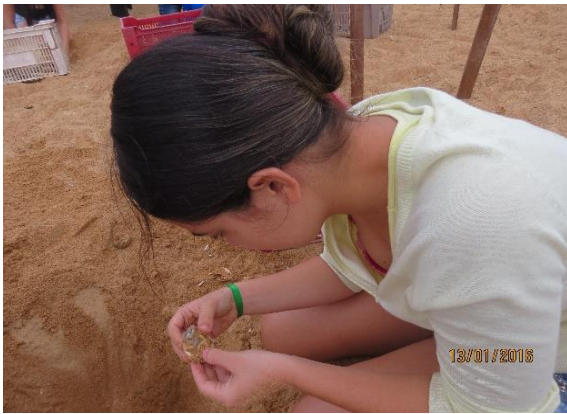
Figura 33 – Ações de manejo comunitário na praia Juncal, no Tabuleiro do Embaubal.