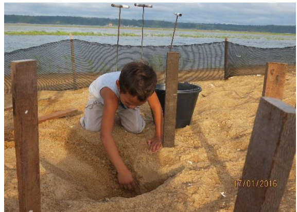
Figura 36 – Ações de manejo comunitário na praia Juncal, no Tabuleiro do Embaubal.