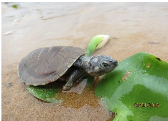
Figura 25 – Soltura de filhote de P. expansa na praia Peteruçu. Tabuleiro do Embaubal