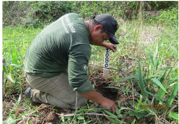
Figura 2 – Monitoramento das posturas de P. unifilis , no Tabuleiro do Embaubal.