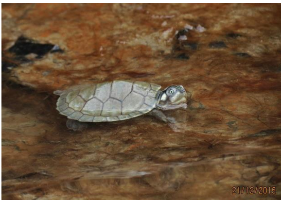
Figura 19 – Filhote de P. expansa após destinação ao habitat natural na praia Peterçu.