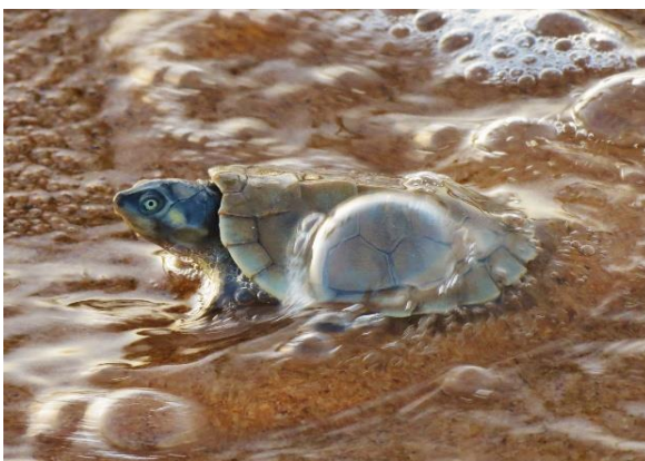
Figura 23 – Destinação de filhotes de P. expansa na praia Juncal. Tabuleiro do Embaubal.