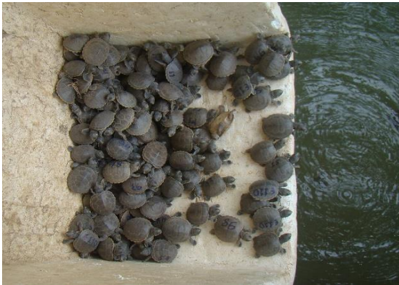
Figura 1 – Destinação de filhotes de P. unifilis ao habitat natural, na Volta Grande.