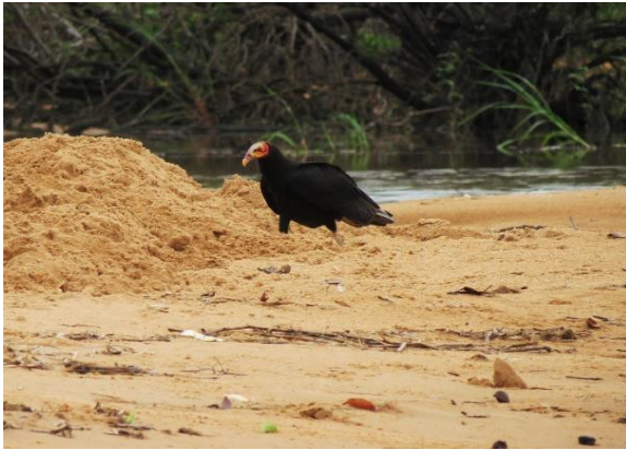
Figura 27 – Predador de filhotes de Podocnemis : Cathartes burrovianus , no Tabuleiro do Embaubal.