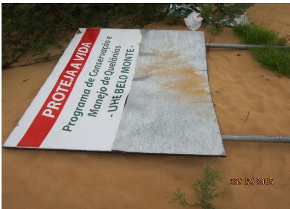
Figura 47 – Placa de sinalização danificada na praia Mestre Pedro, no Tabuleiro do Embaubal.