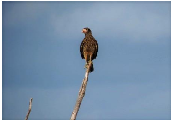
Figura 30 – Predador de filhotes de Podocnemis : filhote de Milvago chimachima , no Tabuleiro do Embaubal.