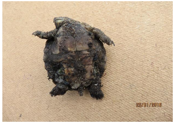
Figura 46 – Filhote de P. unifilis carbonizado no Campo (incêndio). Tabuleiro do Embaubal.