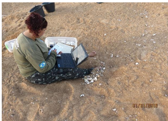
Figura 7 – Remoção de dataloggers das posturas de P. expansa , no Tabuleiro do Embaubal.