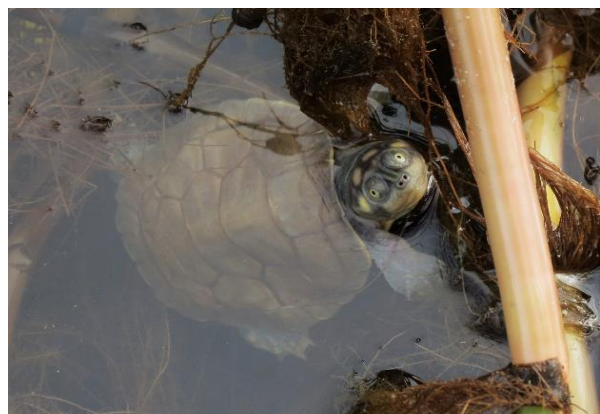
Figura 24 – Destinação de filhotes de P. expansa na praia Peteruçu. Tabuleiro do Embaubal.