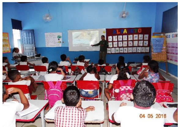
Figura 54 – Aplicação de atividade de EA na EMEF Mariana Dias, em Senador José Porfírio.