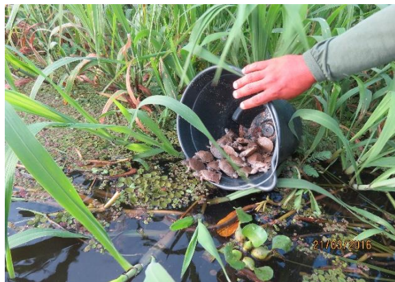
Figura 20 – Destinação de filhotes de Podocnemis ao habitat natural na praia Peterçu.