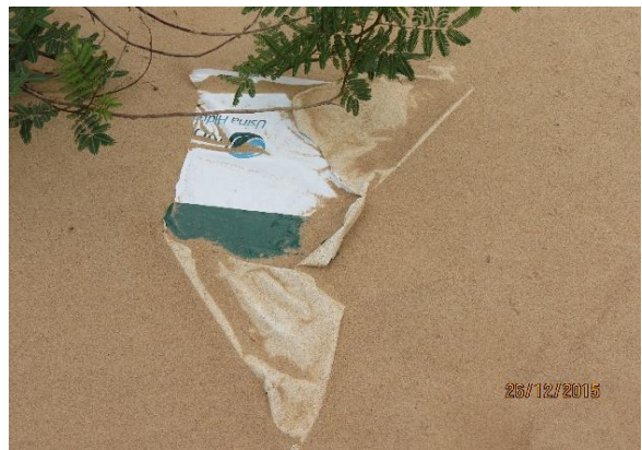
Figura 48 – Placa de sinalização danificada, com logo do empreendimento arrancada na praia Mestre Pedro, no Tabuleiro do Embaubal.