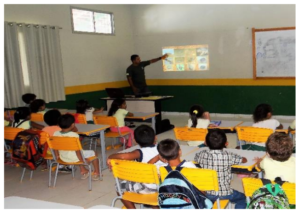
Figura 56 – Aplicação de atividade de EA na EMEF Domingas Fortunato, em Vitória do Xingu.