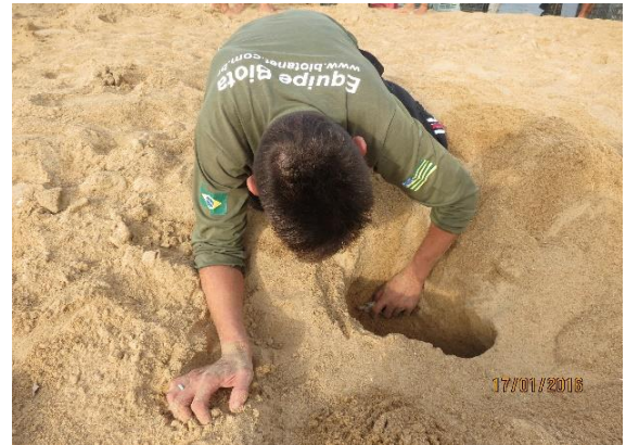
Figura 6 – Monitoramento das posturas de P. expansa , no Tabuleiro do Embaubal.