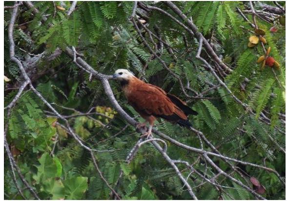
Figura 28 – Predador de filhotes de Podocnemis : Busarellus nigricollis , no Tabuleiro do Embaubal.